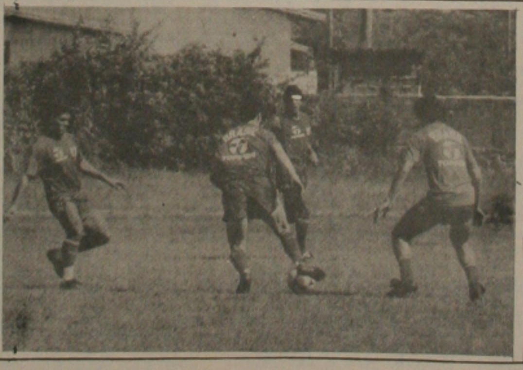
A Seleção treinou na Granja Comary e o time está definido.

Nas respostas as perguntas seguintes, La-