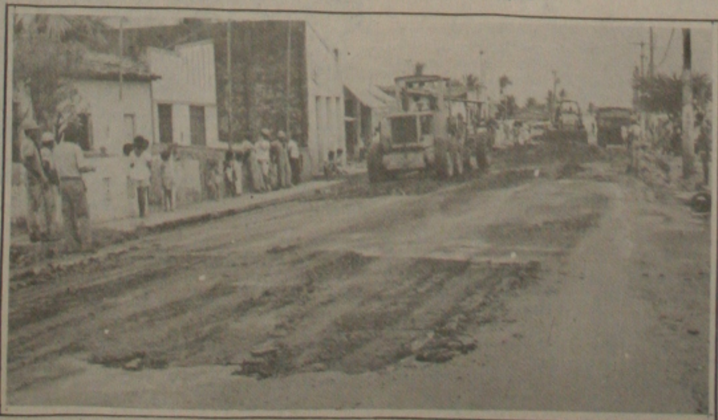
Prefeitura começa recuperar ruas destruídas pelas chuvas.