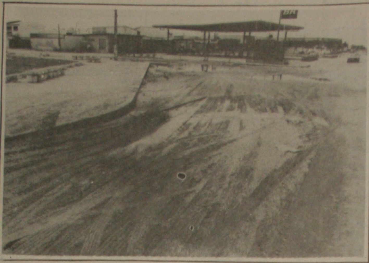
No Eduardo Gomes a população reclama da precariedade do acesso.

Disse ainda que nos dias 1º de setembro, hoje, e na segunda-feira, 04, serão entregues certificados aos concluintes dos seguintes cursos: Cobil e Primeiros Socorros, já concluídos.