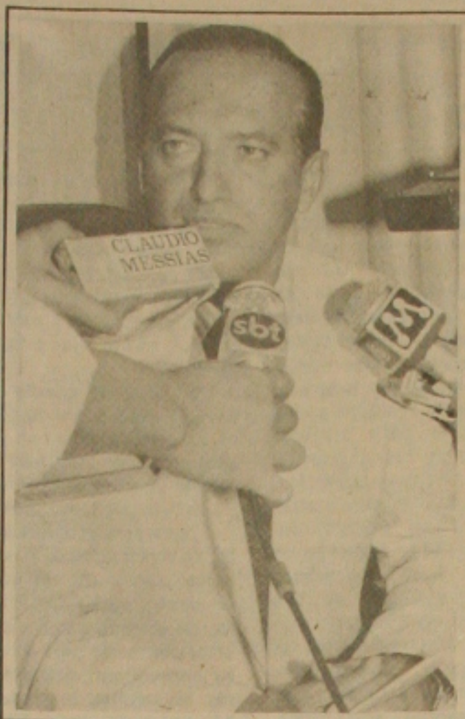
Valadares aceita investimentos de japoneses para obra histórica em Sergipe.