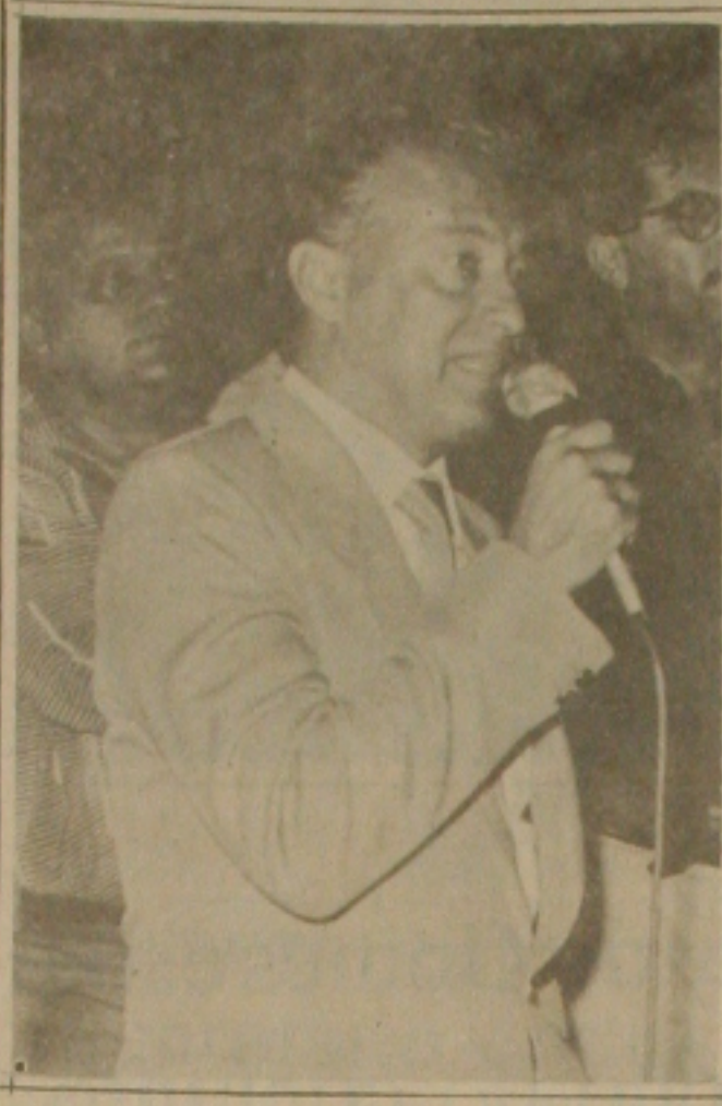
Valadares: sucesso com os japoneses.

Rio - Em uma assembleia histórica, os funcionários da área administrativa do edifício-sede da Petrobrás aprovaram ontem a proposta da empresa, que ofereceu reajuste salarial médio de 83,54%, além do abono de 30,51% que será pago na segunda-feira, dia 4. Pela primeira vez em uma assembleia do pessoal administrativo, estavam presentes cerca de 3.500 funcionários, quase 50% dos oito mil que trabalham no edifício-sede. Os Sindicatos da Bahia e de Minas Gerais também aprovaram a proposta da empresa. O comando de greve dos petroleiros informou que ontem a noite, com base no resultado das demais assembleias que se realizaram em todo o país, iria decidir se a greve a partir de hoje seria mantida ou suspensa. A tendência da categoria era a de suspender a paralisação. O número de presentes a assembleia no edifício-sede foi tão grande que foi necessário organizar duas filas na entrada do prédio, uma para quem era a favor e outra contra.