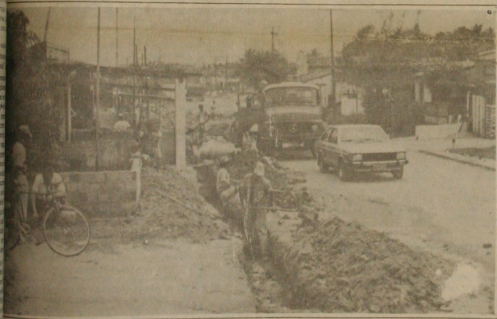
A recuperação de ruas doanel viário do Bairro Santos Dumont, destruídas pela chuva.

Aconteceu ontem, na Colônia Treze, e a população está revoltada com o bárbaro crime. (PÁGINA 7)