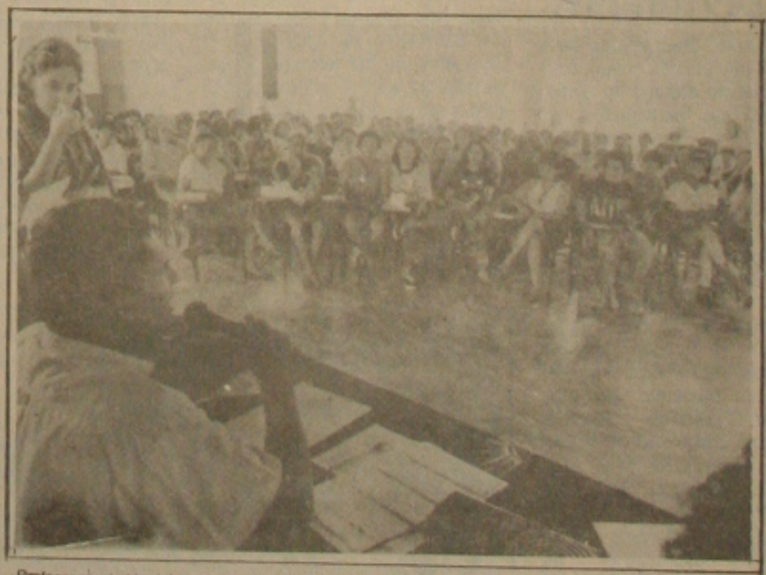
Professores do Município não aceitam proposta salarial e paralisam as atividades.

Os professores da rede municipal não se consideram financeiramente independentes e por isso, vão realizar ato de protesto neste domingo, quando da realização do desfile cívico dos estudantes das escolas municipais, dentro da programação comemorativa dos 167 anos da Independência do Brasil. A decisão dos professores foi aprovada ontem na assembleia geral realizada no Centro Educacional Presidente Vargas, oportunidade que eles rejeitaram a proposta salarial apresentada pelo prefeito Wellington Paixão, estabelecendo o piso salarial dos professores, da rede municipal em 85 por cento do piso nacional. Eles decidiram também que vão se reunir hoje com a secretária da Educação, Ada Augusta, para negociar a contra proposta salarial da categoria. Mas mesmo estando abertos as negociações, os professores vão fazer atos públicos, na frente da Prefeitura, nesta segunda (Página 02).