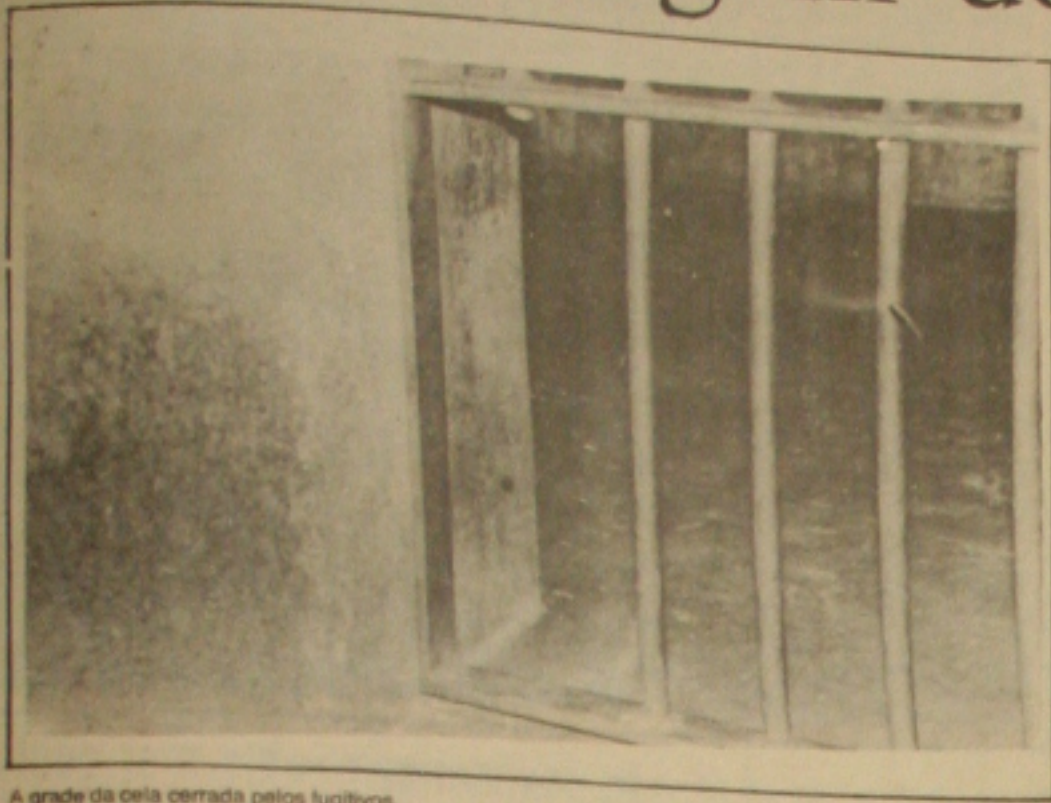
A grade da cela cerrada pelos fugitivos.