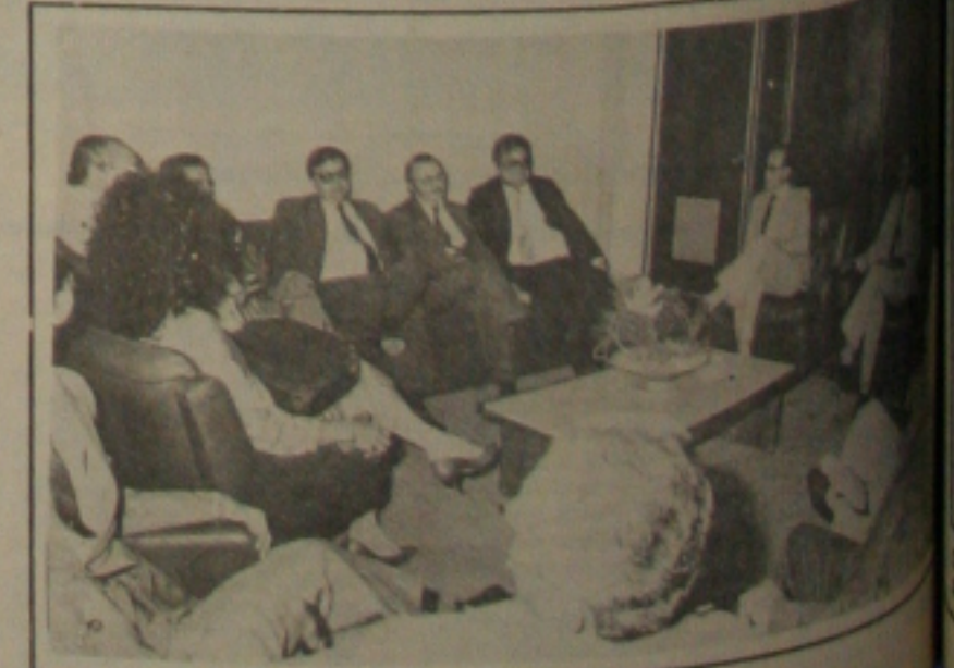
Conselheiros do Tribunal de Contas visitam o Ministério Público.