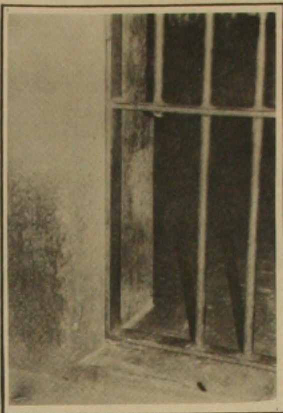
Grade aberta para a fuga dos presidiários.