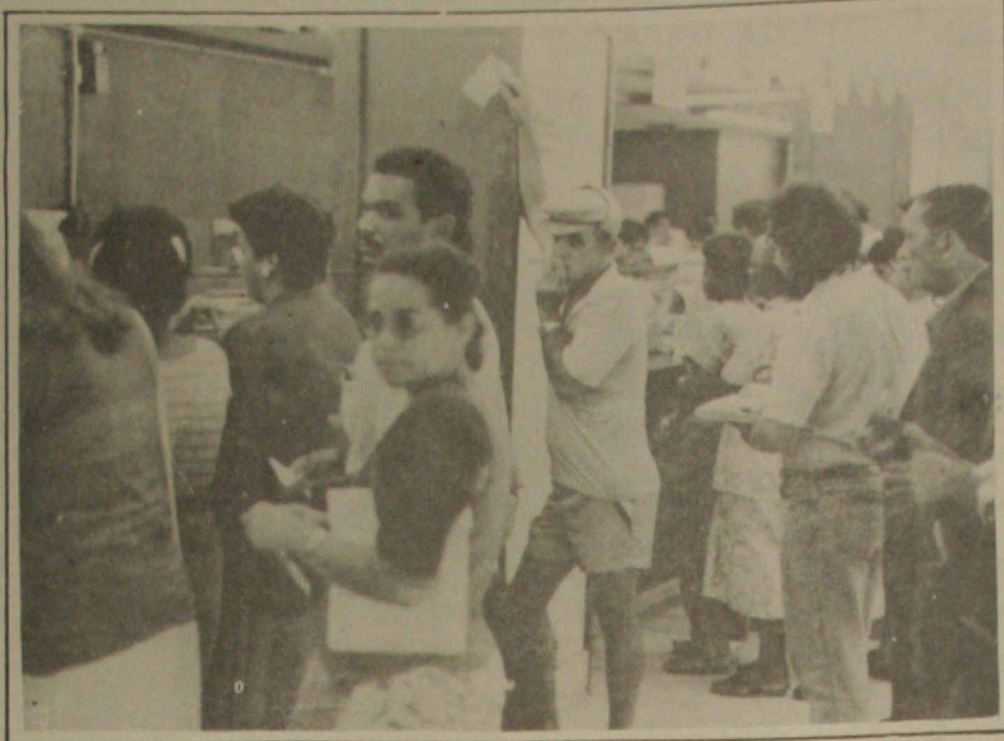
Bancos podem fechar suas portas na próxima quarta-feira.