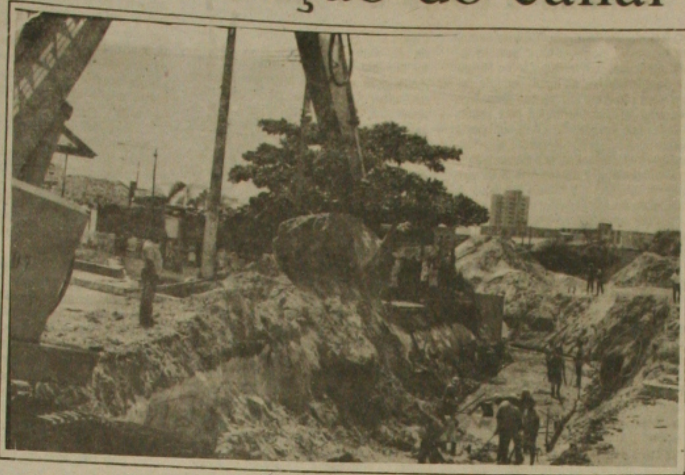
O povo reclama, mas a abertura do canal continua sendo feita pela Prefeitura em ritmo acelerado.

O canal que vem sendo construído pela Prefeitura Municipal de Aracaju, através da Secretaria de Obras, na avenida Hermes Fontes, no trecho entre a Sub-Estação e a Telergipe do Gragerú, com o objetivo de solucionar o problema de alagamento na artéria, continua revoltando os moradores da área que não se conformam de conviver com um canal a céu aberto.