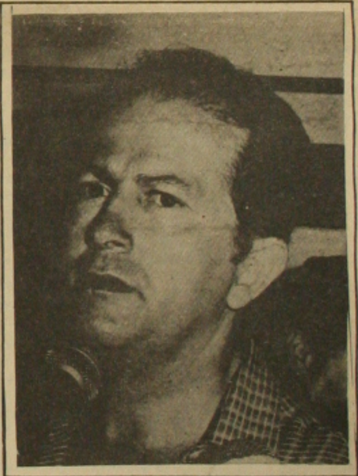
Albano: preocupado com retomada da inflação.

A sortuda é solteira, de 20 anos e jogou NCZ$ 400, mas na casa lotérica há a suspeita de que terá que dividir o prêmio com outras pessoas. "Foi uma das maiores apostas já feitas em Glória" - comentou Roberto Gonzaga, funcionário da casa lotérica, assinalando que a ganhadora, que desapareceu da cidade, não teria tanto dinheiro para fazer a aposta sozinho, por se tratar de uma pessoa aparentemente humilde. Ele também não sabe o nome da ganhadora.