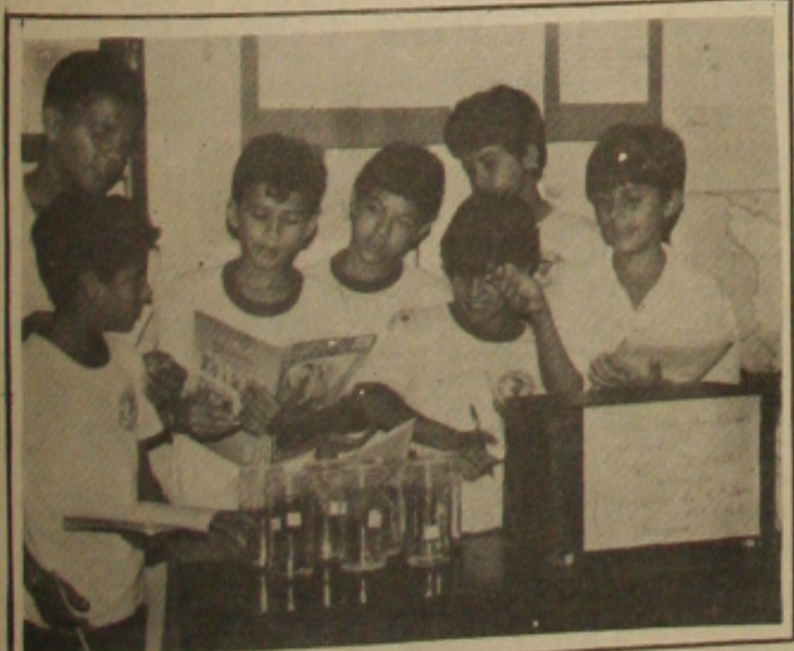
Estudantes pesquisando a reprodução das moscas.