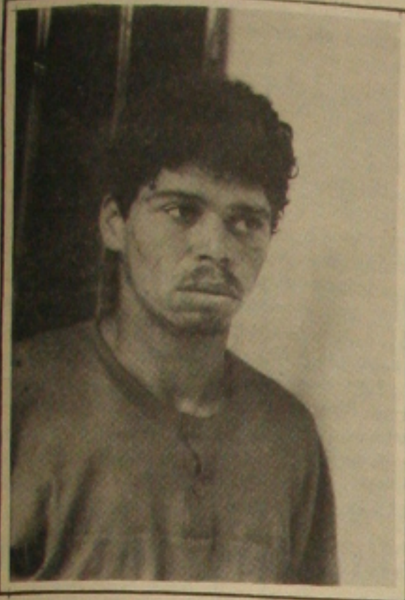
"Espanador da Lua", assassino do cabo da PM.