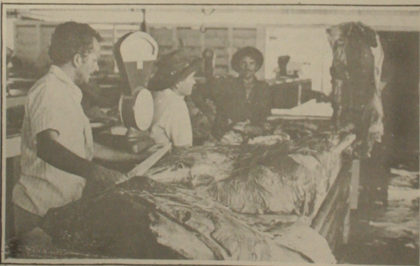
Venda de carne bovina caiu em 40 por cento, em Aracaju.

O consumidor está pagando hoje NCz$ 11,00 por um quilo de alcatra, NCz$ 13,00 por um quilo de filé e NCz$ 6,00 por um quilo de carne de segunda. Uma família com 4 pessoas consome a cada 7 dias uma média de 4 quilos de carne, tendo assim, que desembolsar, por semana, NCz$ 44,00 por uma alcatra e NCz$ 176,00 por mês, o que representa 70% do valor do Piso Nacional de Salário que é de NCz$ 249,00.