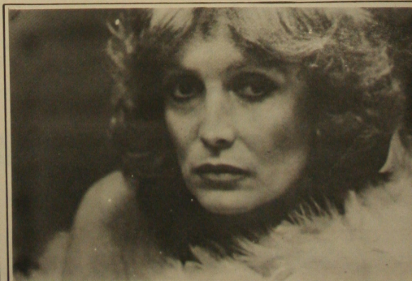
A cantora Doris Monteiro uma das musas da Música Popular Brasileira é a grande atração do Restaurante Chapéu de Couro para os dias 22 e 23 com o apoio Cultural da VASP.