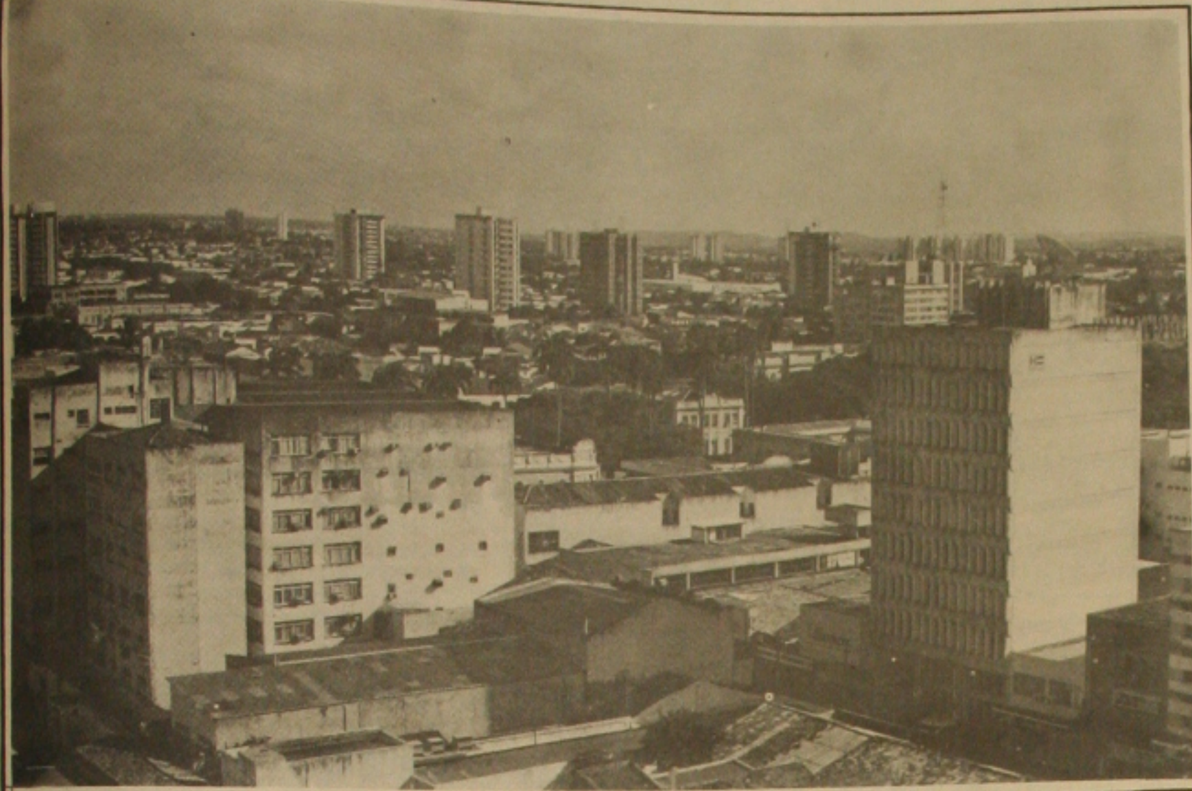
Reaquecimento das vendas, vai procurar o surgimento de novos lançamentos imobiliários, aumentando o crescimento vertical de Aracaju.

nto isso, o líder da do PSB na Câmara ju, Emanuel Nas- condena qualquer ção e arbítrio.