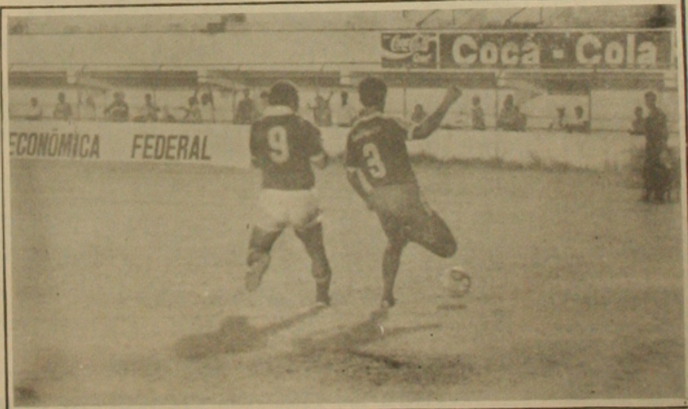
Sergipe e Confiança torçaram pouco e ficaram longe do gol. (Foto Fernando Silva).

O torcedor que compareceu ontem à noite ao Batistão deixou o campo triste pelo péssimo futebol apresentado pelas duas melhores equipes do futebol sergipano. Foi um jogo ruim e o empate em zero espalha realmente a mediocridade dos dois times em campo. Com o empate, o Confiança assumiu a liderança do grupo G, com três pontos ganhos ao lado do Leônico. Foram poucas as oportunidades criadas na partida de ontem por Sergipe e Confiança. Américo Beata com excelente trabalho foi o juiz da partida. A renda do jogo: NCZ$ 10.782,50 com 2.313 pagantes. Na cidade de Conceição do Coité, o Lagarto voltou a perder e está praticamente fora da luta pela classificação. O Campeonato prossegue para os sergipanos nesta terça-feira. O Sergipe recebe a visita da Catuense no Batistão e o Confiança em Conceição do Coité enfrentará o Leônico. (Esporte página 8).