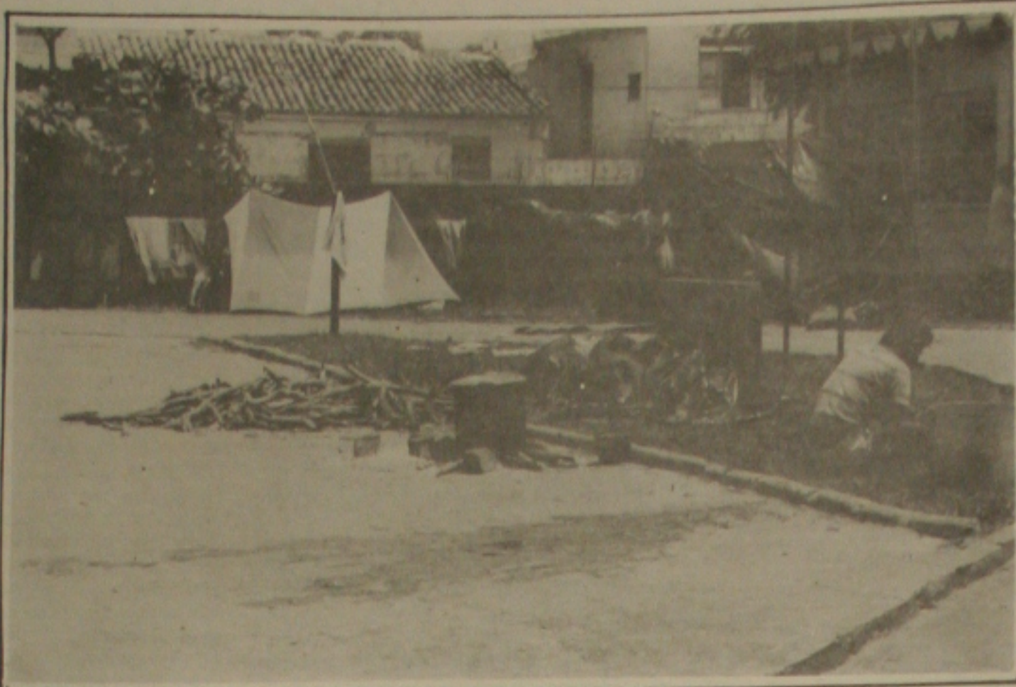
Sem-terra: estão acampados desde a madrugada de quinta-feira.

A secretária acrescentou que constam da programação culto evangélico (8hs), missa na Igreja local (9hs), atividades esportivas e apresentação da Banda de Música da Prefeitura Municipal de Aracaju (10hs), gincana cultural (14hs) e mais torneios de futebol de campo e salão, cuja entrega de prêmios e troféus se dará às 17h30, atividades artísticas com apresentação de grupos de chorinho, dança, makulelê e quadrilhas caipiras, e encerrando com chave de ouro, um grande show musical com apresentação de vários artistas sergipanos.