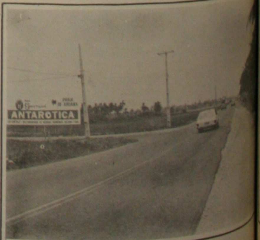
Rodovia dos Náufragos é totalmente recuperada pela Emurb.