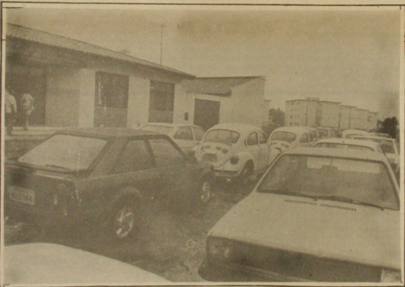
Polícia devolve 12 veículos que foram apreendidos.

Quanto a entrega dos carros aos legítimos donos, eles antes de serem entregues passam pela perícia técnica, já que muitas das adulterações não saíram perfeitas. Os proprietários apresentam a documentação e se for possível a Nota Fiscal de compra, facilitando mais ainda o trabalho da polícia na devolução do mesmo.