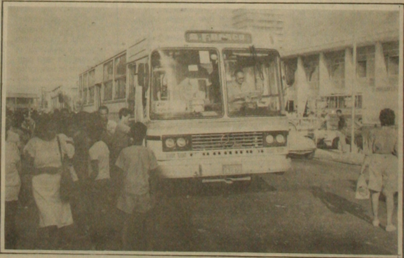
Aracajuanos passa a pagar hoje 60 centavos pela passagem dos ônibus urbanos