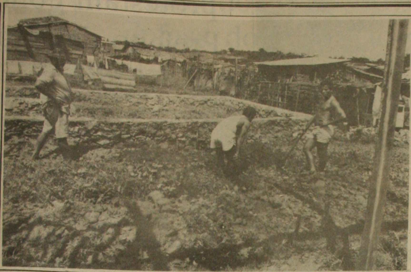
Quando os policiais se retiraram, os invasores retomam para reconstruir as casas demolidas.

Depois da promulgação da Constituição Estadual, as Câmaras Municipais vão desenvolver importante papel em toda a sociedade. No entanto, até agora, poucos são aqueles que se movimentam, no sentido de discutir a elaboração da Lei Orgânica de cada município. Pode parecer coisa boba, mas os legisladores municipais irão desenvolver trabalho fundamental para o desenvolvimento da cidade. (Página 02 - 2ª Cad)