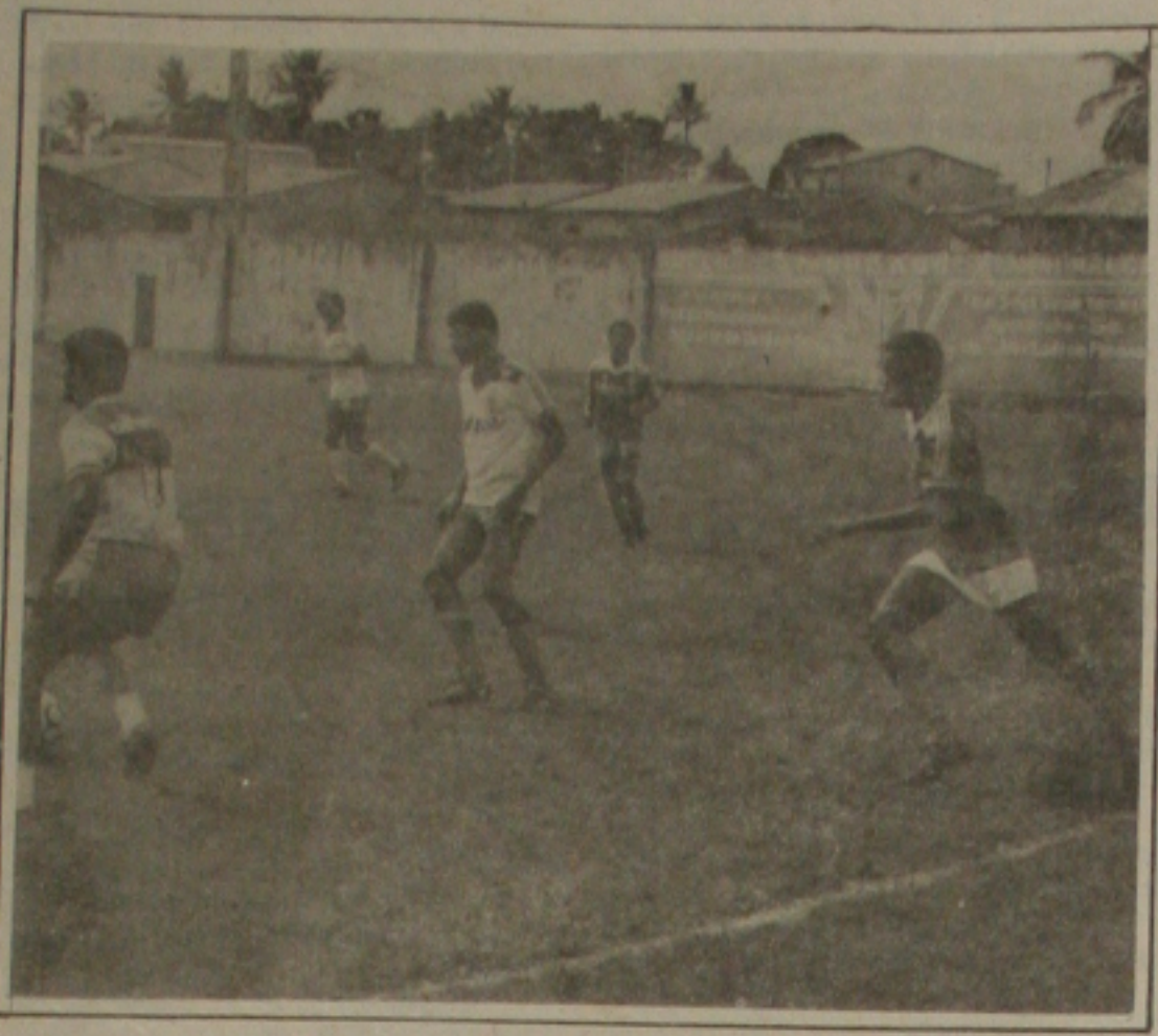
Confiança treinou motivado e o time viaja hoje para enfrentar o Fluminense em Feira.

Com quatro pontos ganhos, o time do Confiança ostenta a liderança do grupo H, esta noite na cidade de Feira de Santana. No estádio Jôia da Princesa, o vice-campeão sergipano vai enfrentar o Fluminense, numa partida esperada com certa expectativa pelos torcedores proletários. Uma vitória do time proletário deixará o Confiança em situação privilegiada na competição, com a classificação para a próxima fase quase assegurada. Os atletas pensam na vitória, para a equipe manter o padrão de sempre se apresentar bem em competições de âmbito nacional.