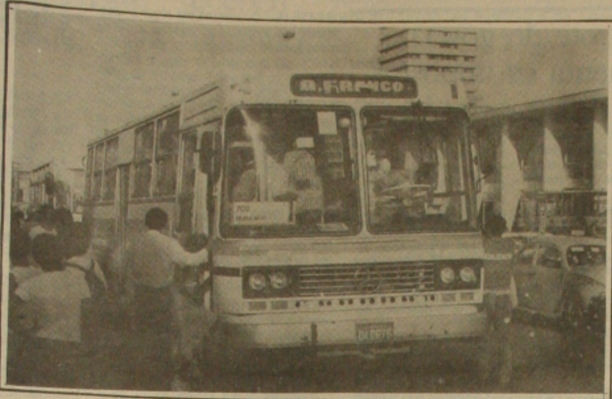
Os passageiros dos ônibus, pagam mais a partir de hoje.

Entra em vigor hoje dia 23 a correção que elevou a tarifa dos ônibus urbanos a NCz$ 0,50, como forma de compensar os reajustes autorizados pelo Governo Federal nos preços dos combustíveis, pneus, peças de reposição e outros insumos.