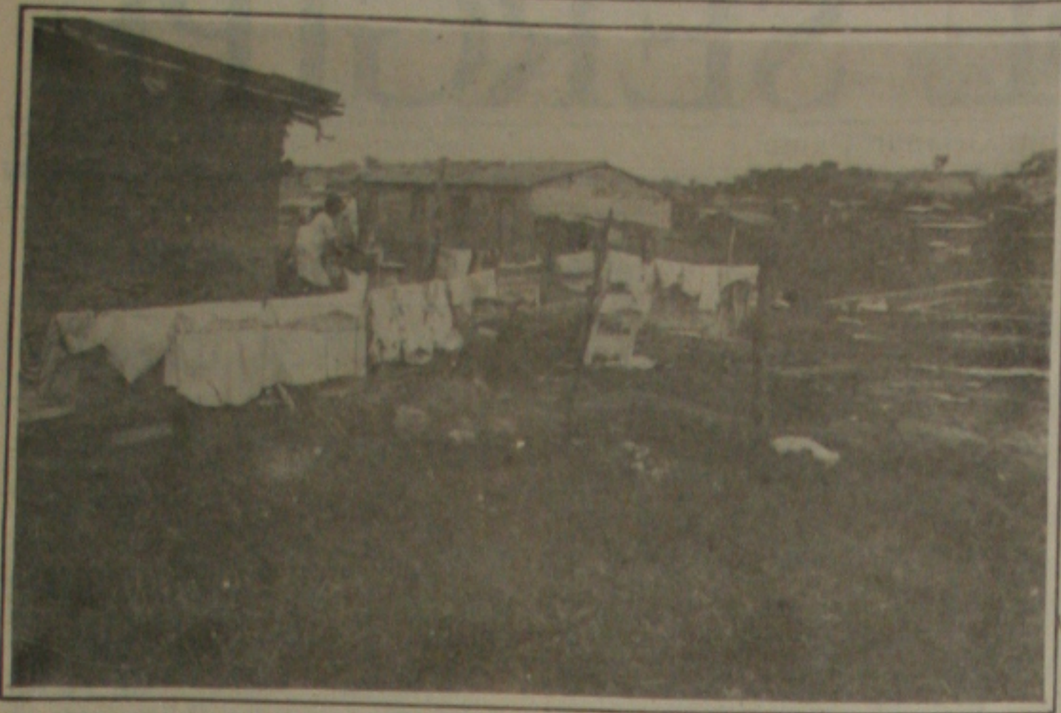
Moradores de invasão denunciam ameaças de expulsão pelo prefeito.