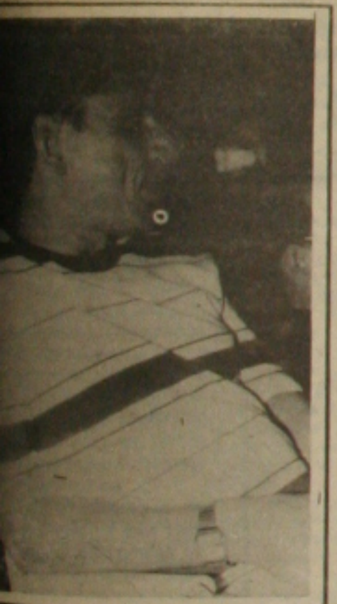
Agricultura privilegiada nos orçamentos.