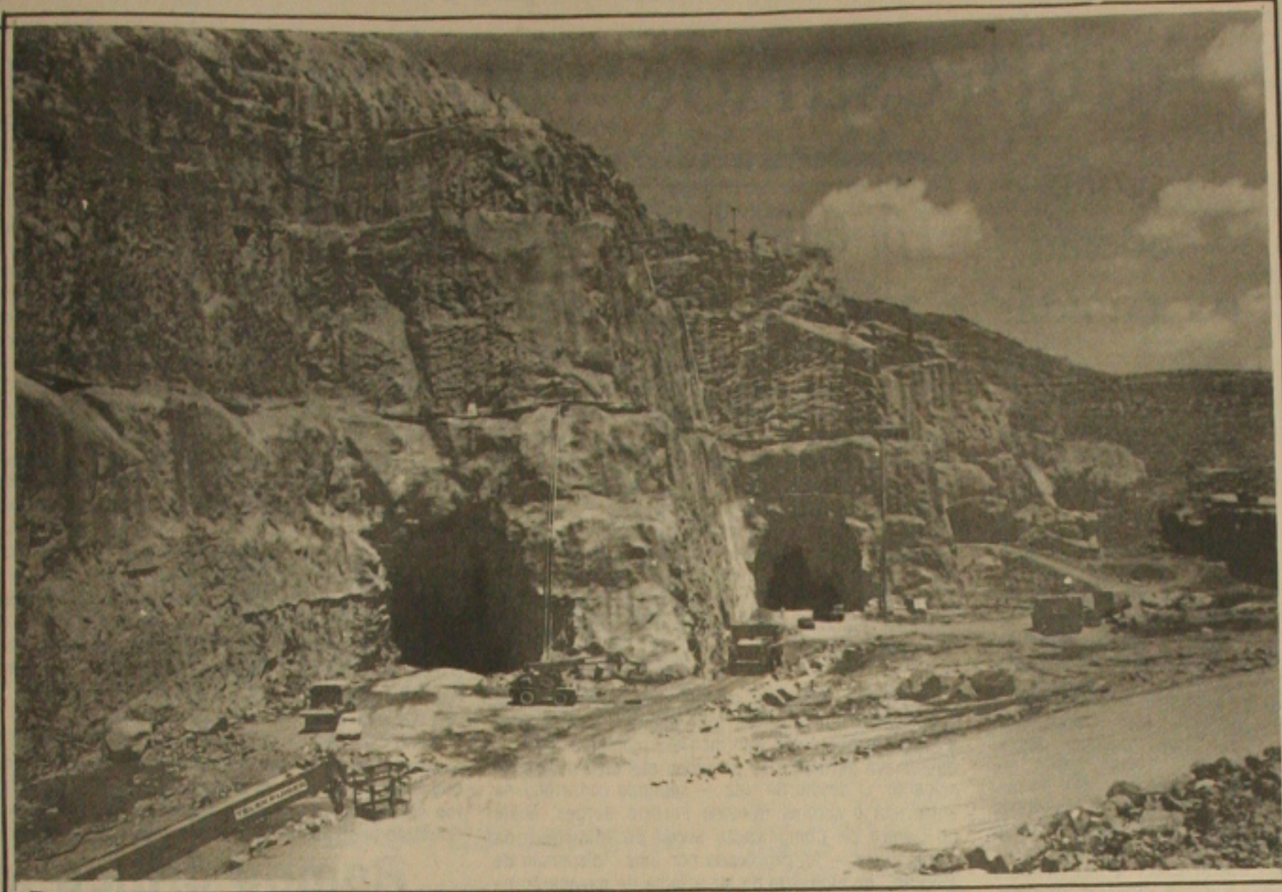
Obras de Xingó agora em períodos para não parar.

Os deputados federais que teriam uma reunião, ontem à noite, em Paulo Afonso para analisar a situação e elaborar um documento que seria entregue ao presidente Sarney, segunda-feira próxima, no Rio de Janeiro, adiaram a viagem por problemas de transporte aéreo. Só na próxima semana é que os parlamentares tentarão retratar para o presidente a realidade da situação, para que haja uma solução urgente.