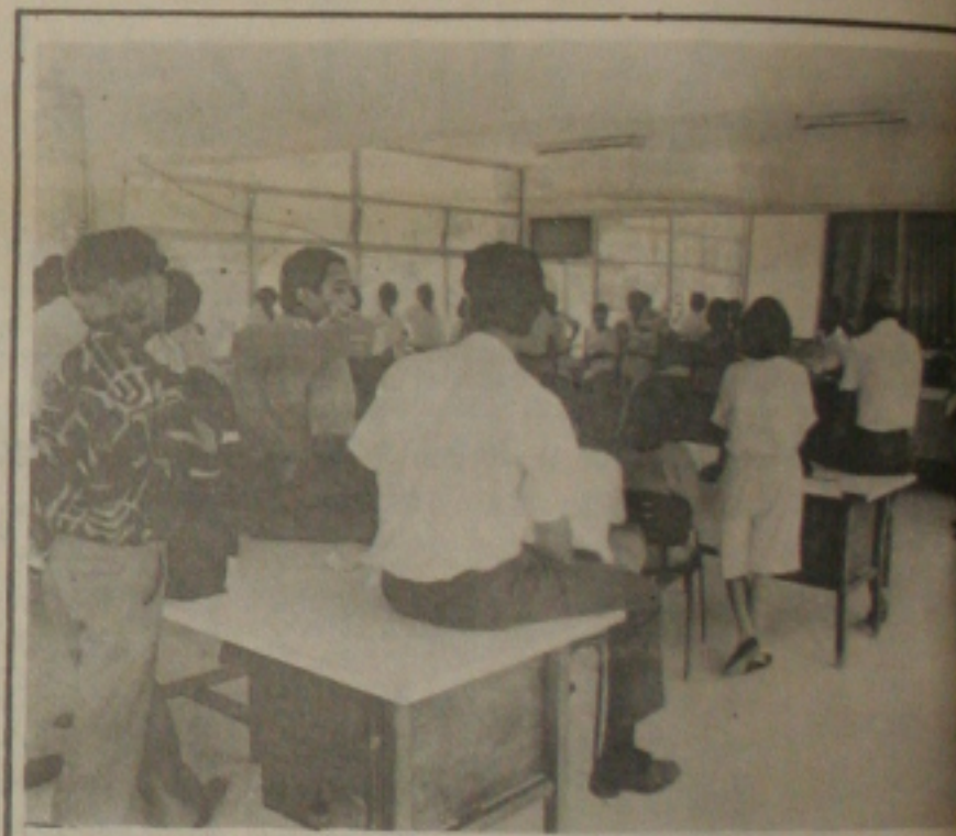
Servidores da Agricultura realizam assembléia geral.

permanecer em estado de greve. José Oliveira disse que as propostas do Governo para a gratificação emergencial e suspensão do movimento ocorreram com o Rio Grande do Sul e Paraná. A manutenção do mecanismo para garantir as reivindicações por eles ao Ministério da Agricultura, Iris Resende Machado, segurado que apresentaria a proposta no dia 14, hoje, aos funcionários da Delegacia Federal da Agricultura. A greve da Delegacia Federal da Agricultura está prejudicando o trabalho desenvolvido pela Delegacia para a luta contra a tuberculose e carbúnculo. O trabalho está suspenso até o retorno dos funcionários as atividades. O Serviço de Inspeção Federal está também prejudicado pela greve, o que compromete a qualidade da carne consumida em Aracaju, que, inclusive, está contaminada.