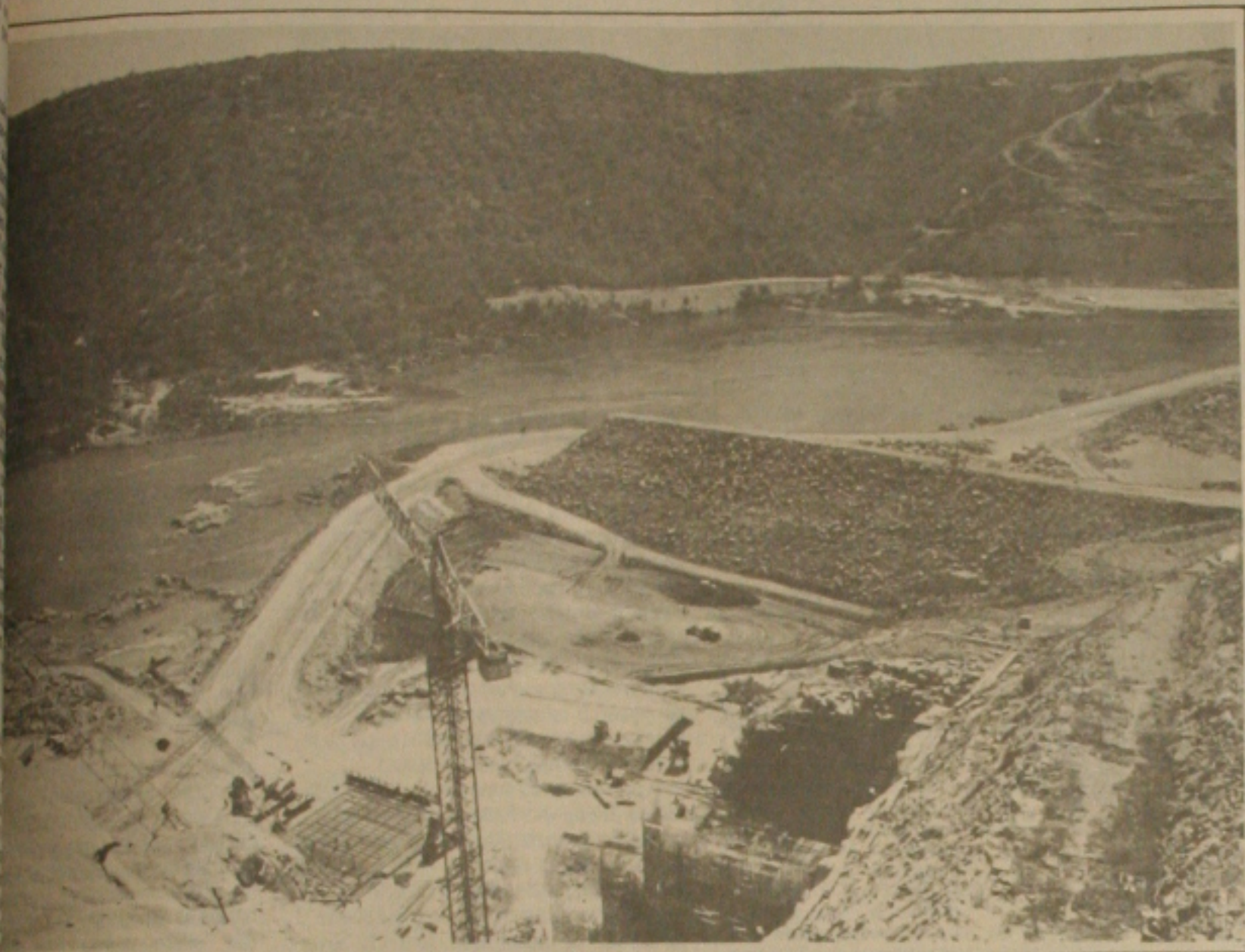
Operários de trabalhadores e a paralisação das obras, o canteiro de Xingó fica praticamente vazio.