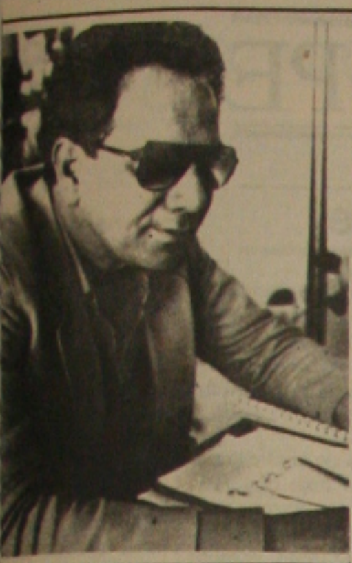
...que a greve trassou.