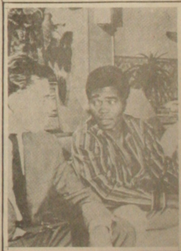
Cena do filme Os Farsantes.

Título Original: The Comedians Nacionalidade: Americana (TV) Ano de Produção: 1986 Direção: Peter Greenville Elenco: Richard Burton, Elizabeth Taylor, Alec Guinness, Peter Ustinov, James Earl Jones e Lilian Gish. Adaptação não muito inspirada do romance de Graham Green sobre a intriga política no Haiti.