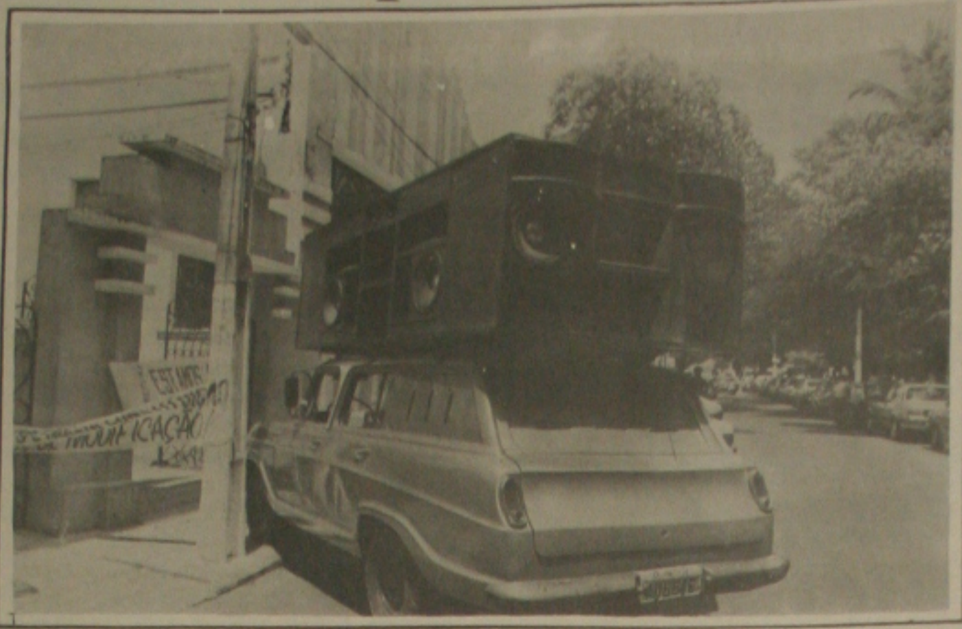
Carro de som atralha movimento grevista, diz sindicalista.