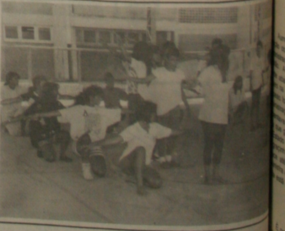
Alunos da rede escolar, ensaiam a coreografia para abertura dos XIV Jogos da Primavera.