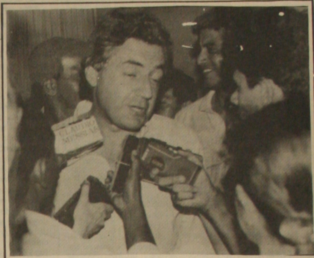
O presidenciável ficou irritado, quando um repórter lembrou sua aversão à região Nordeste, que ele sempre considerou responsável pelo atraso no país.