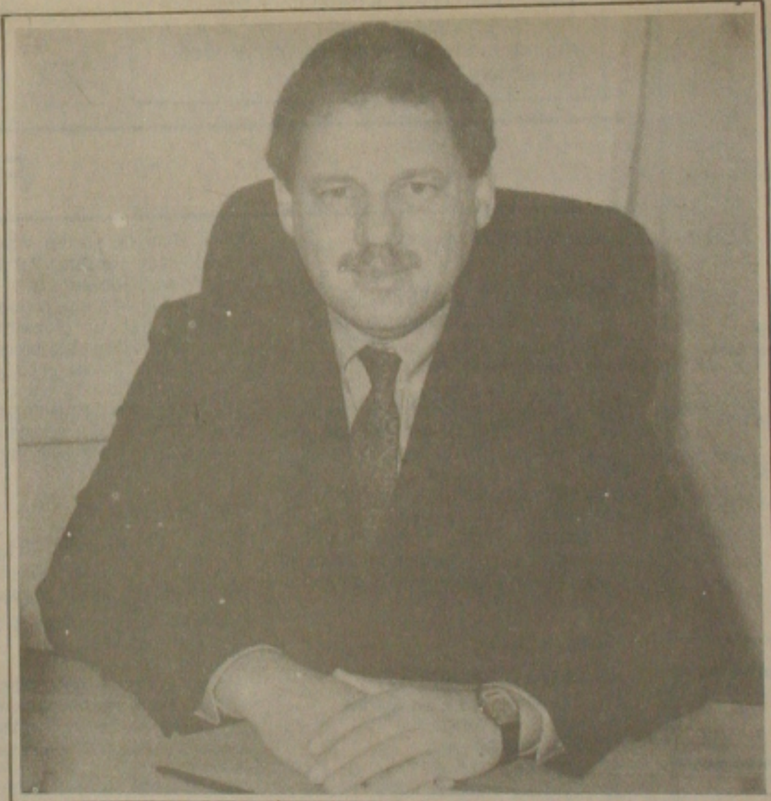
Para Vantinc, o transporte rodoviário brasileiro permanece com equipamento e métodos de 20 anos atrás.

cos (depósitos) e dinâmicos (em trânsito), acompanhando a evolução da produção Just-In-Time das empresas industriais. Esta combinação é atrativa, não apenas sob o ponto de vista financeiro, mas principalmente porque acompanhará o desenvolvimento do próprio País, com a multiplicação de pontos de venda e de consumo. É desejável que, ainda antes da segunda metade da década de 90, o transporte aéreo regional venha a integrar a grande rede de distribuição nacional.