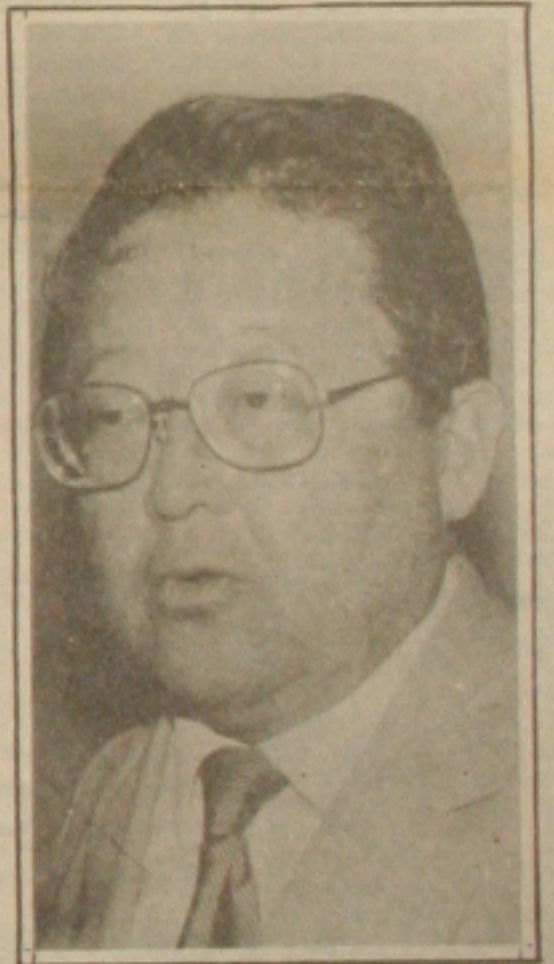
Seigo Tsuzuki: hoje em Sergipe.

O ministro da Saúde, Seigo Tsuzuki, chega hoje a Aracaju, desembarcando no Aeroporto às 12:30 horas. Ele vem presidir a solenidade de abertura do I Encontro de Saúde Brasil/Nordeste/Cuba, que acontecerá no Hotel Parque dos Coqueiros, numa promoção da Sociedade Brasileira de Pediatria. O ministro vai permanecer em Sergipe até segunda-feira, quando às 7:30 horas vai participar da abertura da campanha de vacinação contra a meningite, que acontecerá na Escola Santos Dumont, no Bairro Atalala Velha. Ainda na segunda-feira, o ministro Seigo Tsuzuki presidirá o lançamento, a nível estadual, do Programa Nacional de Combate à Cárie Dentária, que acontecerá na Escola de 1º Grau "Maria do Carmo Nascimento Alves". Após essas duas solenidades, o ministro da Saúde concederá entrevista coletiva à imprensa e encerra sua visita participando da solenidade em que será homenageado com a outorga da Medalha do Mérito Aperipê. (Pág. 2)