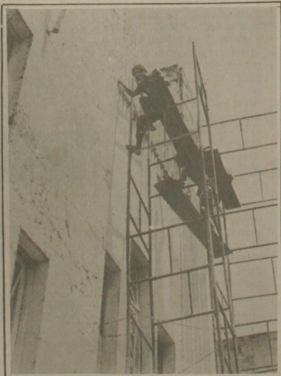
Falta de segurança na construção civil continua provocando inúmeras mortes em Sergipe.

Algumas campanhas que tem sido realizadas na capital alertando para os riscos da Construção Civil ninguém as obedece. Os quatro operários que estão trabalhando na pintura da fachada do Instituto Histórico não estão preocupados para o perigo que enfrenta. A segurança é mínima e qualquer desequilíbrio é fatal para quem estar no andaime.