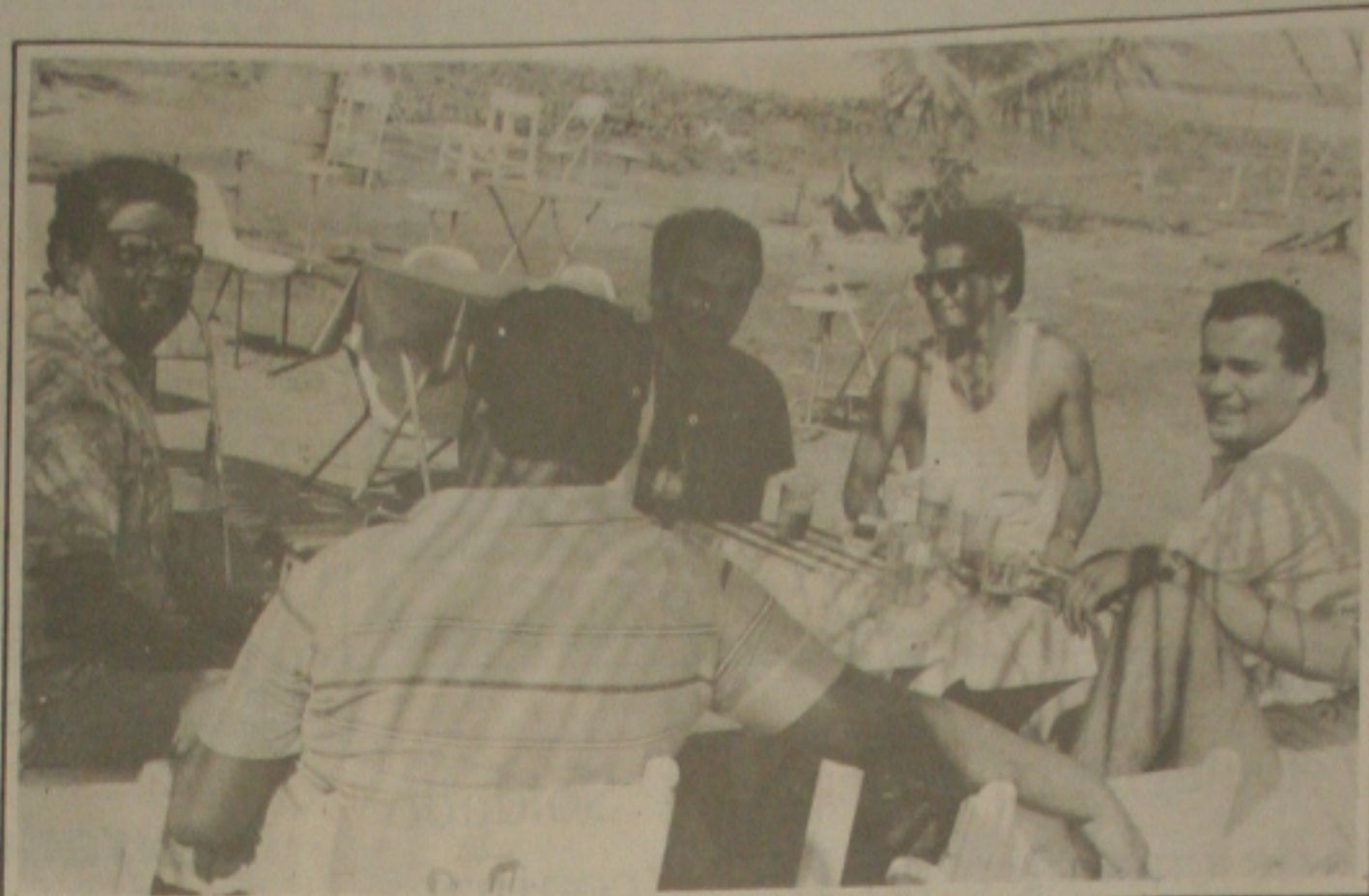
Enquanto esperam o grande clássico, os dirigentes do Confiança tiveram ontem uma manhã de lazer. Conversaram sobre a perspectiva de classificação.

A ginástica aeróbica, será uma das atrações dos XIV Jogos da Primavera. É a juventude sergipana, vibrando com a maior competição estudantil do Brasil a nível estadual.