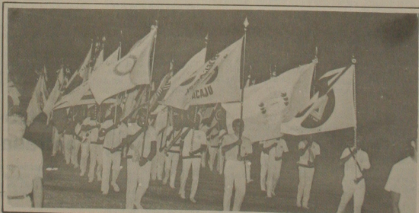
O pelotão de bandeiras, foi um espetáculo à parte.