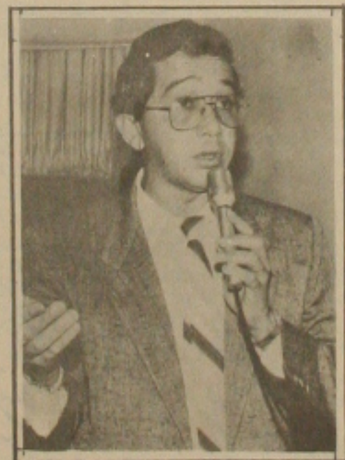
Mário quer evitar privatização.

Além - prosseguiu o vereador - o que se estranha é a febre de privatização no final de um Governo desacreditado e que foi elivado de denúncias de corrupção e com escândalos e mais escândalos, sem que qualquer um dos envolvidos estivesse pagando pelo crime de responsabilidade. O exemplo disso, é o que aconteceu com a Balsa de Valores, onde o megainvestidor Naji Nahas e Elminho Calmões, o filho do presidente do Banco Central, estão por aí gastando tudo que conseguiram de forma ilícita, arruinando muitos empresários honestos que confiaram neles e, também, no Governo Federal, porque o Palácio do Planalto tem o dever de garantir o investimento, sob pena de cair no descrédito total. Diante disso, não podemos permitir que as empresas estatais sejam negociadas.