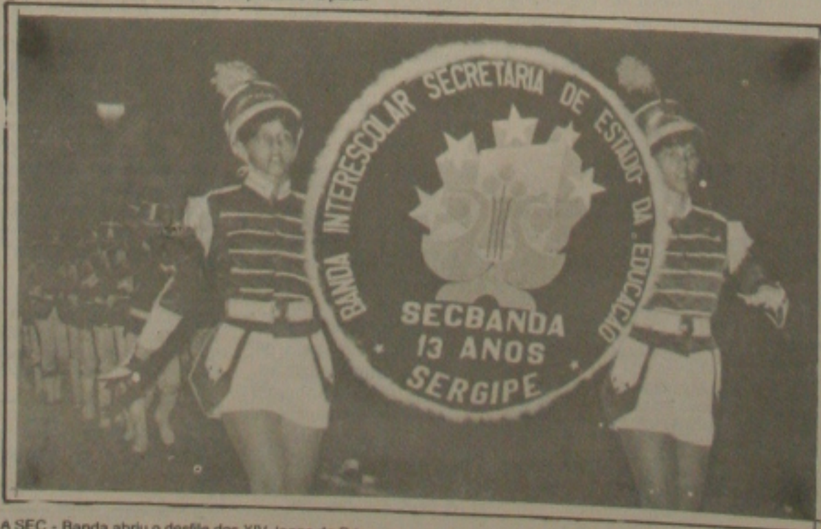
A SEC - Banda abriu o desfile dos XIV Jogos da Primavera