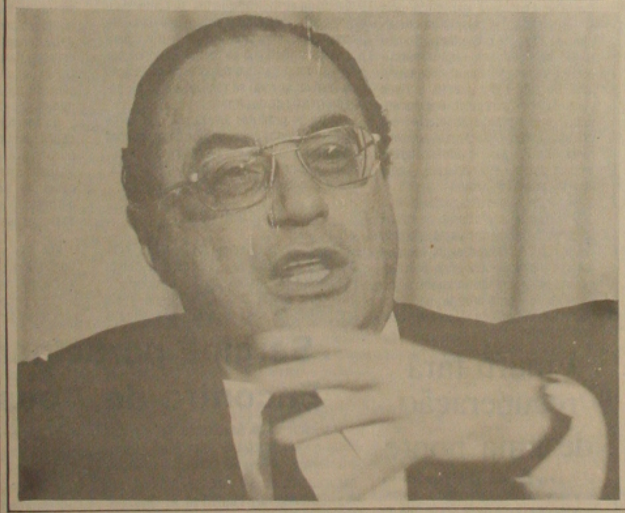
Paulo Maluf: "o Brasil precisa de um presidente com autoridade".

O Brasil precisa é de ordem. A casa precisa ser colocada em ordem porque o Governo perdeu a credibilidade. A comida do povo não pode continuar subindo mais que a inflação. O que o Brasil precisa é de um presidente com autoridade, que puna os casos de corrupção e tenha uma visão moderna das coisas", a declaração é do presidente Paulo Salim Maluf (PDS), feita com exclusividade para a GAZETA DE SERGIPE, durante uma longa entrevista. Maluf fala ainda sobre educação, desemprego, dívida interna e externa e de todo o seu programa de Governo, "que será posto em prática no dia seguinte à minha posse". Ele diz que a dívida externa tem que ser renegociada e garante: "eu pararia o pagamento dos juros e do principal no dia 16 de março, e depois começava a negociar. Estou pregando a renegociação da dívida faz cinco anos". (Página 2 do 2º Caderno).