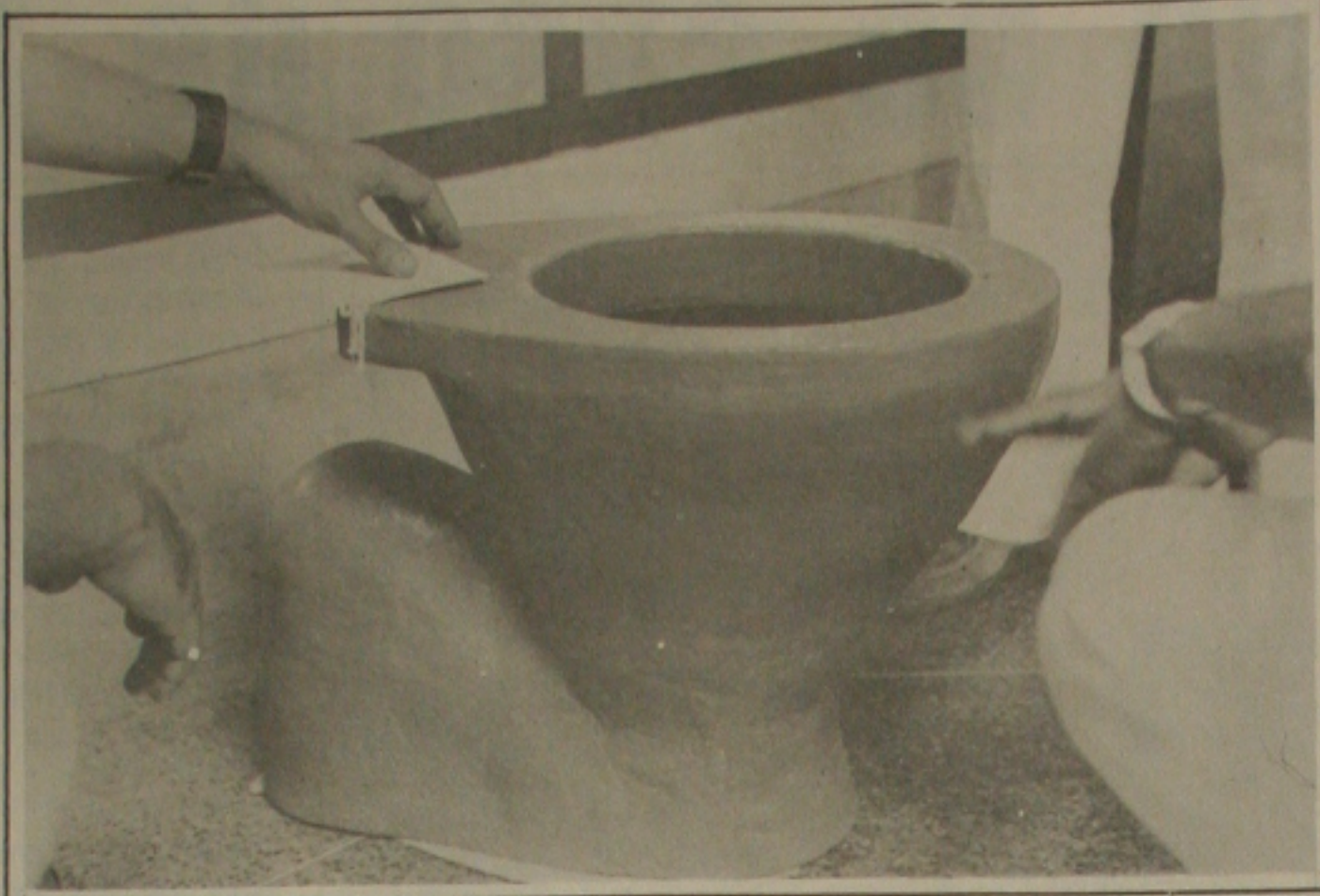
A Fundação Sesp produz no Departamento de Engenharia vaso sanitário para atender a população carente do interior sergipano.