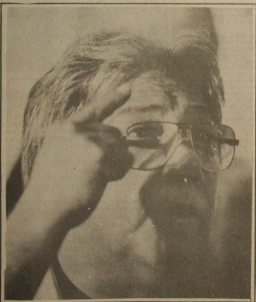
Covas: "o Brasil precisa de um Governo..."

O candidato do PSB à Presidência da República, senador Mário Covas, condenou, ontem, a violência na campanha eleitoral, afirmando que, depois de 30 anos sem eleições, a disputa pela presidência da República não pode ser transformada numa "batalha campal". Covas diz que não utiliza os serviços de segurança oferecido pela Polícia Federal aos candidatos porque "quem não pode andar nas ruas para ouvir as verdades que o povo tem a dizer, não deveria sequer ser candidato".