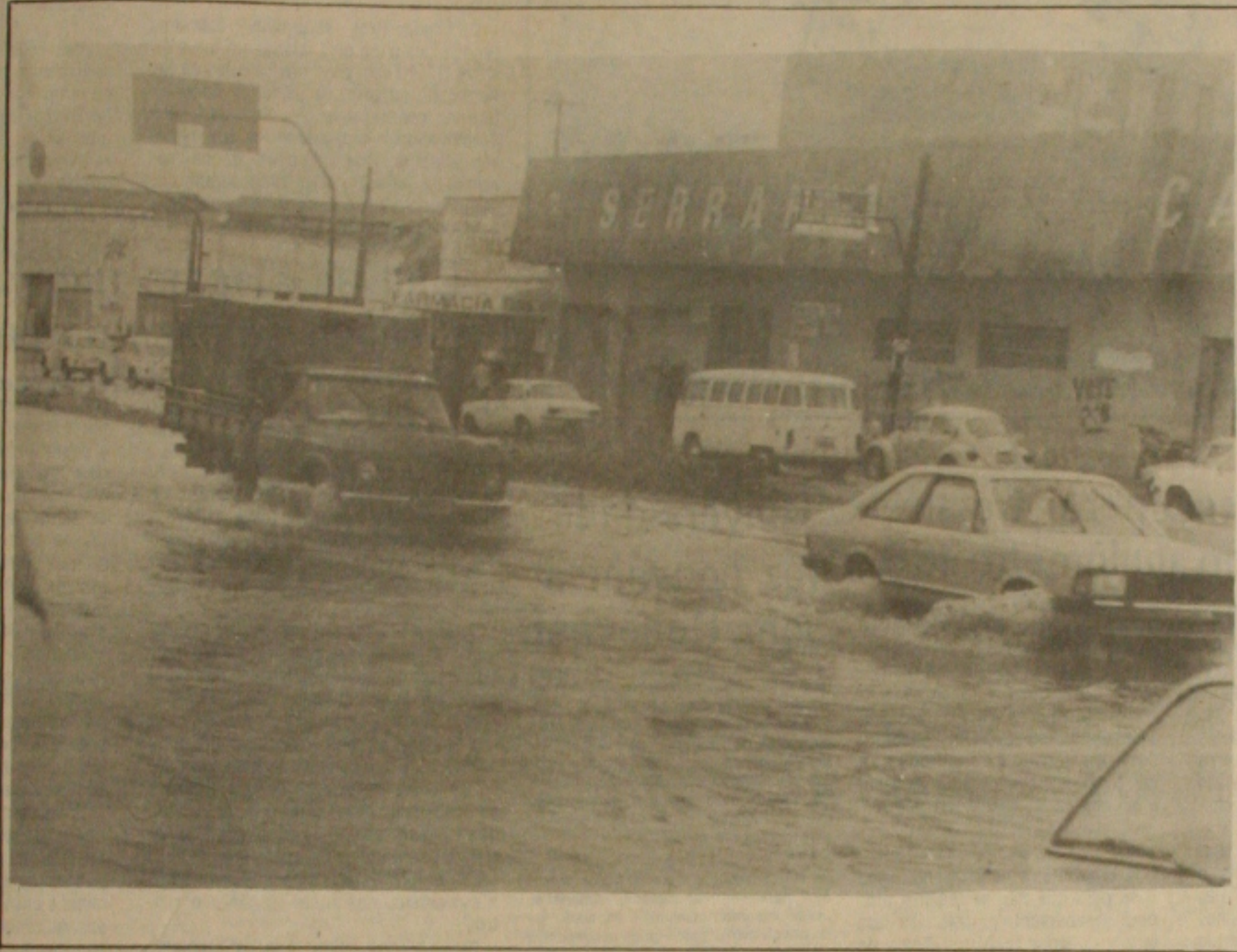
As águas voltaram a inundar as principais ruas de Aracaju, provocando transtornos no trânsito.

amanheceu, onada por fortes chuvas, iniciando na sexta-feira, de um vento frio do início do ano, apesar de estar entrada do verão. a estranheza das a Invernada vem tribuído ao fenômeno-espandimento de o arrastado pela cometa Haley. Em estas chuvas, vários bairros de amanheceram inun- notadamente onde mais, pois se registra transbordamento. Os bairros Veneditas e Lourival foram os mais e houve casos em necessária a inter- Corpo de Bom- Avenida Beira também teve tre- inundações, vá- tiveram proble- parte energética, se utilizar dos do Rotary Club, em boa parte da Sobral o trânsito foi (Página 2)