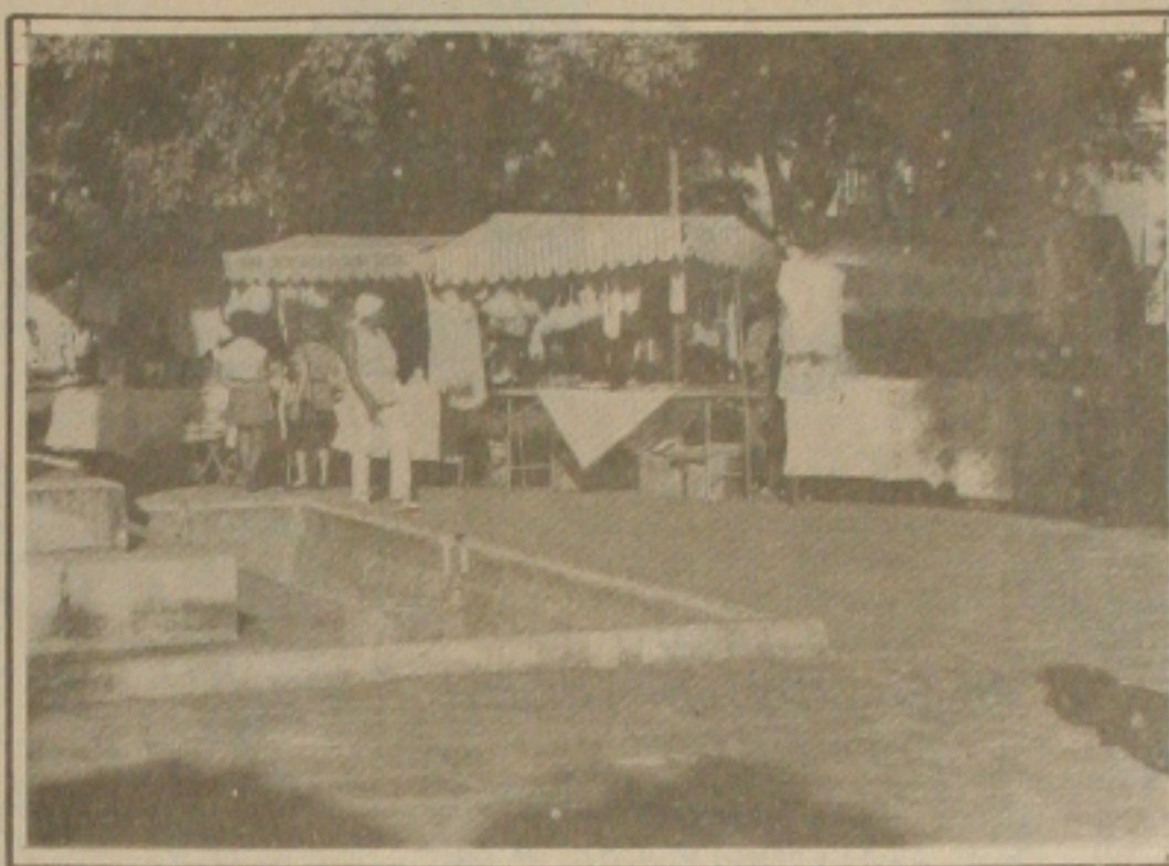
No Parque Teófilo Dantas a Feira está vendendo mais.

Como os turistas são os principais fregueses dos comerciantes de artesanatos, eles afirmam que no período de alta estação estão confiantes que as vendas aumentarão mais ainda chegando até a 100 por cento.