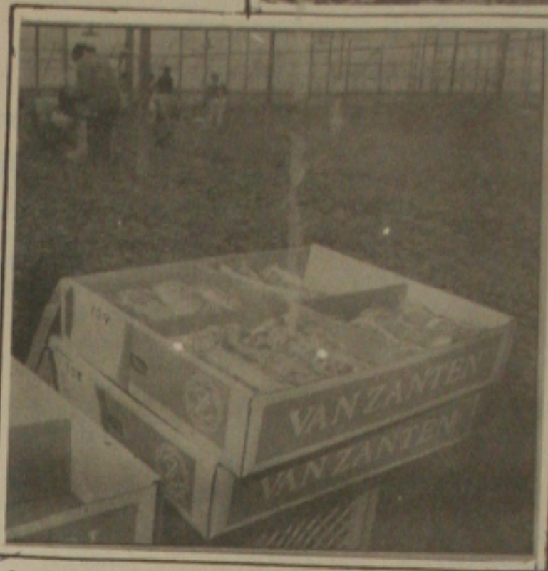
A embalagem é padrão para a exportação: caixa de papelão prensado com ventilação

Milhões de dúzias de rosas, cravos, begônias, crisântemos, orquídeas ou vasos de cactos, produzidos pela Holambra e também pela Florilândia Atibaia chegam com maior segurança a seu destino. Graças ao transporte rodoviário e aéreo especializado.