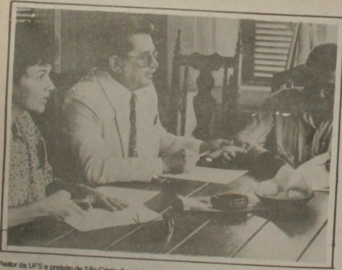
Reitor da UFS e prefeito de São Cristóvão assinam convênio.

periências nas áreas de interesse comum através da realização conjunta de projetos de extensão, pesquisa e atividade artístico-culturais e realizar seminários, encontros e outros eventos que julgar necessários, como também desenvolver uma ação social e médico-hospitalar para assistência à população carente. O presente convênio será executado em regime de co-participação, devendo a Universidade e Prefeitura de São Cristóvão, respectivamente, indicarem seus representantes, cabendo a coordenação geral à Universidade. A Prefeitura de São Cristóvão cabe a tarefa de proporcionar aos alunos regularmente matriculados nos cursos de graduação da UFS, campo de estágio curricular e extra curricular e realizar estudos e pesquisas sobre campos específicos do interesse da Universidade, dentro de suas possibilidades.