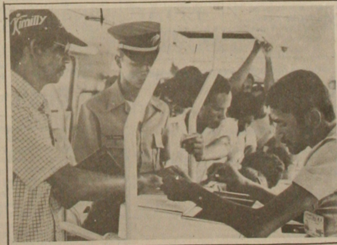
Usuários dos transportes coletivos reclamam o "celebre" troco. Só cobradores gostam.