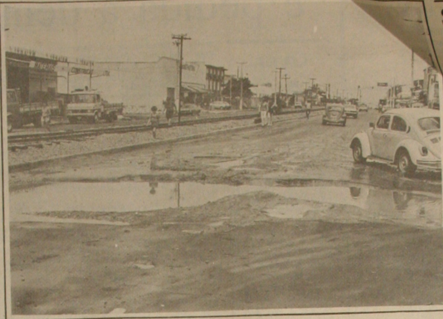
A recuperação asfáltica da Emurb só serve para críticas.

Quero alertar à população que, se dentro em breve, recursos não forem liberados para a execução do trabalho de recapeamento das vias públicas, no próximo inverno, as artérias estarão intransitáveis, por não mais suportar a chuva que destruirá o asfalto e molhará a base.