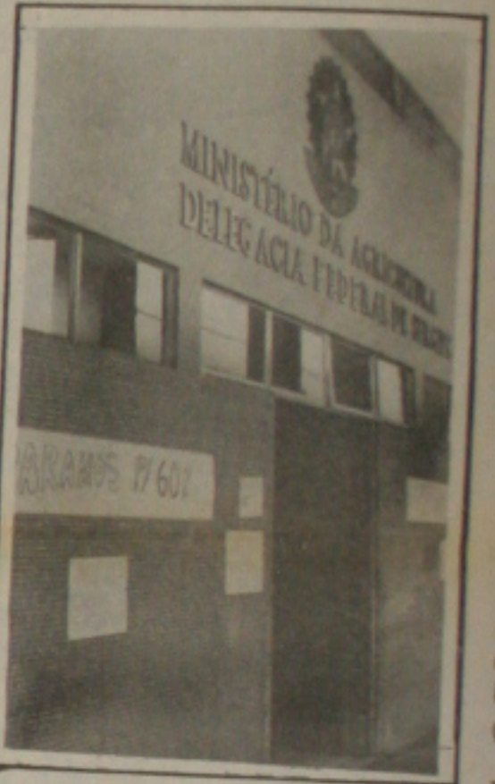
Funcionários do Ministério da Agricultura mantêm greve.