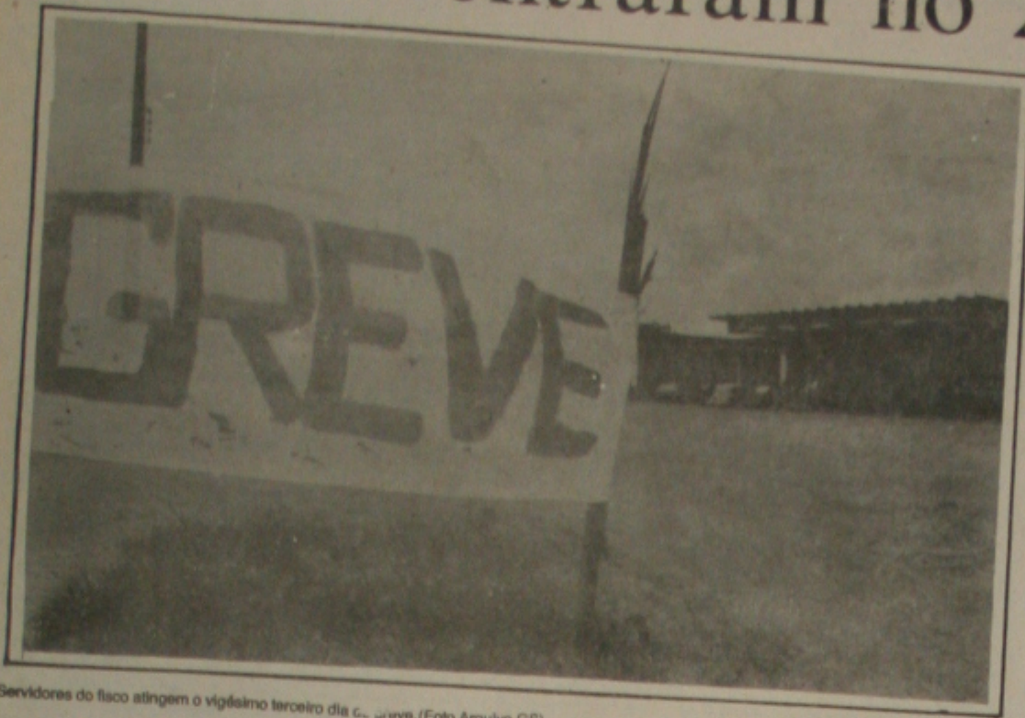
Servidores do fisco atingem o vigésimo terceiro dia de greve. (Foto Arquivo GS).