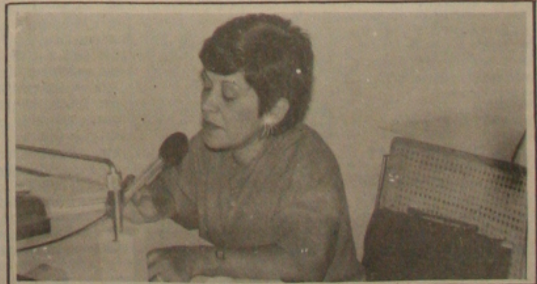
A vereadora diz que o importante é a qualidade.

Na entanto, isso é muito prematuro, porque nossa intenção é trabalhar a candidatura do senador Mário Covas e fazer com que as pessoas politizadas e conscientizadas elejam-no e temos certeza de que ele no segundo turno, a vitória estará assegurada. O difícil é passar no segundo turno, porque as pessoas estão acostumadas com o oba-oba, que não prestam atenção nas coisas sérias. Mesmo assim, acreditamos em sua vitória - concluiu.