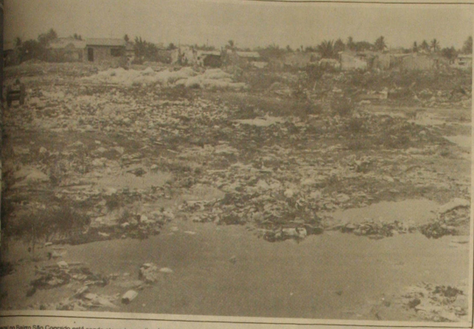
Uma lixeira no Bairro São Conrado está sendo aterrada com lixo, formando uma nova lixeira na cidade, o que tem causado problemas para os moradores.

Ao assumir o governo, um dos primeiros atos do presidente eleito, Fernando Collor de Mello será a deflagração da "Operação Pega Ladrão", que inclui a investigação de todas as denúncias de atos de corrupção do Governo Sarney. Foi o que anunciou ontem o assessor de imprensa, jornalista Cláudio Humberto, ao revelar também a disposição do novo presidente em acabar com a instituição do imóvel funcional em seu governo, cumprindo assim uma das promessas da campanha eleitoral. Sobre a "Operação Pega Ladrão", Cláudio Humberto comentou que os inquiridos sobre corrupção no Governo Sarney deverão ser reabertos e será nomeado um procurador especial para coordenar essas ações, pois, "a intenção é de ir até as últimas consequências na punição desses atos". O assessor do presidente Fernando Collor de Mello chegou a duvidar que alguém possa prover um atestado de probidade