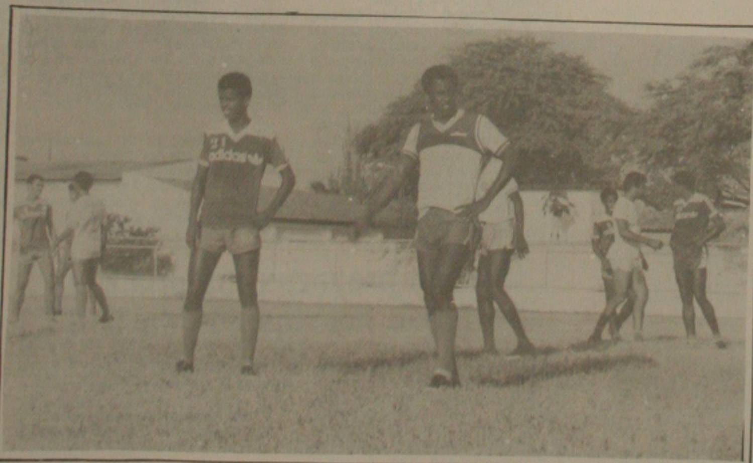
Confiança faz coletivo amanhã, para enfrentar o União de Propriá.

Na entrevista coletiva depois do jogo, o técnico Zagalo se confessou embasbacado com a Holanda. "um estilo de jogar" que ele não conhecia.