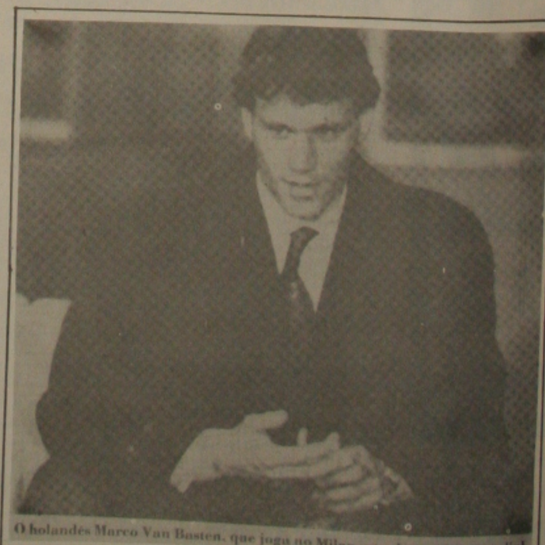
O holandês Marco Van Basten, que joga no Milan, atual campeão mundial

Mantá x Organtec E no Ginásio do late Clube às 20:00hs Coritiba x AABB/Estância Iete x Cruzeiro Atlética x Independente E na sexta às 20hs no Ginásio Graccho Cardoso Hesagipe x Cruzeiro Confiança x Mantá Coritiba x Iete