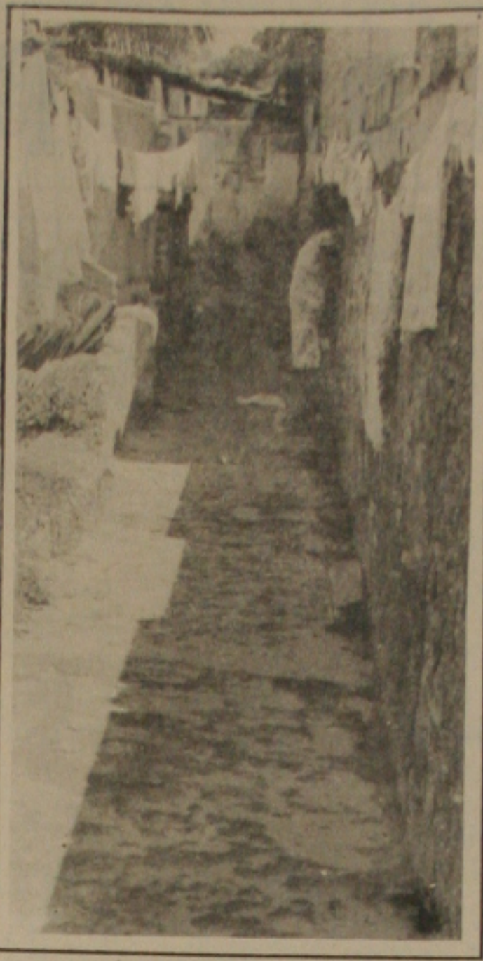
Nas vilas as pessoas residem como "só Deus sabe".