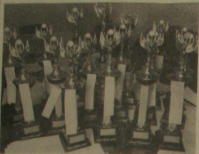
HOBBY SPORT PROMOVE JOGOS

Hoje a partir das 8 horas da manhã, no Complexo Desportivo do Trabalhador, situado no Distrito Industrial de Aracaju, acontecerá a abertura dos "Jogos Abertos Hobby Sport", coordenado pela Divisão de Esportes e Lazer do Sesi. Na foto, aparecem os troféus ofertados pela firma Hobby Sport.