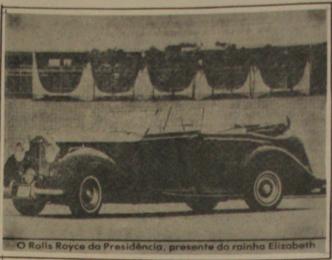
O Rolls Royce da Presidência, presente da rainha Elizabeth