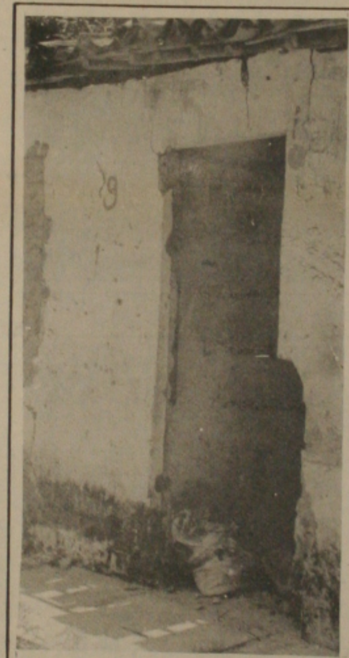
Morar numa casa dessa "é muito difícil".