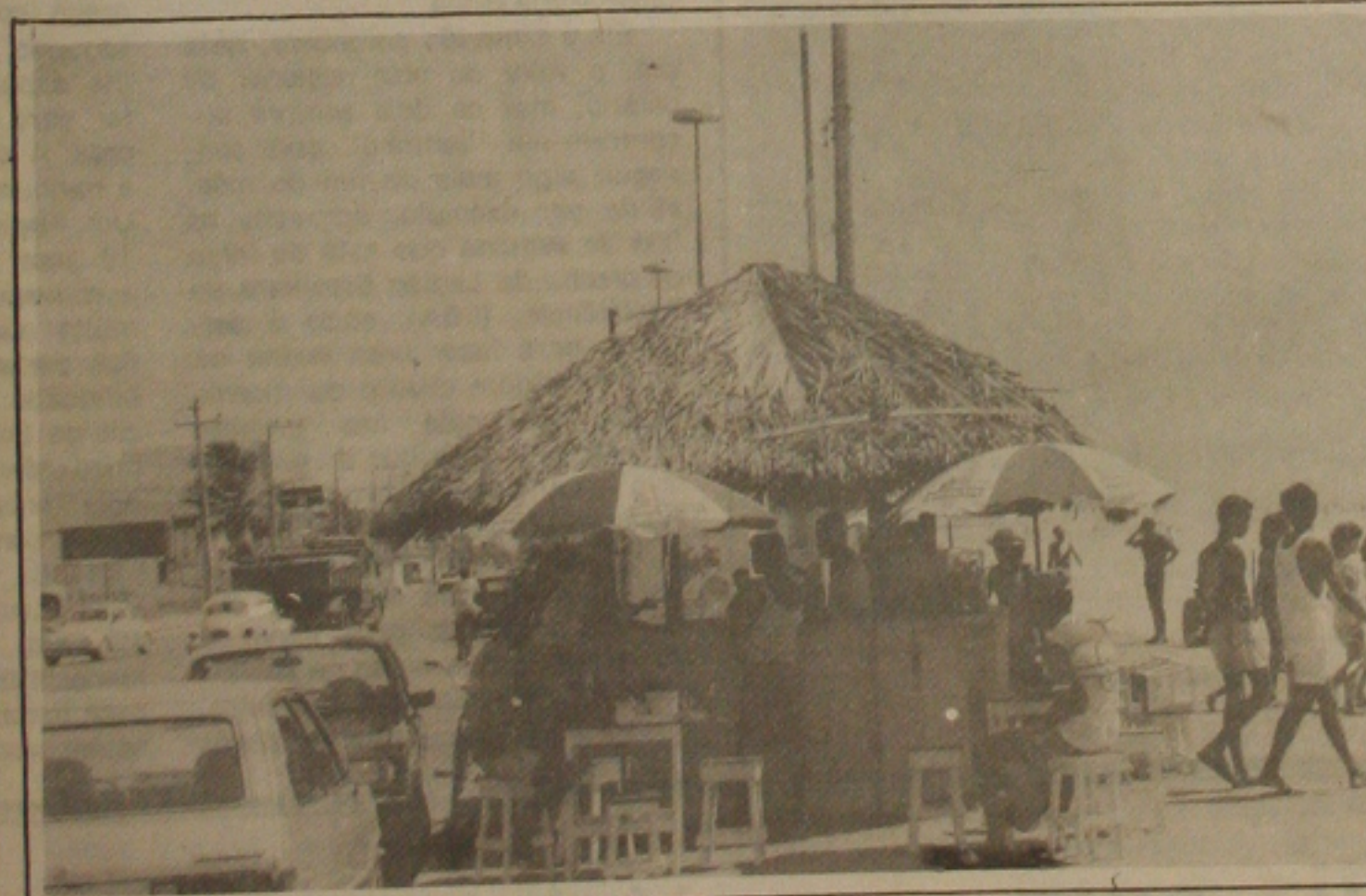
Os bares da orça marítima estão sempre lotados.