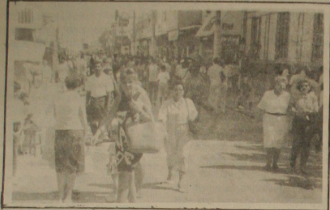
... e o calçadão apresenta uma movimentação grande de consumidores.