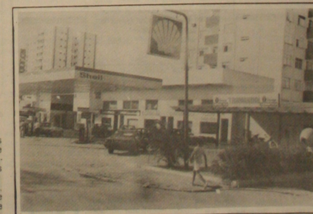
Auto Posto Tramandal Ltda.