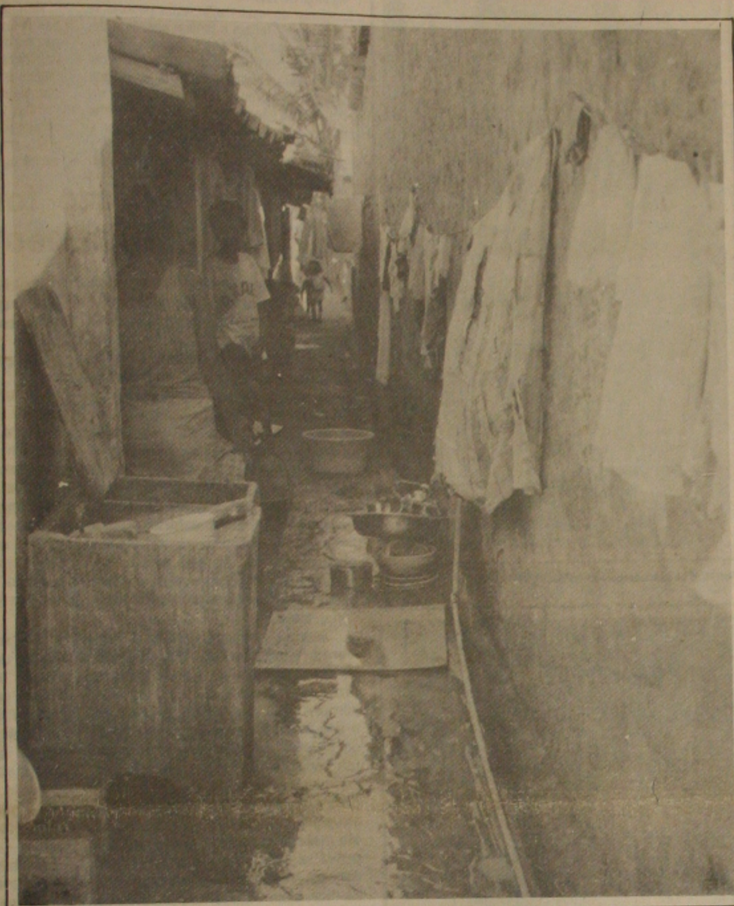
As vilas são um retrato fiel da miséria dessa gente que sobrevive com o salário.

de ouvir as consi- dos comandantes e do Comar - en- quis a de que a que atinge os lano- e trazida pelos mas uma doen- ença do