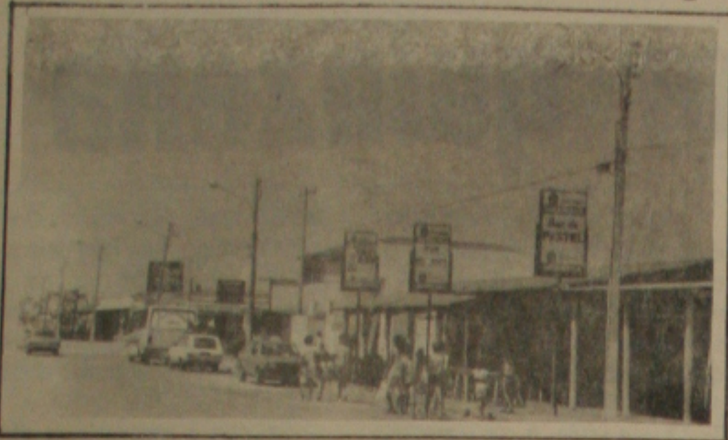
Apesar da crise, os bares da orla marítima estão sempre cheios...