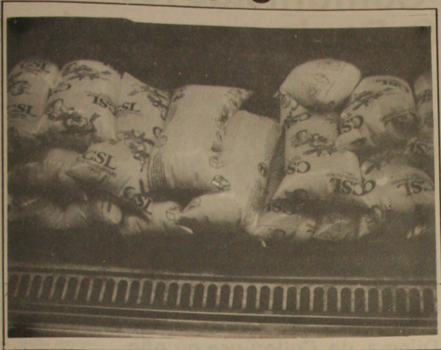
Milhares de litros de leite são jogados fora diariamente.