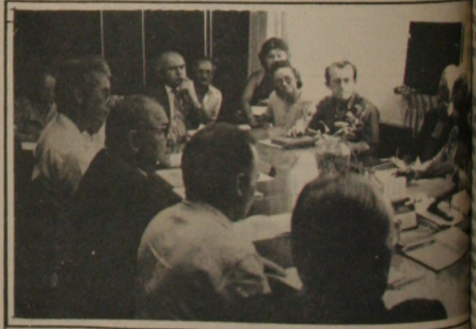
Professores e dirigentes da rede particular de ensino firmam acordo.

acrescido de mais 4 salários mínimos de referência e as vantagens de 9 por cento para o pessoal com licenciatura plena por cento com licenciatura plena, cinco por cento para aqueles com curso de aperfeiçoamento e especialização, 15 por cento com mestrado, e 20 por cento com doutorado. Inicialmente a classe patronal sentou a mesma proposta que acabou aprovada pelos dirigentes sindicais presentes na última rodada de negociações que aconteceu ontem pela manhã na Delegacia Regional do Trabalho. Foram aproximadamente 3 horas de discussão entre as partes. No encontro o presidente do Sindicato dos professores concedeu entrevista à imprensa quando considerou a negociação em alto nível. Para ele, a classe trabalhadora conseguiu avanços nas negociações justamente por falta de mobilização da categoria haja vista que o Sindicato tem apenas 100 filiados.