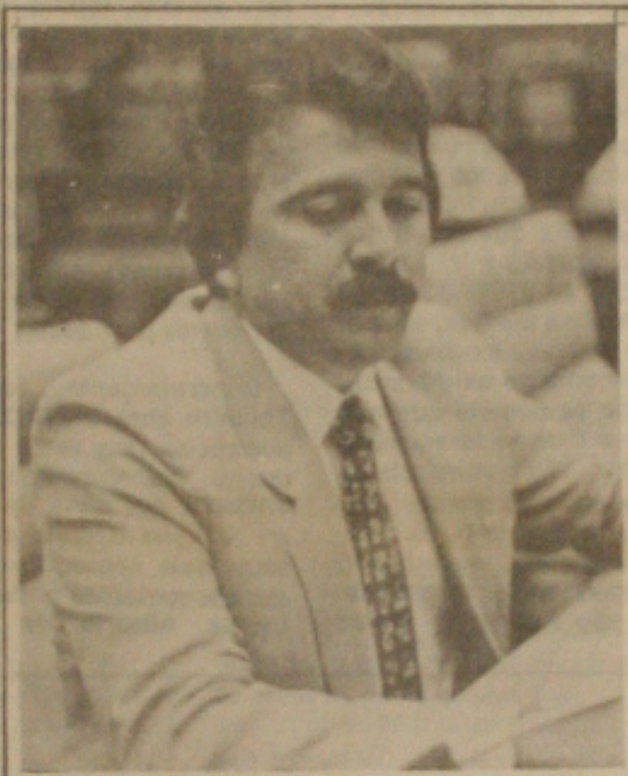
Almeida sonha com a vice...