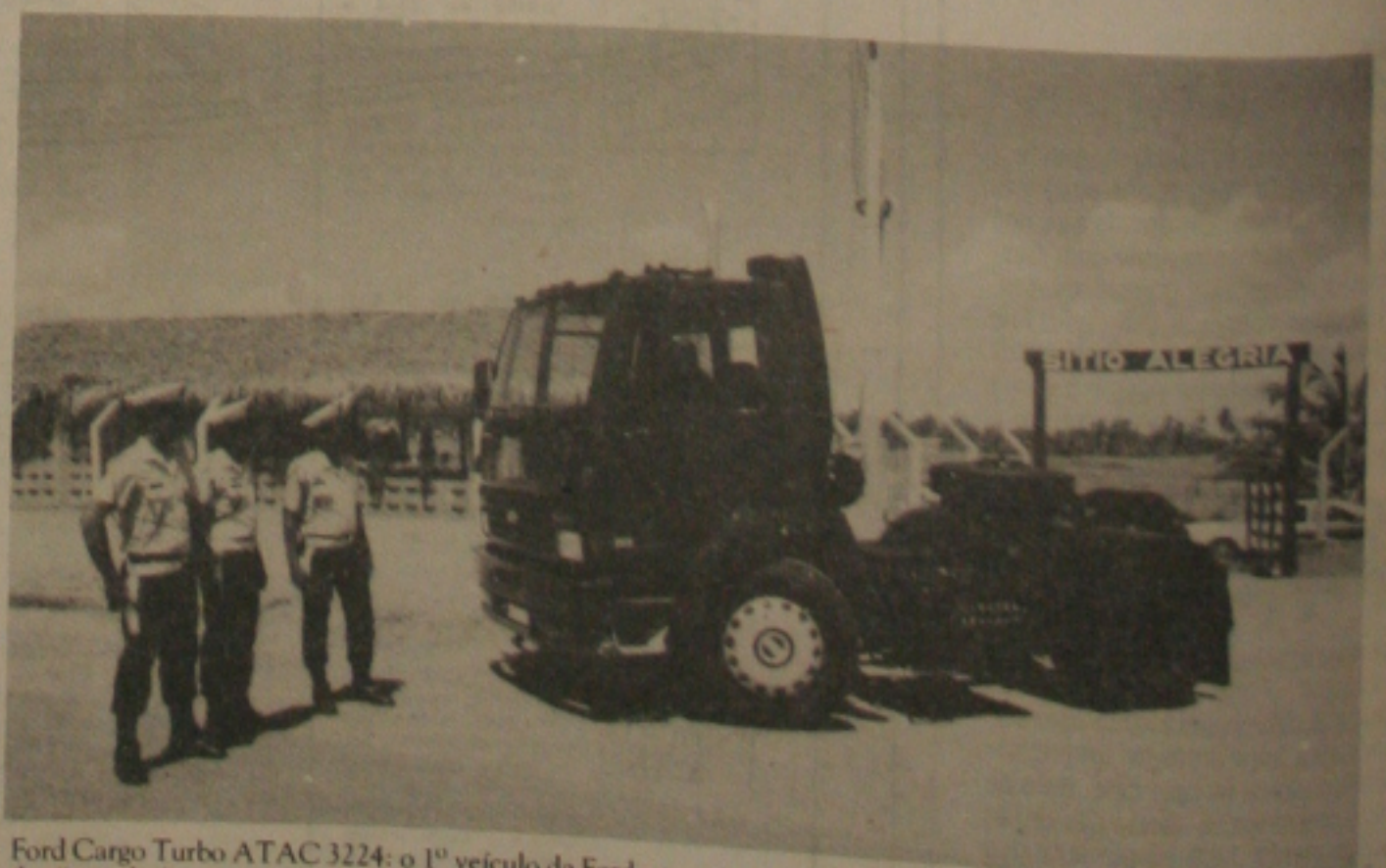
Ford Cargo Turbo ATAC 3224: o 1º veículo da Ford no segmento dos "pesados".

RESTAURANTE DORMITÓRIOS... BANHEIROS... CONFORTO PARA CAMINHONEIROS