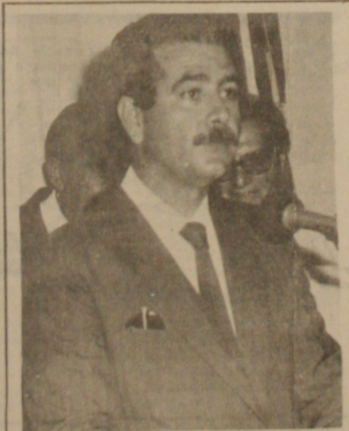
Benedito quer à Câmara...