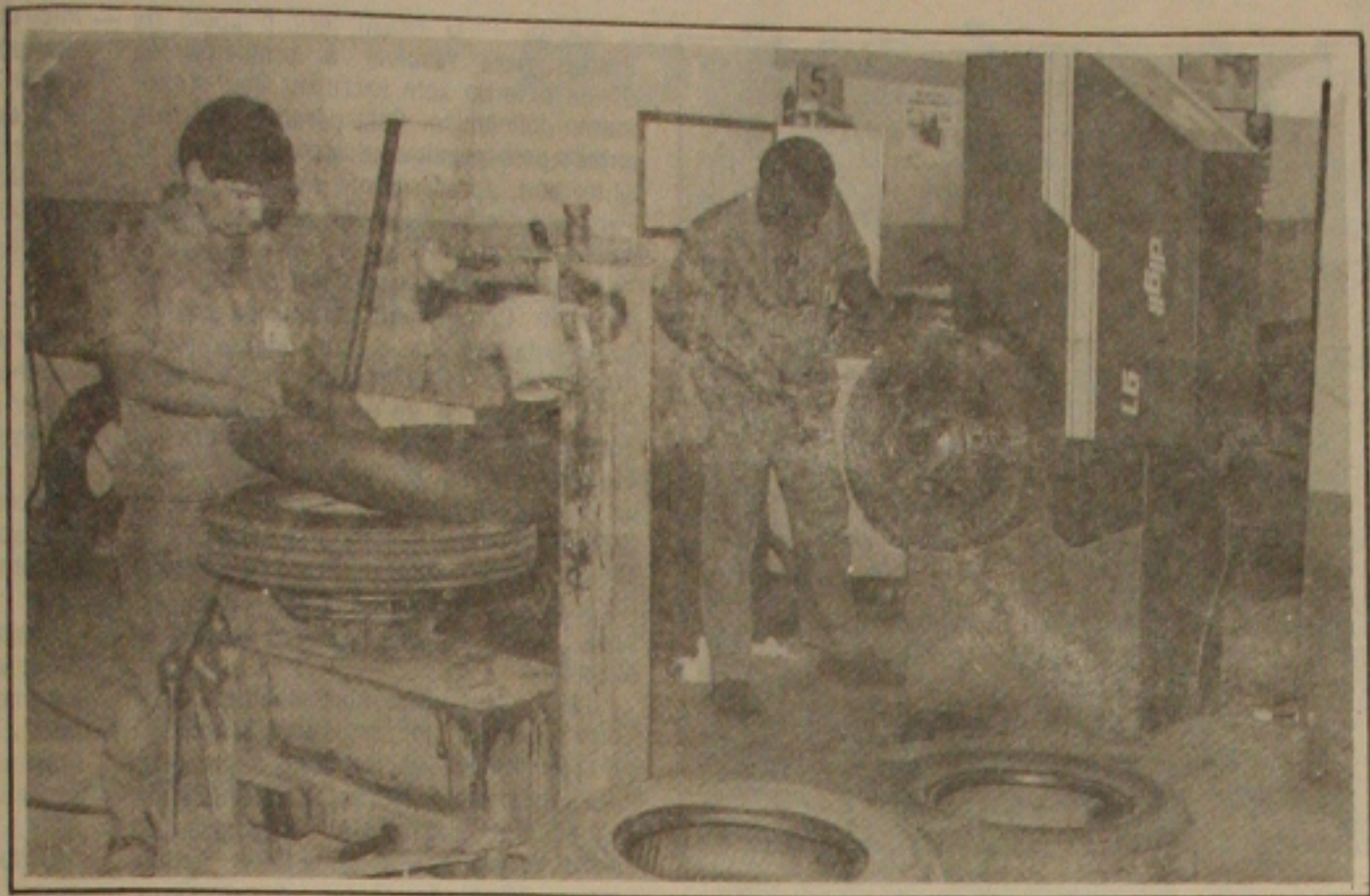
A venda dos pneus cairam 40 por cento em janeiro deste ano, afirmam os revendedores.