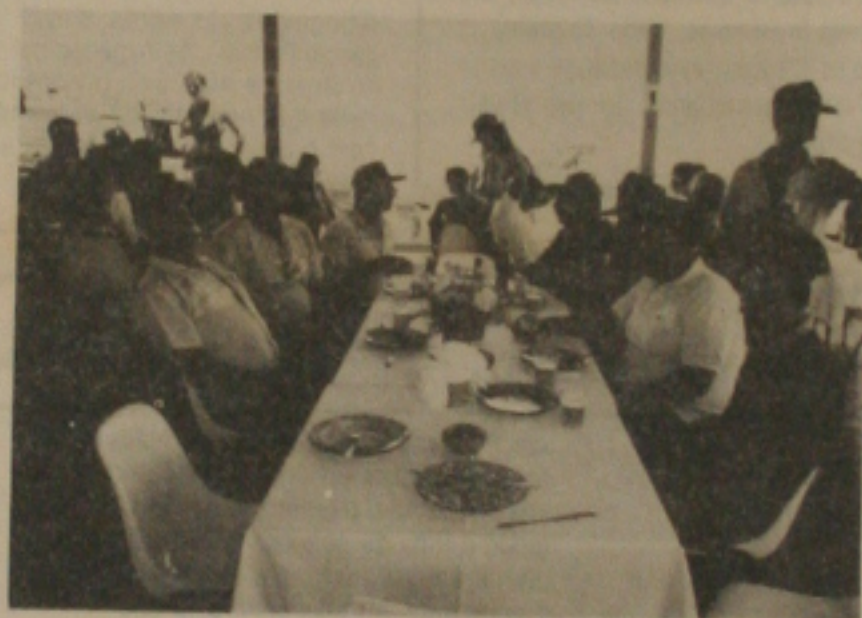
Caminhoneiros, frotistas e chefes de transporte reunidos em almoço oferecido pela Cimavel após o "test-drive".