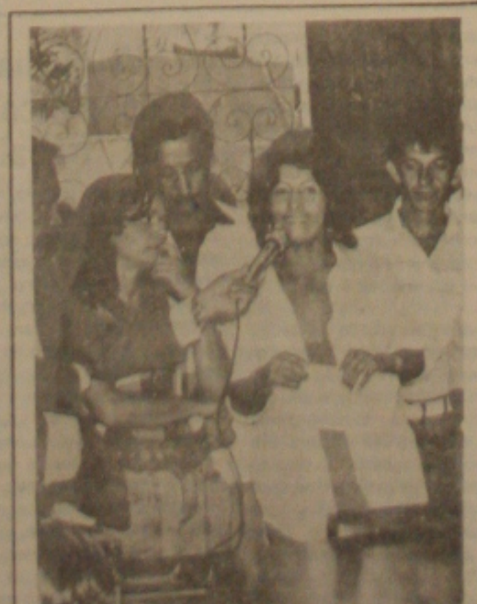
Eleonora empurrada à Assembleia...