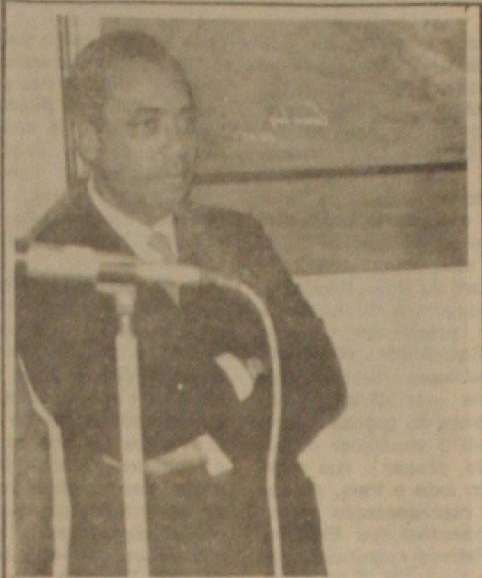
João pensa no acordo...