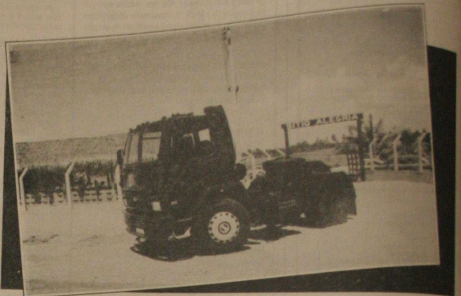
O novo Cargo Turbo ATAC: motor diesel de 243cv de potência e capacidade para tracionar até 32 toneladas de peso bruto.

Durante o teste, os convidados puderam perceber a preocupação da Ford em oferecer um projeto inovador, que proporciona segurança, arrojo e comodidade aos motoristas que labutam pelas estradas de todo o País transportando, além de cargas das mais diversas, o nosso desenvolvimento.