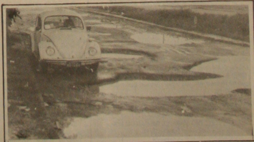
Ruas cheias de buracos no Bairro São Conrado.