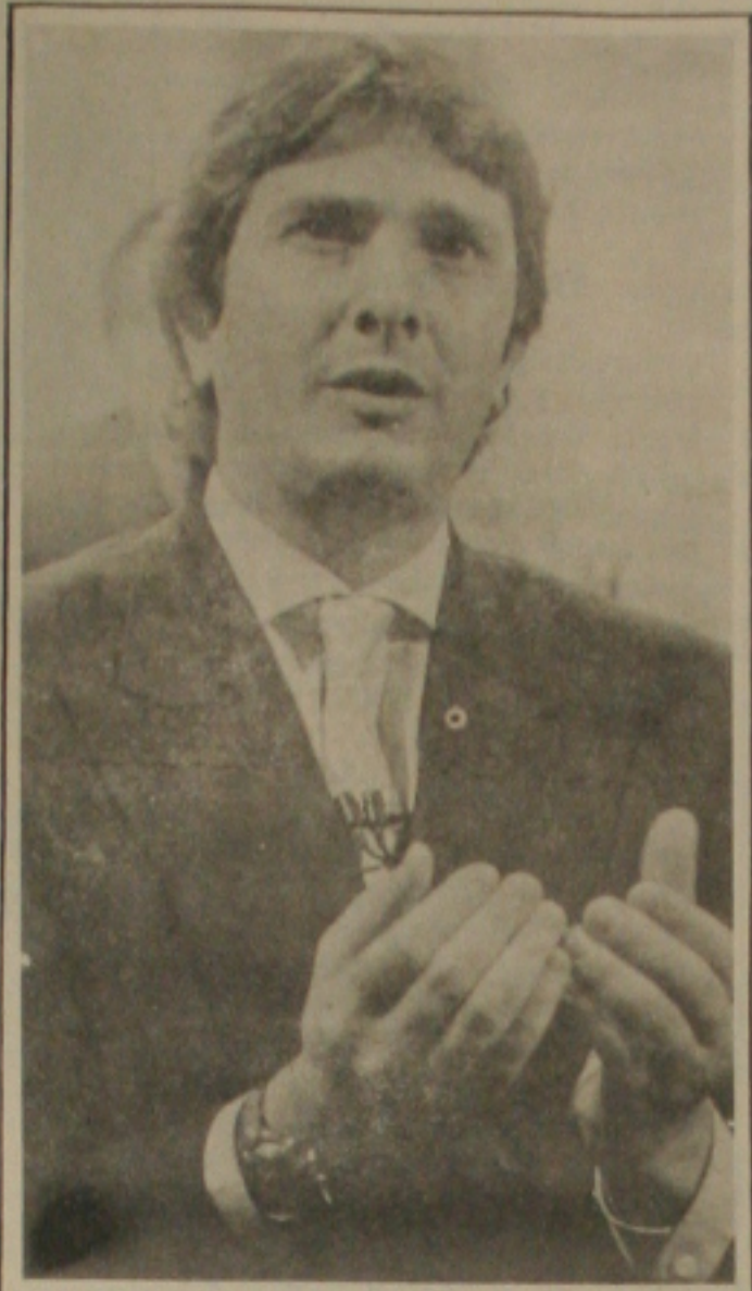
Collor. Holding no Ministério.

Pretendo intensificar ainda mais a troca de informações com os públicos interno e externo, a Área de Comunicação Social do Grupo IOB, passou, neste início de ano, a integrar a Diretoria Administrativa da Empresa.