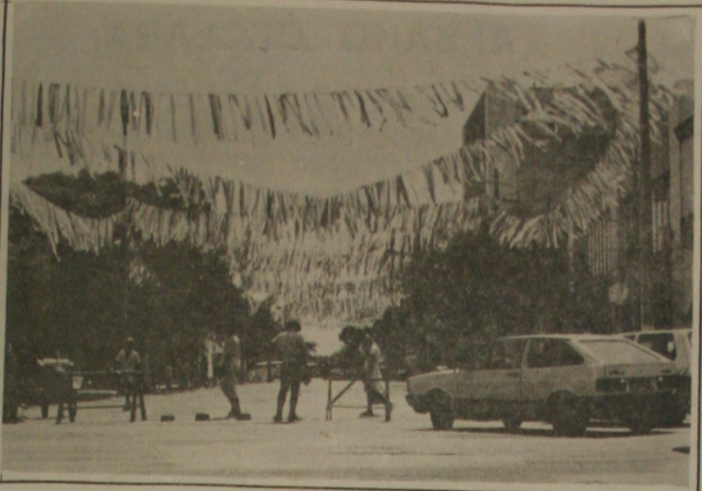
Ornamentação do Clube do Povo deverá ser a mesma do ano passado.

Segundo a parlamentar, que também é professora e mantém um núcleo educacional no Conjunto Castelo Branco, a emenda aprovada, que será inserida na nova lei orgânica do município, a ser promulgada no próximo dia cinco de abril, representa um grande avanço no setor de educação de Aracaju, pois propiciará condições aos estudantes que não dispõem de recursos financeiros a frequentar as escolas particulares mediante convênios firmados com o município, indo, portanto, socorrer pais de famílias que atualmente se vêem privados de educarem seus filhos em igualdade de condições com os filhos oriundos da chamada classe média.