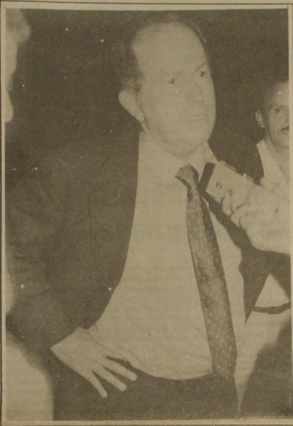
Albano: candidatura confirmada no desembarque ontem em Aracaju.

"Eu não posso ser candidato de mim mesmo. A sugestão do meu nome surgiu de outubro para cá e eu tenho conversado com algumas lideranças. Agora, eu tenho dito que não terei medo de enfrentar qualquer candidato, porque faz parte do jogo democrático. Além do mais me sinto perfeitamente à vontade de enfrentar, pois vou fazer isso com idéias e propostas, principalmente analisando o passado, o presente de cada um dos homens que fazem política em Sergipe. Isso sim, é o que me anima e me estimula a continuar na política do Estado", a afirmação é do senador Albano Franco, feita ontem à noite, ao desembarcar no Aeroporto de Aracaju, procedente de São Paulo.