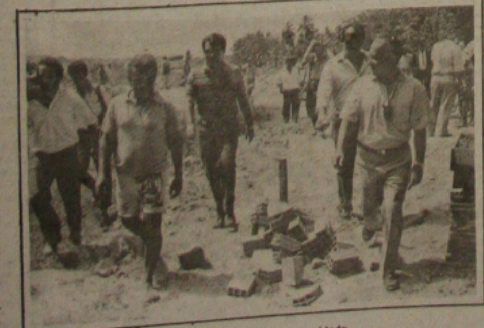
Flagrante do governador fiscalizando obras para a comunidade