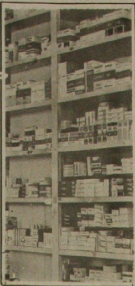
tônio Carlos Araújo, comerciante e que não tem condições de almoçar em casa todos os dias faz um lanche meio dia no centro da cidade.

Uma farmácia em Aracaju que teve suas portas e seu dono mudar de ramo foi a Acácia, localizada na rua Laranjeiras esquina com Santo Amaro, que passou a ser lanchonete, uma vez que o comércio de remédio passou a ser deficitário, enquanto que o de alimento não, pois todos são obrigados a se alimentar e muita gente que não pode pagar por um almoço, prefere fazer um simples lanche que é mais barato, como é o caso de An-