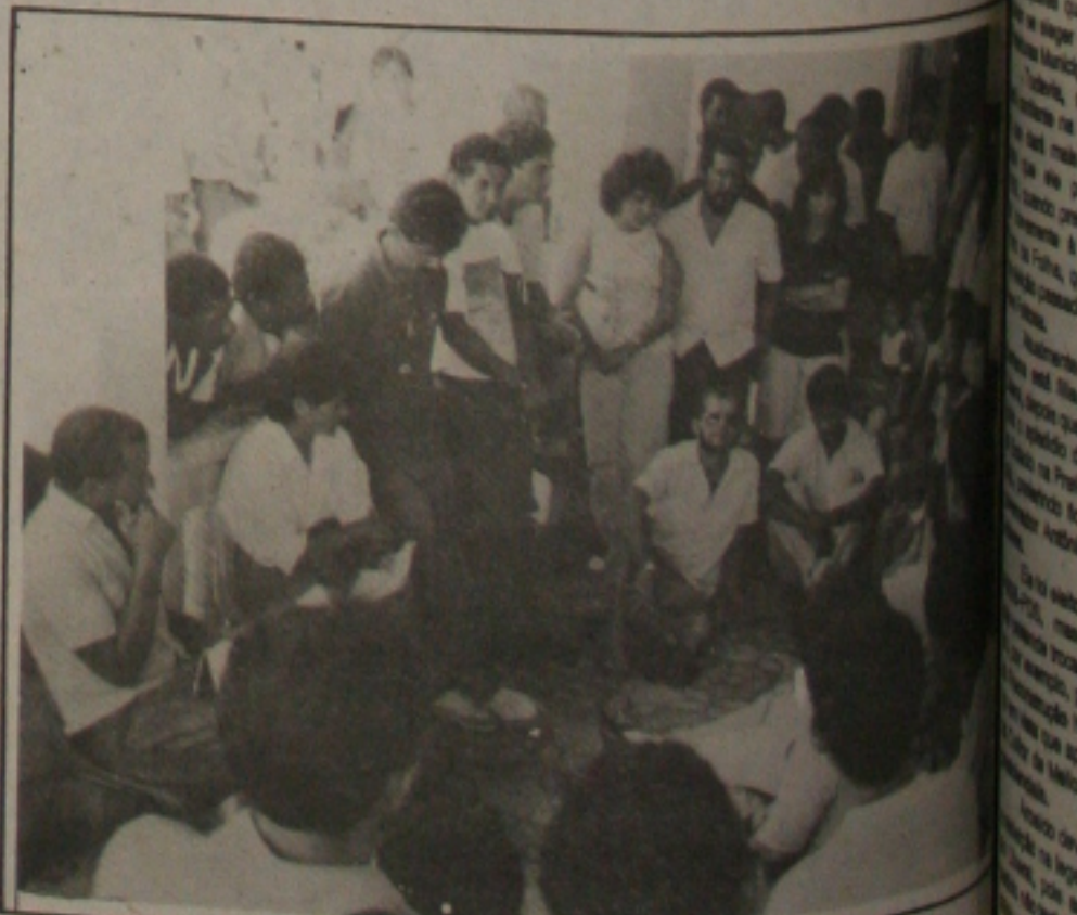
Eletricitários concentram-se na sede do SINTIEESE.

O presidente em exercício do SINTIEESE garantiu que a população, em nenhuma hipótese, será penalizada com a greve dos eletricitários. Segundo esclareceu, o movimento do sindicato garantiu um sistema de distribuição de energia elétrica e também uma equipe que ficará no local para atender os usuários em caso de problemas dos usuários.