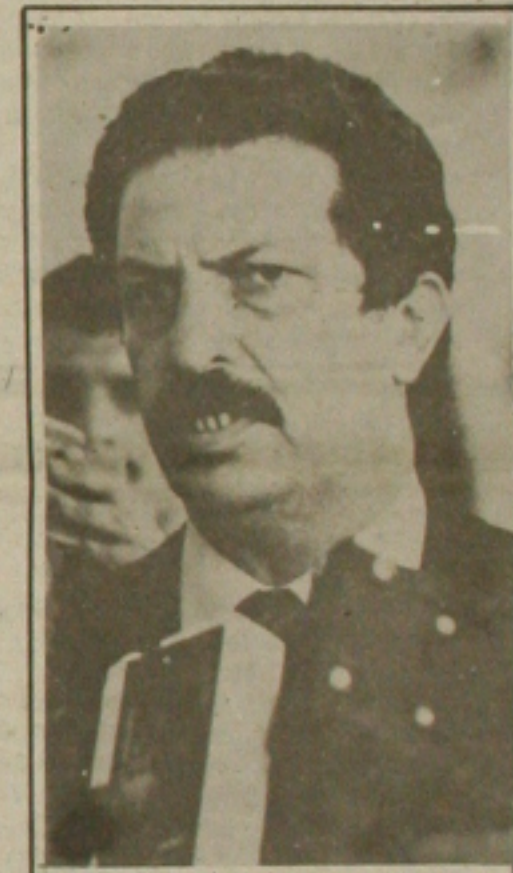
O superintendente da Polícia Federal, delegado Romeu Tuma se reuniu com empresários do setor varejista.

Diante do quadro de instabilidade vivido pelo País, a população fica apreensiva, na expectativa de que o governo (se não for atual que já está com suas horas contadas, que seja o futuro que toma posse dentro de 30 dias) possa controlar a situação, para que volte a paz e a tranquilidade