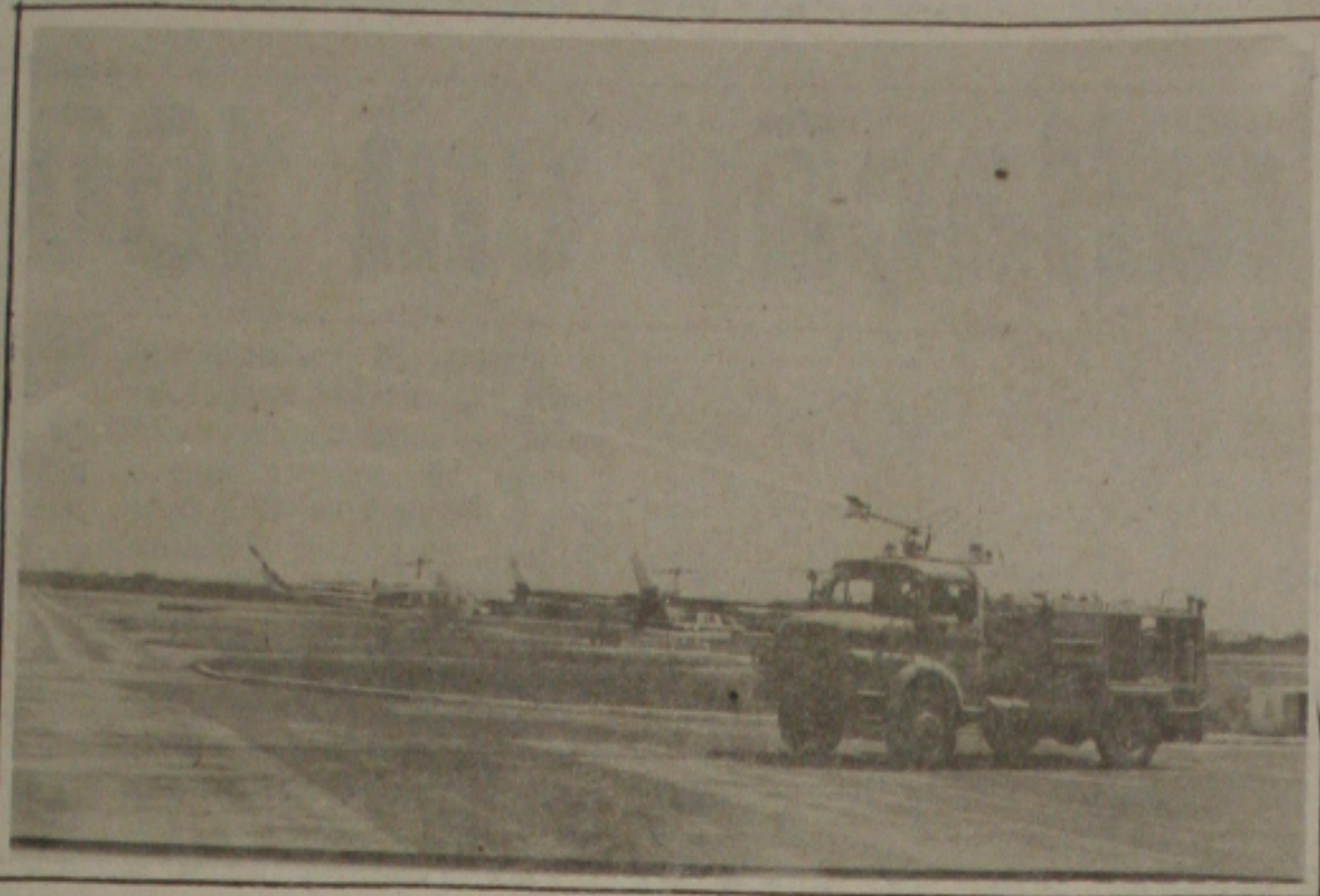
Aeroporto de Aracaju oferece segurança, diz superintendente da Infraero.