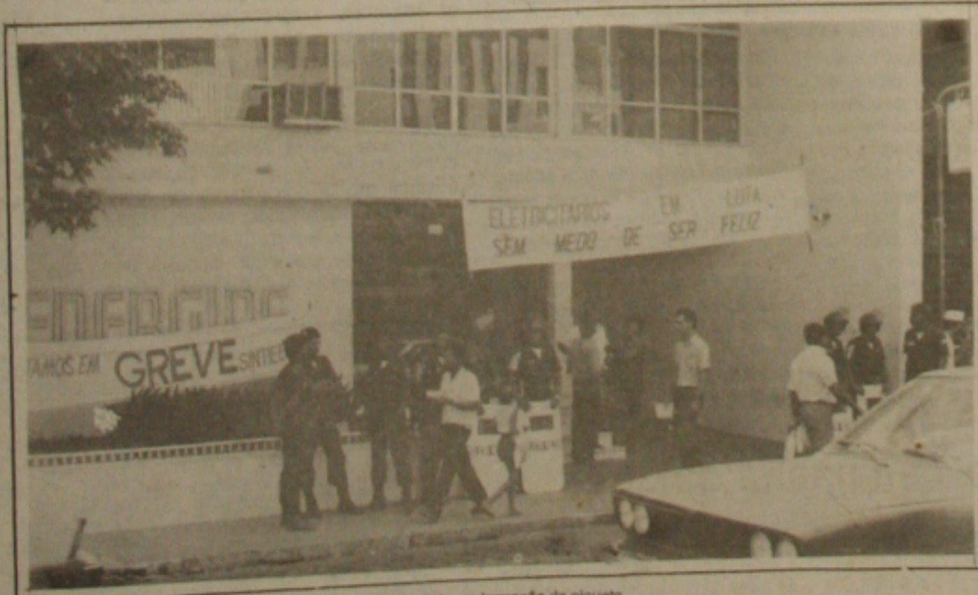
Greve da Energipe: policiais garantem a segurança e impedem a formação de piquete.