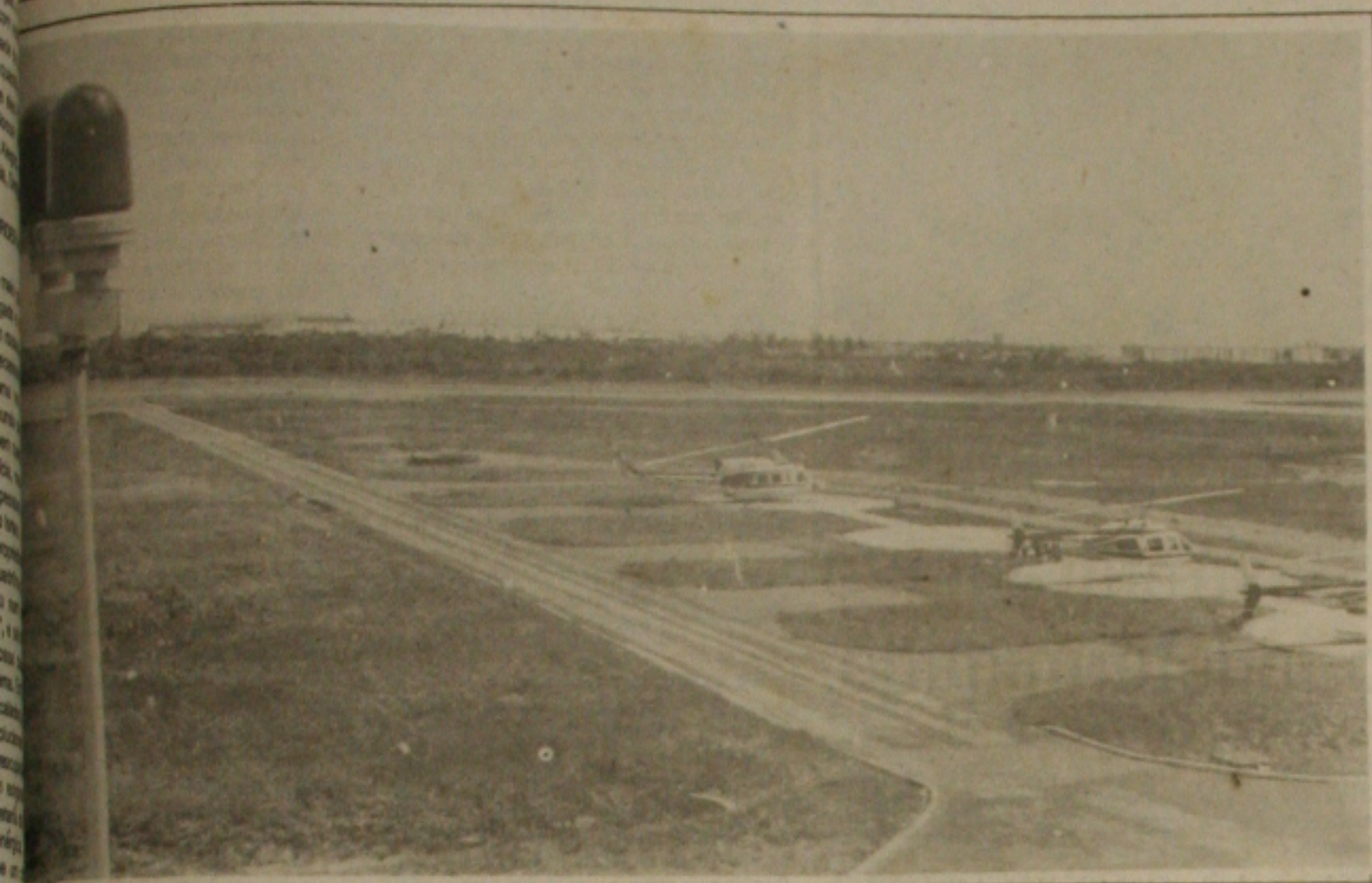
Área próxima ao Aeroporto, estão temerosos com a possibilidade de acidentes aéreos.

Brasília - O presidente José Sarney precisa tomar medidas urgentes para conter a aceleração do processo inflacionário e evitar o caos da hiperinflação. Este alerta foi feito ontem pelo presidente eleito Fernando Collor em conversa com jornalistas durante o voo que o levou do Rio de Janeiro a Brasília. Collor retornou ao País depois de 20 dias de viagem a nove países e se disse extremamente preocupado com a perspectiva de inflação de 72% que se desenha para o mês de fevereiro.