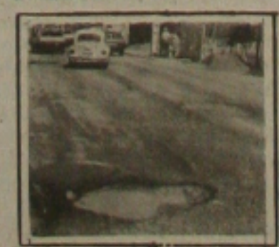
Existem vários buracos como este espalhados pelos bairros da cidade.

Os denunciantes aproveitaram a oportunidade para denunciar a coleta de lixo em diversos bairros da capital sergipana como também a falta de iluminação pública, principalmente na orla da marítima de Aracaju e na pista que dá acesso a Atalaia Velha.