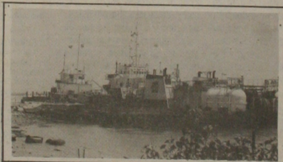
Sindicato dos Marítimos aguarda decisão para deflagrar greve.

Na sexta-feira passada, o movimento foi discutido e aprovado numa assembleia geral no Rio de Janeiro, porque os proprietários de navios se recusam em negociar a proposta apresentada pela categoria. Ontem à meia noite, os marítimos de onze sin-