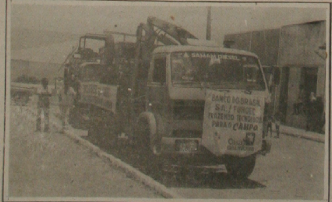
O caminhão da Casa da Lavoura carregado com diversos implementos agrícolas que vão facilitar a vida dos colonos do Mocambo.