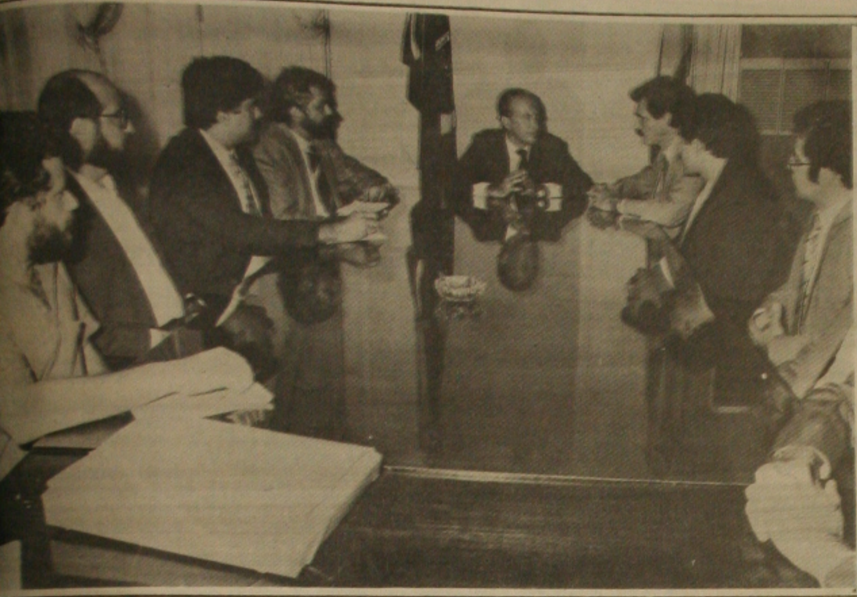
Valadares reuniu dirigentes e funcionários da Petrópolis para oficializar a proposta do ministro Ozires Silva.

Antecipando o que anunciará no seu pronunciamento da próxima segunda-feira, o governador Antônio Carlos Valadares declarou ontem que não vai se afastar do Governo do Estado para disputar qualquer cargo eletivo este ano.