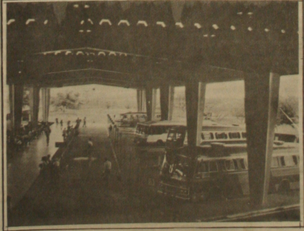
As medidas econômicas do Plano Collor provocaram queda de movimento até no Terminal Rodoviário.

BRASÍLIA - A cerveja 10% e os refrigerantes 6% estão mais caros a partir de hoje. Os reajustes foram autorizados pela ministra da Economia, Zélia Cardoso de Melo, para repassar a alta do imposto sobre produtos industrializados (IPI). O aumento de 30% para o IPI, foi autorizado pelo presidente Fernando Collor, através do decreto 15.181, assinado no dia 15 de março, em vigor desde o dia 19, porém, como a medida provisória 154 proíbe qualquer aumento, os fabricantes ficaram sujeitos a fiscalização da Polícia Federal. O presidente Fernando Collor assina hoje nova medida provisória. E a que vai regulamentar o reajuste das mensalidades das escolas particulares. A medida foi definida ontem em audiência com o ministro da Educação, Carlos Chiarelli. Em abril as mensalidades escolares deverão ficar congeladas e a partir de maio o reajuste será igual ao concedido para os salários. Caberá aos Conselhos Estaduais de Educação fiscalizar o cumprimento da medida pelas escolas, assim como, proceder fiscalização sobre a correta aplicação do reajuste nas mensalidades do mês de março. (Página 6)