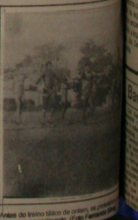
Antes do treino técnico de ontem, os dirigentes da ACDS se reuniram para discutir o planejamento. (Foto Fernando Gomes).