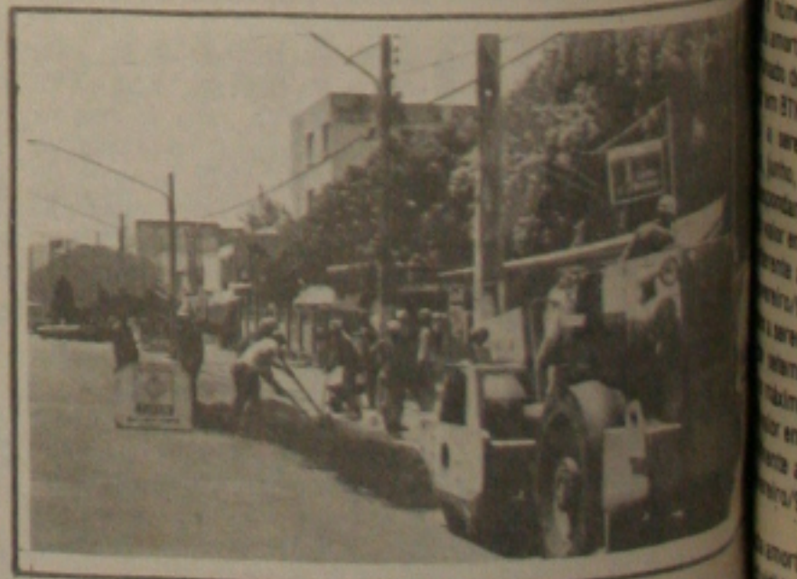
Mutirão beneficia moradores do bairro Suissa.