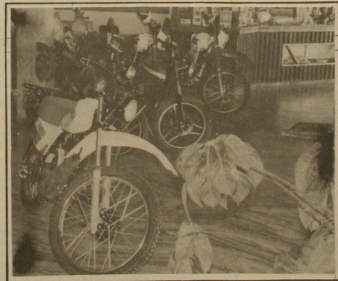
Segundo os gerentes o Plano Brasil Novo fez diminuir a venda das motos.

Apesar de acreditar que os preços das motocicletas não baixarão por entender que criaria um conflito com as pessoas que adquiriram o mesmo produto com preço mais elevado, o chefe de departamento de vendas da Moto Pop, afirmou está confiante que o atual quadro se reverterá, com o surgimento de cruzeiros e a queda da inflação.