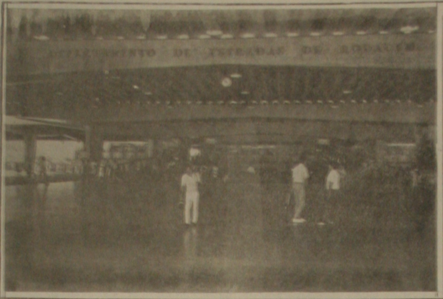
Diminui o movimento de passageiros no Terminal Rodoviário.

Antes das medidas tomadas pela Petrobrás o movimento era intenso no Terminal Portuário de Aracaju. Atualmente praticamente não existe movimento de embarcações. Além disso com a ameaça de acabar com a Petrobrás tudo ficou estagnado. Mas Alcísio Pereira acredita que na administração do presidente Fernando Collor de Mello os problemas sejam solucionados e a estatal volte a contratar mais embarcações.