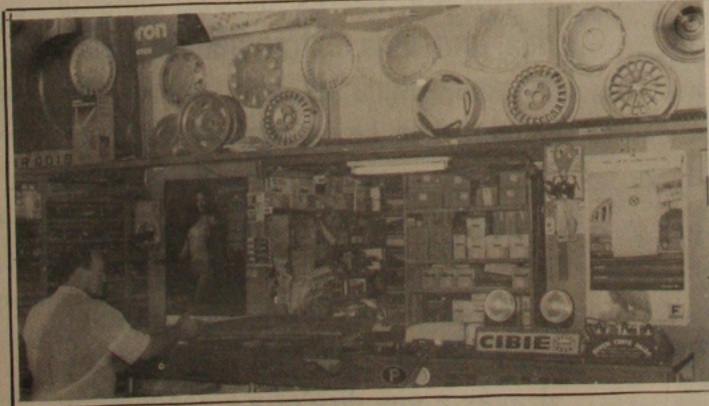
Comércio de auto-peças caiu em 70%, em Aracaju.

A esperança dos comerciantes de auto-peças é que entre mais cruzeiros no mercado, e principalmente, que os fabricantes baixem seus preços, por entenderem que, somente a partir daí as vendas serão normalizadas e os problemas solucionados.