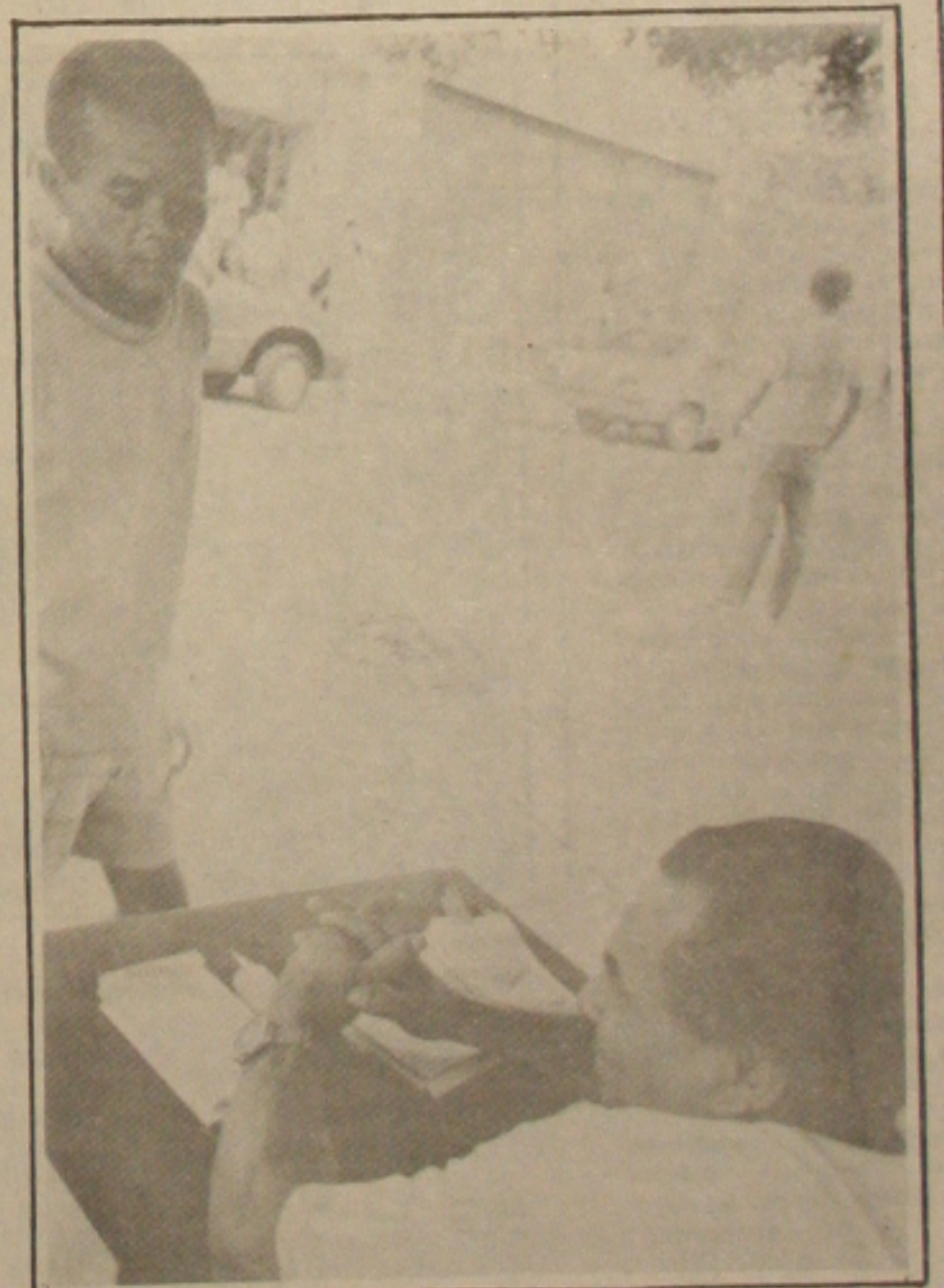
De bicheiros sofreram com o Plano Collor.

Os bicheiros, a exemplo de outras camadas sociais, também estão sofrendo as consequências do Plano Brasil Novo. Com o bloqueamento do dinheiro investido, pelo Banco Central, e conseqüentemente sem dinheiro eles estão reduzindo o valor para apostas e, com isso faturando menos. Para se ter uma idéia clara da situação atual, um cambista que faturava uma média de NCZ$ 2.000,00, o equivalente a Cr$ 2.000,00 atuais, hoje arrecada simplesmente Cr$ 700,00. (Página 2)