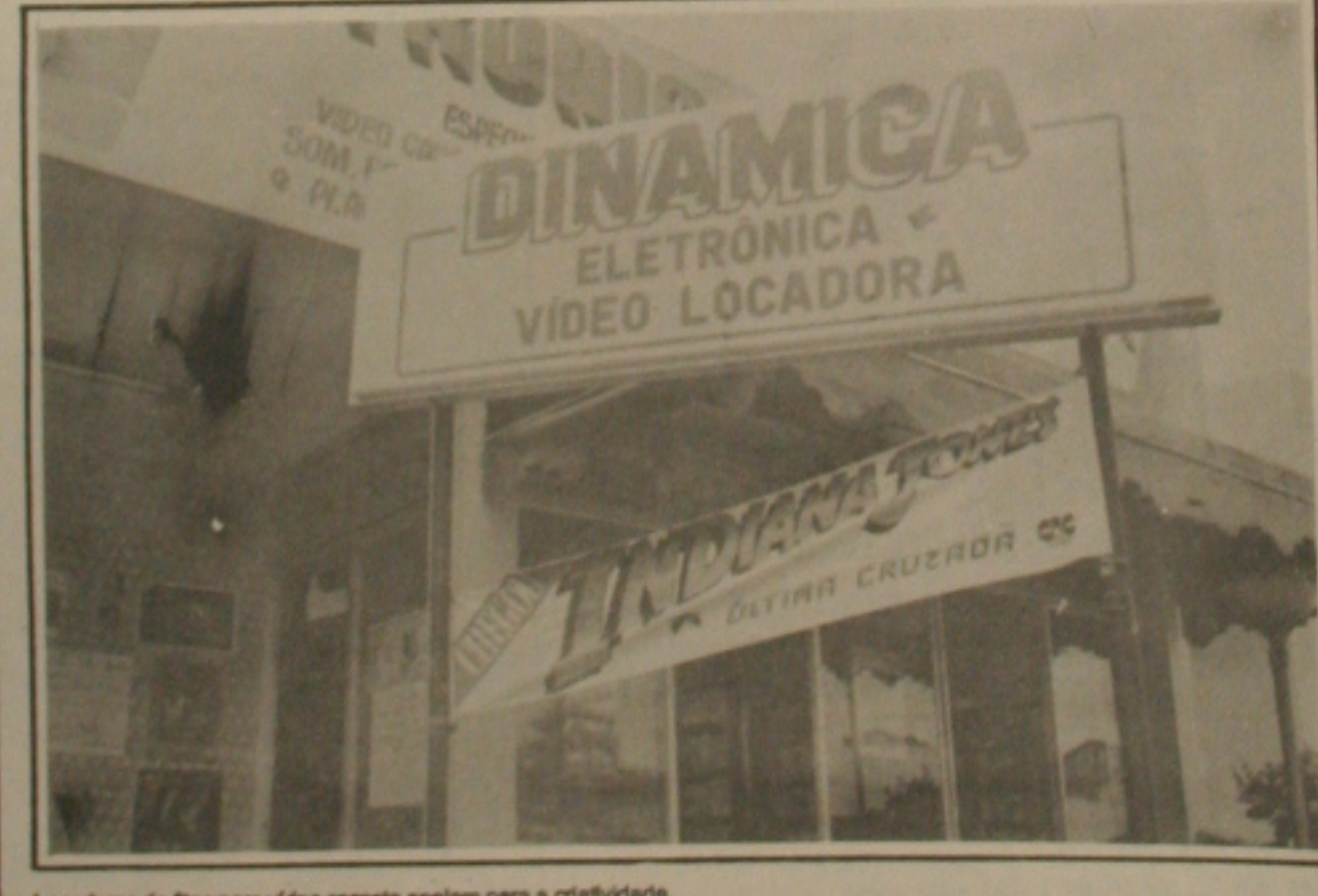
Locadoras de fitas para vídeo cassete apelam para a criatividade.