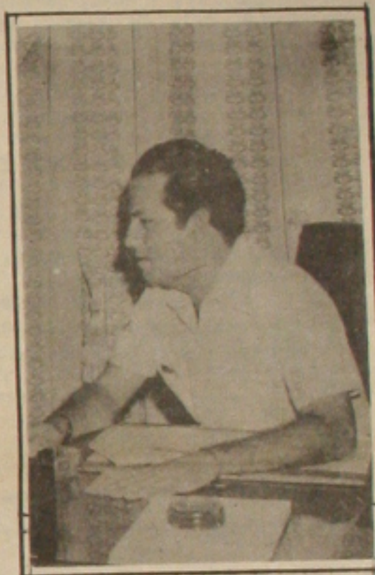
Senador Albano Franco

Ainda está indefinido o funcionamento do Centro de Tomografia Computadorizada Senador Albano Franco, do Hospital São José. É que o equipamento queimado ainda encontra-se na Siemens no Rio de Janeiro devendo chegar em Aracaju na próxima semana, segundo previsão da irmã Joana D'arc, diretora administrativa daquela Casa de Saúde.