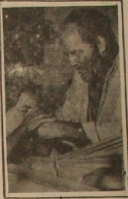
O velho do Pantanal salva Maria Marruá, mordida por uma cobra.

desejo que ela alimenta há anos. Ele resiste mas acaba concordando. Mais tarde, Irma diz que quer ficar com Leôncio. Ele fala que é uma loucura. Em seu quarto, Filó chora e acha que perdeu Leôncio de novo.