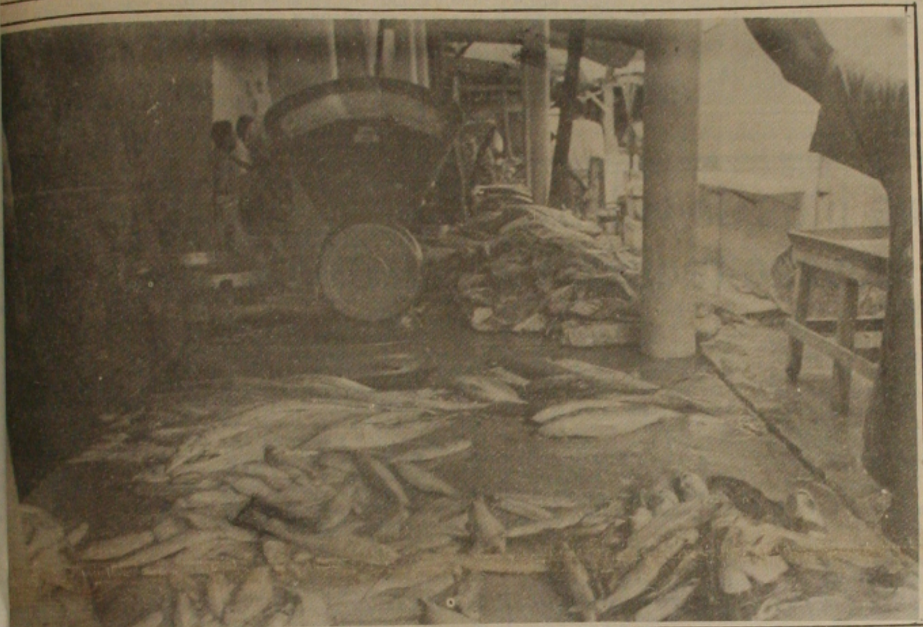
Peixe está sendo muito procurado nos mercados e postos de venda da Capital.

O presidente do Tribunal de Contas do Estado, Carlos Alberto Sobral, garantiu ontem que dentro de mais 15 dias terá condições de divulgar os nomes dos prefeitos que receberam recursos dos Governos Federal e Estadual, para obras, e aplicaram em suas contas pessoais, para levarem vantagem com a especulação financeira. Segundo Carlos Alberto, o Tribunal está esperando apenas que o Banco do Brasil e o Banese enviem os extratos de contas das Prefeituras Municipais, a fim de concluir a investigação.