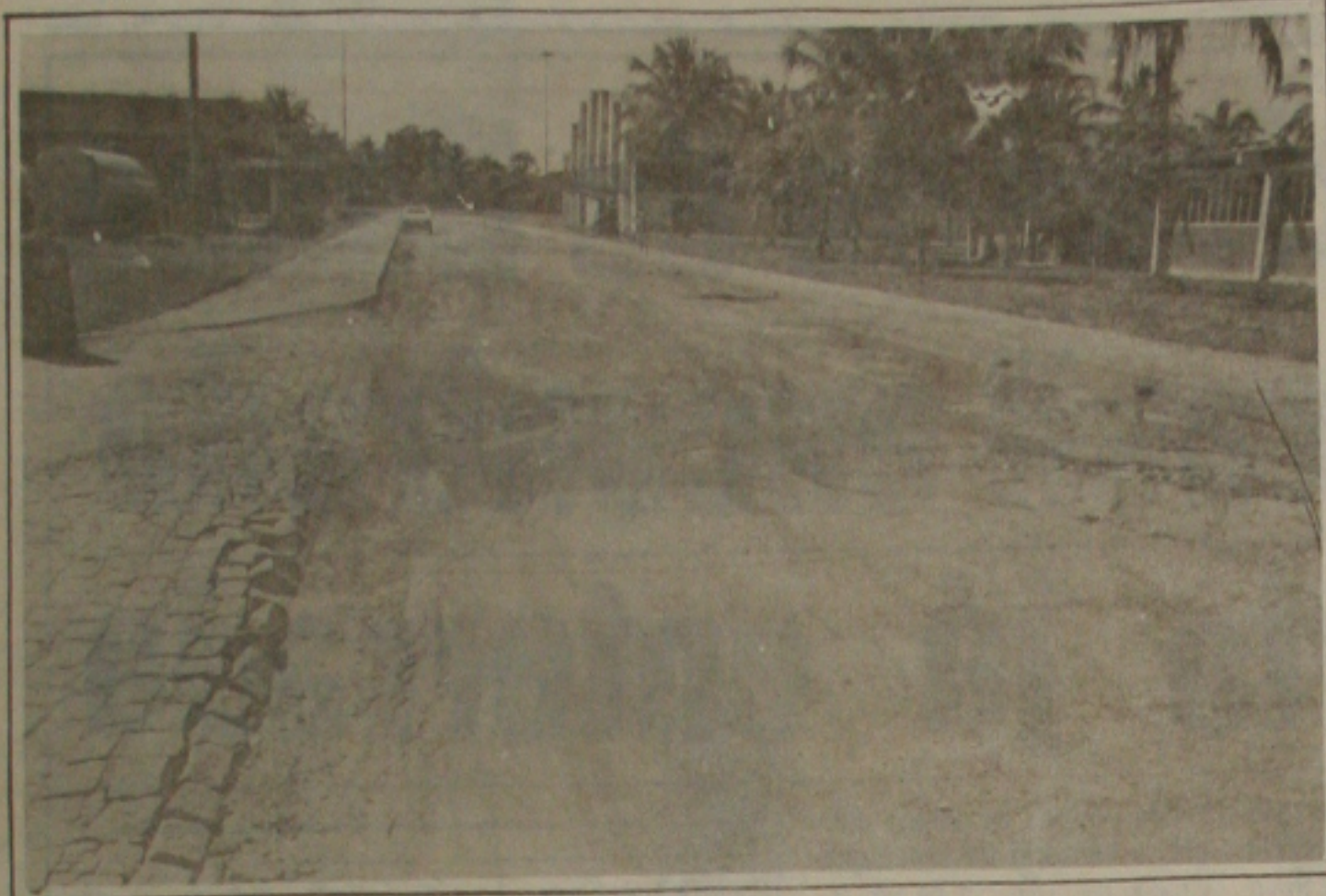
Malha viária da cidade universitária está em péssimas condições.

É constrangedora a situação da Universidade Federal de Sergipe que por falta de recursos financeiros se encontra em total estado de abandono. Um dos fatores mais preocupantes é o Restaurante Universitário que por falta de manutenção dos seus equipamentos, pode a qualquer momento acontecer uma explosão sem precedentes.