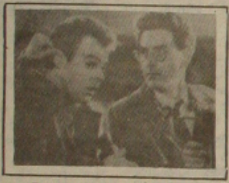
Domingo à tarde na Globo, "Os Caça-Fantasmas"