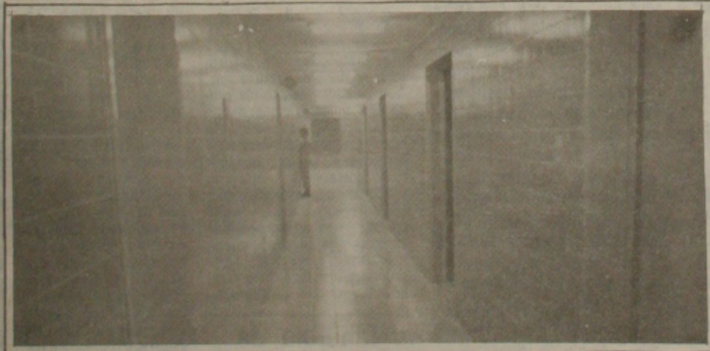
Com capacidade para atender mais de 350 pessoas por dia o novo Pronto-Socorro...

No futuro, a direção do Hospital de Cirurgia pretende aperfeiçoar a especialização nas áreas de cardiologia, neurocirurgia, traumatologia, pediatria e urologia além de cirurgia em geral com mais sofisticados equipamentos do Norte Nordeste. Dentro em breve deverá chegar no HC o equipamento para Cineangiografia que serve para cateterismo cardíaco que reduz consideravelmente o uso de contrastes radiológicos. Este equipamento sairá de Alemanha devendo chegar em Sergipe no mês de julho e custou as cofres do Hospital o montante de US$ 2 milhões.