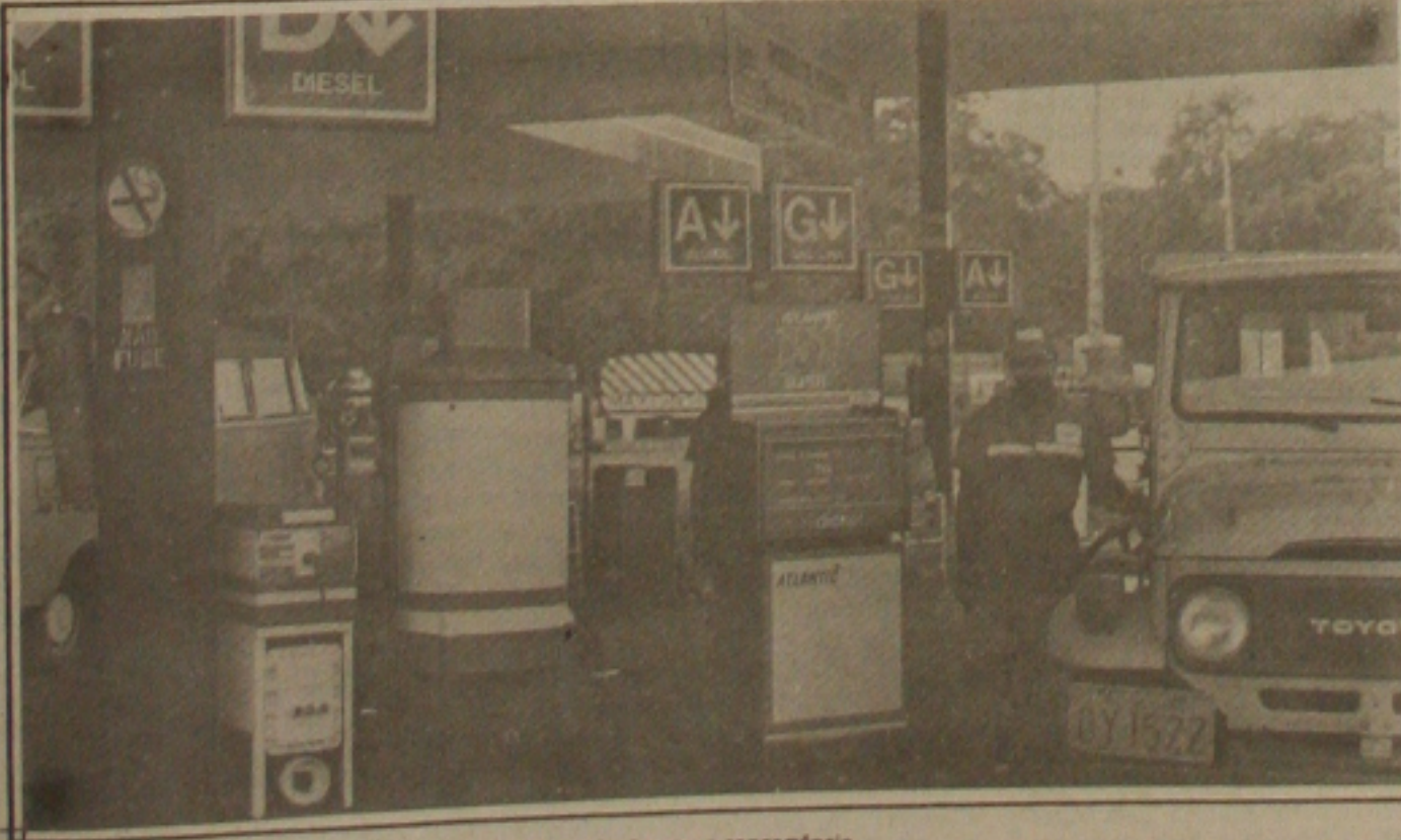
A liberação dos preços dos combustíveis vai promover redução com a concorrência.

realizam assembleia geral, a partir das 8 horas, na sede do Cotinguiba. Os trabalhadores querem reposição salarial de 211 por cento, segundo eles, o acumulado com o Plano Collor. Exigem também a estabilidade no emprego e estão dispostos a cruzar os braços se as reivindicações não forem atendidas. (Páginas 1 e 3-B).