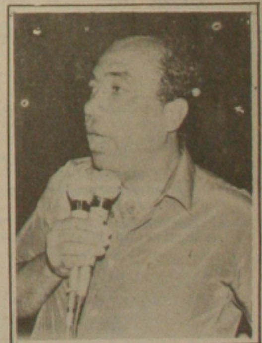
Ex-ministro quer a integração total no desenvolvimento

O ex-ministro, ex-governador sergipano e ex-prefeito de Aracaju diz que soma a experiência administrativa que acumulou na passagem por esses cargos públicos com sua disposição de lutar por