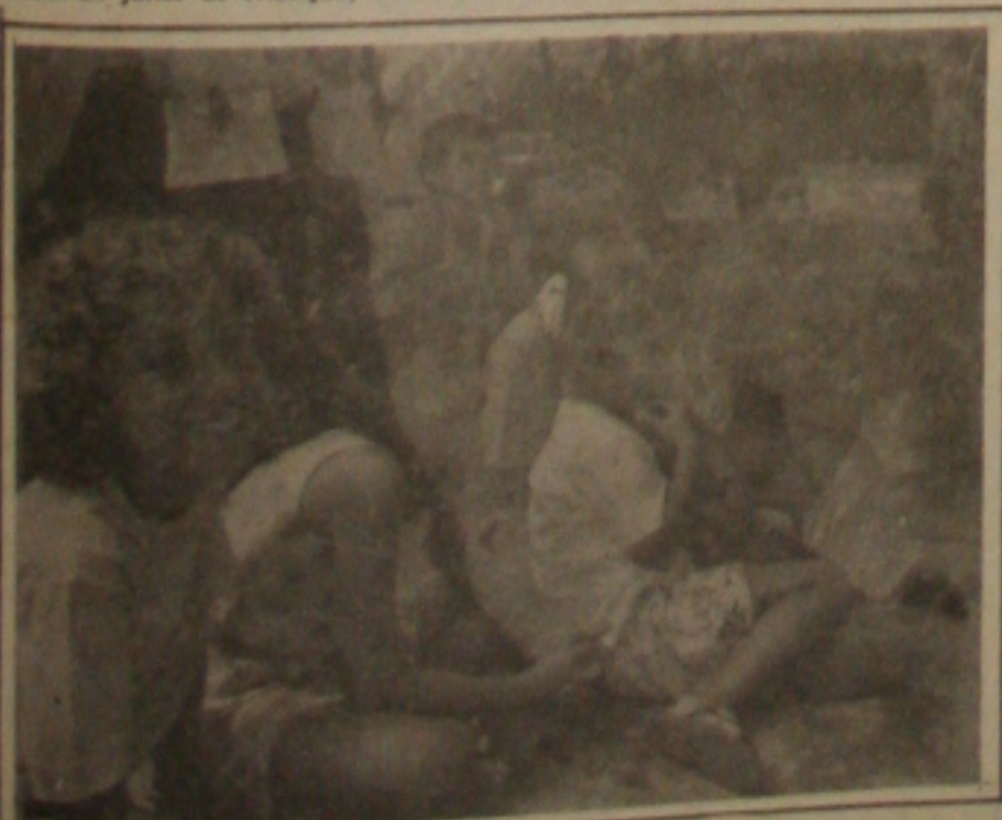
Crianças participam de curso de férias promovido pelo Cultart.