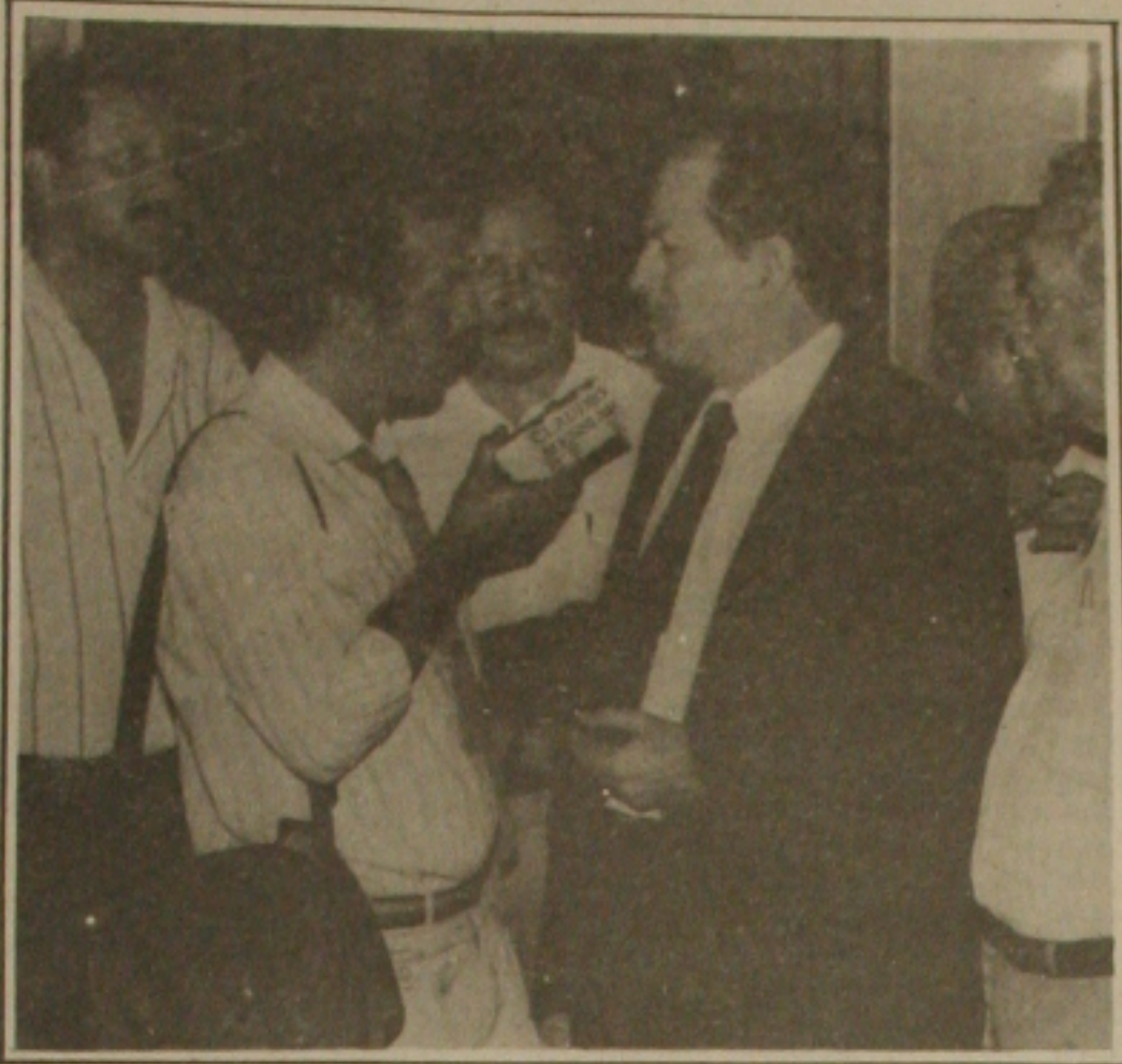
O senador quer os jovens preparados para o mercado de trabalho

Continuando seu trabalho incansável pelo crescimento sócio-econômico de Sergipe sem distinção de região, o senador Albano Franco revelou ontem que já pediu ao governador Antonio Carlos Valadares uma área no Conjunto Marcos Freire, para a ampliação de uma escola profissionalizante, que venha a atender as necessidades das indústrias, sobretudo, próximas aquele núcleo residencial e, com isso, preparar jovens para o ingresso no mercado de trabalho.