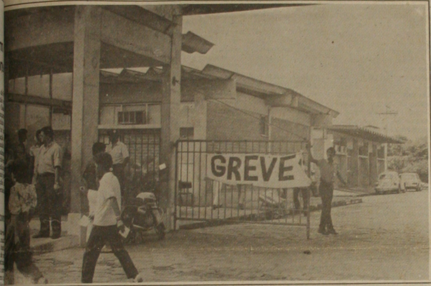
da greve da Cohab, os trabalhadores bateram o ponto e depois foram se concentrar na porta da empresa.

Das duas horas diárias de programa de propaganda eleitoral gratuita do Tribunal Regional Eleitoral, que começa no rádio e na televisão a partir do próximo dia 3, os dez partidos que integram a coligação União por Sergipe, vão dispor de mais de dois terços do tempo, ou seja, dos 120 minutos, eles terão 92 minutos e 52 segundos por dia. Foi o que ficou definido ontem pelo presidente do TRE, Aloisio Abreu, ao estabelecer a divisão do tempo da propaganda gratuita de acordo com o critério de proporcionalidade de representação de cada partido.