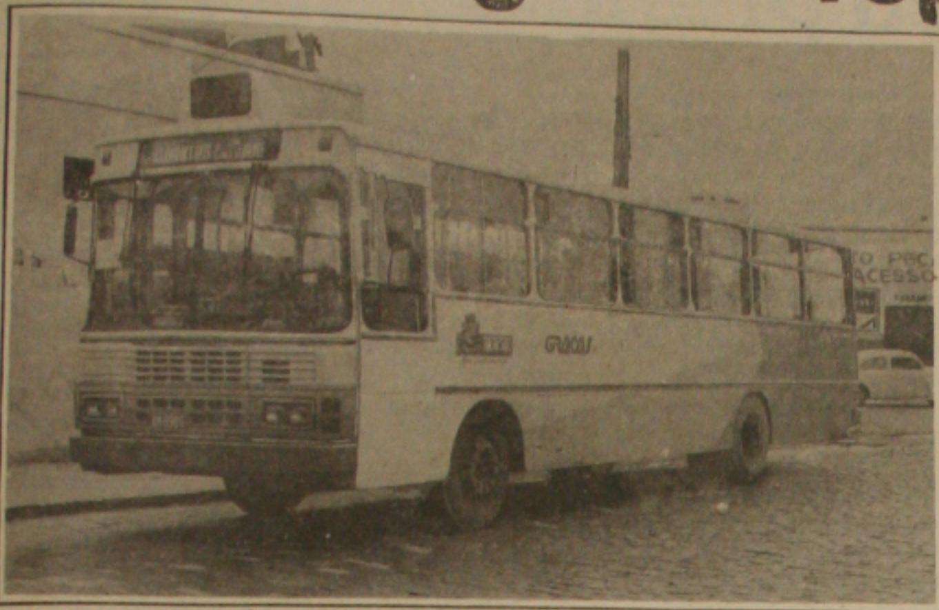
Se não houver contra-proposta, os ônibus podem parar na próxima segunda-feira a zero hora.