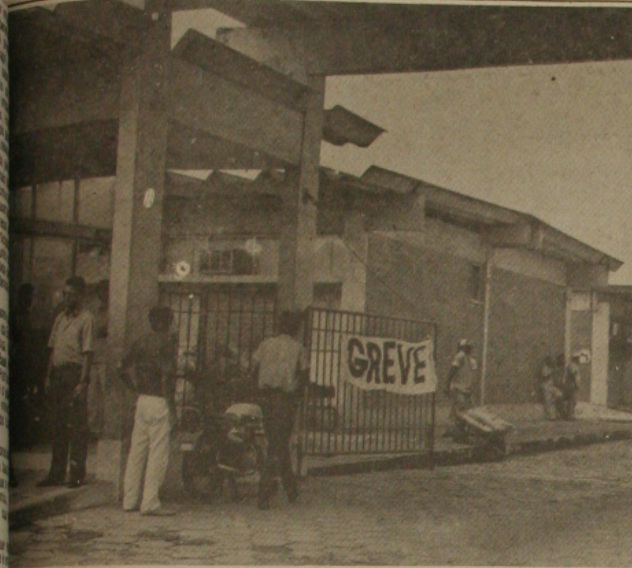
Funcionários da Cohab decretam greve por melhoria salarial.