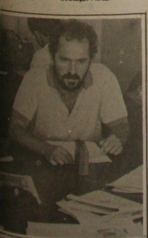
Senador vai pedir votos de trabalhadores.

Durante o dia de hoje, os candidatos majoritários da Frente Sergipe Popular visitam as Agências Bancárias da periferia da capital e comparecem ao Campus Universitário onde conversarão com os estudantes que participam do Encontro Nacional de Estudantes de Educação Física.