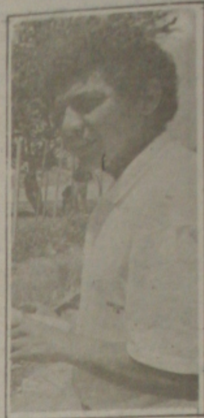
Ferreira é comunicação total

Este é, em rápidas pinceladas, o quadro que esta CAMARIN oferece aos seus leitores no sentido