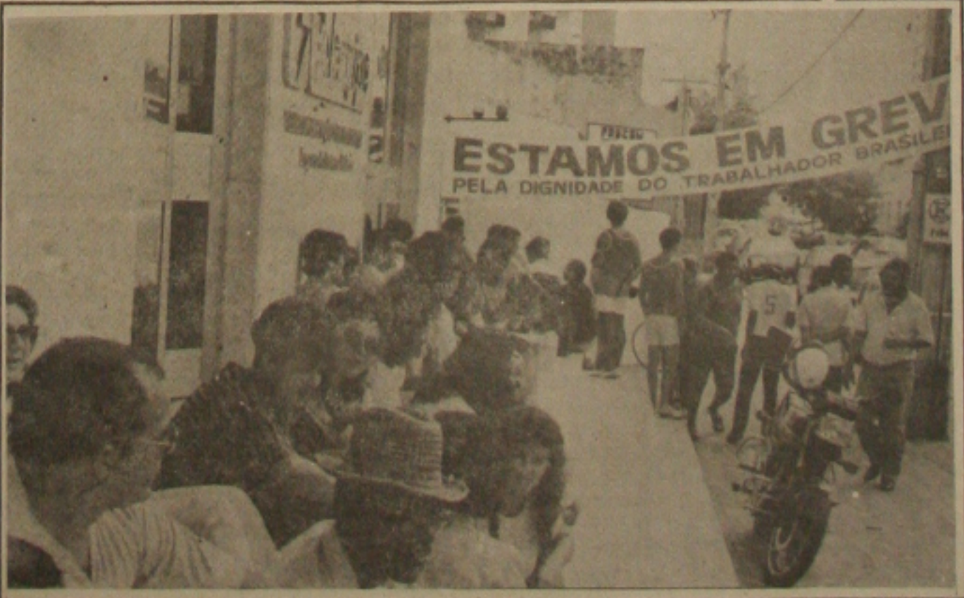
Telefônicos entram no segundo dia de paralisação em Sergipe.

Como a Telegipe não aceitou o acordo, a categoria está aguardando em greve o julgamento do dissídio coletivo que acontecerá hoje.