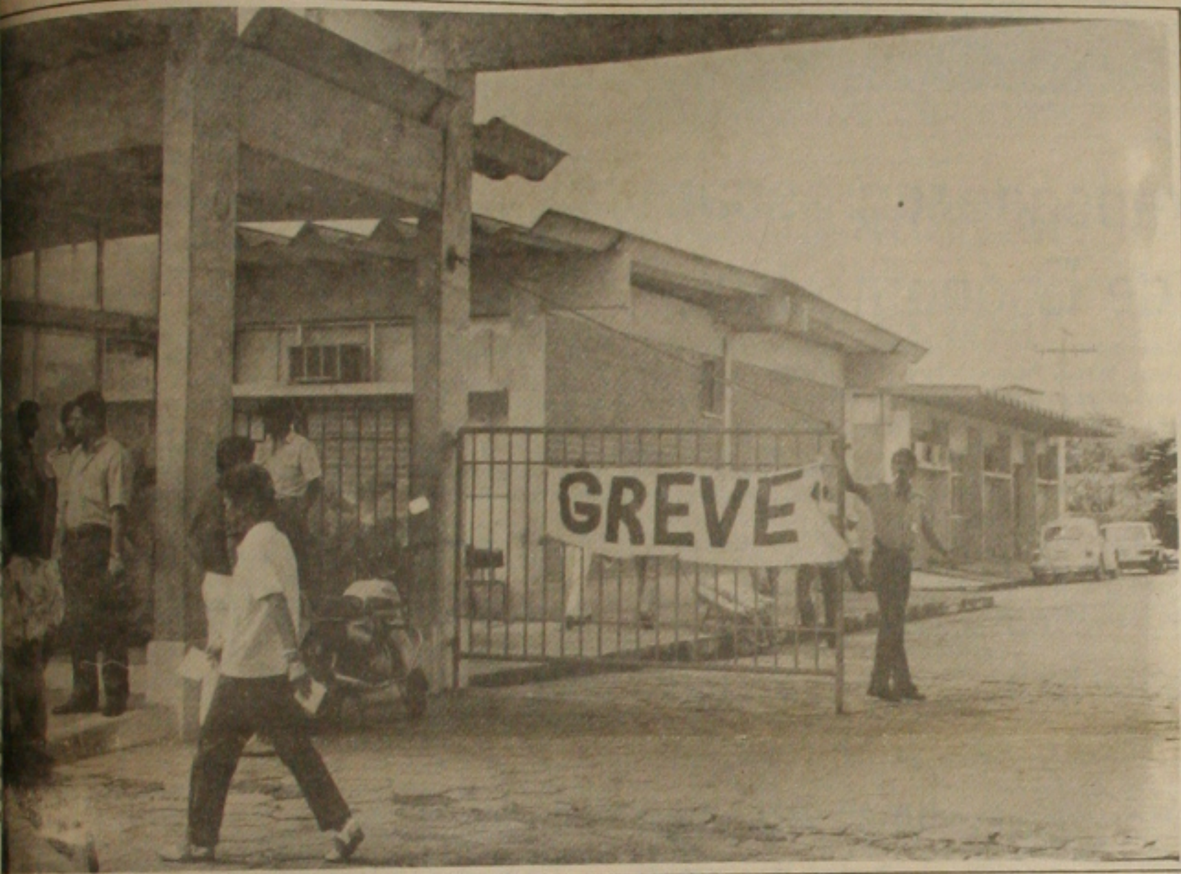
Funcionários da Cohab realizam assembleia geral e decidem pela greve (Foto/Arquivo).

Os funcionários da Companhia de Habitação Popular de Sergipe, (Cohab), decidiram ontem durante assembleia geral realizada no auditório da Companhia entrar em greve por tempo indeterminado até que a diretoria da Cohab decida atender as reivindicações. Na avaliação a diretoria da Associação dos Funcionários, (AFC), as negociações estão sendo dificultadas pelo secretário de Trabalho e Ação Social, Leô Filho, que insiste em não conceder o resíduo do plano verão, implantado no Governo do ex-presidente José Sarney, que equivale a 3,6 salários de cada trabalhador. Como contra proposta para repor as perdas salariais detectadas com o Plano Brasil Novo avaliadas em mais de 200 por cento, a direção da Cohab assegurou um reajuste de 25 por cento para o mês de agosto, 5 por cento em setembro e 5 por cento em outubro deixando para discutir outros índices de reposição no mês da data-base, em novembro. O clima foi tenso na assembleia geral e os funcionários decidiram então rejeitar a contra proposta por considerarem insignificante. Conseqüentemente, conforme estava previsto desde