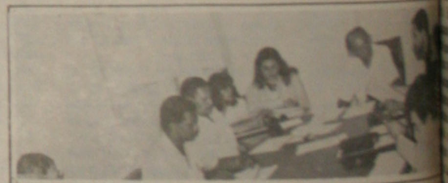
O Conselho de Defesa do Meio Ambiente analisou a questão do aterro da Praia 13 de Julho.