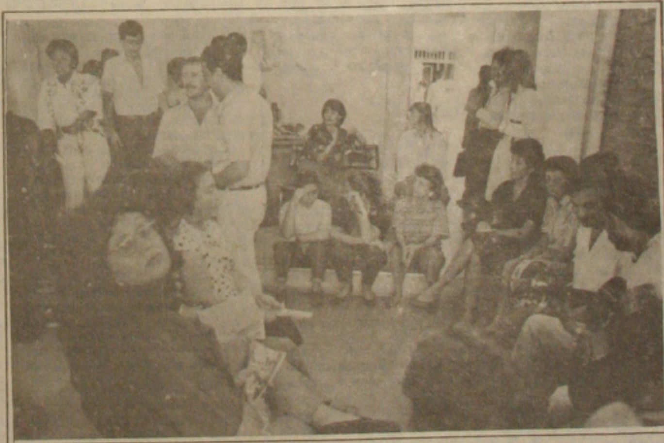
Na assembleia de ontem, os servidores da Cohab não aceitaram a contraproposta e aprovaram a greve.