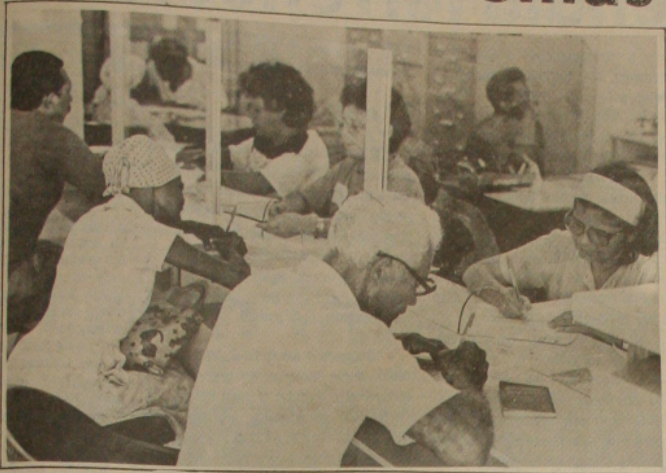
Os aposentados e pensionistas terão seus problemas sendo debatidos amanhã, no III Encontro, no auditório do Banese.