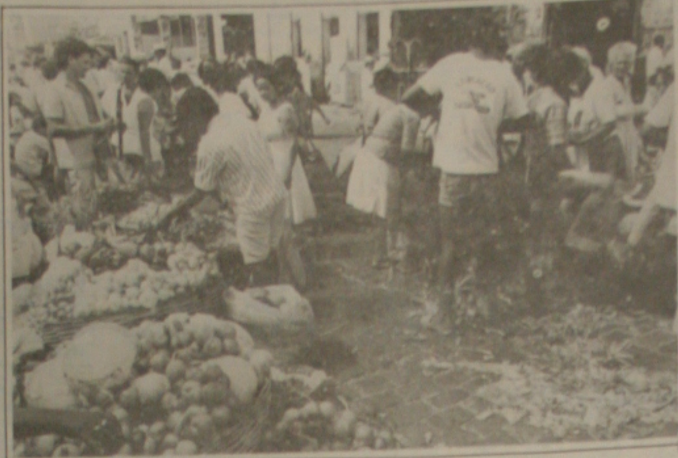
Programa de pesquisa em hortaliças vai ser ampliado em Sergipe.

No dia 20 de agosto o magnífico reitor deverá estar de volta ao Brasil e, segundo espera ele, trazendo convênios envolvendo os campos do Ensino, Pesquisa e Extensão.