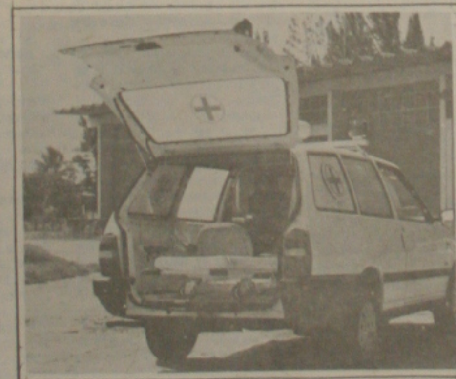
Maternidade mantida pela UFS recebe ambulância comprada com recursos próprios da Universidade.