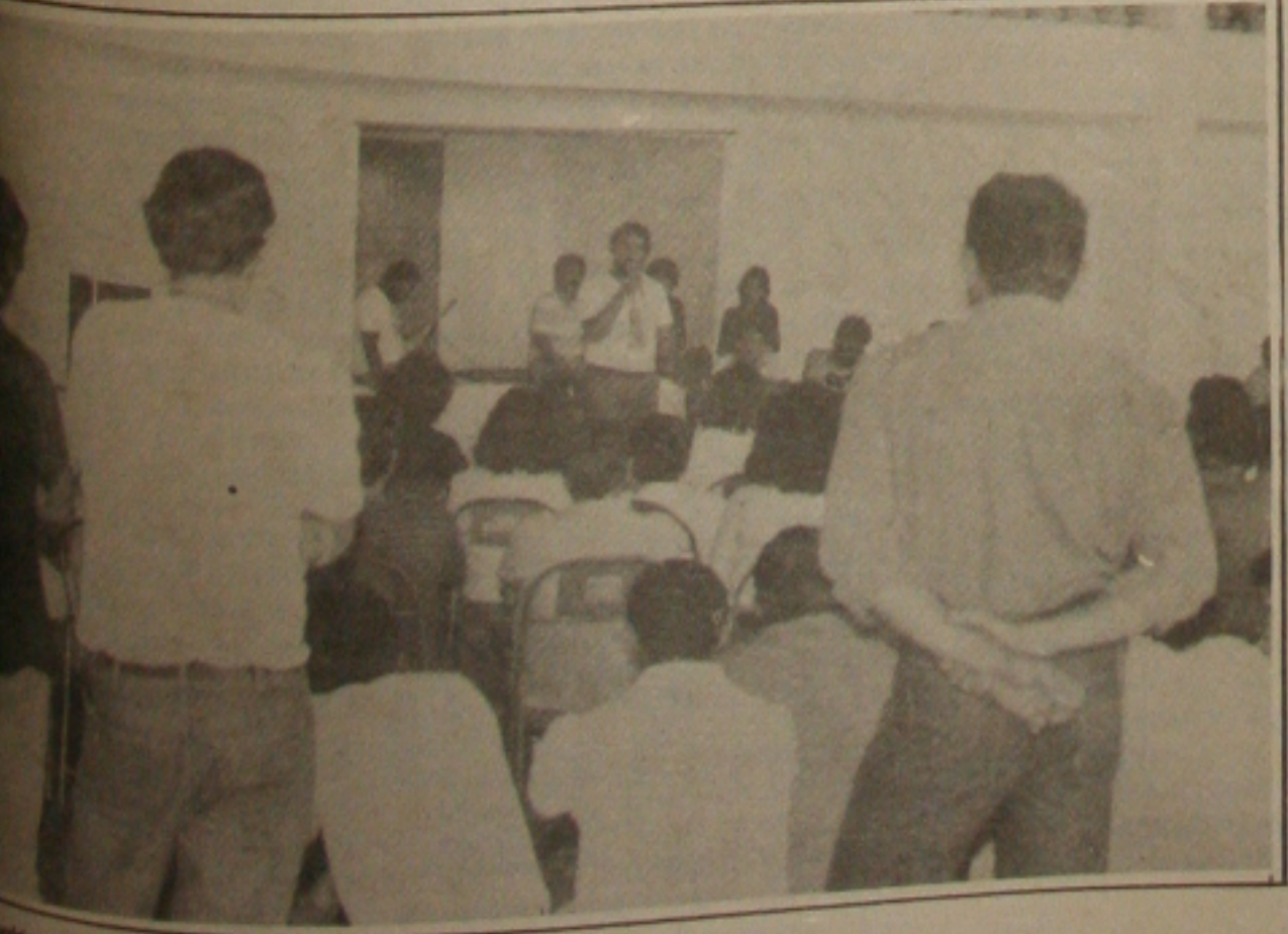
Funcionários do Deso fazem assembleia geral e não decretam greve.

mobilizar a categoria porque todos estão coesos e conscientes das perdas salariais e da irredutibilidade dos padrões que se negam a negociar", ressaltou o sindicalista. OS CONTATOS Apesar de manterem contatos com a classe patronal, as negociações não surtiram nenhum efeito positivo. Os patrões, segundo Valdir Argolo, ofereceram apenas um índice de 50 por cento de aumento real e não reconheceram as perdas do plano Brasil Novo implantado pelo presidente Collor de Mello. Representantes da classe trabalhadora e patrões tentaram chegar na Delegacia Regional do Trabalho. Como a contra proposta dos empresários foi insignificante haja vista a perda do plano Brasil Novo que atingiu cerca de 220 por cento, a classe trabalhadora decidiram na sede da DRT aprovar o indicativo de greve para o dia 16, caso não haja um entendimento entre as partes.