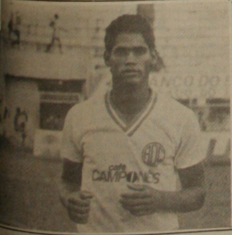
O capitão proletário hoje no Batistão de contrato novo.