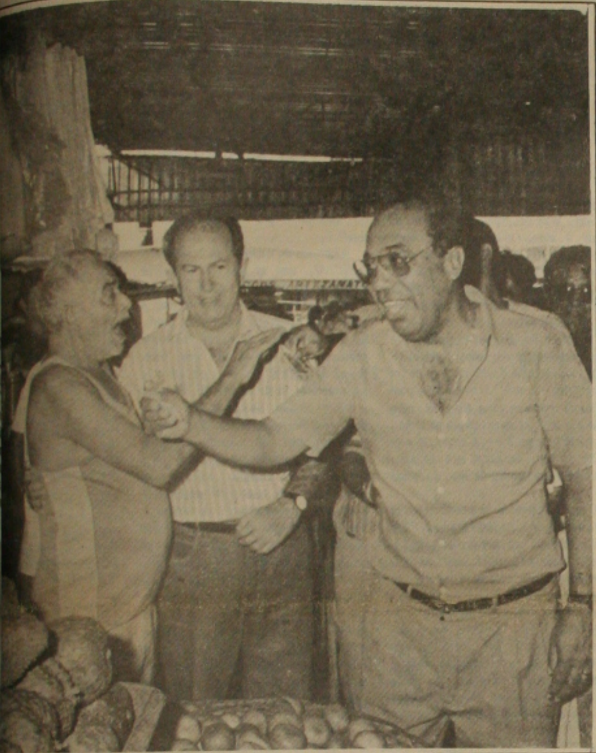
Um candidato ao mercado municipal pedir votos aos feirantes e consumidores na campanha do corpo-a-corpo eleitoral.