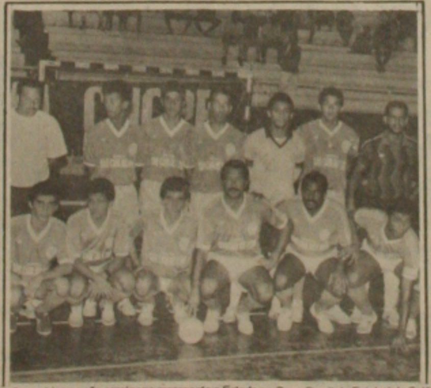
Confiança bicampeão sergipano representa o Estado na Copa Brasil de Futebol de Salão.

como grandes atrações os atletas Edinho e Manoel convocados recentemente para a Seleção Brasileira, também são destaques da Votorantim o ala Bigode, o pivô Rabico e o atleta Nailson adquirido junto a equipe da Associação Desportiva Confiança. No dia 25 o vice-campeão brasileiro atuará na cidade de Itabaiana diante do Independente.