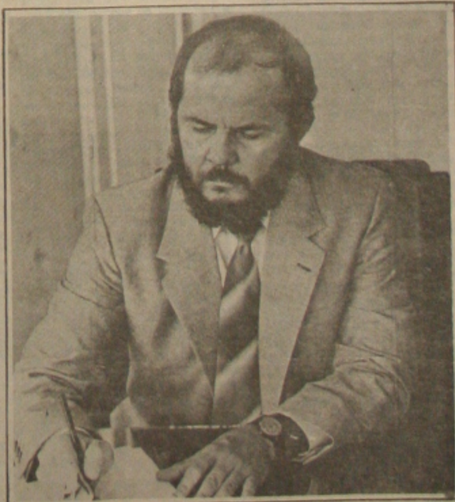
Secretário da Agricultura, Paulo Viana

sobre o Nordeste, serão discutidas diversas alternativas, entre as quais a criação de frentes de trabalho, destinação de recursos creditícios como o Fundo Constitucional do Nordeste, o papel da Sudene e demais organismos de apoio da esfera federal, fomento à produção agropecuária, através da produção de mudas e sementes, assim como o fornecimento de matrizes e reprodutores para ampliar o programa de fomento a ovinocaprinocultura. Outro ponto de discussão - disse o secretário - será sobre a definição de nova estratégia de ação para o combate a praga do Bicuado que assola a região nordestina, concluiu.