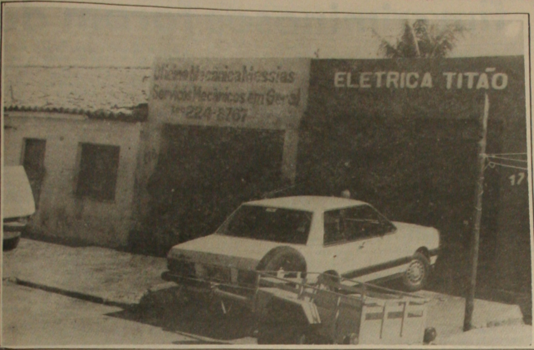
Oficinas mecânicas aumentam o movimento em quase 80%, em Aracaju.

Nos últimos 60 dias aumentou significativamente o movimento nas oficinas mecânicas da capital sergipana e nas casas de alinhamento e balanceamento de pneus. A garantia é dos donos e gerentes destes estabelecimentos comerciais entrevistados pela reportagem da GAZETA DE SERGIPE, na manhã de ontem.