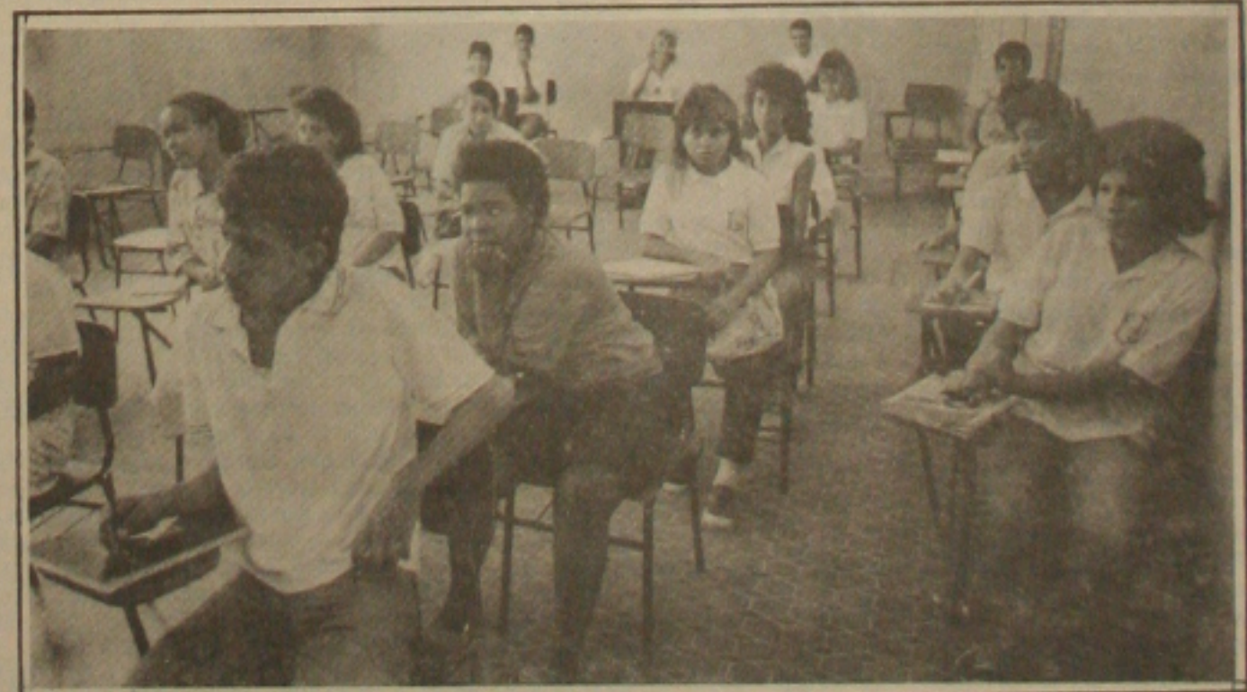
Educação: o professor também assume a responsabilidade pela queda do nível do ensino.

forma pela qual se consegue mudanças de comportamentos através da educação escolar. Em reportagem produzida pela jornalista Cássia Santana, professores sergipanos apresentaram suas avaliações sobre a queda do nível do ensino a partir da responsabilidade do próprio professor. (Página 3-B)