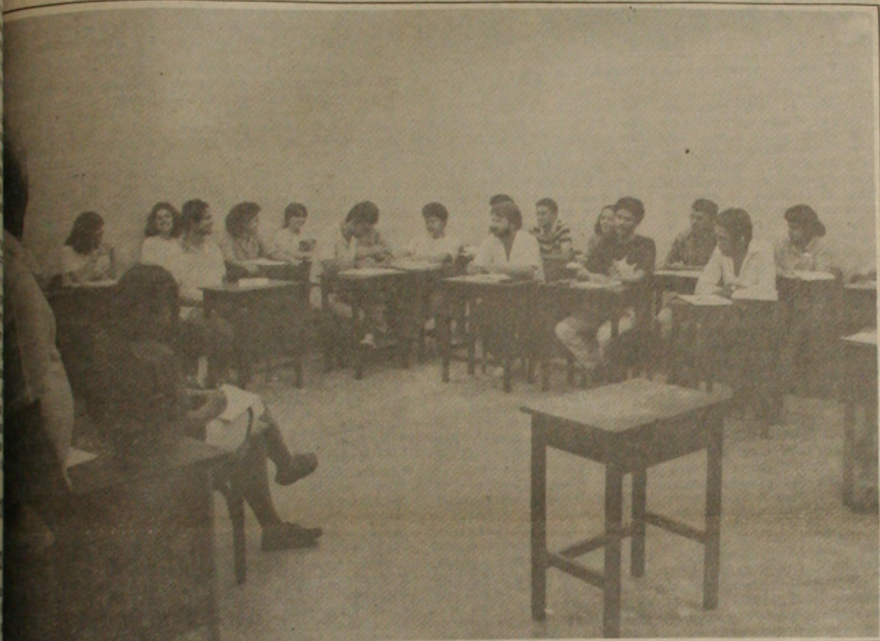
Novo método de ensino na Universidade Federal de Sergipe.