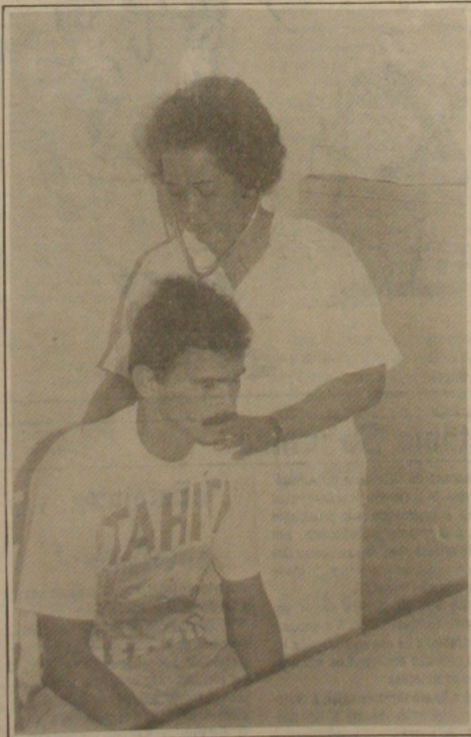
Poucos clientes ontem nos postos de saúde do Estado.

Foi assim que os fatos aconteceram e foi isso que levou a GAZETA DE SERGIPE a publicar a matéria na edição de ontem. No mais, que deve estar faltando também a Jackson é "raça e coragem" para manter a prática fiel ao seu discurso.