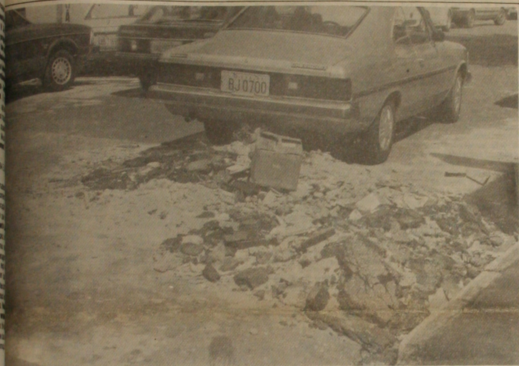
Da ação da Prefeitura, o Deaso está contribuindo para aumentar o número de buracos nas ruas de Aracaju. (Página - 3-B).

Um soldado morreu degolado por um único golpe de foice e 72 pessoas ficaram feridas - 47 colonos e 25 soldados - sendo que seis em estado grave, foram as principais baixas do violento confronto ocorrido ontem, durante pouco mais de 5 minutos, no centro de Porto Alegre, entre cerca de 600 trabalhadores sem terras e 220 soldados militares do policiamento da capital gaúcha. Os incidentes aconteceram ontem, por volta das 11:35 horas, no centro de Porto Alegre, na Praça da Matriz, onde os quase 600 colonos estavam acampados desde a madrugada. Parlamentares negociavam com assessores do Governo do Estado a retirada dos sem terras, quando o coronel Jair Portele, comandante do Policiamento da Capital, através de um megafone, deu ultimato aos colonos para que desocupassem a praça. A área começou a ser invadida pelos 220 homens da Brigada Militar armados de fuzis, baio-