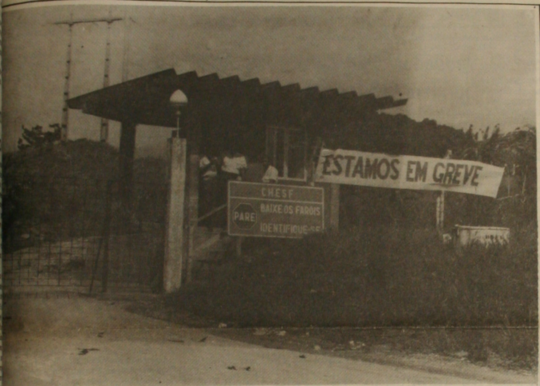
Trabalhadores da Chesf permanecem com as atividades paralisadas.

Os 72 funcionários da Companhia Hidrelétrica do São Francisco, (Chesf), em Sergipe permanecem de braços cruzados em adesão ao movimento deflagrado nacionalmente pelos eletricitários que desenvolvem atividades nas empresas federais. São sete companhias paralisadas em todo o País haja vista o posicionamento do Governo Federal que não procurou atender as reivindicações da classe trabalhadora.