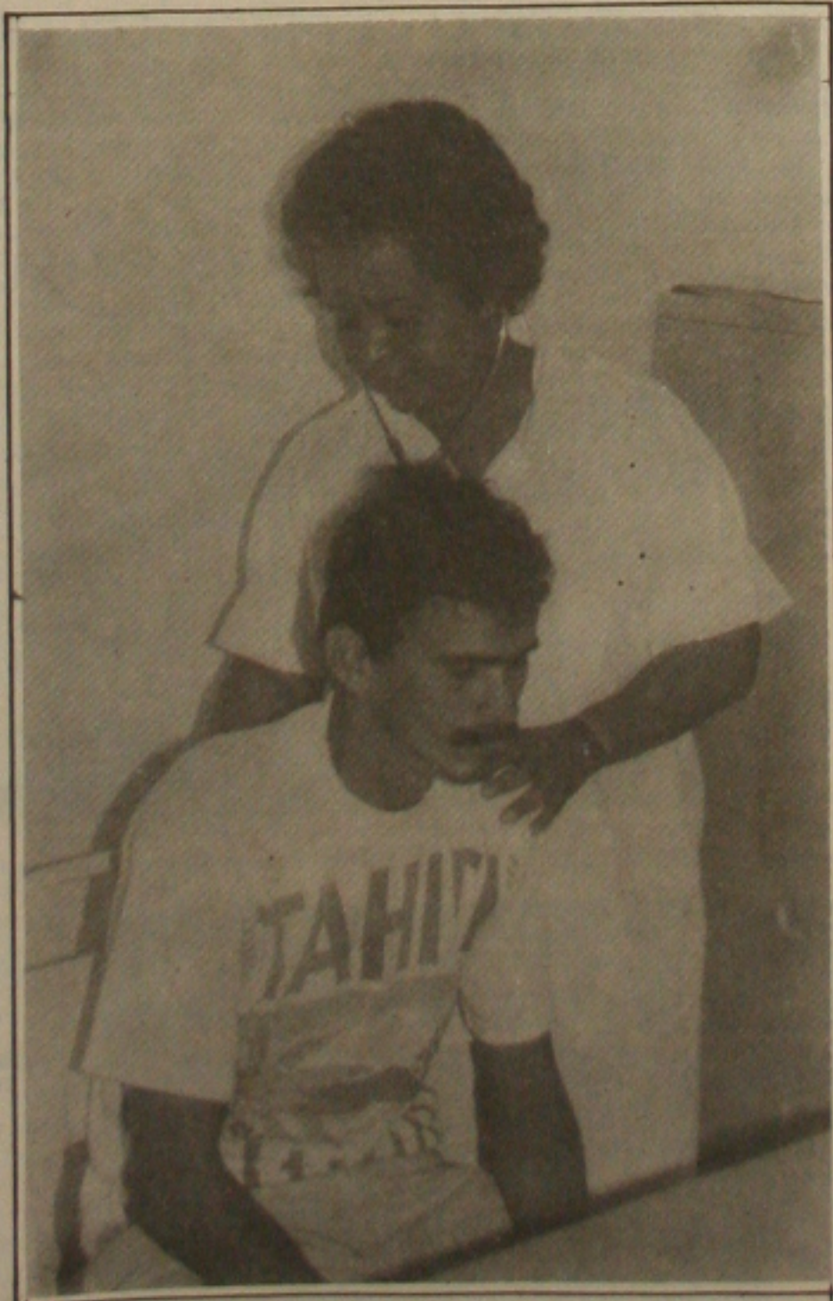
Médicos retomam às atividades após seis meses de paralisação.

ente para cobrir as perdas já detectadas com o plano de estabilização econômica do Governo federal que atinge a casa superior aos 200 pontos percentuais.