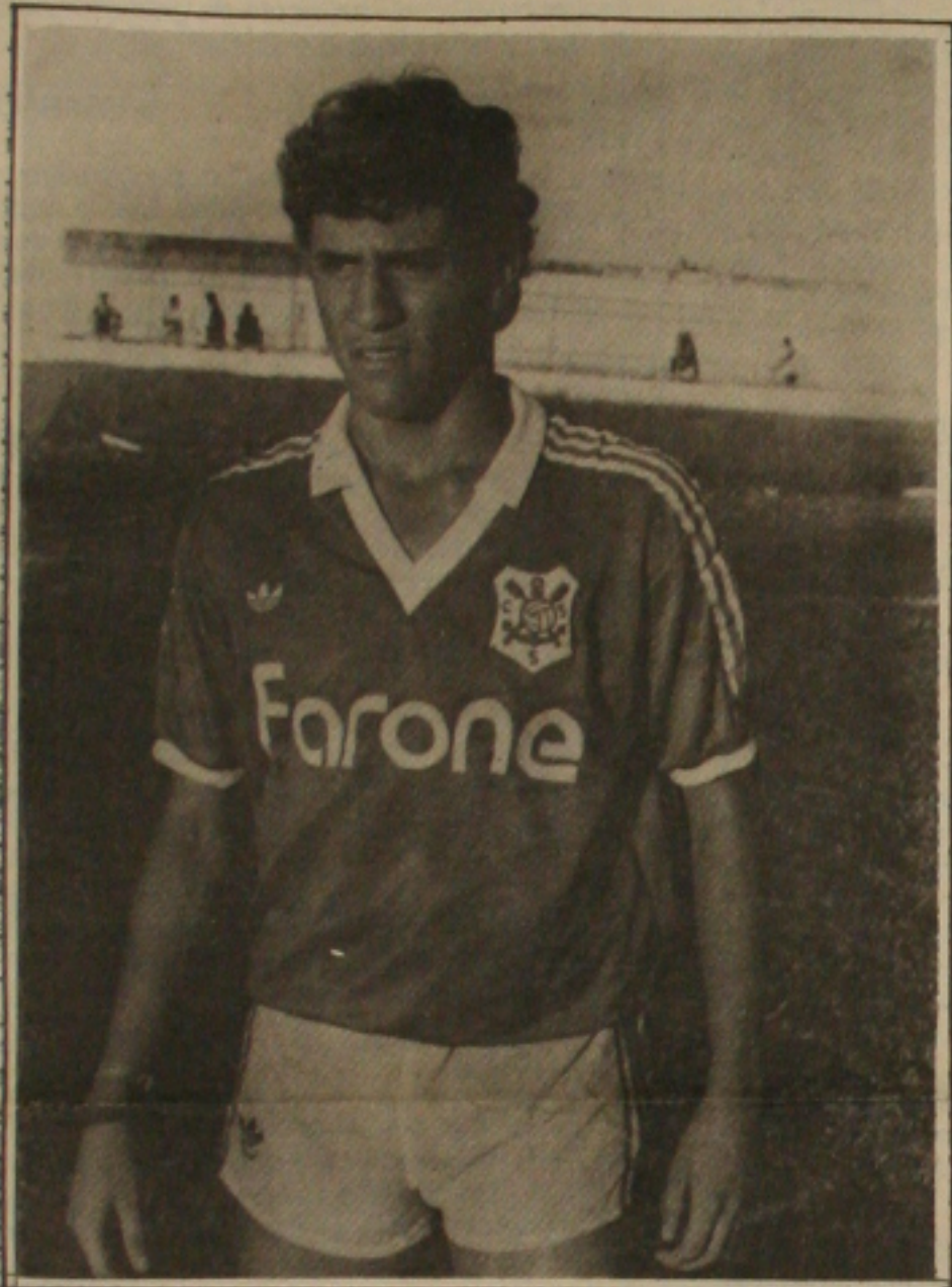
Atleta pivô de mais um problema na Justiça Desportiva.