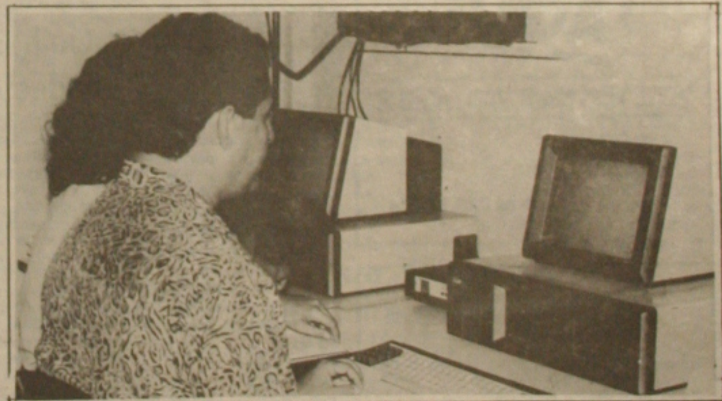
A Prefeitura de Aracaju se informatizou para melhor servir a comunidade aracajuana.