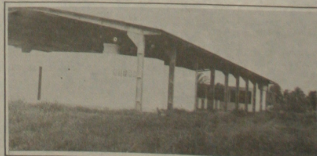
Mercado Setorial de Areia Branca só poderá funcionar com ajuda da população.