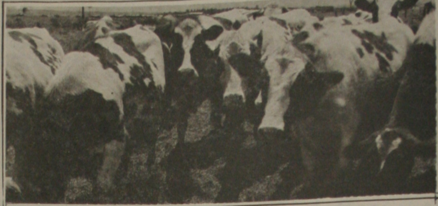
Cabeças de gado roubadas são recuperadas pela Polícia.

USINA VASSOURAS S.A. CGC 13.003.959/0001-22 ASSEMBLÉIAS GERAIS ORDINÁRIA E EXTRAORDINÁRIA