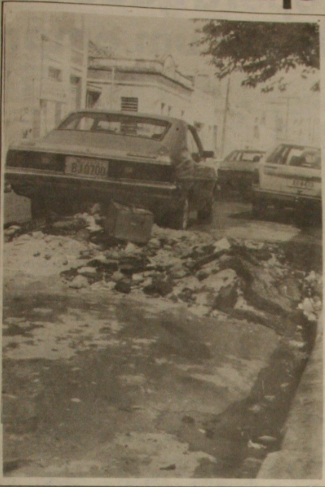
Enquanto a PMA e o Deso brigam pelos estragos nas ruas, o único prejudicado é o povo, que paga os impostos.

Além das intensas chuvas de inverno que vem caindo na capital sergipana provocando inúmeros buracos em todas as artérias, outro sério contribuinte para a proliferação desses estragos é a Companhia de Saneamento de Sergipe (Deso) - responsável pela distribuição de água e conservação de esgoto da cidade -, conforme declarações dos aracajuanos.