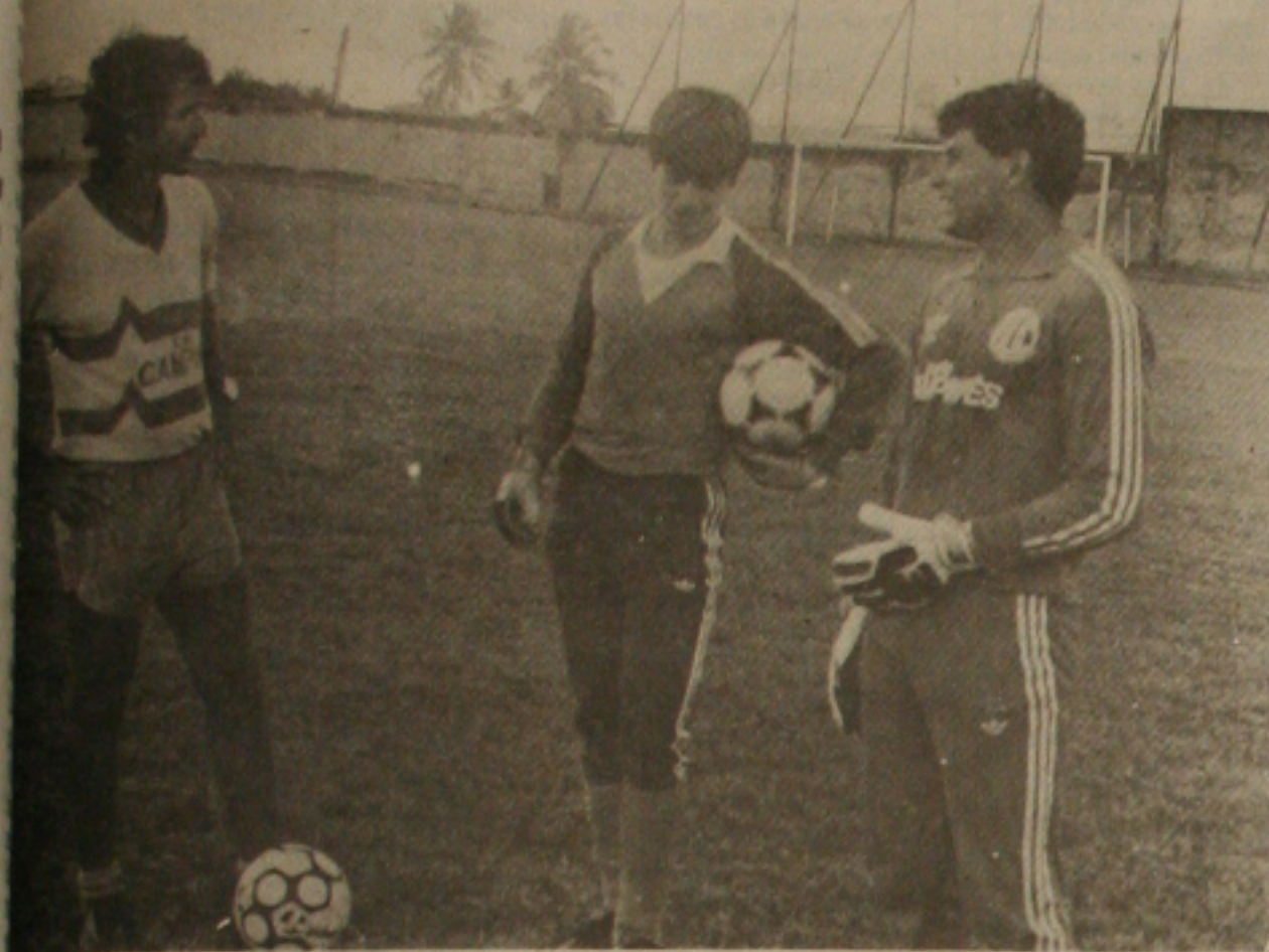
Chico discutiu com Ailton e pode ser dispensado do Confiança.