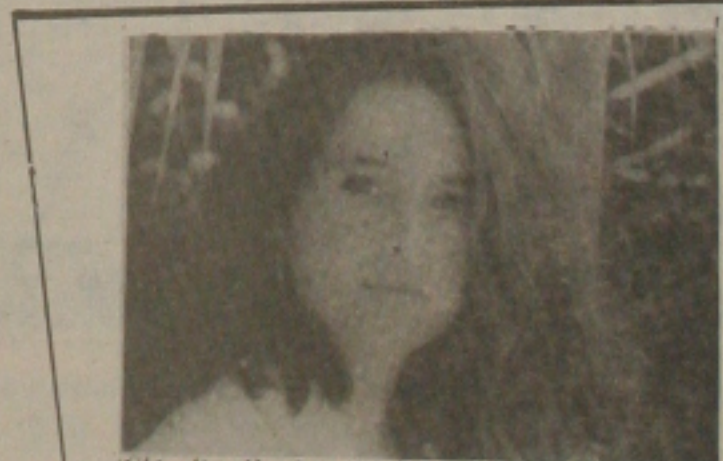
Cláudia Abreu grávida mais uma vez

Natália Thimberg foi para o "Pantanal". Grava cenas de sua Mariana em terras de José Leôncio (Claudio Marzo). Como é tempo de chuvas na região, a atriz não tem previsão de quando retorna ao Rio. "Vai depender da vontade de São Pedro. Só dá para gravar em dias de sol. Mas como a atriz adora o Pantanal ela viajou tranqüila.