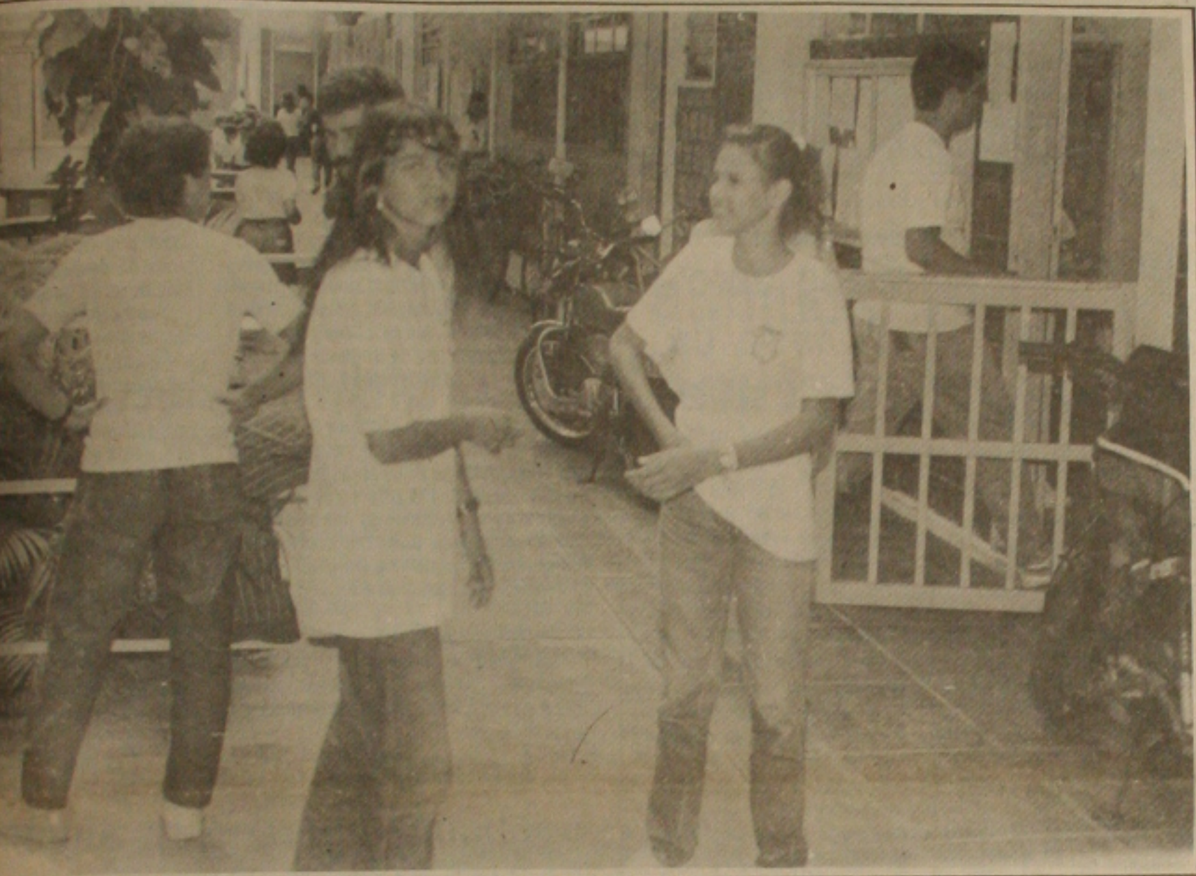
Professores paralisam suas atividades até o próximo dia 20.

As escolas da rede particular de ensino estarão com suas atividades paralisadas a partir de hoje. Desta vez não são os professores que estão em greve, mas os próprios diretores que decidiram advertir o ministro da Educação, Carlos Chiarelli, que insiste em defender o congelamento das mensalidades escolares que desde o mês de março que não sofrem qualquer reajuste.