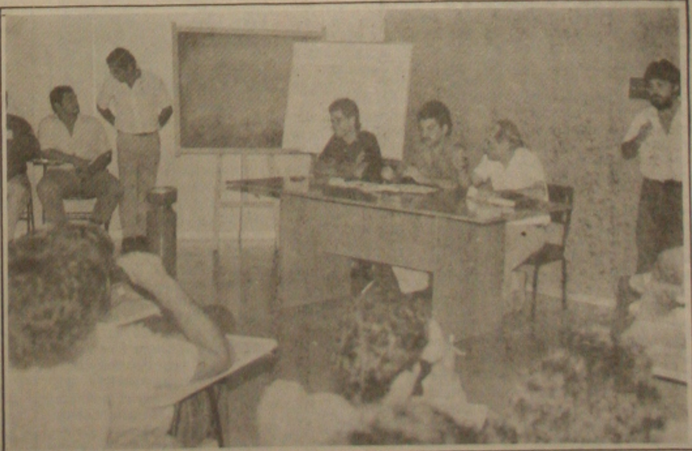
Funcionários da Prodase decidem aceitar contraproposta da empresa.

tes serão descontados em folha, sempre no patamar mensal de 20 por cento da dívida.