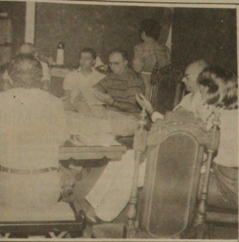
Centos de alunos de ensino deixam 100 mil alunos sem aulas.

Na sua avaliação, os dirigentes das escolas não devem em nenhuma hipótese esquecer dos salários da classe trabalhadora que estão congelados desde o mês de março. Segundo suas avaliações, a maioria dos professores com 8 horas diárias percebem um salário que atinge no máximo o valor de dois Pisos Nacionais de Salários. "Isto é um absurdo. Deve ser revisado e nós estamos seriamente preocupados."