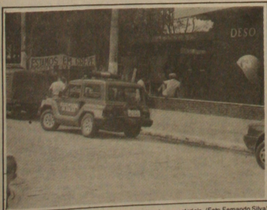
Polícia Militar ocupa instalações do Deso para evitar danos materiais.