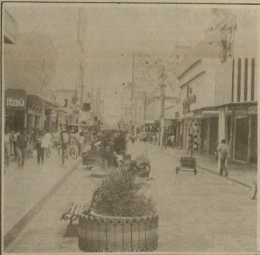
Abertura do comércio aos domingos pode gerar mais empregos.

Essa questão vem sendo tratada pelo ministro do Trabalho e Previdência Social, Antonio Rogério Magri, há pelo menos, um mês. Uma comitiva de representantes de confederações estiveram discutindo o assunto para reforçar a antiga reivindicação desse setor.