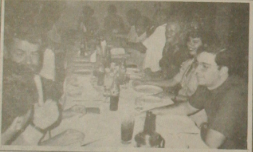
Na reunião-jantar compareceram muitos associados

O Skal Clube surgiu na Espanha. No Brasil, a sede nacional fica no Rio de Janeiro e possui em todas as capitais do país os clubes regionais. O objetivo primordial do Skal é o congregar entre os profissionais da hotelaria, agência de viagem, gerentes de companhias aéreas, transportadoras e restaurantes.