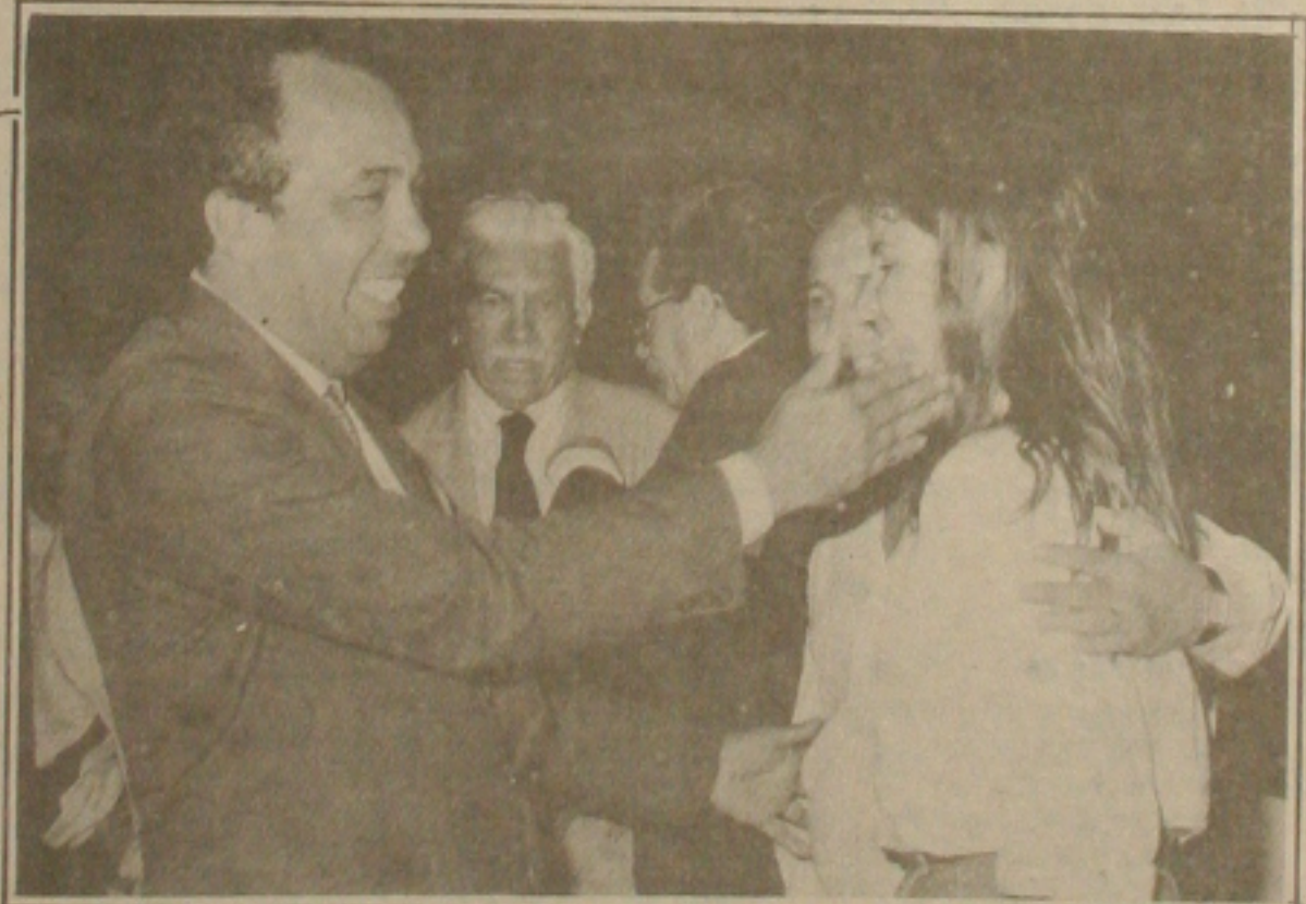
Mas que buchechinha bonita que ela temerária!

A poupança mineira engordou consideravelmente no fim do ano que passou. Quarenta comerciantes mineiros investiram o lucro obtido no ano de 1987 de Loteria Esportiva no boião netalino de Loteria Esportiva e ganharam todas as séries de Loteria do Natal. O lucro acumulado de Natal também foi para os comerciantes mineiros. "A venda de colchões para guardar dinheiro deve ter crescido tremendamente..."