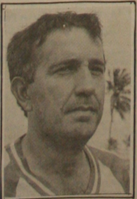
criados em laboratórios até que é demais. Nada melhor do que um dia atrás do outro...

Alguns ditos "desportistas" que estão mamando em órgãos públicos e que hoje isolam seus verdadeiros amigos, estão terminando seus relacionamentos. O cinismo dos "desportistas"