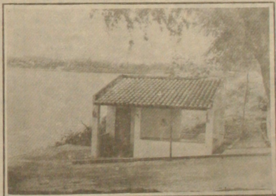
O Mosqueiro passa a ser procurado por aqueles que preferem a beleza da natureza.