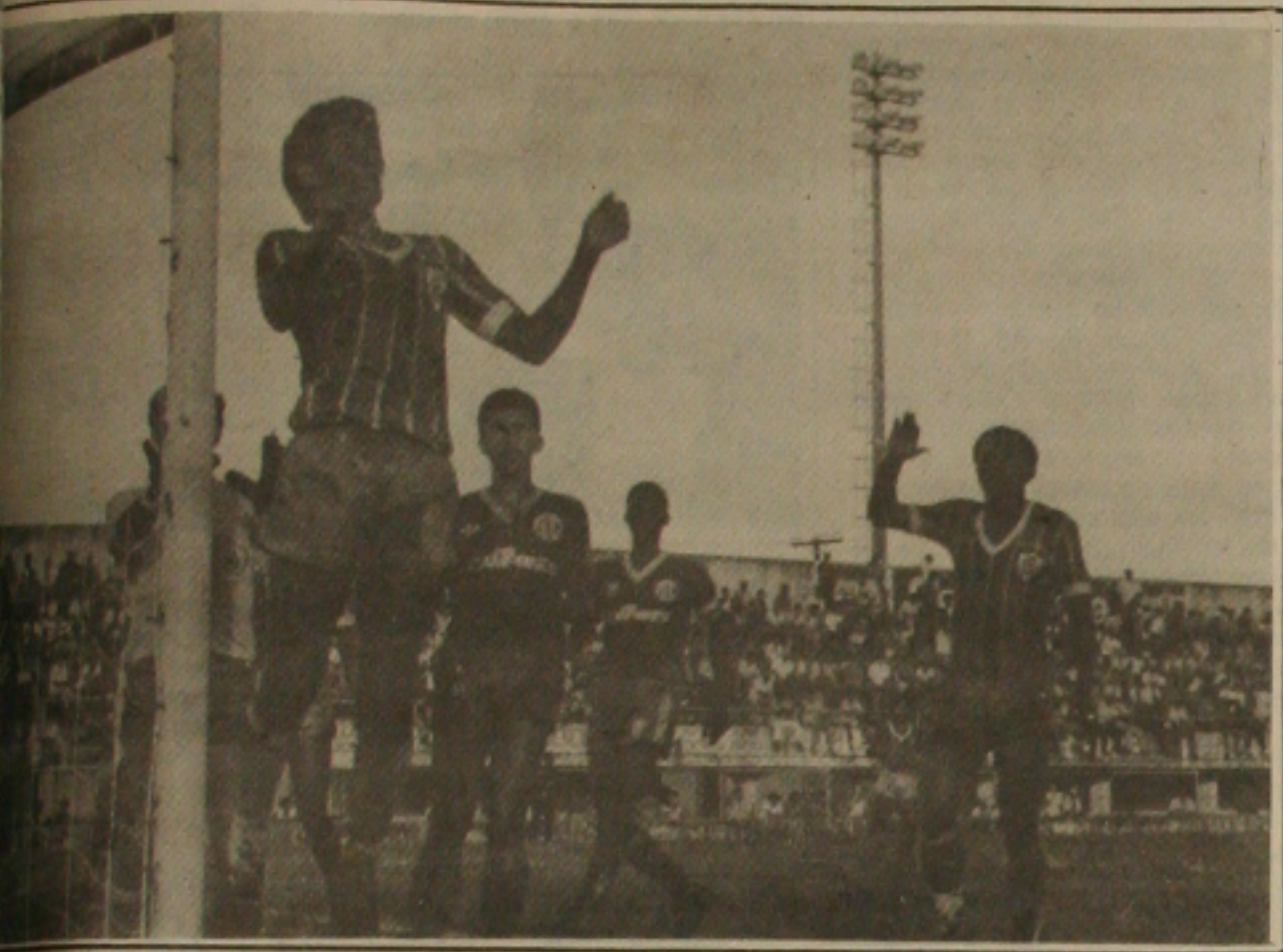
Itabalana prometem um grande jogo.

O Batistão pode reviver hoje um dos seus grandes dias. Confiança e Itabalana fazem o principal jogo da rodada em um dos clássicos mais famosos do futebol sergipano. A partida deve agradar pela rivalidade existente entre os dois quadros e pela ânsia do torcedor em ver partidas importantes, principalmente o torcedor da capital, cujo último jogo importante foi o Sergipe e Confiança na decisão do primeiro turno. O jogo de hoje portanto deve levar um bom público ao Batistão, até mesmo com o valor dos ingressos majorados ao bel prazer dos dirigentes.