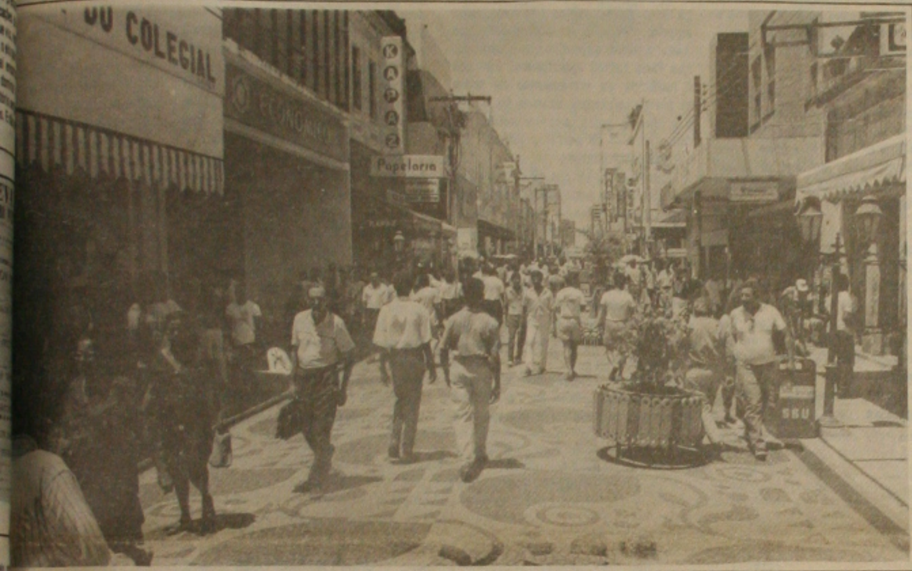
Protestos ocorrem pela regulamentação do decreto para abrir as lojas aos domingos, contra a vontade dos comerciantes.

Enquanto o presidente Fernando Collor estava reunido em Brasília com o secretário de Política Econômica, Antônio Kandir, a ministra da Economia, Zélia Cardoso de Mello, informava em São Paulo que a concessão do abono de Cr$ 3 mil, ainda este mês, a aposentados e pensionistas, deverá representar desembolso de Cr$ 34 bilhões. A medida deverá beneficiar 95% dos aposentados - 9,5 milhões que recebem até cinco salários-mínimos, dos quais 9 milhões recebem meio salário mínimo.