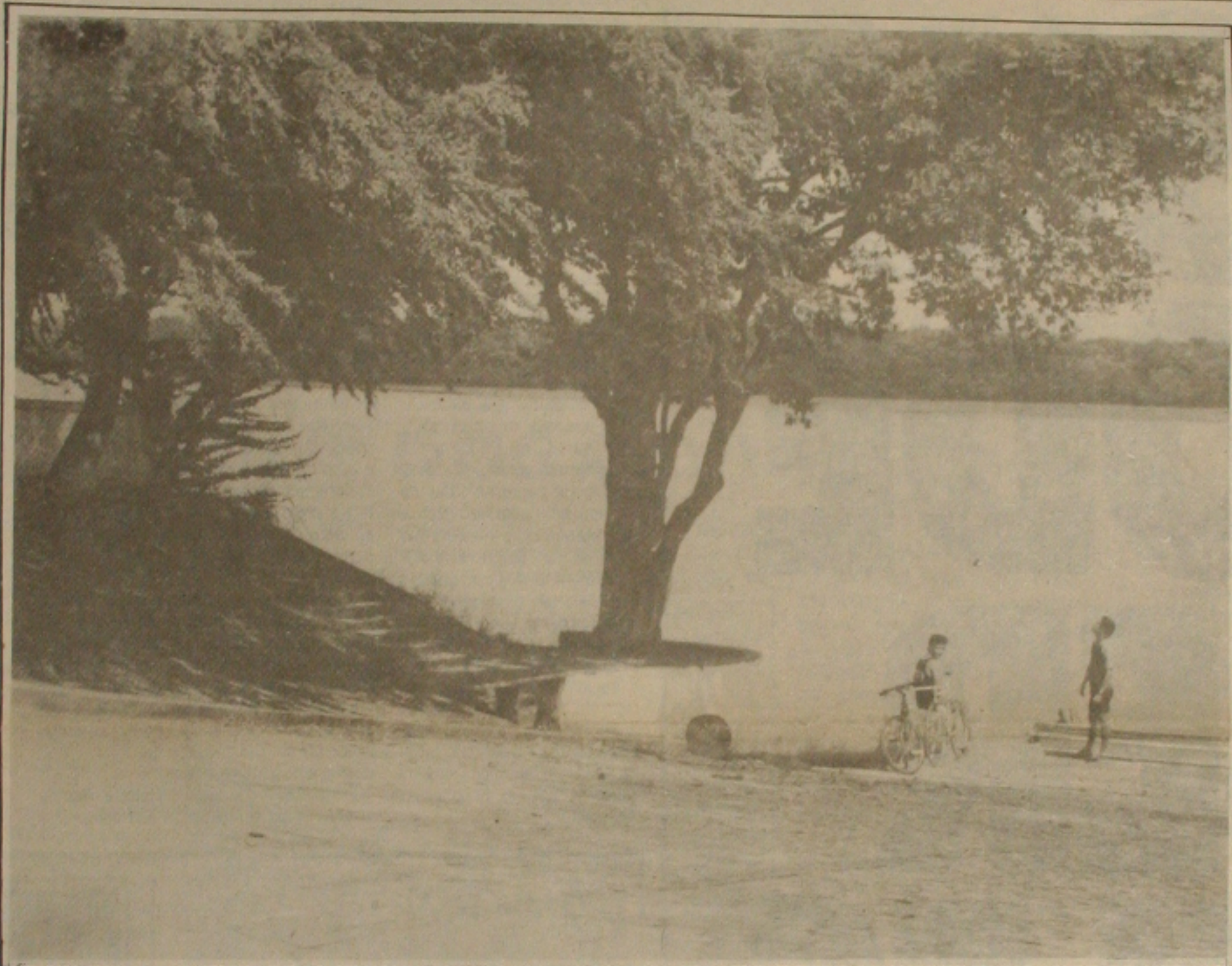
A pesca ainda se constitui na principal atividade no Mosqueiro.