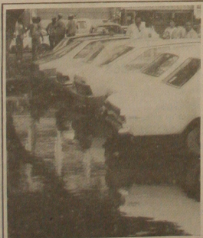
O esgoto obstruído obriga os taxistas a estacionarem os carros no meio da rua.

O ex-presidente da OAB rebate críticas feitas contra o PDT, no sentido de que não souberam escolher o seu representante, afirmando que isso demonstra o desespero das forças conservadoras, que imaginavam ser Sergipe um jogo eleitoral e que o povo não queria mudanças reais e significativas, visando tirar o Estado do atraso sócio-econômico.