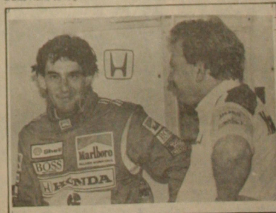
Ayrton Senna, esperançoso no título de campeão Mundial do ano.

Está será a 2ª vez que o Grande Prêmio da Bélgica será disputado neste circuito. A prova é realizada em 43 voltas de 6,940 metros cada, num total de 298,420 quilômetros. O recorde da pista pertence a Senna, no ano passado, quando conquistou a Pole Position com 1m50s067. Neste mesmo ano, enfrentando muita chuva, ele venceu a prova em 1h40m54s196, com a média de 181,576 km/h.