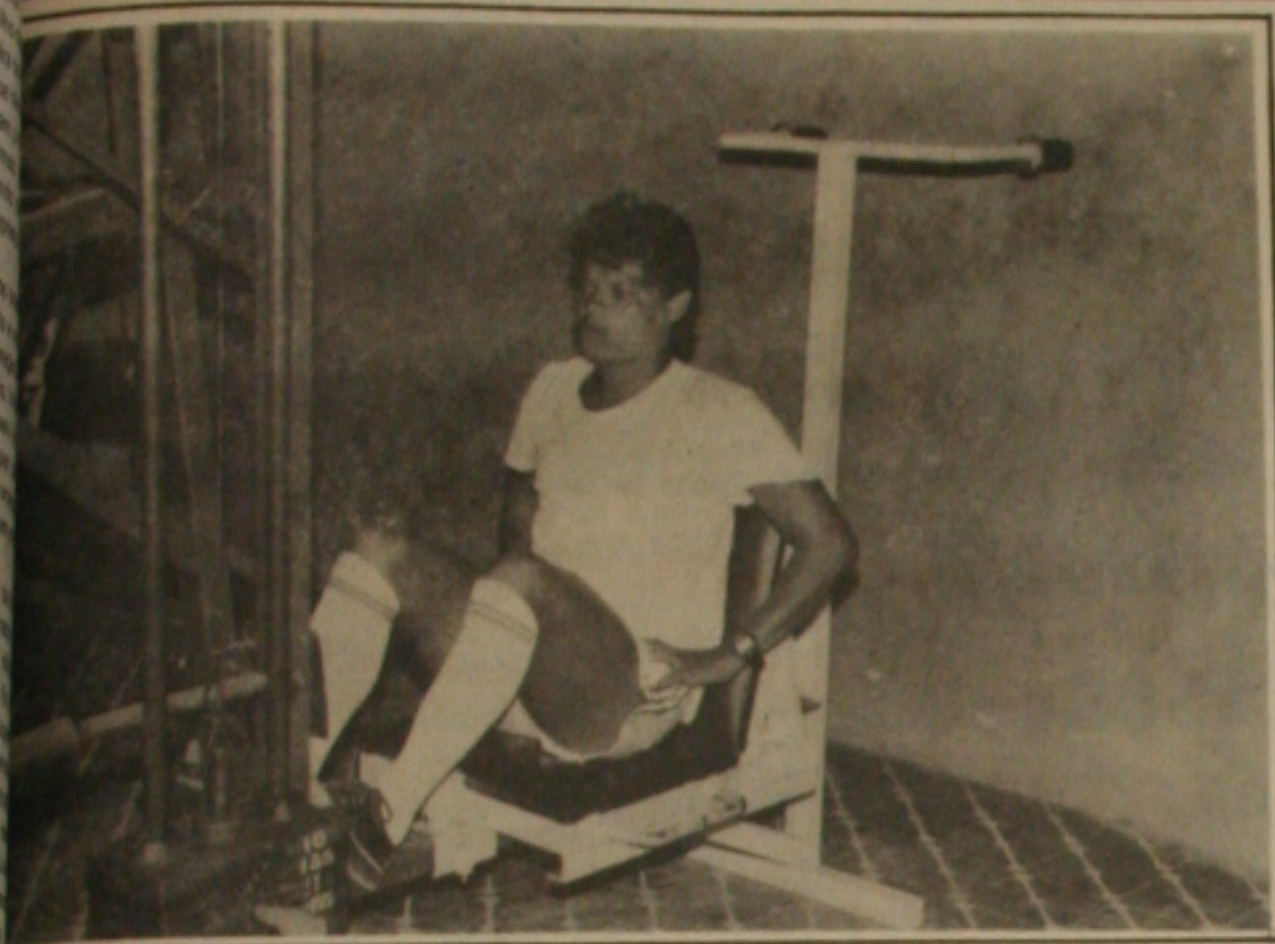
encara o Amadense como adversário difícil.