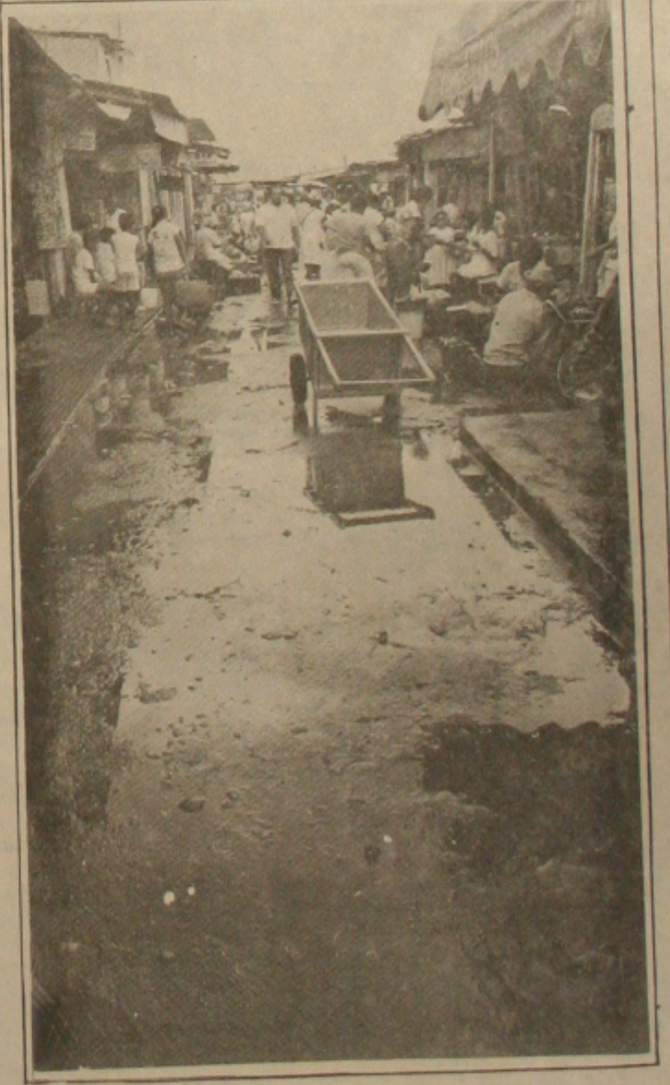
No Thales Ferraz a lama e o lixo prejudicam os consumidores.

Com as chuvas caídas nestes três últimos dias, acompanhadas de um vento muito forte, o mercado Thales Ferraz sofreu praticamente uma inundação e ficou intransitável. Por entre as barracas, a lama se misturava com restos de alimentos e lixo, prejudicando o comércio e afastando os consumidores, em virtude da grande imundície que se forma neste período. Com as chuvas cresce o número de ratos e baratas que se escondem por entre os alimentos, trazendo um grande perigo à saúde de quem consome frutas e verduras. (Página 3B)