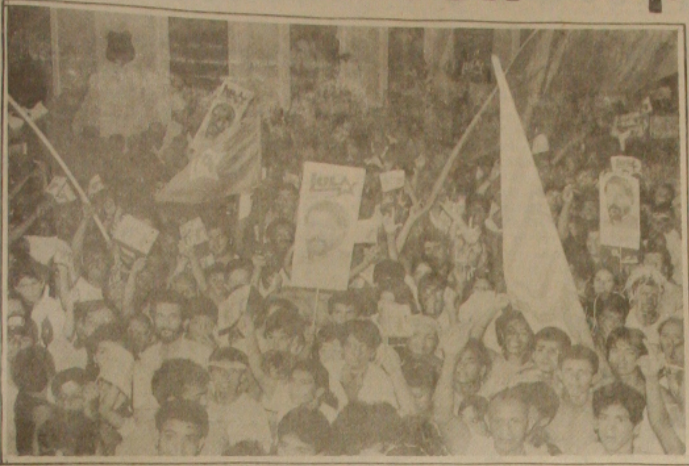
Lula volta às ruas para ajudar o PT e vencer no dia 3 e não irá disputar mais eleições sindicais.