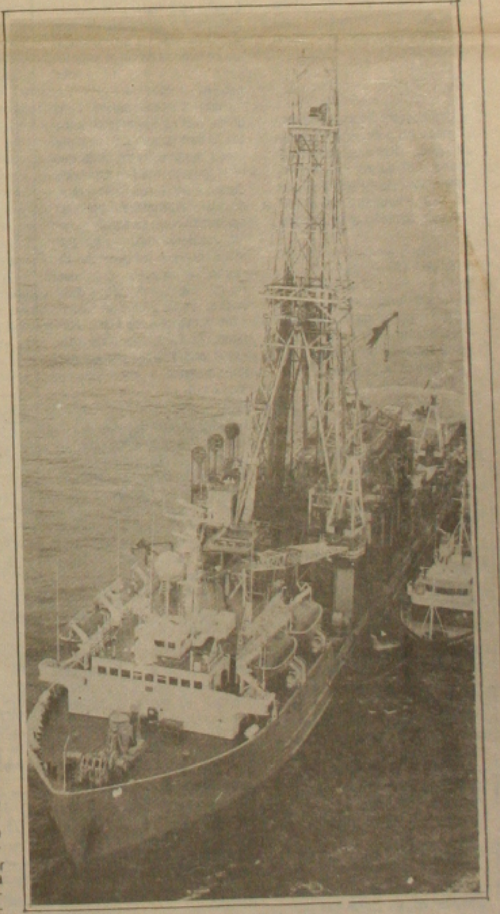
Exploração de petróleo: uma das riquezas do mar.