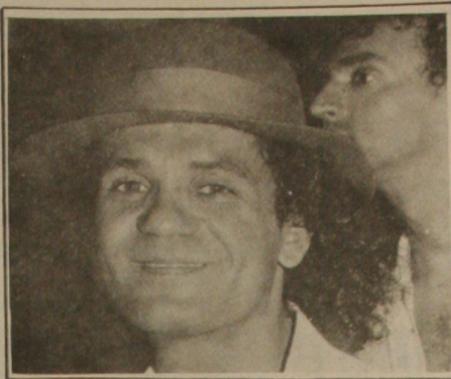
Rogério, um dos maiores representantes da música sergipana, no cenário musical brasileiro.