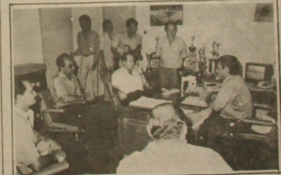
Apoio aos candidatos tem sido em todos os segmentos

O candidato a governador pela coligação do PFL, PRN, PMDB e outros sete partidos, está certo que "uma das formas de garantir a manutenção do trabalhador rural no campo é promovendo a entrega de títulos agrários e a irrigação, especialmente no sertão sergipano".