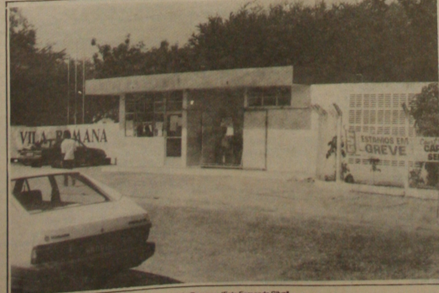
Ameaça de demissão esvazia novamente grevista na Vila Romana.

Na opinião do sindicalista a atitude da classe patronal é uma forma de pressionar a classe trabalhadora que acabou desmobilizada por temer demissão e punição. Na assembleia geral realizada ontem na porta da Vila Romana pouca gente participou e quem estava presente se comprometeu em manter o movimento para mobilizar a categoria. Os manifestantes estão confeccionando um panfleto que será distribuído na porta da fábrica. Através desse panfleto, as lideranças sindicais esperam resgatar a mobilização da categoria.