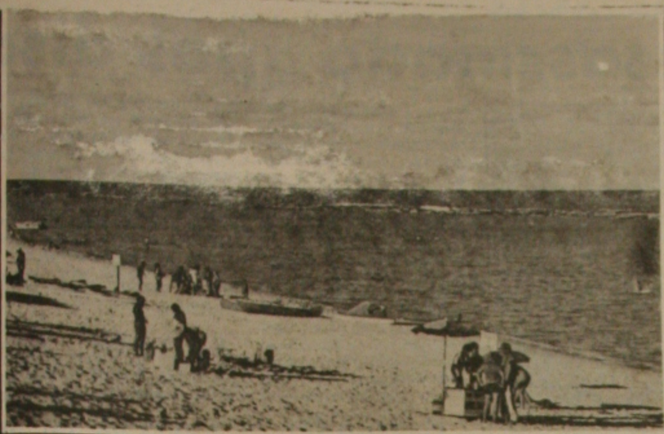
Exposição sobre o oceano movimentou o shopping.