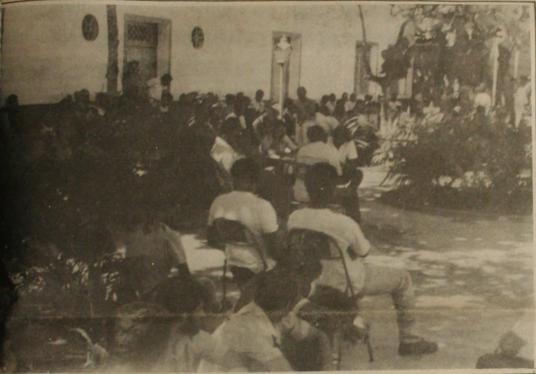
Bancários do Deso decidem manter a greve após assembleia geral.

Os bancários pretendem hoje fixar um painel no calçamento da rua João Pessoa divulgando a situação da classe trabalhadora que está com uma defasagem salarial avaliada em 288,6% conforme cálculo feito pelo Departamento Intersindical de Estatística e Estudos Sócio Econômico, (Dieese). Além do painel, os bancários distribuirão uma carta aberta solicitando apoio da população na campanha salarial.