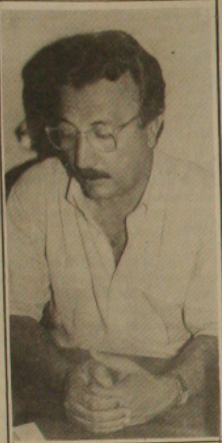
Jackson: na espera

Expansão e melhoria da rede de saúde em 483 municípios do Nordeste, com uma população de 10 milhões de pessoas, é a proposta do Projeto Nordeste do presidente Fernando Collor esta semana em Maceió. O projeto prevê investimentos de 510 milhões nos próximos anos, dos quais US$ 267 milhões financiados pelo Banco Mundial. As ações previstas no Nordeste beneficiarão sete Estados - Bahia, Ceará, Alagoas, Pernambuco, Maranhão e Paraíba. Com isso, a região será atendida na estrutura básica de saúde. O Projeto Nordeste I, iniciado em 1987, que já consumiu US$ 70 milhões, eram cobertos apenas o Grande do Norte, Piauí, parte da Bahia e Norte de Minas Gerais.