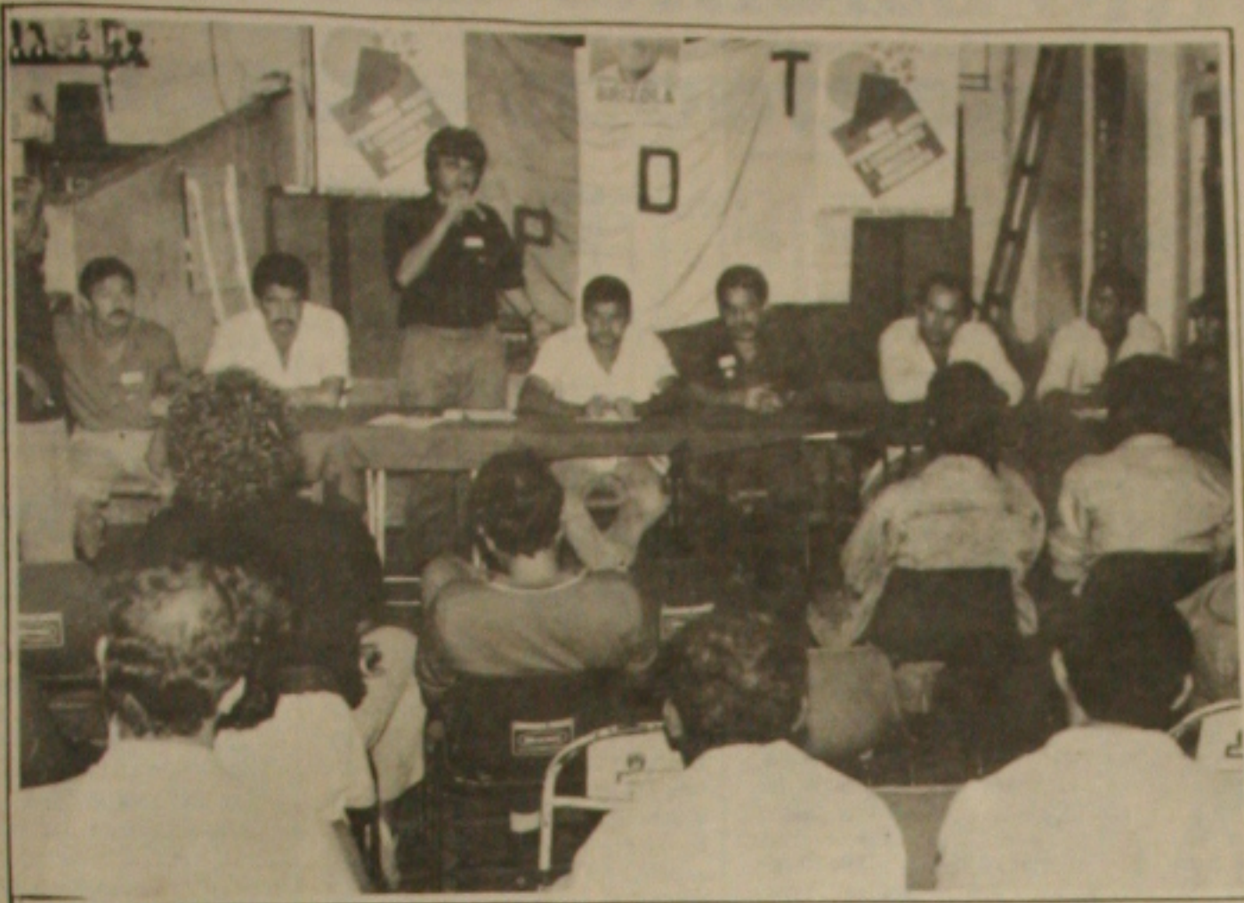
Brizolistas estão certos de que o dinheiro não será problema para a vitória em todo o Estado.

deputado é Na. trabalh-fício do povo Foi o que andidato a de- adual Pedro indenar a deci- as parlamenta- os que decidi- uma folga" e sessões ordiná- as e quartas e se integra- panha eleitoral á que a maio- idatos a reelei-