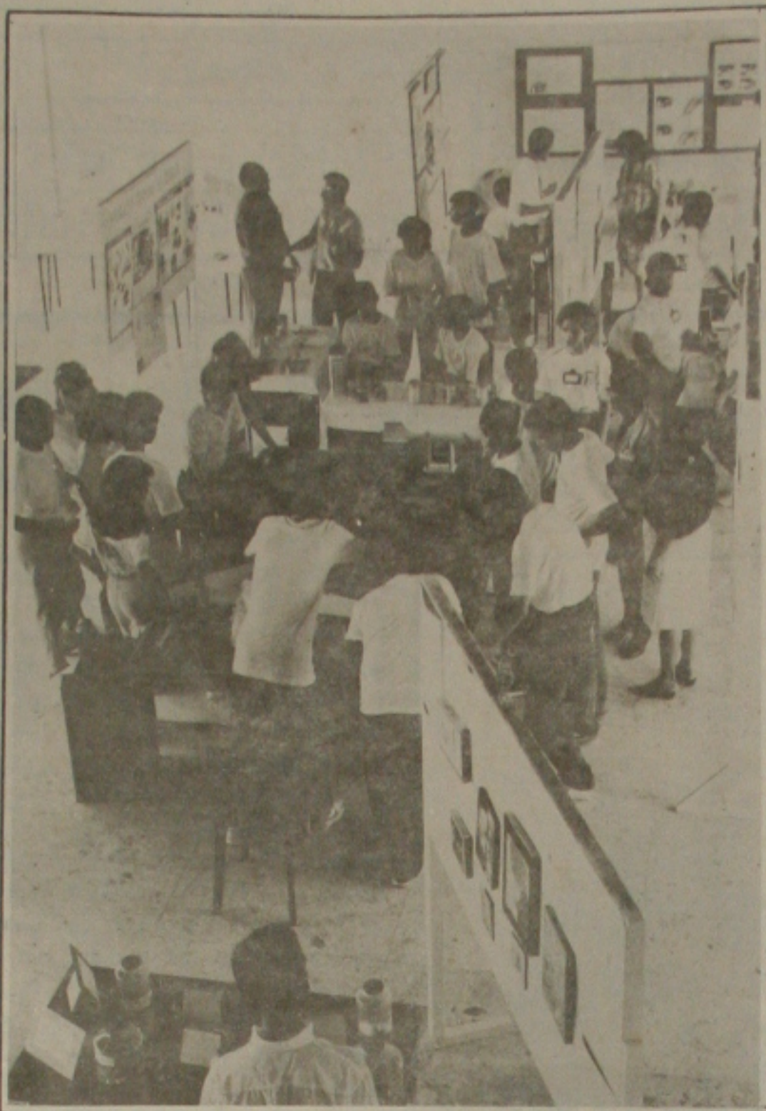
Exposição sobre encontro de ciência e matemática

O governador recebeu ainda a confirmação da vinda a Sergipe, neste domingo, de oito técnicos da Vale do Rio Doce, que vêm analisar a atual situação da Petromisa e avaliar a possibilidade de a empresa estatal assumir a mina-indústria de póssido de Taquari-Vassouras.