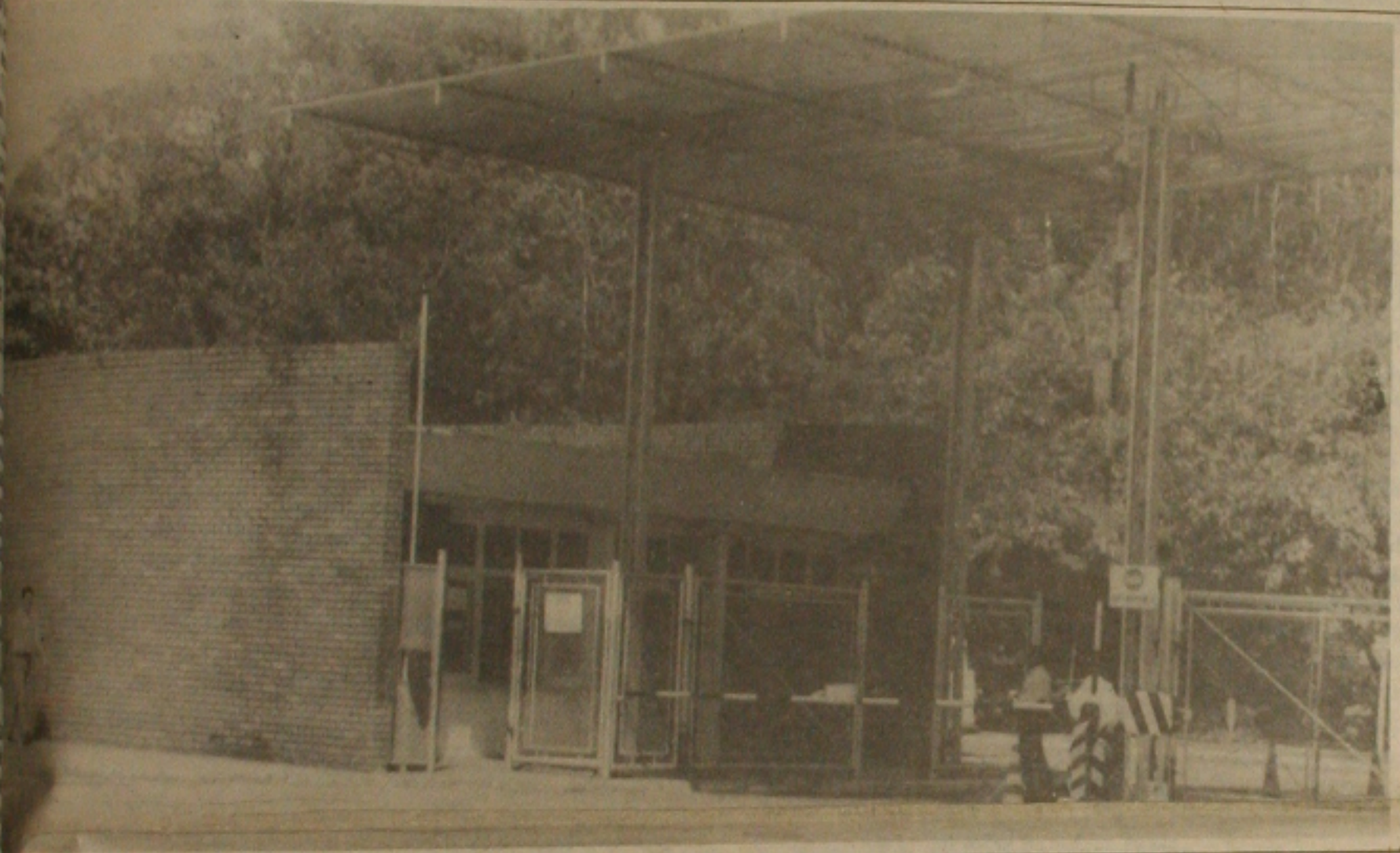
Obras de Sergipe começam a discutir hoje a deflagração de greve a partir da próxima terça-feira.