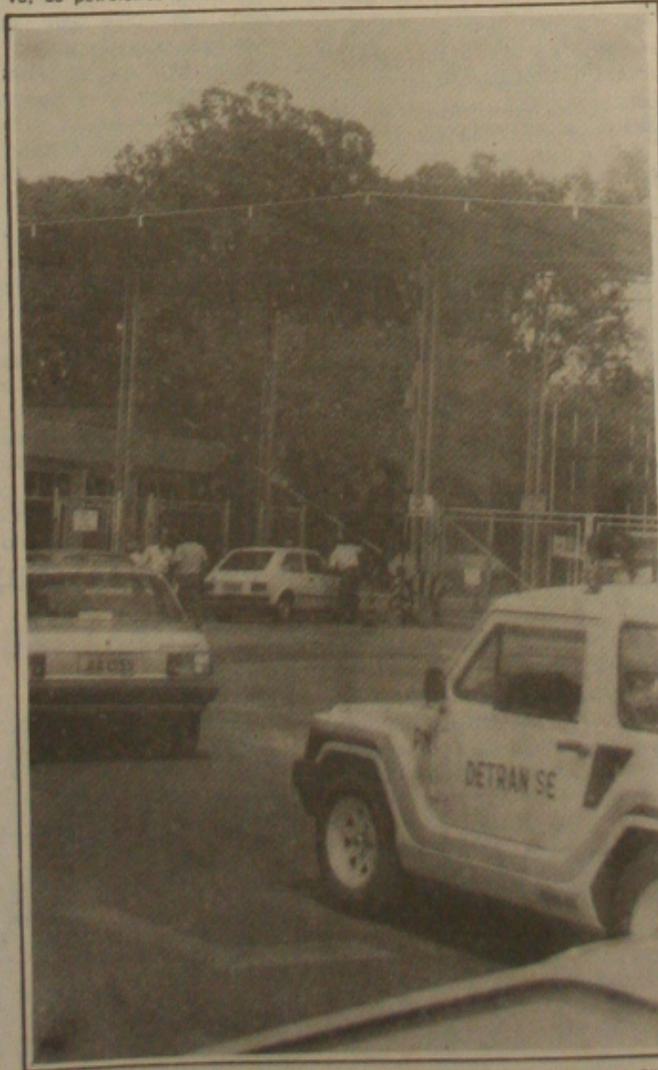
Operários da Fábrica de Tecidos Sergipe Industrial em greve.

te o congresso Nacional dos Petroleiros realizado no Estado de São Paulo no período de 21 a 23 do mês passado. Para comprovar a data da greve, os petroleiros estão realizando assembleias gerais nos Estados e em Sergipe a categoria está aguardando maiores informações do movimento a nível nacional e das últimas negociações.