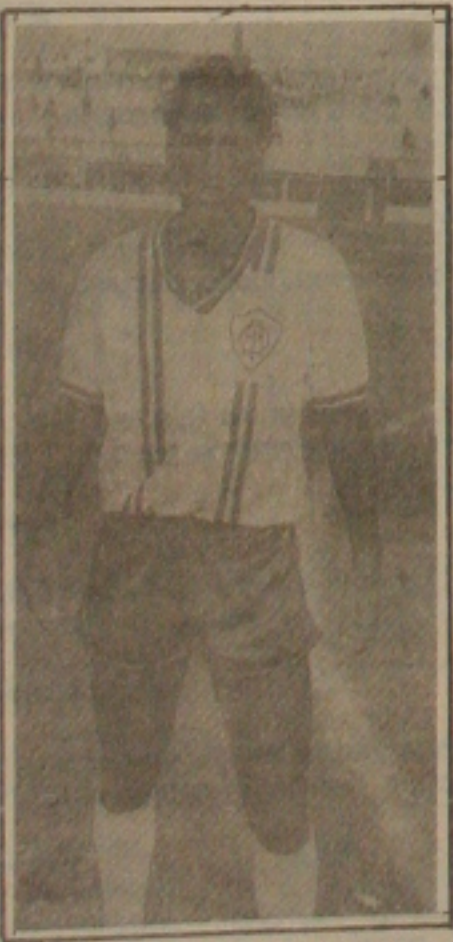
Castorzinho firma no time tricolor.

para os passes errados que têm causado sérios problemas à equipe. São esses passes que abrem as chances para o adversário marcar os gols, e uma reação de imediato nem todas as vezes é a solução do caso.