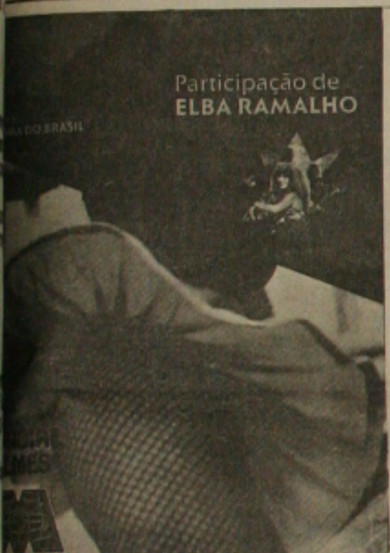
Participação de ELBA RAMALHO