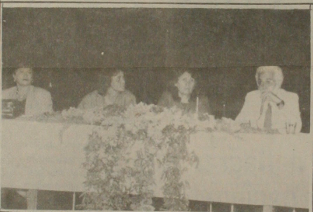
Na abertura do Encontro uma palestra sobre as duas matérias