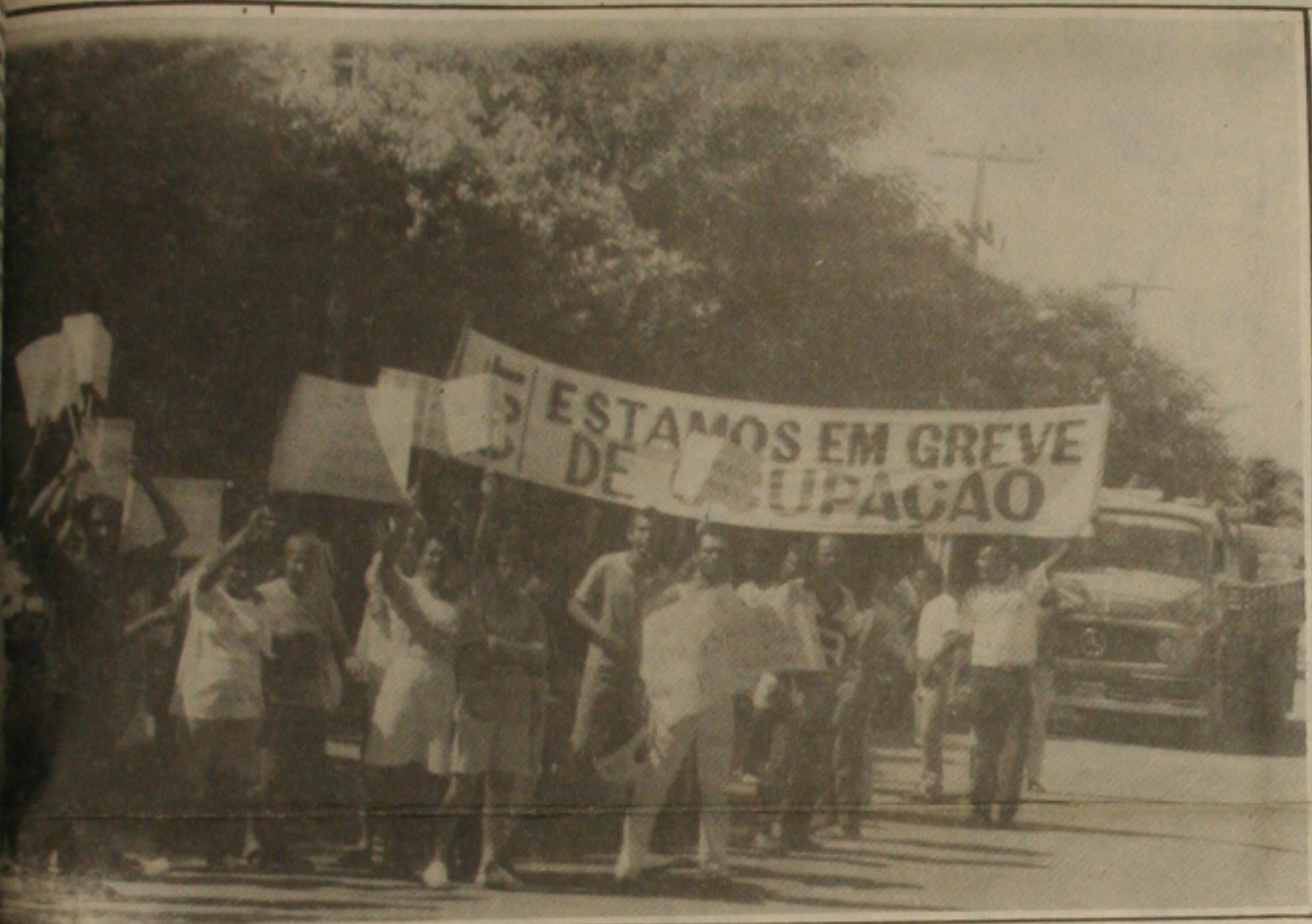
Petroleiros podem decretar greve na próxima semana.

Policiais militares ocuparam ontem as instalações da Fábrica de Tecidos Sergipe Industrial por determinação de sua direção em consequência do movimento grevista da classe trabalhadora que luta por melhores condições de trabalho e reposição das perdas salariais. O clima ficou tenso na porta da fábrica quando a diretoria impediu a entrada de um sindicalista nas instalações da Sergipe Industrial.