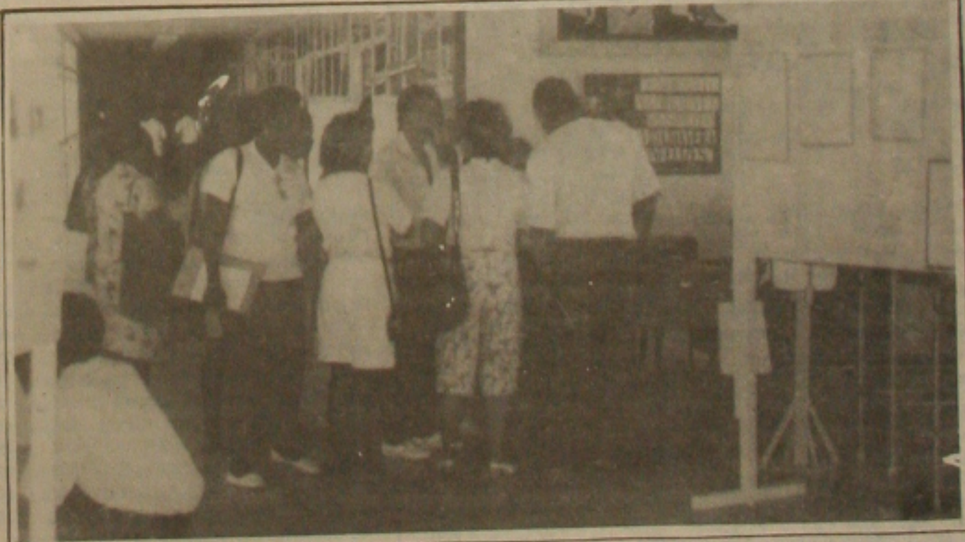
Na abertura do Encontro, professores e estudantes ainda se inscrevem para o evento.

Com a participação de professores, estudantes de nível superior e do 1º e 2º graus, foi aberto ontem no Campus Universitário o I Encontro Sergipano de Ensino de Ciências e Matemática, promovido pela Universidade Federal de Sergipe. Paralelamente está sendo realizado o I Concurso Sergipano de Jovens Pesquisadores, que vai premiar as pesquisas científicas desenvolvidas pelos estudantes do 1º e 2º graus. O encontro será encerrado amanhã com a entrega dos troféus aos vencedores. (Página 1B).