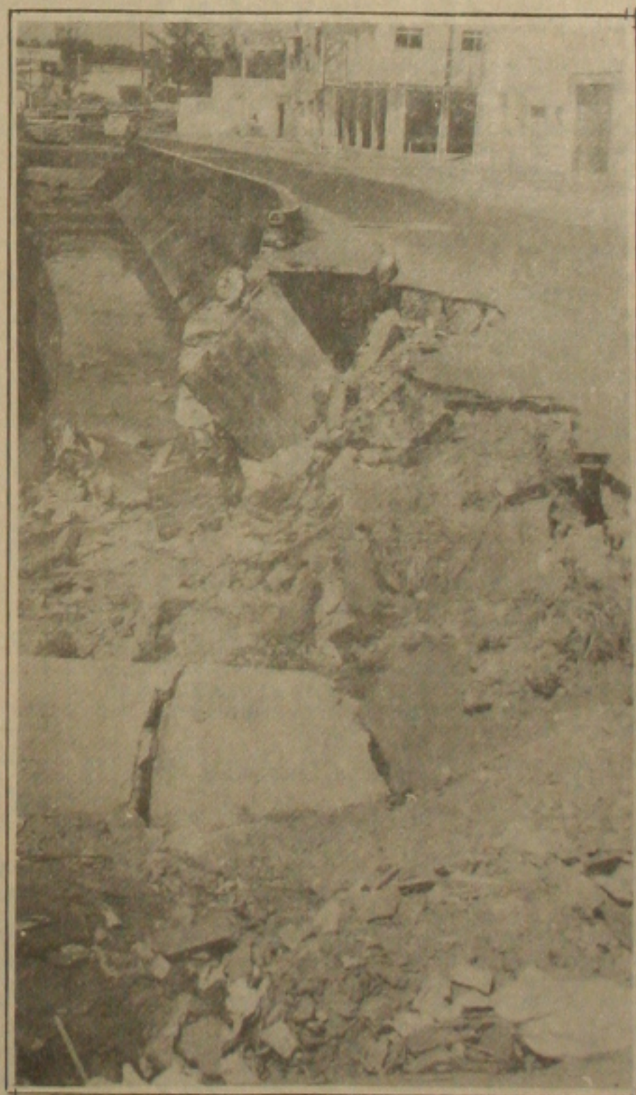
Esta cratera pode causar um grave acidente.

Há cerca de dois meses que a Avenida Gentil Tavares, no trecho compreendido entre as Avenidas Semeão Sobral e Maranhão, está com uma cratera proveniente das últimas chuvas, sem que a Prefeitura tome as devidas providências. Mas o pior de tudo é que a destruição parcial daquela artéria, pela erosão, se constitui em uma ameaça à vida dos populares que se vêem obrigados a trafegar por aquela via pública. Muitas são as insatisfações por parte dos que residem nas imediações, visto que nenhuma atitude no sentido de sanar o problema foi tomada pelo poder municipal. (Página 3-B)