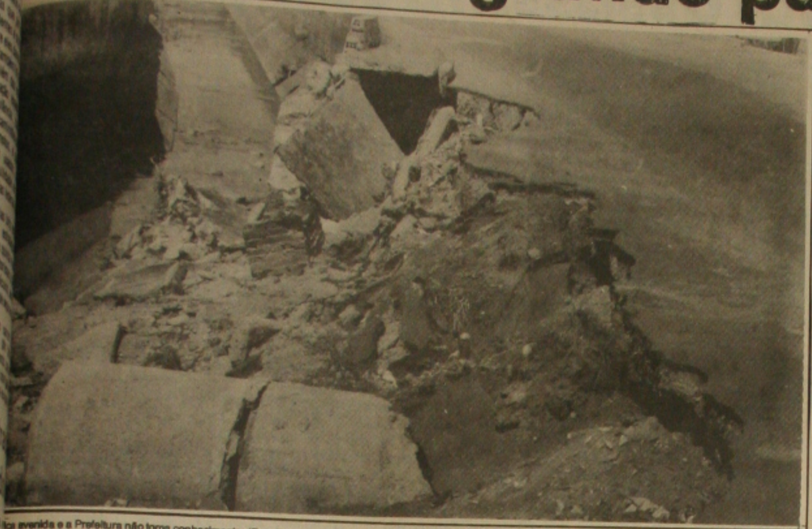
Cratera aberta na avenida e a Prefeitura não toma conhecimento.

Sem que a Prefeitura Municipal de Aracaju tome as devidas providências a cratera existente há cerca de dois meses na avenida Gentil Tavares, entre as avenidas Simeão Sobral e Maranhão continua tomando parte da pista e, por conseguinte, colocando em risco à vida da população que por ali trafega.