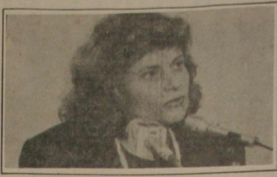
Zélia anuncia fim da lei de Informática.

Brasília - A ministra da Economia, Zélia Cardoso de Mello, anuncia na quarta-feira a abertura do mercado de informática, no contexto da nova política industrial brasileira, que exporá a empresa nacional a concorrência externa. A ministra disse ontem que a abertura do mercado à importação de bens do setor de informática é vital para a modernização e capacitação tecnológica da empresa brasileira. Na quarta-feira, Zélia anunciará o programa de capacitação tecnológica, em fase de conclusão no Departamento de Indústria e Comércio. O projeto prevê a criação de um conselho de política industrial, que terá poder normativo para fixar as diretrizes do novo modelo de desenvolvimento do País, distribuindo os limitados recursos do Estado para setores industriais eleitos como prioritários. Será criada também uma rubrica orçamentária especialmente destinada a financiar o desenvolvimento tecnológico.