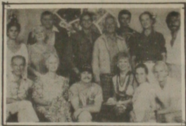
A Globo exibe a divertida fantasia "Cocoon" na tarde de domingo

Interessante filme de ação, que não é muito movimentado, mas prende a atenção até o final. Rodado na Irlanda, mostra um bando de sequestradores, liderados por um psicopata, Lou Kramer (Perkins), que domina um navio, o "Esther", que abastece as plataformas de petróleo do Mar do Norte. Kramer enche de bombas o navio e uma plataforma, o Jennifer, exigindo, para não explodir tudo, 25 milhões de libras ao Governo britânico. Aí, a primeira-ministra convoca o almirante Brinsden (Mason) para ir a uma ilha escocesa, contratar o perito em demolição submarina, Rufus Folkes (Moore) para acabar com os bandidos. Boa diversão. Disponível em vídeo CIC.