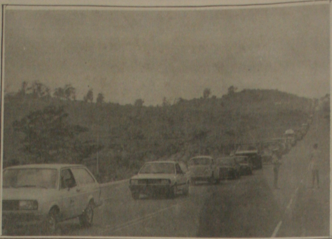
Rodoviária Federal teve muito trabalho neste final de semana prolongado.