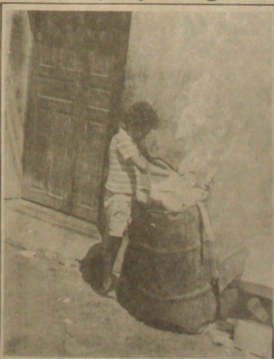
A criança e o adolescente estarão melhor protegidos.

O procurador do Estado acredita que os órgãos públicos não terão condições nenhuma de assumir e cumprir na íntegra as determinações expostas no estatuto da Criança e do Adolescente. "Ele é muito avançado