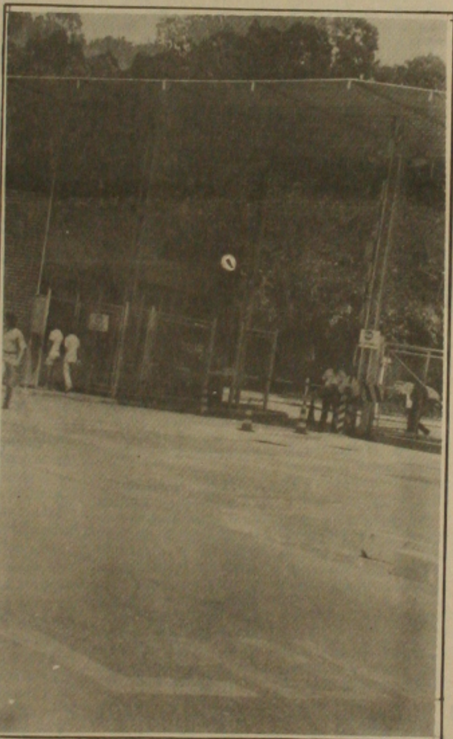
Petroleiros estão ameaçando paralisar atividades em Carmópolis.

Por outro lado, todos os petroleiros em Sergipe estão dispostos a aderir ao indicativo de greve marca-