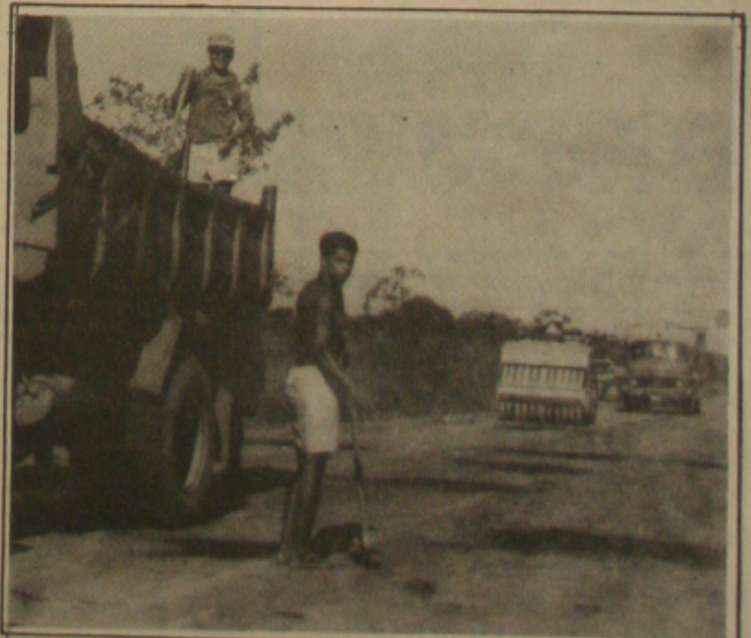
DNER recebe verbas para recuperar rodovias em Sergipe.

Assim, disse Terezinha, para que o consumidor, principalmente de um menor poder aquisitivo, e o comerciante não continuem sendo prejudicados acho de fundamental importância a construção de um novo Mercado, que consequentemente será mais amplo, limpo e terá toda uma estrutura para receber toda a comunidade aracajuana sem maiores transtornos.