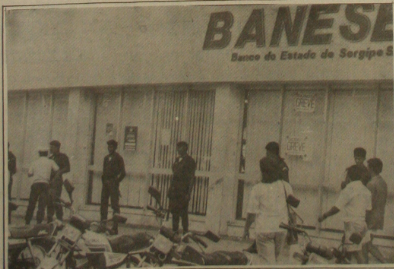
Os clientes da rede bancária continuam sendo atendidos apesar de greve.

Já o governo estadual através da direção do Banese, assegurou cumprir as determinações do Governo Federal explícitas na Medida Provisória 219 assinada pelo presidente Fernando Collor de Mello que estabelece a reposição das perdas salariais em 104%. Mas a categoria não concorda com este índice por considerar que as perdas estão avaliadas em 288%.