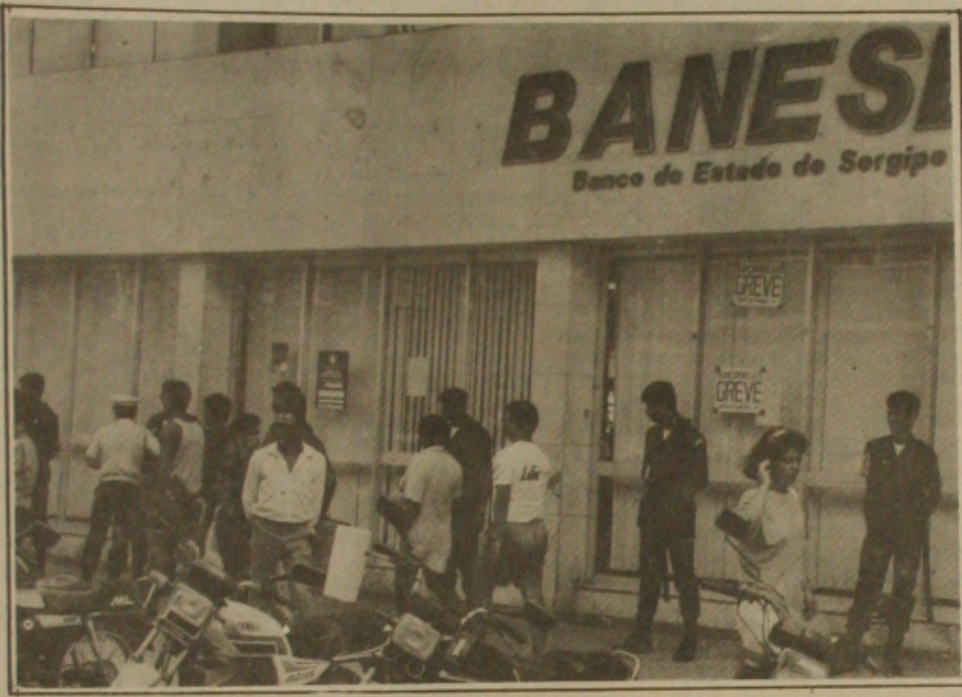
A maior adesão a greve é na matriz do Banesa, que mesmo assim continua atendendo a clientela.