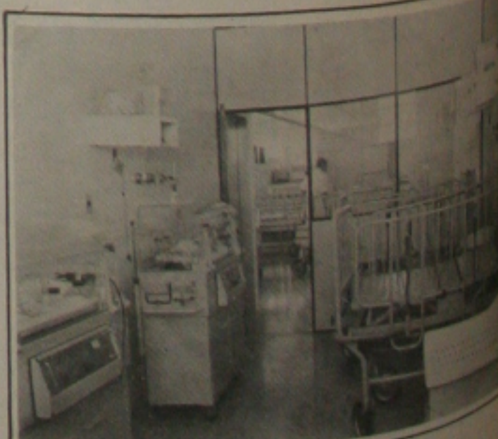
Os equipamentos do novo Centro Cardiológico.