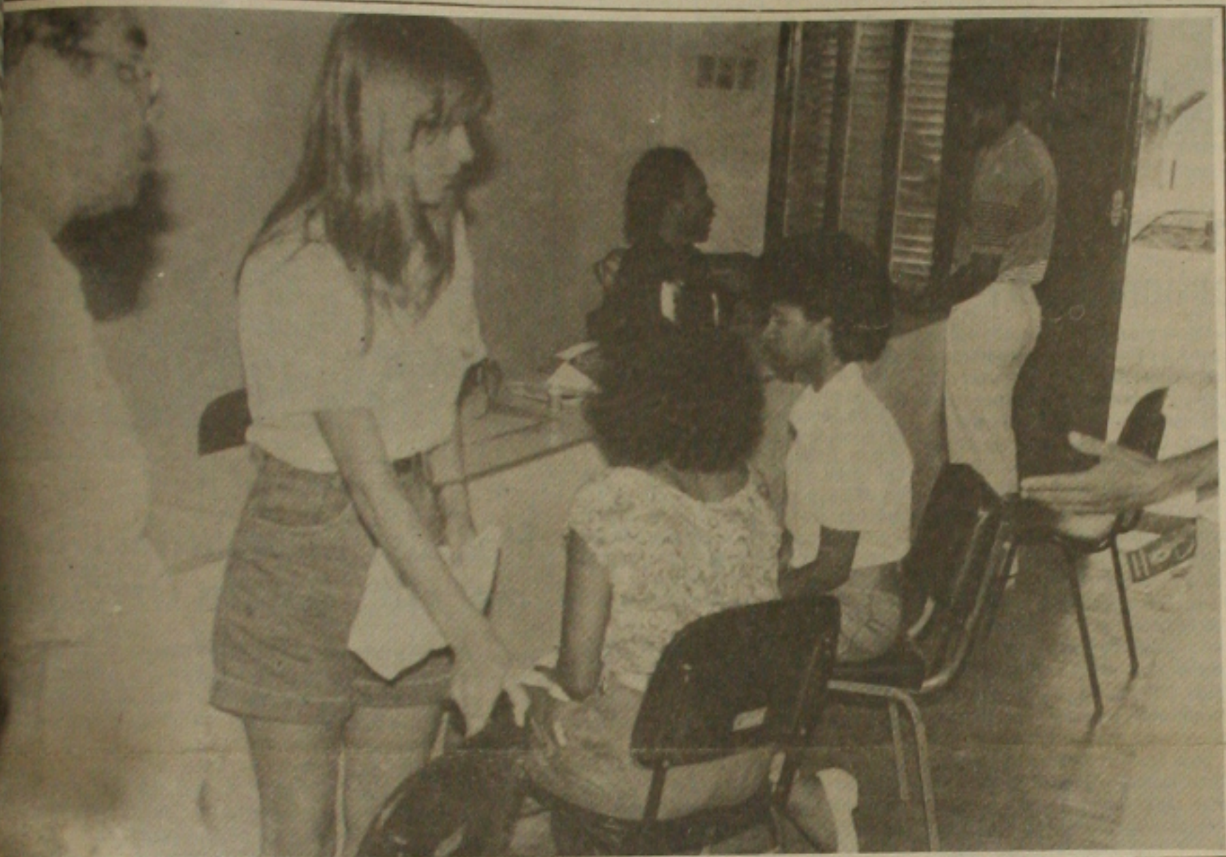
Estado da economia reflete na oferta de empregos.