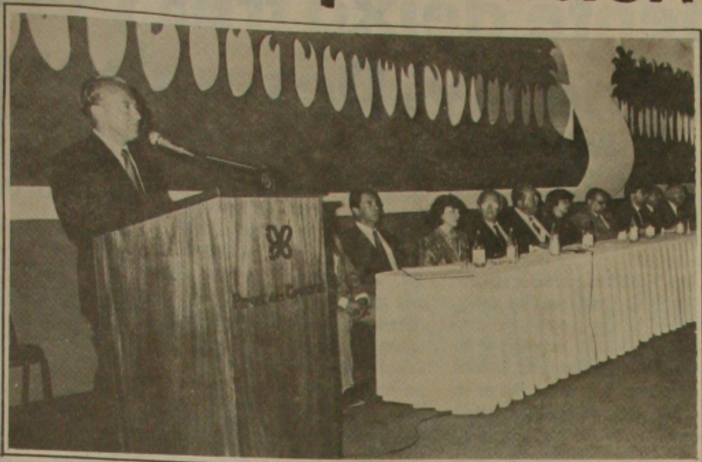
O governador Antônio Carlos Valadares, abriu no domingo a 31ª Convenção Nacional do Comércio Lojista.

As ruas de Aracaju estão sendo destruídas e nem a operação de recapeamento que vem sendo feita pela Prefeitura Municipal ajuda nas principais avenidas. O centro da cidade que as administrações anteriores sempre se esforçaram em preservar por meio do asfalto da cidade, não abandonou, e os buracos são responsáveis pelo aumento no engarrafamento até mesmo batidas. Por exemplo, em um Departamento de Trânsito comemorativa Nacional do Trânsito pelo Governo Federal, a população aracajuana não pôde sair de casa por causa da chuva que caiu no dia 10 de setembro, provocada por uma chuva aberta no meio que tem obrigado os moradores a sair de casa por causa da chuva.