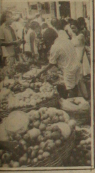
Frutigranjeiros devem baixar

querdas. Mas enquanto o PT pega fogo nas bases, o grupo que fechou questão com a candidatura de Carlos Alberto Menezes ao Senado em substituição ao advogado Clóvis Barbosa, pretende realizar hoje em Aracaju uma passeata com mais de 10 mil pessoas e pela receptividade que anunciam ter obtido nos 20 municípios visitados no final de semana, o quadro político mudou e agora teremos segundo turno na eleição para o Governo do Estado. (Página - 3)