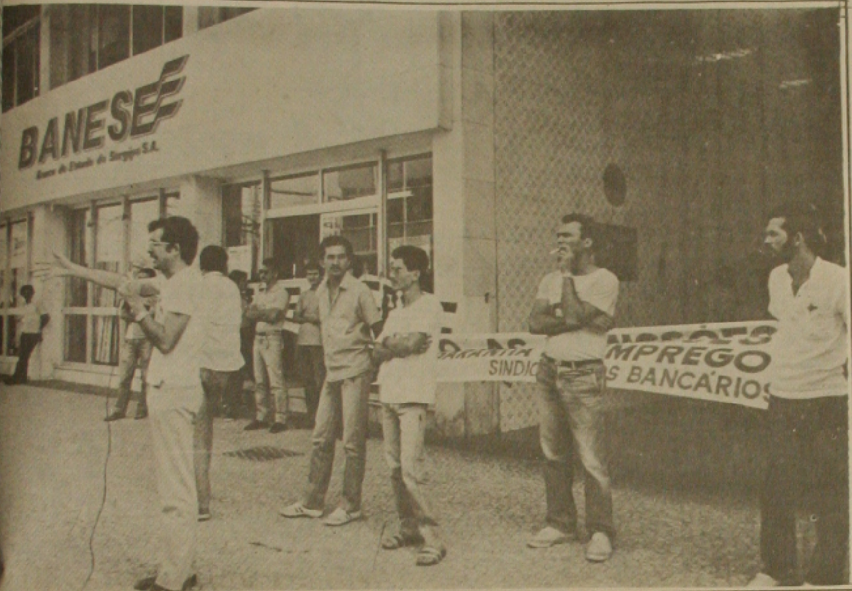
dos Bancários ingressa com ação na Justiça contra o Banese.