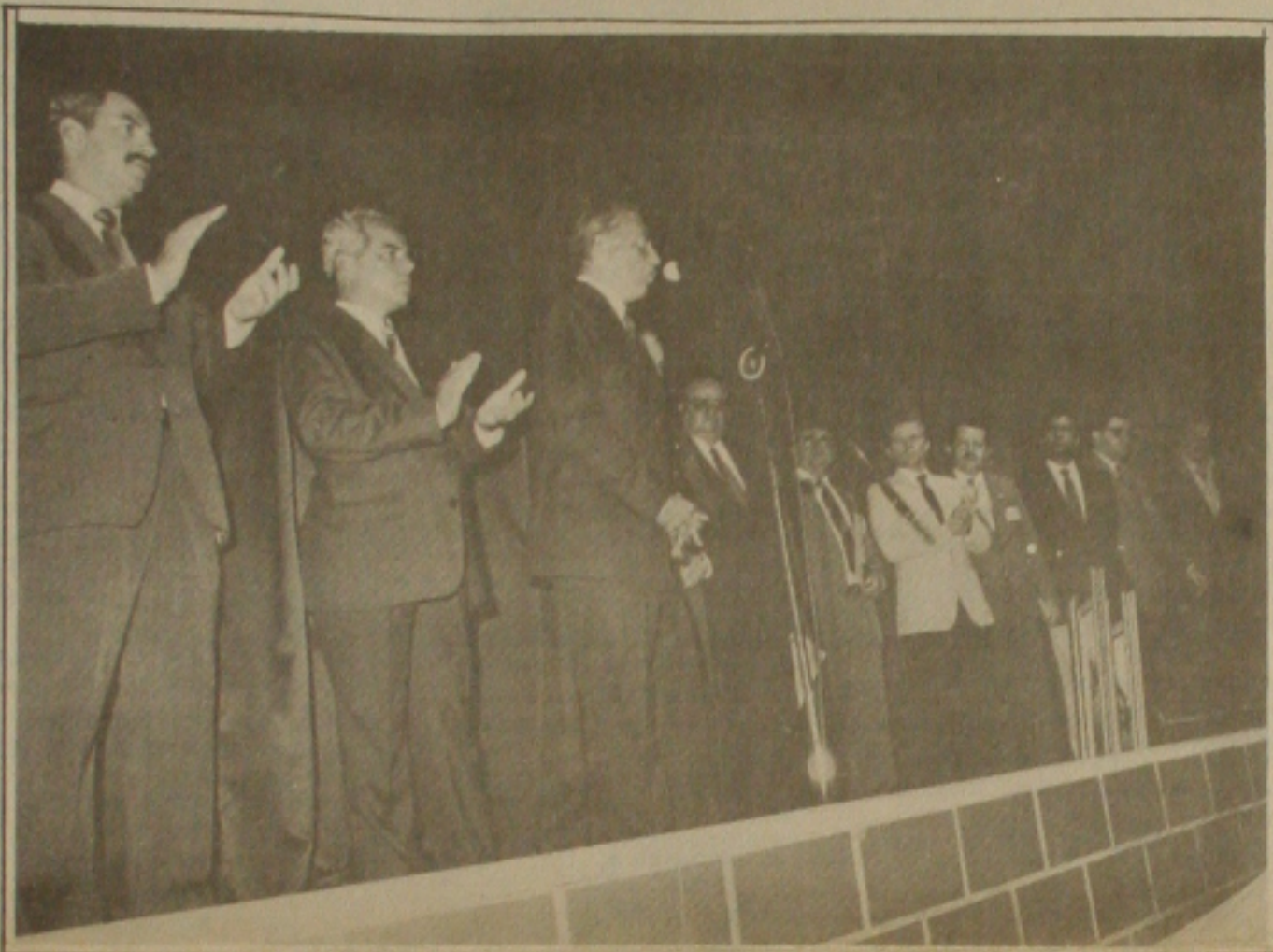
O governador Valadares agradece aos empresários lojistas a concessão da maior homenagem dos CDL's.

Segundo cálculo do Conselho de Desenvolvimento Econômico do CDL de Aracaju, mais de 10 milhões de visitantes da Convenção fizeram circular em Aracaju uns recursos de cerca de três milhões de dólares.