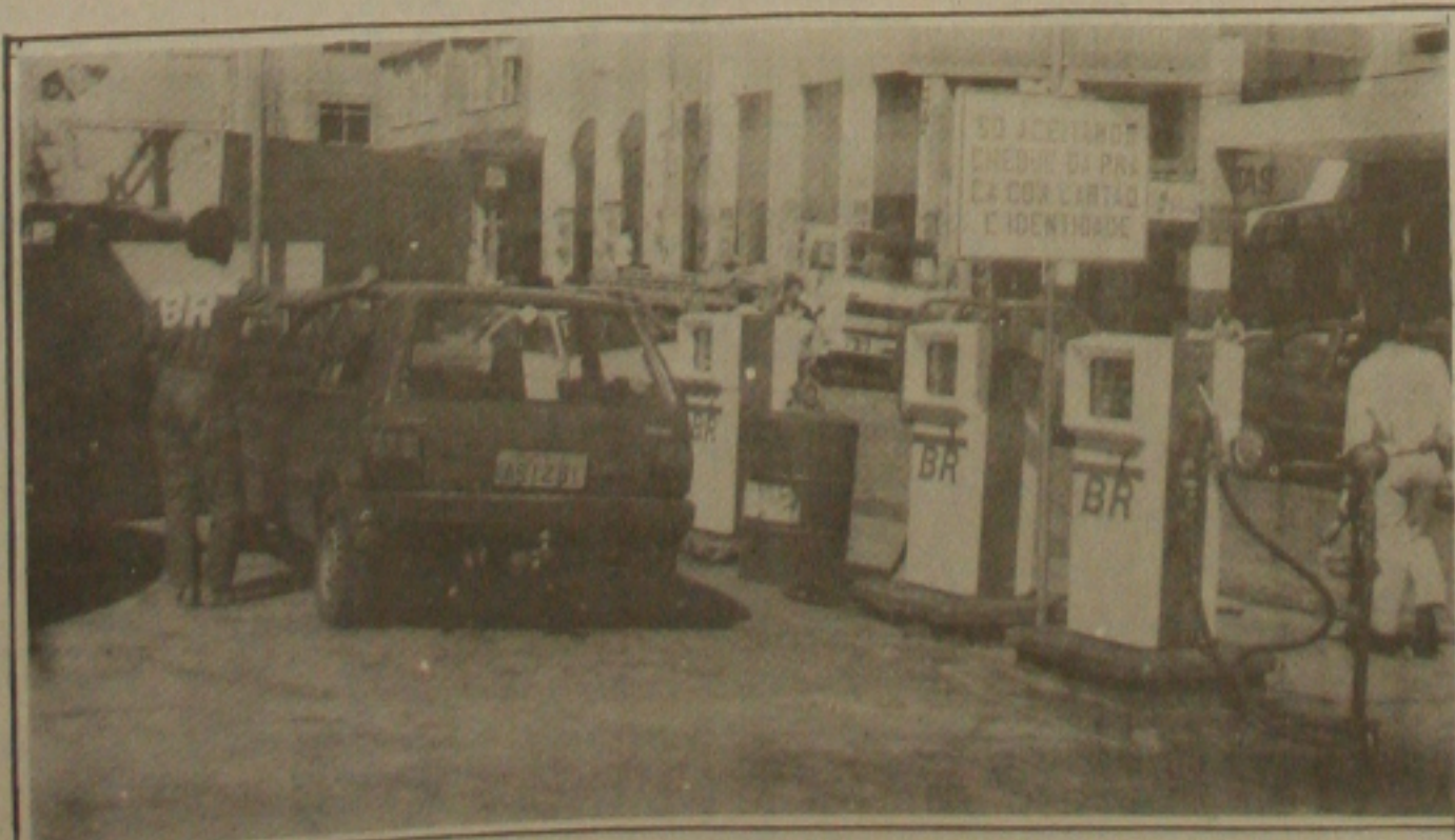
Ainda não está normalizado o abastecimento de álcool combustível.

Após a reciclagem dos fiscais da Semab, o órgão fiscalizador vai agora orientar os vendedores, principalmente os que sobrevivem no vácuo do comércio, oferecendo frutas, doces, salgadinhos e outras iguarias dentro de cestas, baldios, carrinhos de mão e tabuleiros.