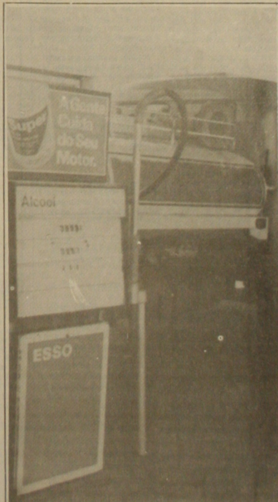
Alcool: bombas voltam a ficar vazias.