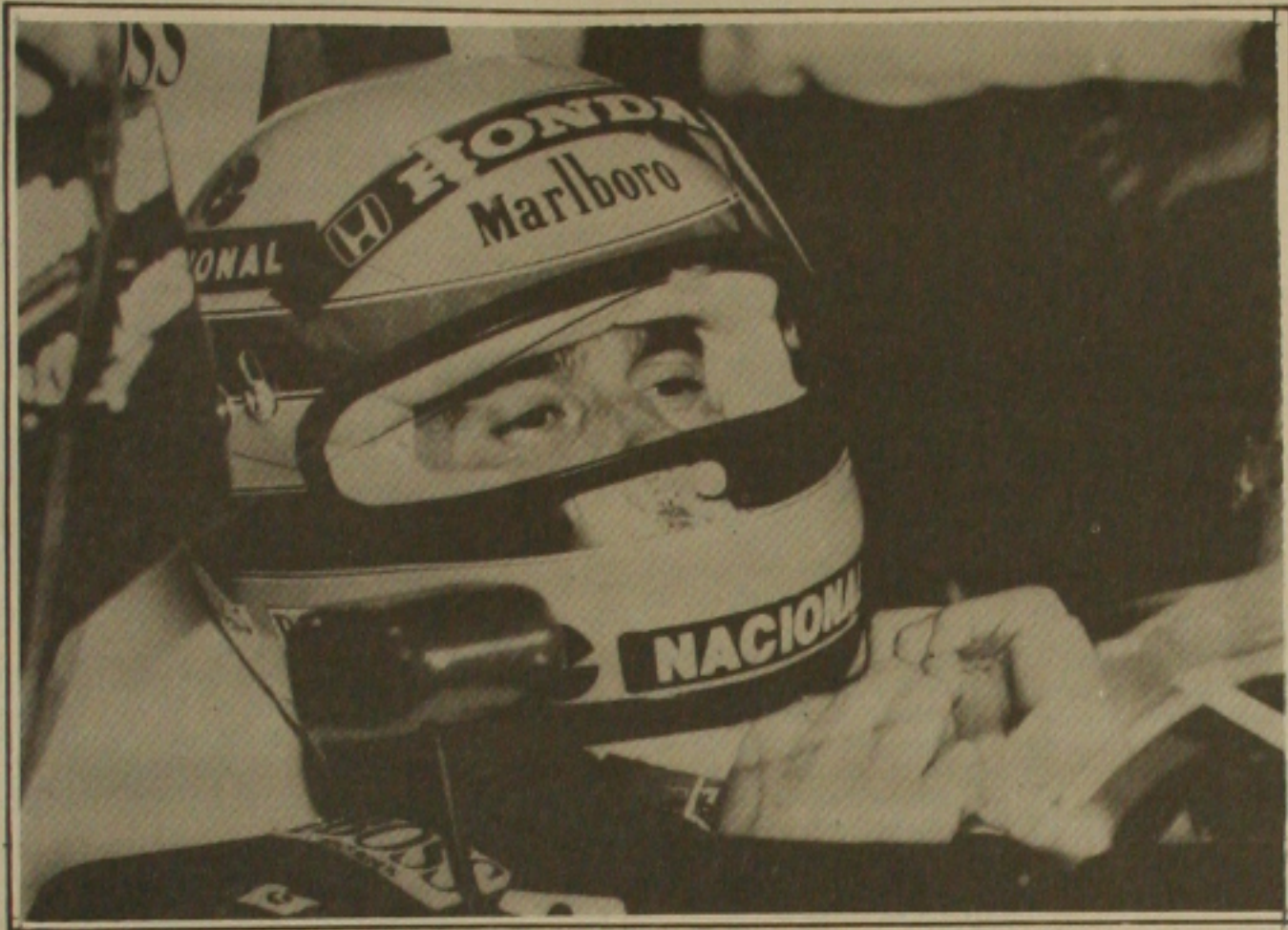
O piloto Ayrton Senna está na briga pela conquista do título do Campeonato Mundial de Fórmula Um.

SÓ SENNA No Mundial de Fórmula 1 venceu hoje, com os cinco resultados que cada piloto é obrigado a obter, Senna somaria 60 pontos, contra 51 de Prost. E o número de pontos da equipe italiana terá de abandonar as características — de correr com cautela — para diminuir esta diferença, nas próximas etapas.