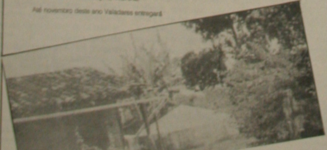
A construção de uma ponte sobre um rio em Sergipe.

Até dezembro deste ano serão inaugurados mais quatro hotéis inaugurados pelo Governo do Estado: Chapéu de Couro, em Camópolis; Del Mar e Brisas Mar, na Aracaju; e a Nova Praia Hotel, na Aracaju. O Estado também totalizou 101 milhões de cruzeiros, para a construção em funcionamento também o projeto de hotel do Estado, numa área localizada em São Miguel do Itaipubim, no município de São Miguel do Itaipubim, já adquirida e passando pelo nome de São Miguel do Itaipubim Hotel. O projeto prevê um moderno Hotel quatro estrelas, com todo o bucolismo de autêntica fazenda de