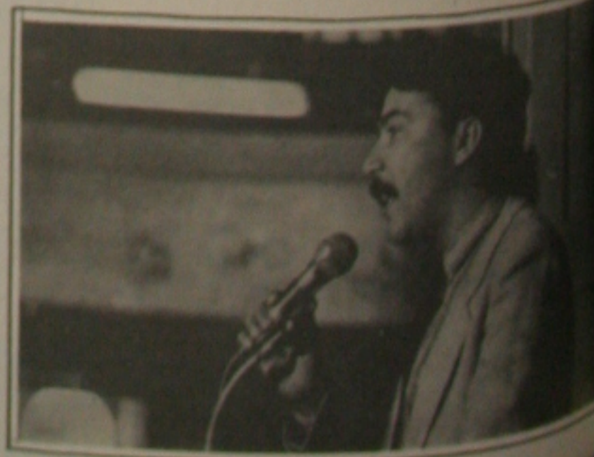
Déda: crítico das leis.

A situação é crítica em Sergipe que é o que mais se aproxima do ano eleitoral na Assembleia Legislativa. O título de utilidade pública em favor das comunidades na capital do Estado. A criação de associações grande que somente no bairro Campos existe hoje cerca de 100 associações de bairros.