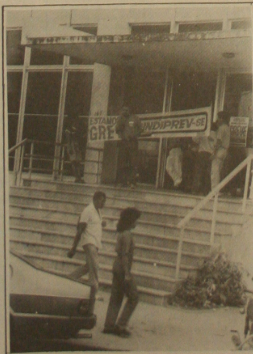
Previdenciários decidem manter movimento grevista.

sempre alertam que os grevistas correm o risco de serem colocados em disponibilidade ou mesmo demitidos dos serviços públicos conforme pretensão do presidente da república Fernando Collor de Mello de "enxugar" a máquina administrativa.