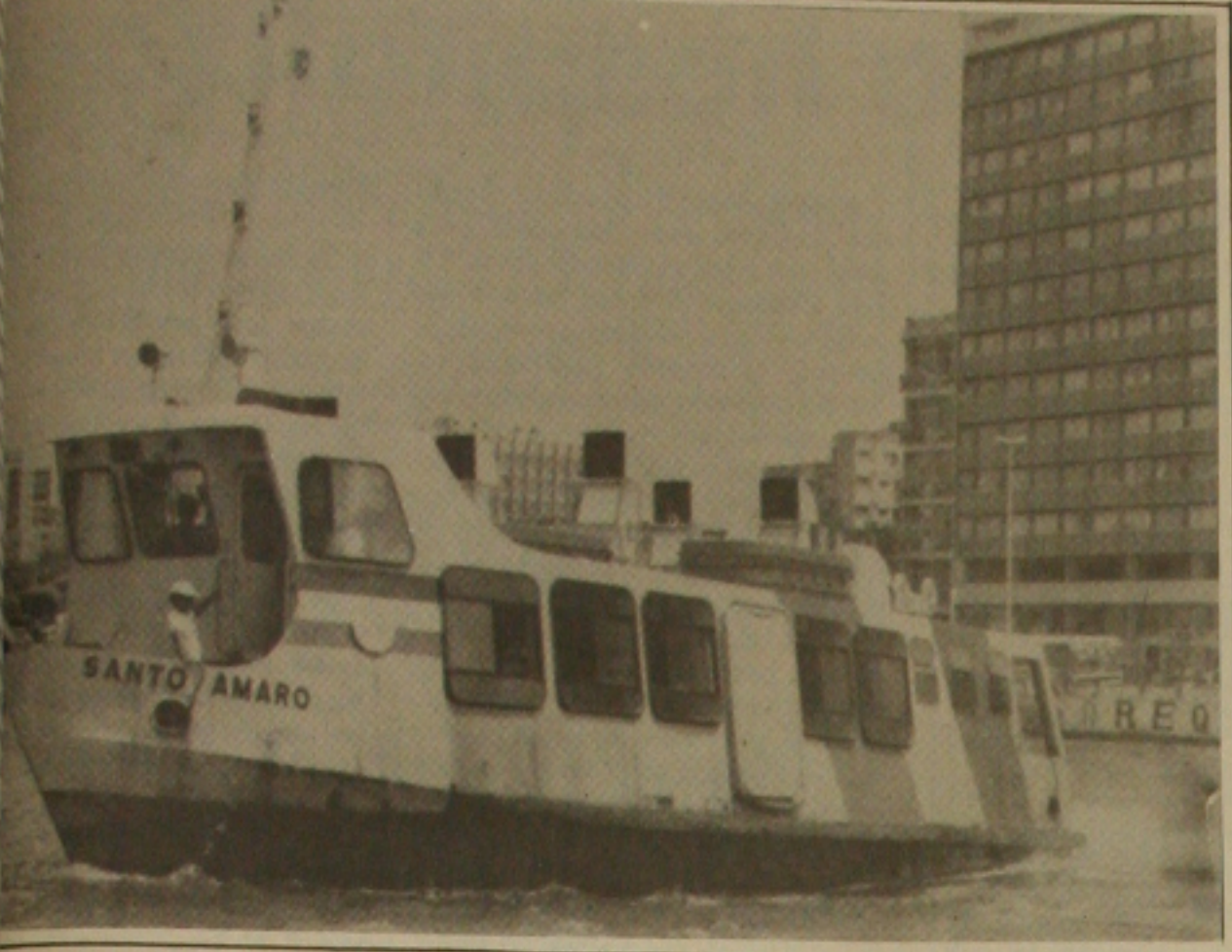
Os funcionários da Empresa Administradora de Portos em Sergipe (Sergiportos), que desde o último dia 12 de setembro vinham reivindicando uma reposição das perdas salariais de 187,90 por cento, aceitaram a contraproposta da empresa que foi um reajuste de 25 por cento neste mês e 5 por cento nos meses de outubro, novembro e dezembro.

A decisão foi tomada por unanimidade, em assembleia geral da categoria, realizada a partir das 20:00 horas da última quinta-feira, na sede provisória da Associação Profissional dos Trabalhadores em Empresas de Transportes Marítimos e Fluviais no Estado de Sergipe, situada na rua João Pessoa, 320, sala