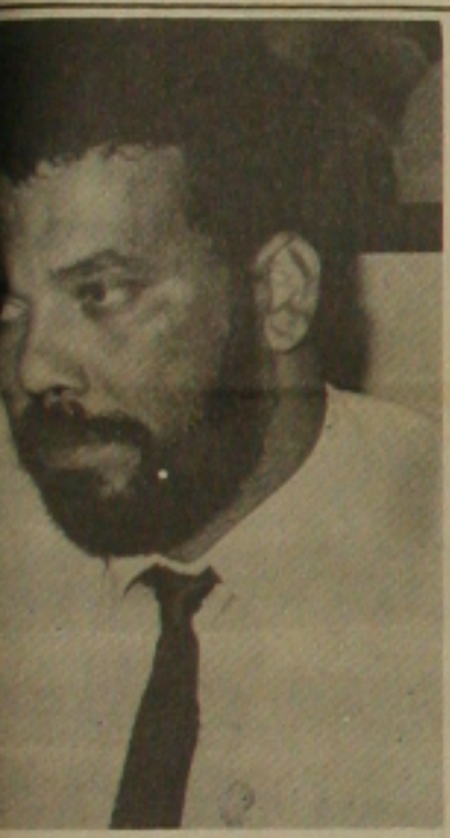
acha que acabou cabresto no interior.

ador ressaltou que o resultado da estadual irá se refletir no pleito de esso, alguns que não lograram êxito de outubro, se quiserem continuar política, devem começar a traba- ra, para colher os frutos depois. o é quem faz se ganhar eleição e gia só desgasta os políticos, por emos surpresas em outubro - con-