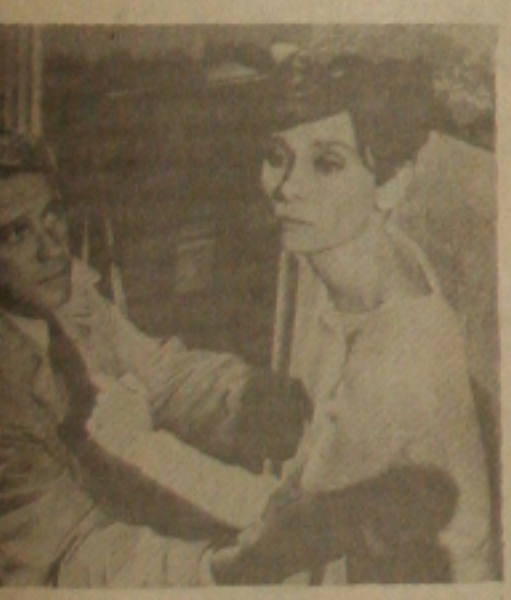
Cena do filme Um Clarão nas Trevas, na Sala VIP.