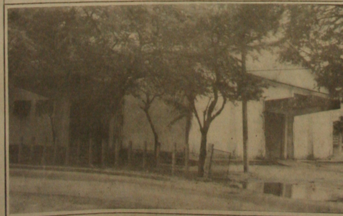
Companhia Brasileira de Armazenagem (Cibrazem).

tos pesqueiros poderão ser reajustados em elevados índices em caso da Cibrazem ser desativada em Sergipe. Os custos dos produtos pesqueiros poderão sofrer reajustes de índices superiores a 100 por cento uma vez que o gelo e o armazenamento fornecidos pela iniciativa privada são bem mais caros do que o fornecimento da Cibrazem. De acordo com a versão dos funcionários que não querem ser identificados, o Governo Federal no país já reduziu sensivelmente o número de funcionários na Cibrazem em todo o país. Em Sergipe até o momento não houve qualquer demissão. "Se ocorrer demissões aqui os postos da Cibrazem serão desativados uma vez que o número de funcionários é insuficiente para atender a todo o Estado", dizem os funcionários.