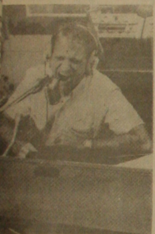
Robin Williams em "Bom Dia, Vietnã"