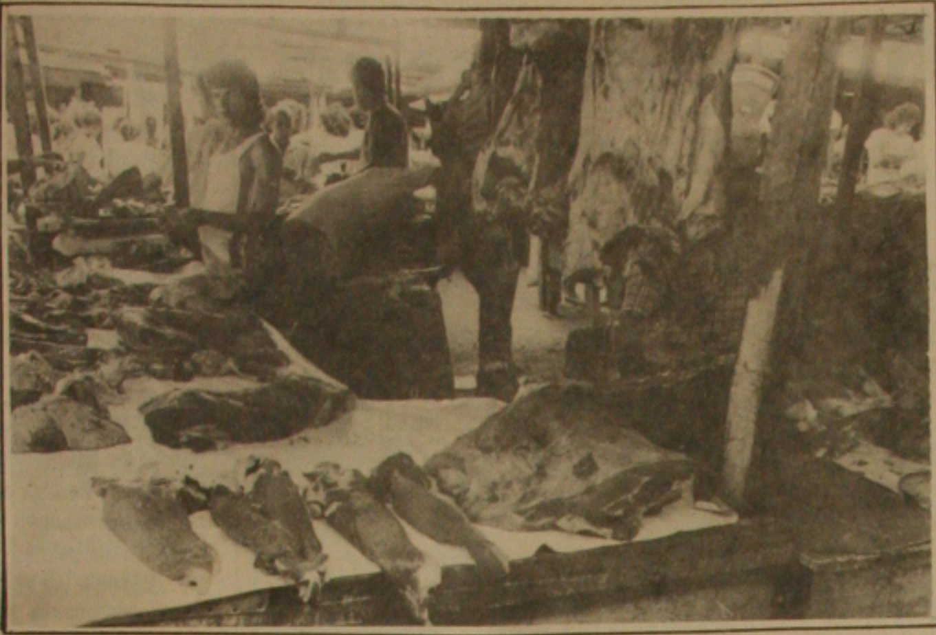
Caiu em trinta por cento a venda da carne bovina nos açougues da capital sergipana

Se comparado com os meses anteriores caiu em torno de 30 por cento a venda de carne bovina nos açougues da capital sergipana. Foi o que informaram os gerentes destes estabelecimentos comerciais entrevistados na tarde de ontem pela reportagem da Gazeta de Sergipe, ao acrescentarem que está sobrando o produto no mercado.