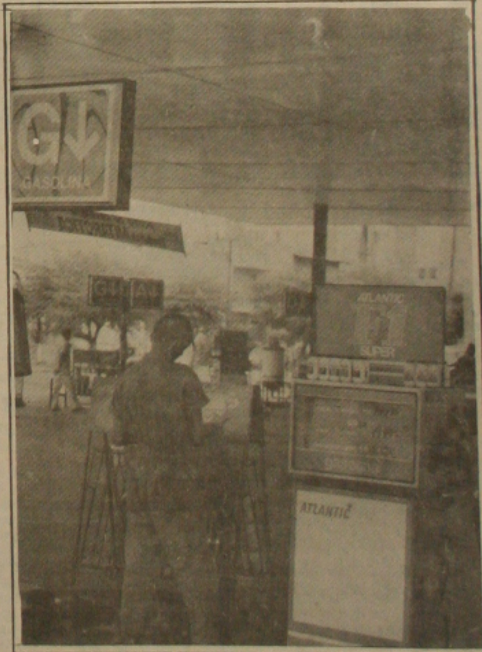
Fechamento dos postos de combustíveis não agrada aos comerciantes

A volta do fechamento dos postos de combustíveis à noite e aos domingos e feriados, como está sendo cogitada pelo Governo Federal para forçar a redução do consumo de gasolina, não tem a aprovação dos revendedores sergipanos, que chegam a não só duvidar da sua eficiência, como não acreditam que realmente o Governo vai adotá-la. Para os proprietários de postos de combustíveis, o fechamento dos postos somente provocará prejuízos para os consumidores e problemas para os trabalhadores. Eles apostam no desemprego e estão certos de que com o fechamento dos postos, o consumo não cairá e lembram que a medida já foi praticada quando da crise dos anos 70 e não surtiu os efeitos previstos na época. O fechamento dos postos é uma das sugestões que estão sendo discutidas pelos técnicos do Governo para o enfrentamento da crise de abastecimento. (Página - 1-B).