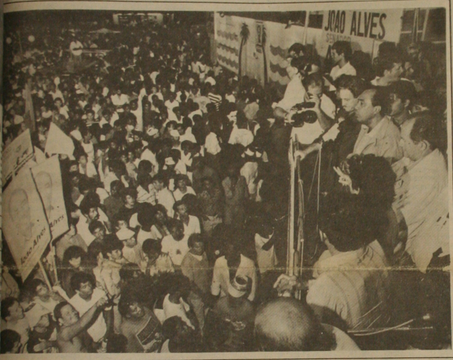
Centenas de pessoas presentes no grande comício de ontem na Praça Fausto Cardoso, que marcou o fim da campanha eleitoral da União por Sergipe