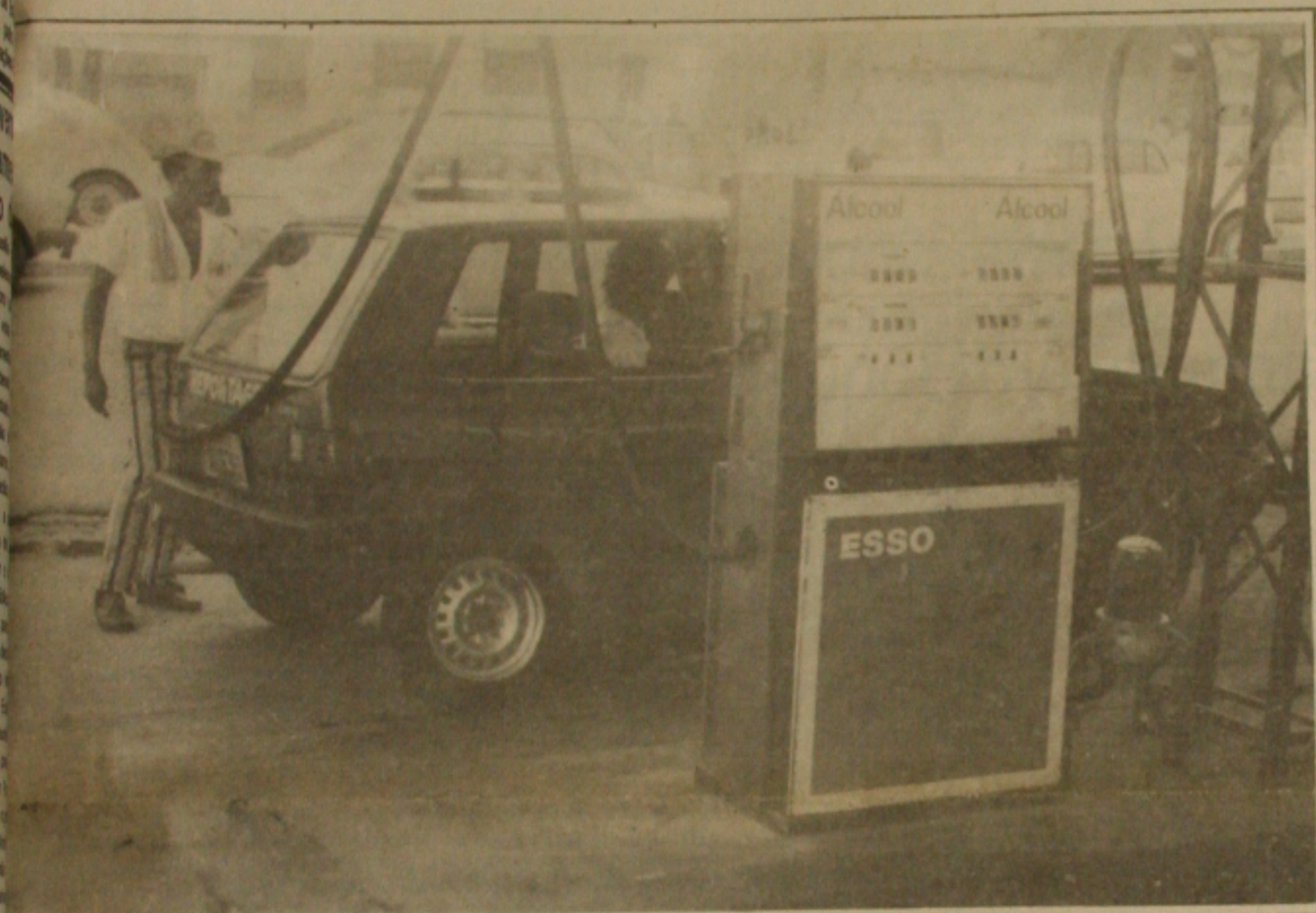
Proprietários de postos de gasolina não querem os mesmos fechados aos domingos.