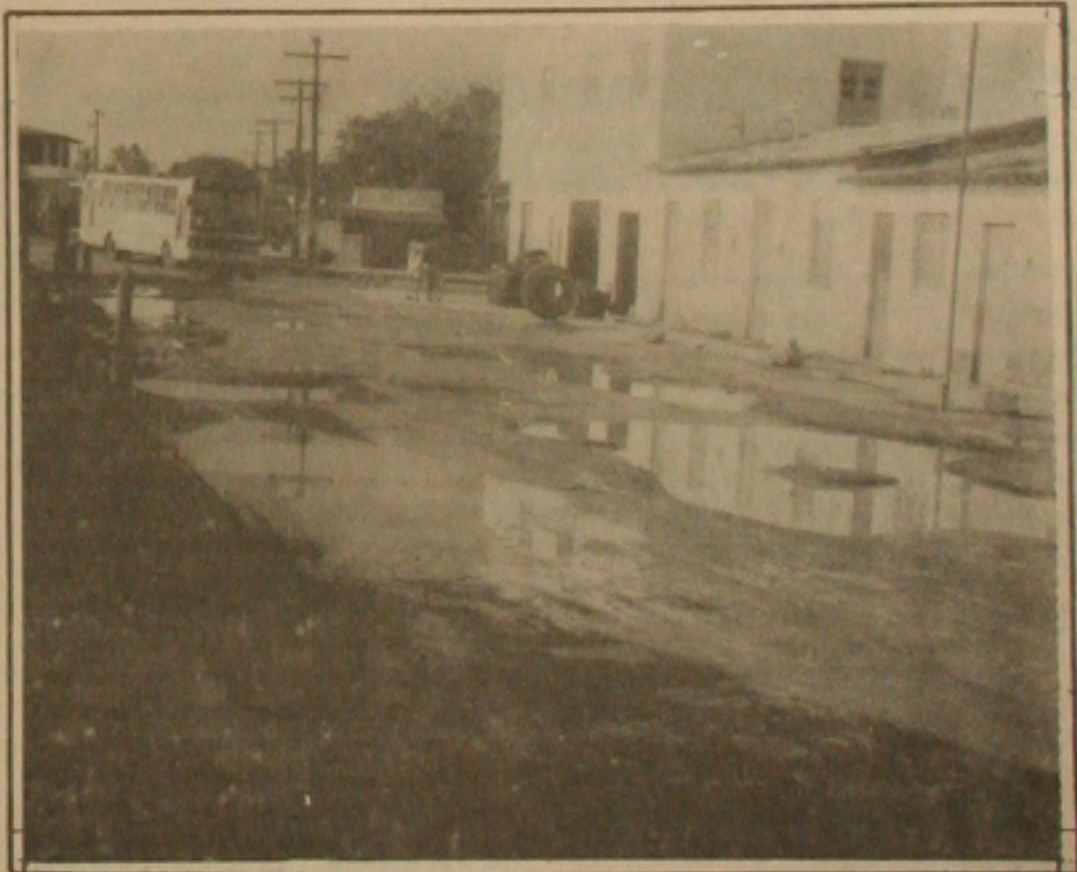
As chuvas que estão caindo em Aracaju desde quarta-feira, abrem mais buracos nas ruas da capital e a PMA nada faz.

Por todos estes transtornos os denunciantes reivindicam ao prefeito de Aracaju que de uma vez por todas acabe com estes dois problemas para que todos possam viver com tranquilidade.