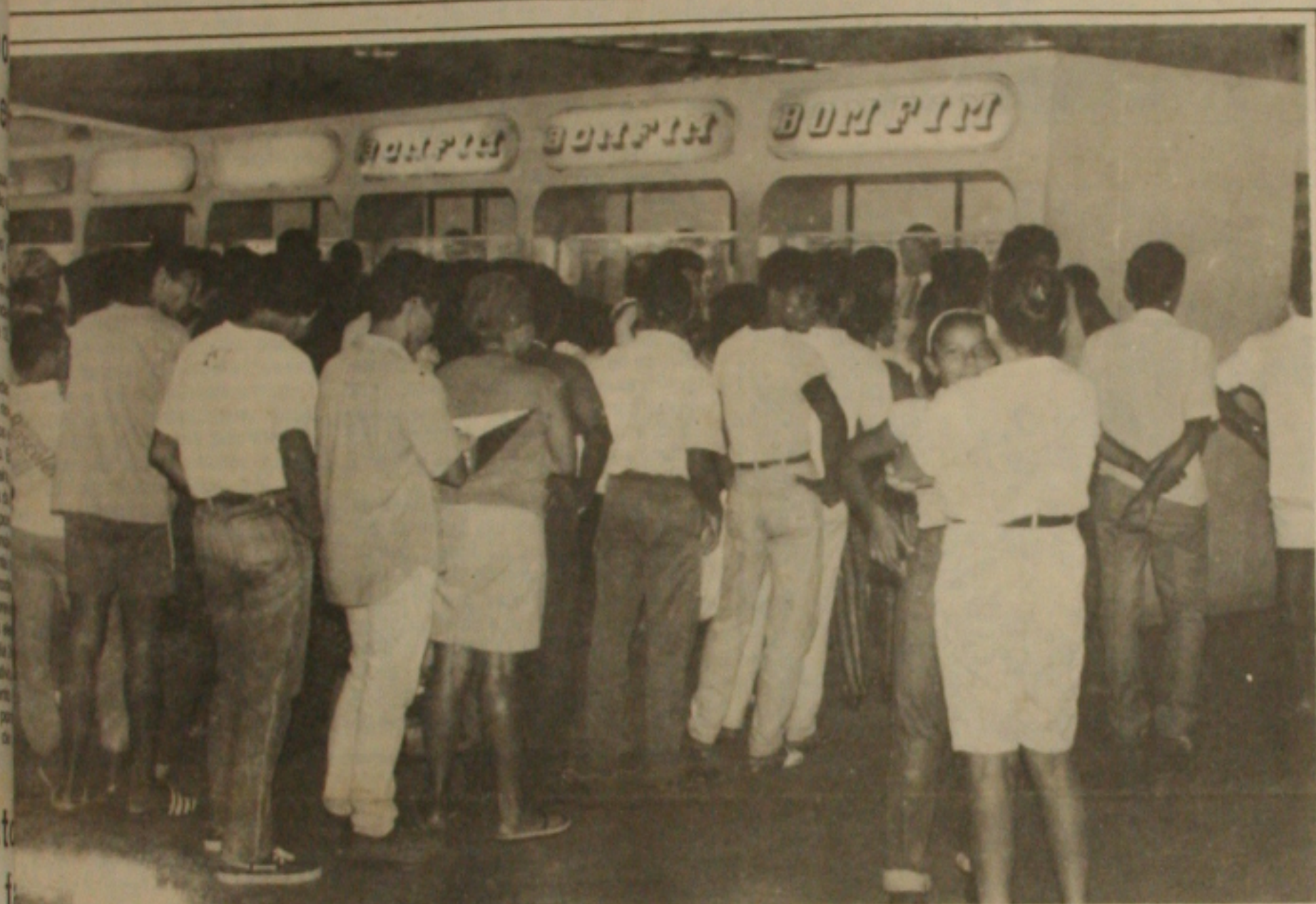
...a procura de passageiros no Terminal Rodoviário.

É grande a procura de passagens no Terminal Rodoviário Governador José Rollemberg Leite para o interior do Estado. As empresas que fazem as linhas para as cidades do interior, já estão se preparando para colocar, ainda hoje, ônibus extras uma vez que ontem as passagens em horário normal para hoje e amanhã foram esgotadas.