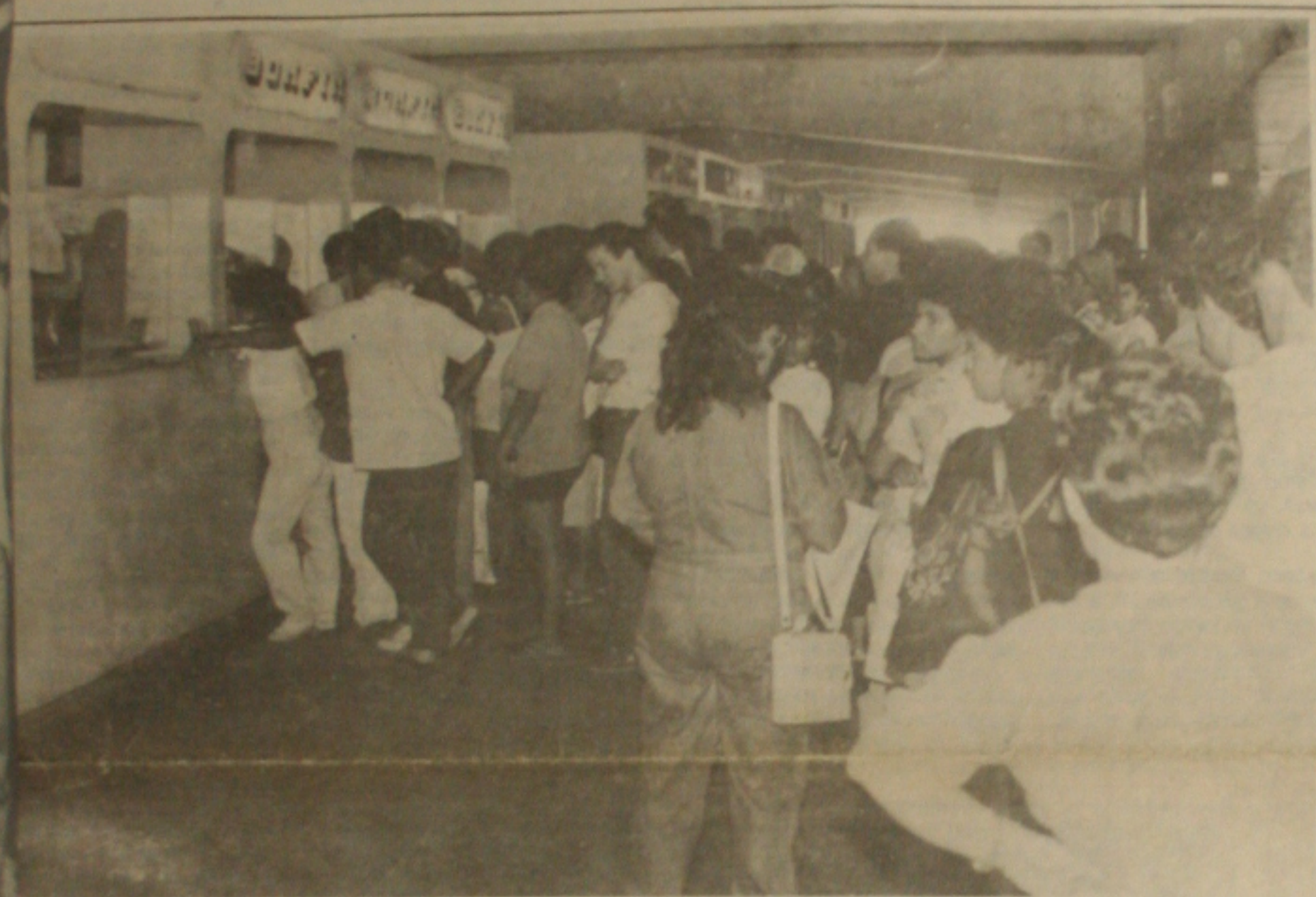
Quichês em Terminal Rodoviário, os eleitores que votam no interior do Estado, procuram com antecedência comprar passagens para voltar amanhã em suas cidades de origem.

Os candidatos que afixaram propaganda ou picharam as paredes dos prédios públicos e particulares que funcionarão como seção eleitoral, têm prazo até hoje à noite para providenciar a completa limpeza dos prédios. Foi o que anunciou ontem o juiz eleitoral, José Emidio Nascimento, responsável pela propaganda política. Ontem mesmo ele se reuniu com dirigentes de partidos políticos e comunicou a determinação.