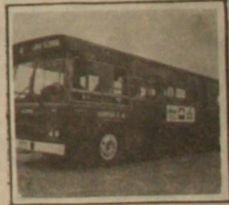
Outra empresa para servir o povo

Os empresários do setor de transportes estão considerando o preço da tarifa, atualmente estabelecido em Cr$ 16,00, defasado e por esta razão pretendem ainda hoje encaminhar planilha de custos à Superintendência Municipal dos Transportes Urbanos (SMTU), reivindicando um reajuste médio de 80 por cento. Em caso da reivindicação ser atendida após as eleições o usuário poderá estar pagando cerca de Cr$ 26 pela tarifa dos transportes urbanos em Aracaju.