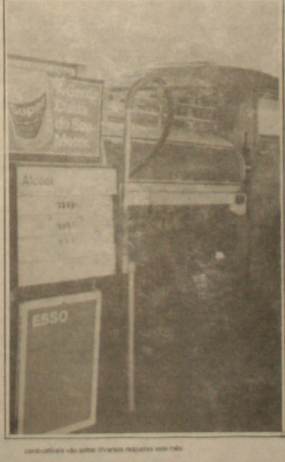
Combustíveis vão sofrer diversos reajustes este mês.

Junto com os aumentos de preços estão sendo decididos mecanismos financeiros que compensem o restante da defasagem. Além da redução dos prazos de pagamento para a Petrobrás (hoje o pagamento é feito com 60 dias, em média, após o recebimento dos combustíveis, e a estatal quer receber em dois dias).