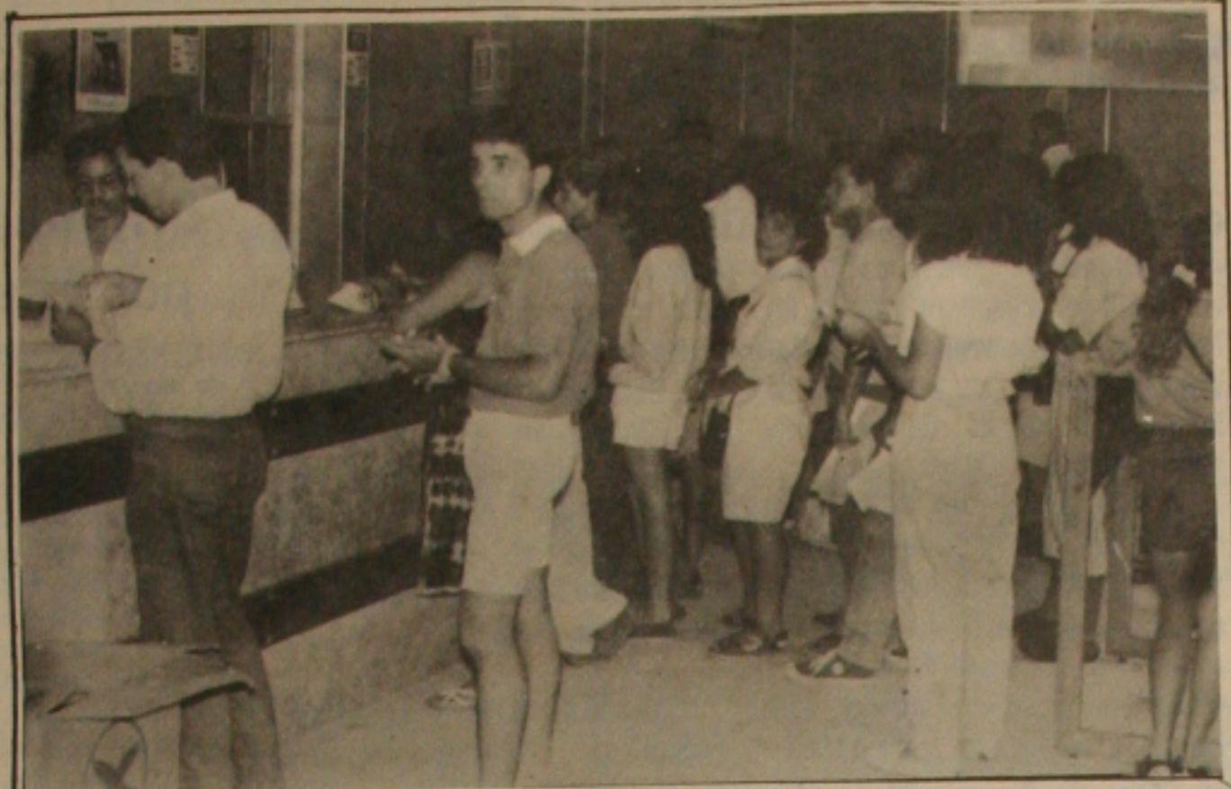
Apesar do pequeno movimento, a ECT vendeu até sábado, três justificativas eleitorais

Para os comerciantes, as leis que são feitas para proteger a população, não sendo usadas agora deixam a população desprovida, é o caso dos comerciantes que estão sendo penalizados pela falta de segurança, praticando crimes contra a propriedade da própria