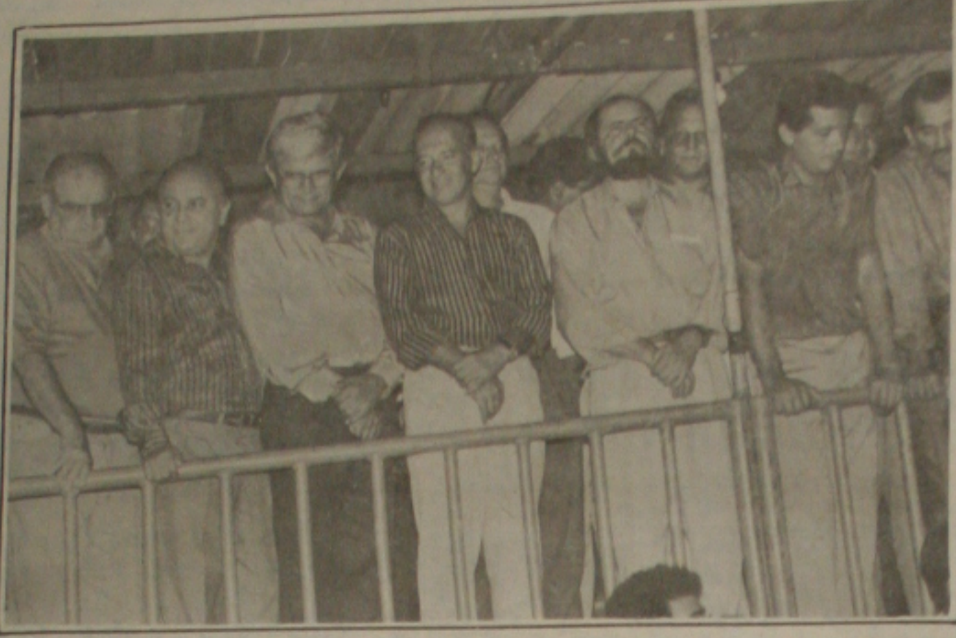
Valadares vai à festa da Laranja em Boquim