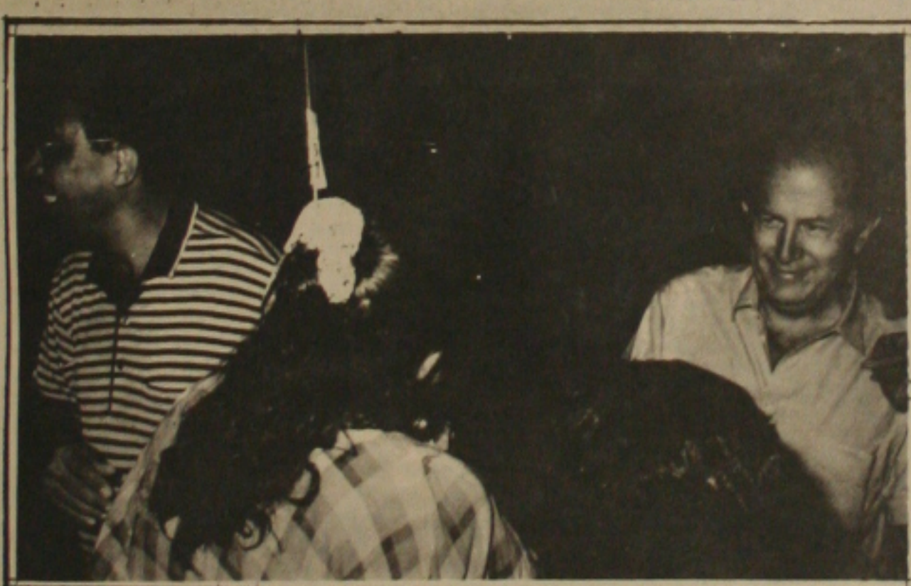
Os candidatos da União por Sergipe acham que o eleitor é o vencedor