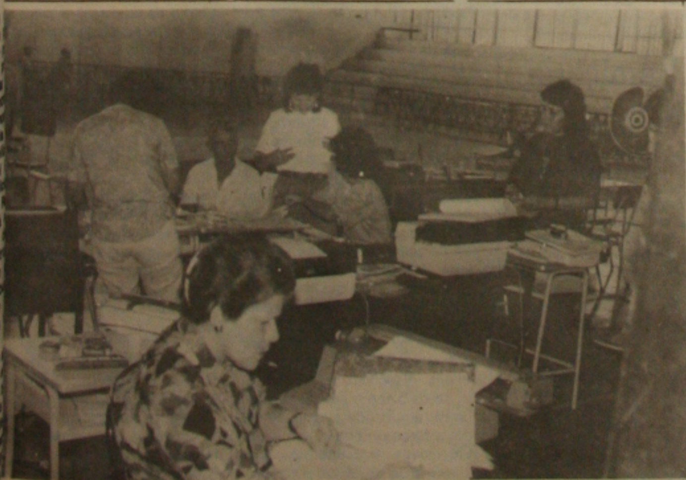
Primeira Zona Eleitoral está preparada, afirma Juiz.