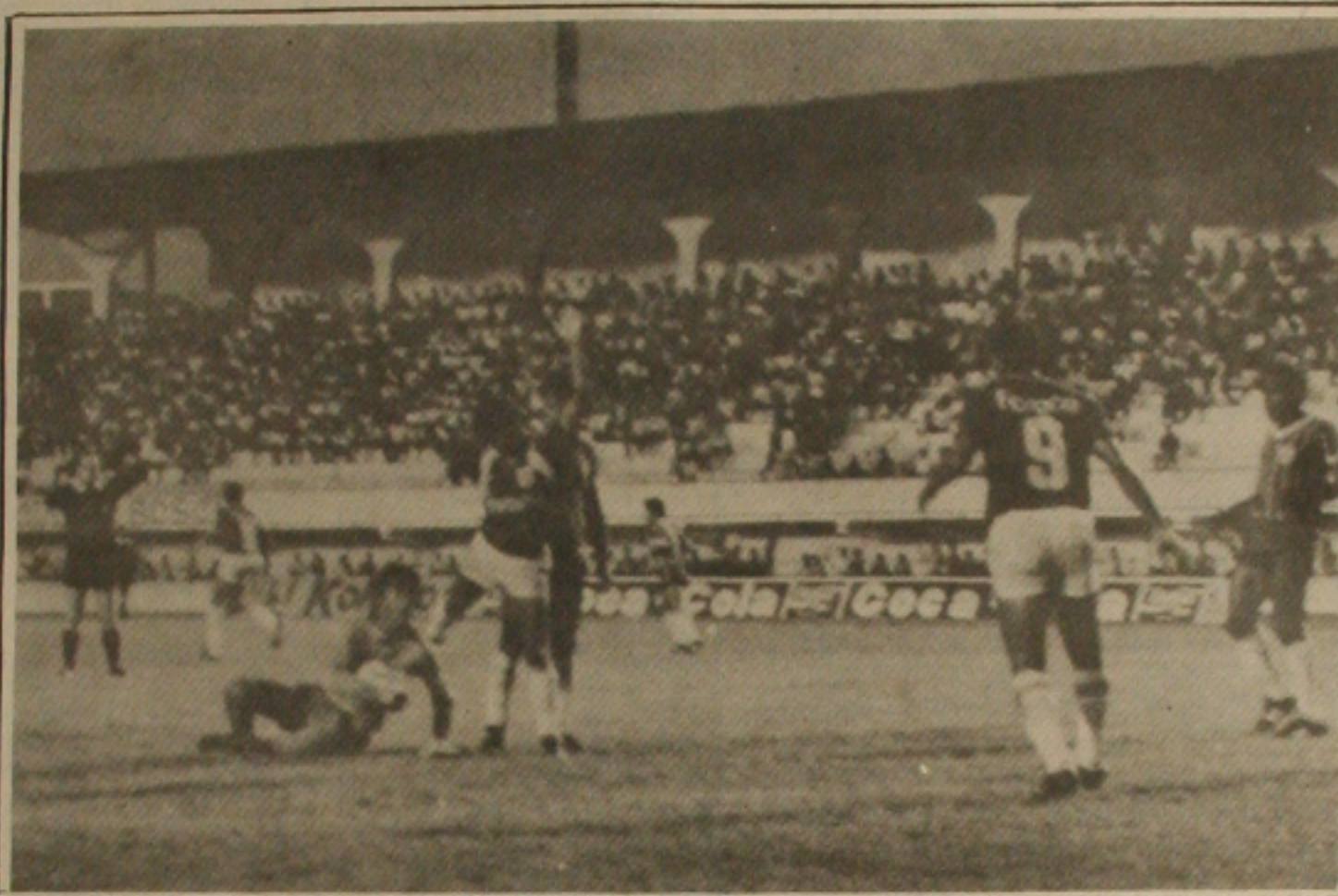
O Sergipe não soube aproveitar as oportunidades de gols surgidas em campo, cedendo às pressões do Itabaiana.

Nem mesmo mudando de técnico o Sergipe conseguiu obter o que mais deseja neste campeonato estadual: a vitória. Empatou domingo com o Itabaiana em 0 a 0 no Estádio Lourival Baptista, quando poderia ter vencido a partida porque criou-se várias oportunidades de gols que não foram convertidas pelos jogadores rubros, principalmente pelo ataque.