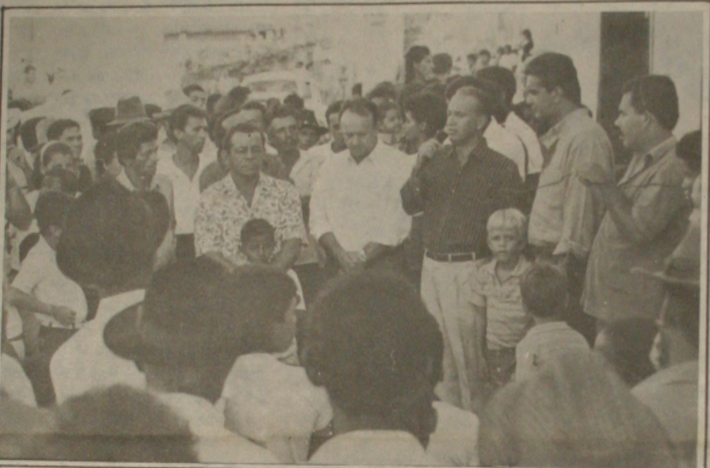
participa de inaugurações em Pedrinhas