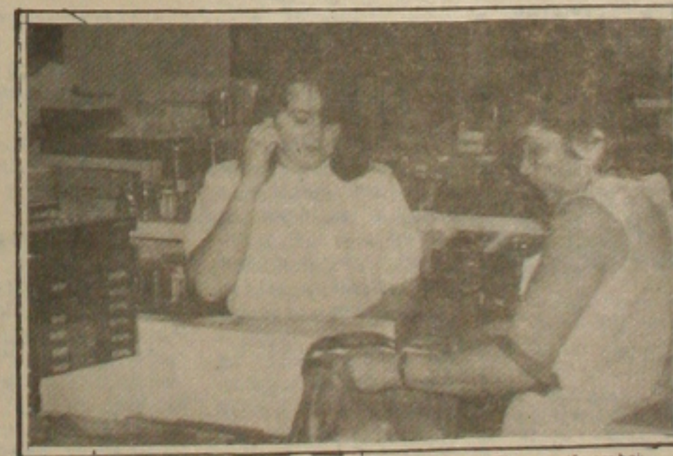
Mesmo com todas as promoções, as vendas no Shopping Center Riomar estão em baixa.

Existem na SSP funcionários, principalmente colocados à disposição oriundos de outros órgãos, exercendo funções diversas, inclusive até burocráticas, mas portando armas. A medida foi justamente para retirar as armas dessas pessoas e entregá-las aos policiais que efetivamente delas necessitam