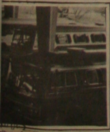
Ônibus não cumprem horários e prejudicam usuários.

Não é só o pessoal que trabalha no Escritório Regional da Codevasf em Propriá, mas também que exerce funções na Diretoria Regional da Secretaria de Educação em Japaratinga. Essas pessoas nunca se em horário devido descumprimento do horário fornecido pelo próprio Departamento de Estradas de Rodagem. Os passageiros não sabem mais quem procurar para causar a ineficiência do serviço que deveria cobrar do horário para não causar prejuízo a quem necessita desse tipo de transporte.