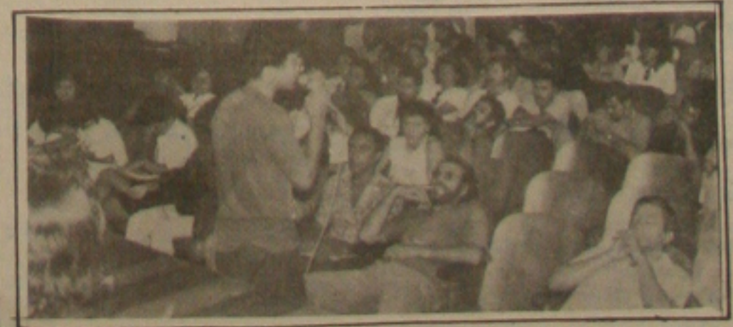
Previdenciários permanecem com atividades paralisadas.

Para avaliar o movimento grevista e tomar novas decisões, os previdenciários estarão reunidos em assembleia geral na próxima sexta-feira no auditório do Inamps Suzana Santos, o movimento somente poderá ser suspenso se o governo federal decidir negociar as perdas salariais e os dias paralisados.