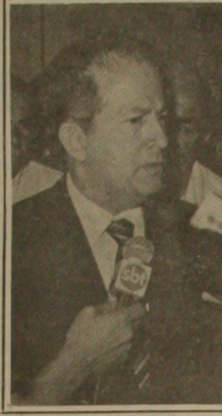
Albano Franco: senador