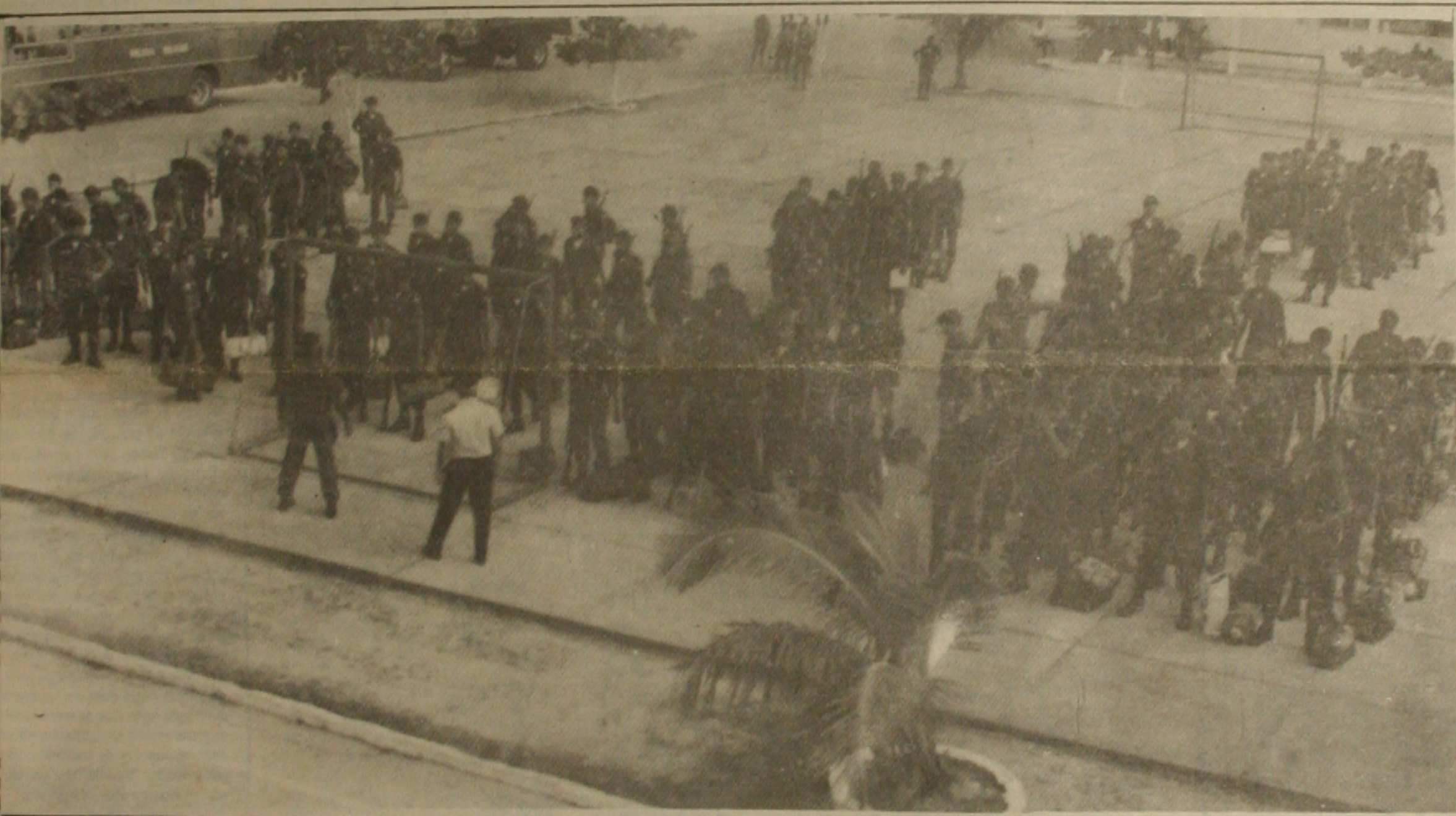
Antes do embarque, as tropas da Polícia Militar foram formadas no pátio interno do Quartel Geral, para as últimas instruções do comando.