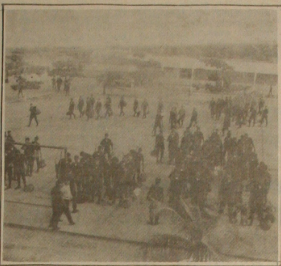
A PM está pronta para garantir eleições em todo o Estado e ontem reforços já foram enviados para o interior.