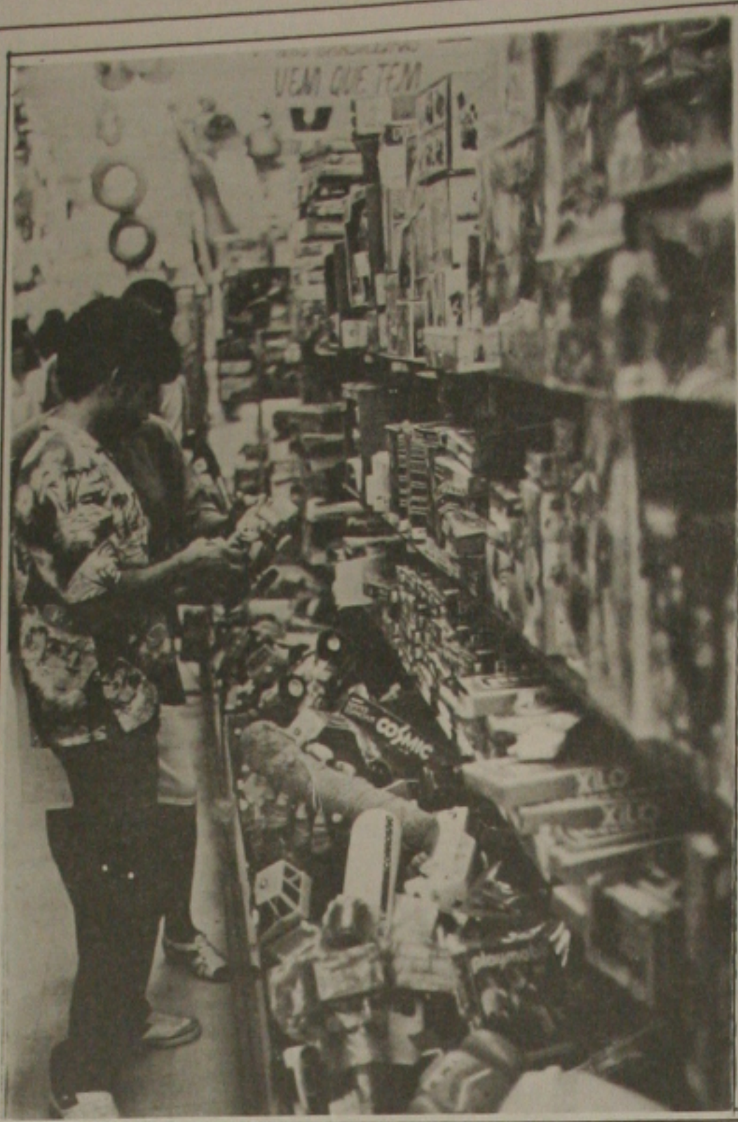
As lojas começam a vender bem brinquedos para o dia da criança

O primeiro movimento do Círio é a transladação, uma procissão que se realiza no sábado à noite, quando a imagem, fica guardada o ano inteiro no Colégio Gentil Bittencourt, é transportada para a Catedral, de onde sairá, às sete horas do dia seguinte, em direção à Basílica. Depois da procissão vem o tradicional almoço do Círio, que equivale, para os paraenses, à ceia de Natal. As famílias de todos os níveis reúnem-se, como no Natal, para a refeição em que não pode faltar o pato-no-lucupi, um dos mais saborosos pratos da culinária paraense.