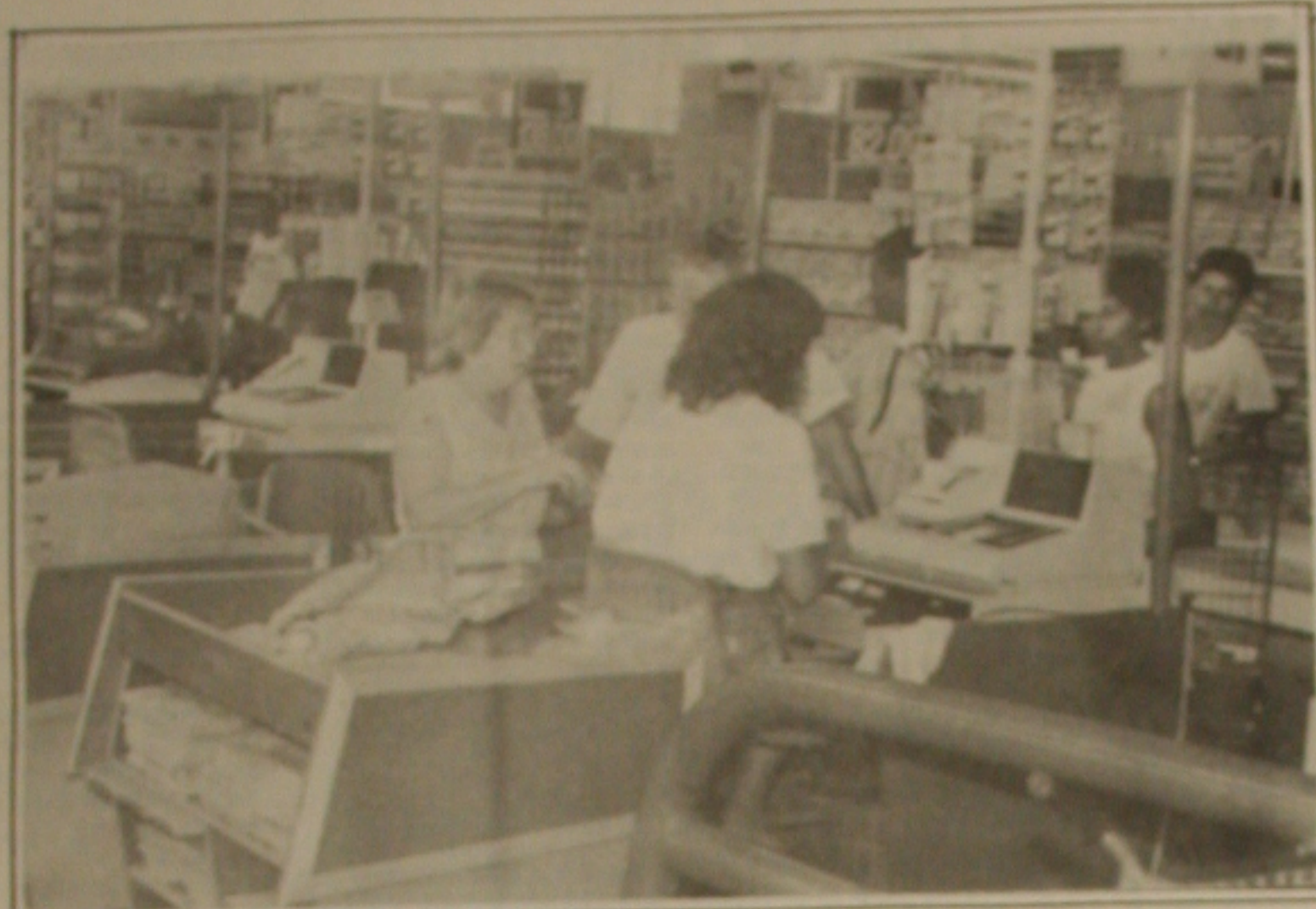
A Receita Federal está apertando o cerco contra os supermercados.