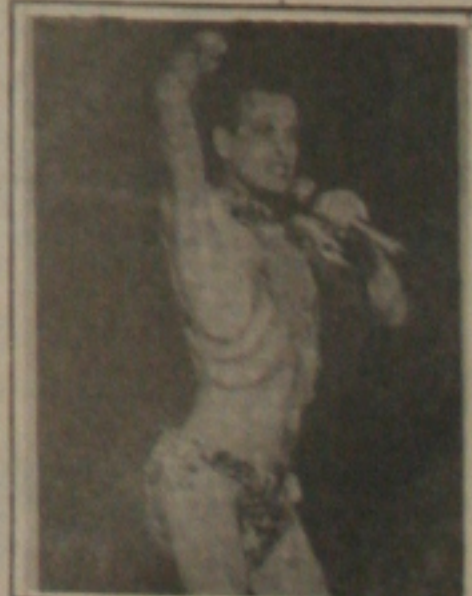
NEY MATOGROSSO se arma e ameaça quem lhe agourar com doença maliciosa

Ney Matogrosso está pânico com doença que se espalham. Confiado para processar boatos que ele é portador de Aids. Ele diz que os danos morais por causa e quer um alto ressarcimento. Na edição do Programa Domingo , o artista revelou evitado de todas as declarações a seu respeito. Ele vem levando uma vida bastante abstermia. E fica com as fofocas.