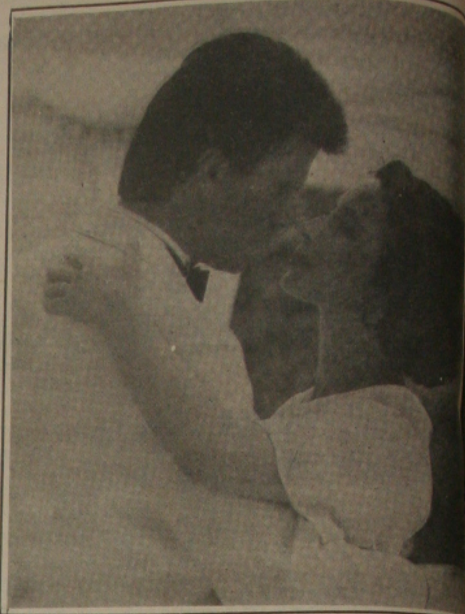
Ted Danson e Isabella Rossellini são os primos de "Um Toque de Infidelidade"