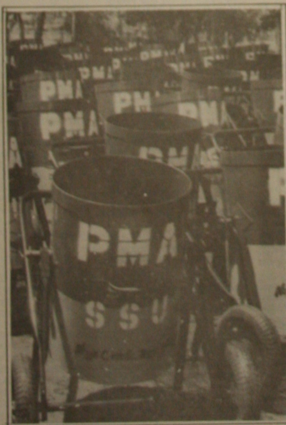
A Prefeitura adquiriu novos carros coletores de lixo.

O secretário acentuou que o crescimento de Aracaju, com novos conjuntos residenciais, faz com que aumente o volume de entulhos coletados, mas o prefeito Wellington Paixão está atento e não descuidou da limpeza da capital, que é uma das prioridades de sua administração.