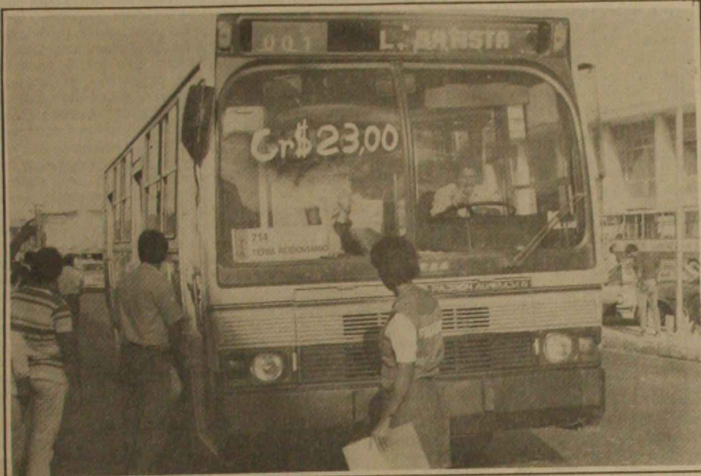
A tarifa única dos ônibus de Aracaju sobem hoje mais de 40%, passando de 16 para 23 cruzeiros.

Depois do crime, o assassino retornou imediatamente ao carro em que chegara e em velocidade rumou pela estrada em direção a cidade de Pedrinhas. O crime provocou transtorno na cidade e revoltou a população.