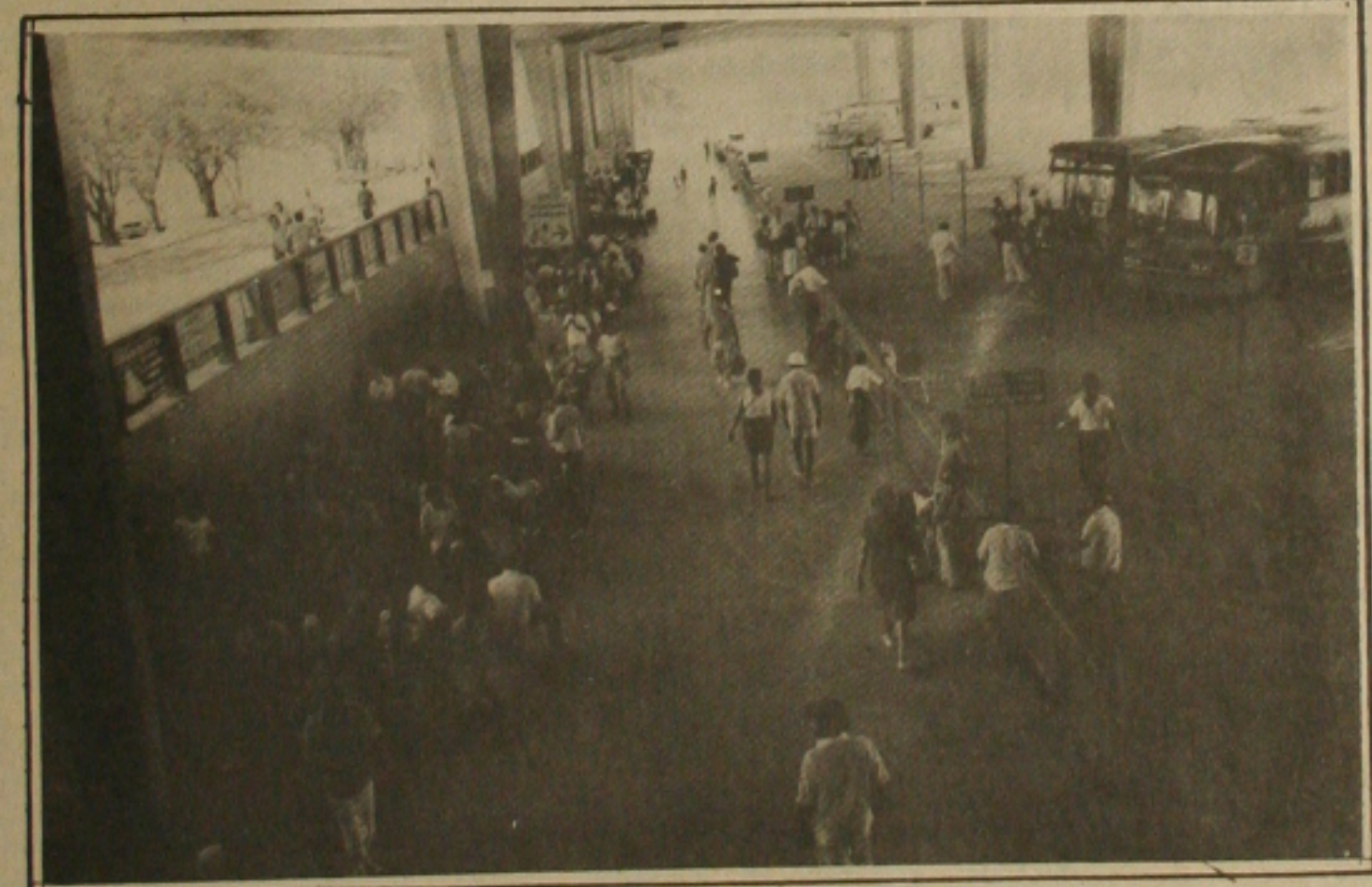
Apesar do "feriadão", o movimento no Terminal Rodoviário foi bem pequeno.

O encarregado disse acreditar que, fatalmente, não será colocado mais nenhum ônibus extra para esse final de semana, pois geralmente a procura da população por uma passagem normalmente ocorre dois dias antes da data prevista para o embarque, no caso desse final de semana, a procura deveria ser na quarta ou quinta-feira passada. Finalizou afirmando que, nem grandes filas foram formadas nos guichês das empresas nos últimos dois dias.