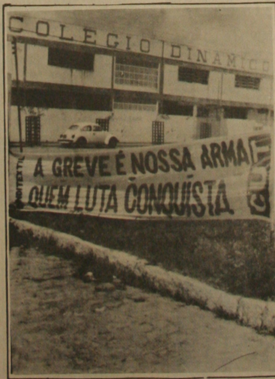
Professores continuam com as atividades paralisadas.

ções junto à diretoria do Colégio. Segundo avaliações dos grevistas, o movimento tem a adesão de aproximadamente 95% do professorado no Colégio Dinâmico. Ontem mesmo, por exemplo, apenas desenvolveram atividades normais 4 professores de um universo de 64 educadores.