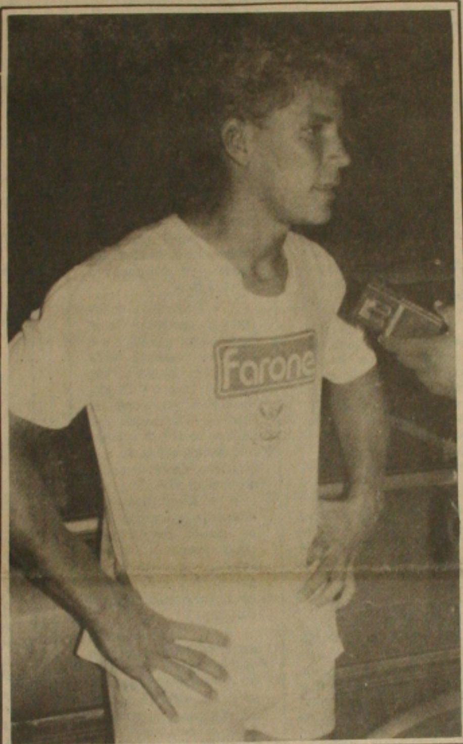
Ita espera uma reabilitação do Sergipe na partida de amanhã contra o Guarany, em Porto da Folha.

O Botafogo poderia ainda ter marcado o segundo gol, num lance em que Vivinho, lançado por Carlos Alberto Dias, aproveitou-se da falha de Veloso e ficou com o gol aberto a sua frente. Como estava meio desequilibrado, seu chute saiu fraco e Eduardo salvou em cima da linha.