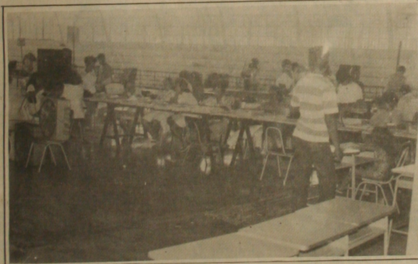
Depois da apuração dos votos, sobrou para os garis o recolhimento de mais de uma tonelada de papel e copos descartáveis.