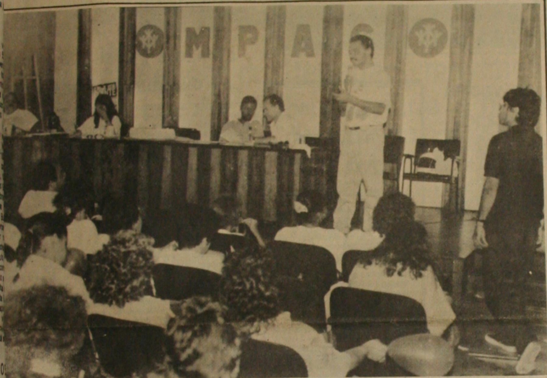
Previdenciários permanecem em greve pelas perdas salariais.

Os previdenciários completaram um mês ontem de greve e apostam na continuidade do movimento grevista até que o Governo Federal demonstre disponibilidade em negociar a reposição das perdas salariais acumuladas em mais de 290% e os dias paralisados. Na avaliação do Comando de Greve, os grevistas obtiveram alguns avanços nas cláusulas sociais durante as negociações com o Governo Federal.