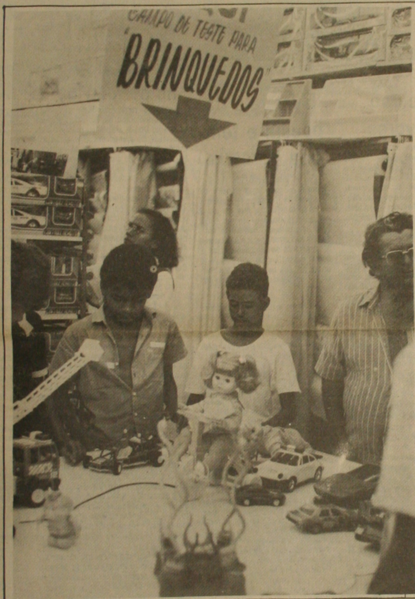
Brinquedos importados estão tendo boa aceitação em Aracaju.