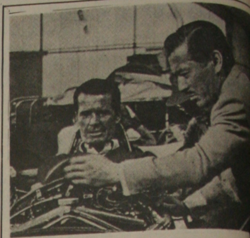
James Garner (à esquerda), em