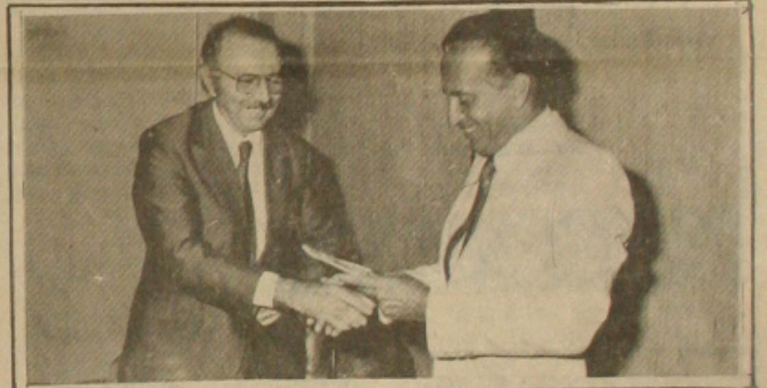
O Procurador Geral de Justiça entregou ontem ao Governador Antônio Carlos Valadares a Cartilha do Ministério Público.