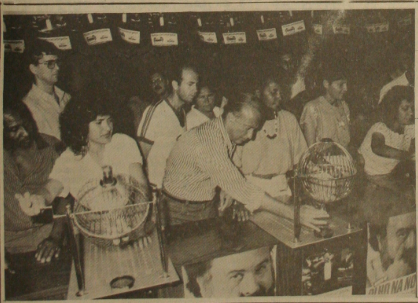
A Cohab vai convocar os ganhadores dos lotes. Na foto, o Governador tirando o primeiro sorteado.

Preservar significa não somente manter, mas, também, registrar, fotografar, efetuar, divulgar e conscientizar a população da realidade do problema, pois sem o respaldo popular, nenhum grupo, fora ou dentro do Governo, poderá concretizar suas ambições preservacionistas.