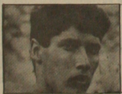
Bismarck: sempre na lista.

Se não pôde participar da primeira partida da Seleção sob o comando de Falcão - foi liberado a pedido do Vasco para que disputasse o jogo contra o Nacional de Medellín, válido pela Copa