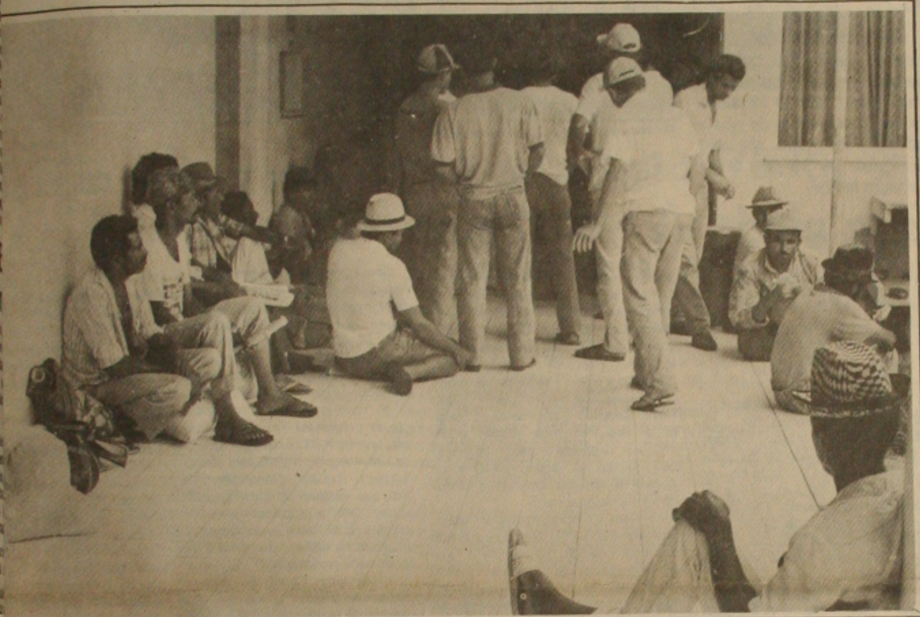
100 famílias ocupam uma fazenda em Santa Luzia do Itanhhy.

Cerca de 100 famílias ocuparam na madrugada de ontem uma fazenda, no município de Santa Luzia do Itanhhy, de propriedade do fazendeiro conhecido como José Valtor. A fazenda é passível de desapropriação por ser improdutiva e possui 500 hectares o suficiente para assegurar melhores condições de vida para as famílias dos sem terra, que permanecem acampadas naquelas propriedades.