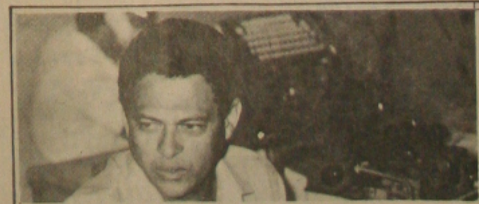
Djenal gostou do trabalho do TRE nas eleições

Agora já eleito, o parlamentar sergipano disse que volta a Brasília para cumprir novos compromissos com sua terra, o que fará da Tribuna nos contatos com autoridades ao