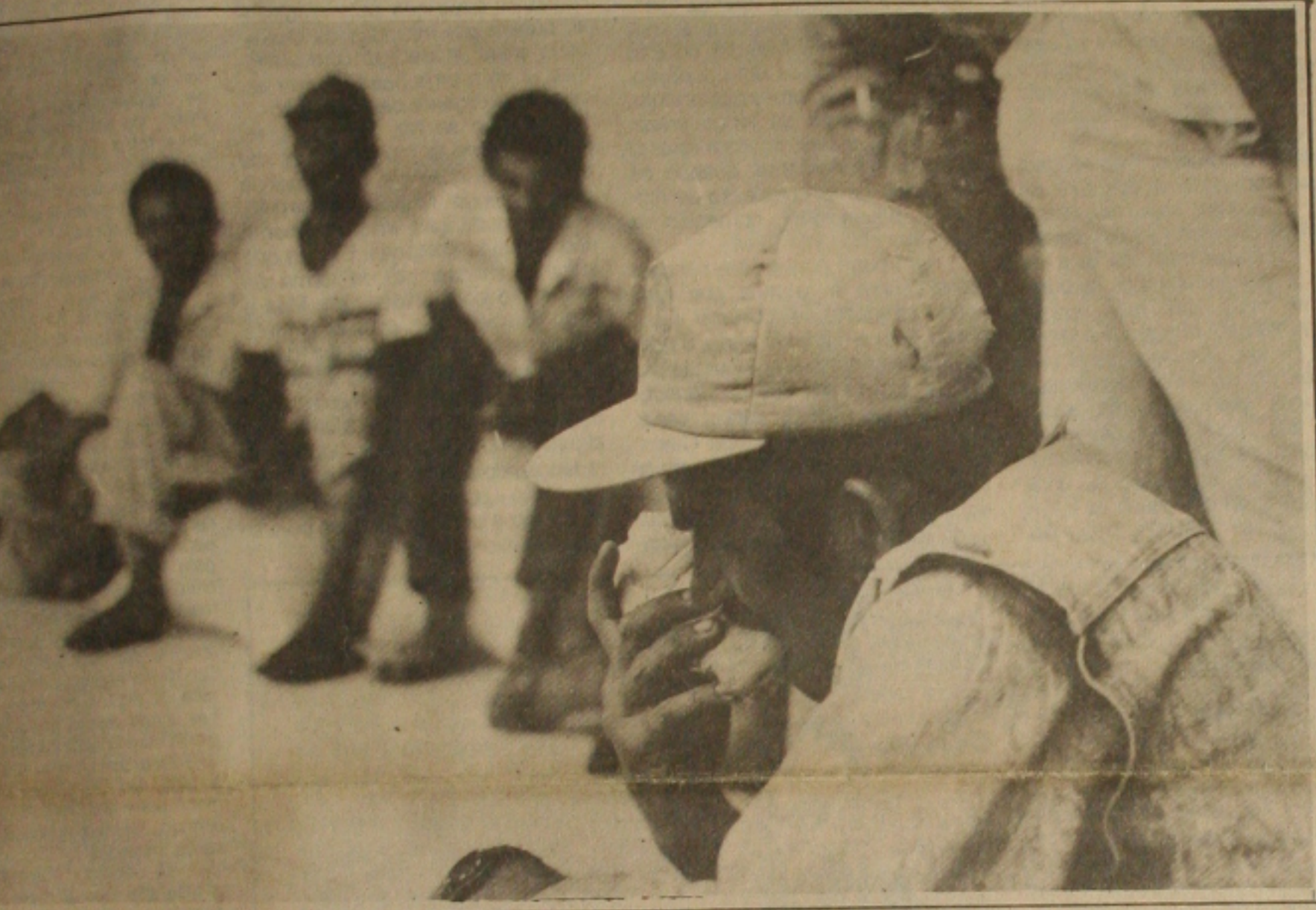
Produtor rural acampado no prédio do Inbra como um cachorro-quente, enquanto espera a liberação do crédito para produzir nas terras ocupadas no interior do Estado.