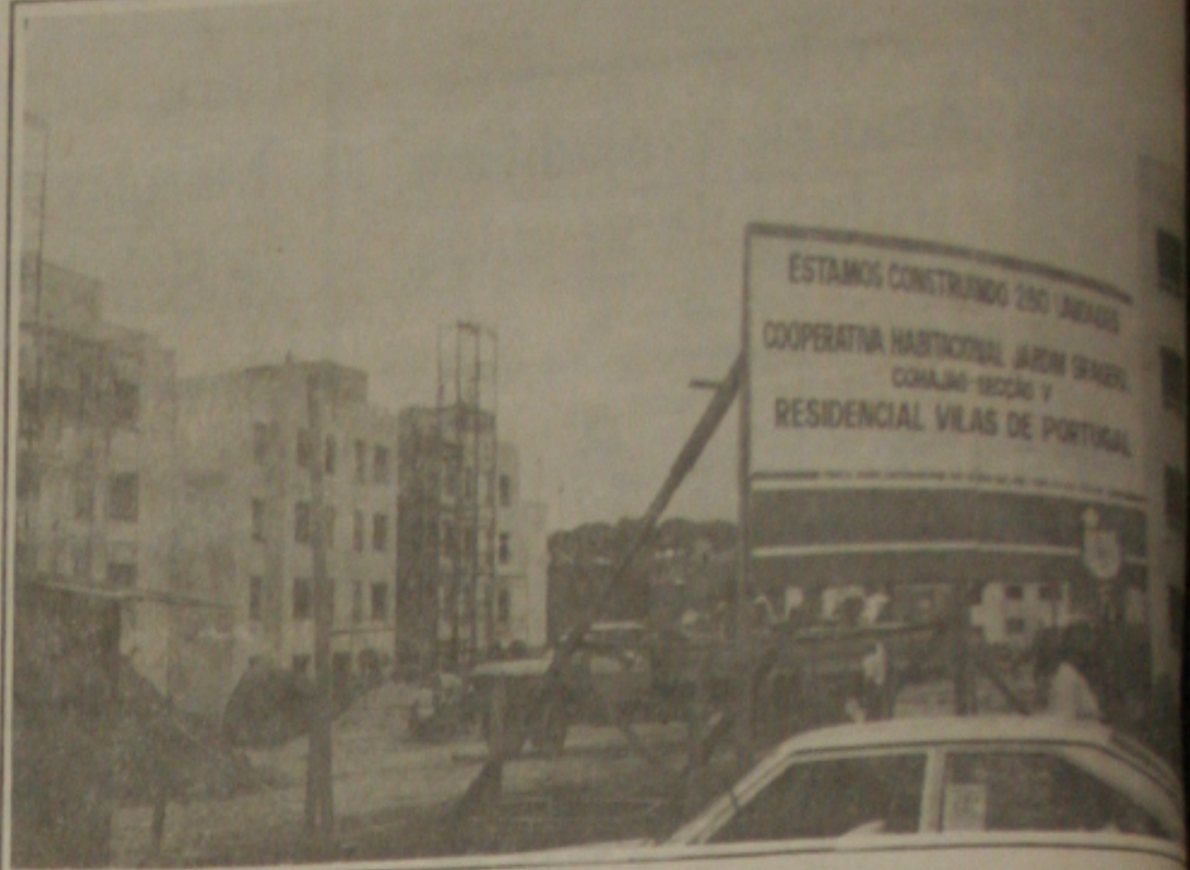
Os apartamentos da Inocoop não serão tomados.

- Da minha parte - disse - não gostaria de prejudicar nenhum mutuário porque que se inscreveu necessita de uma casa para morar. O jornalista se mostrou preocupado com a situação, entretanto, não pode fazer nada por ser uma determinação federal.