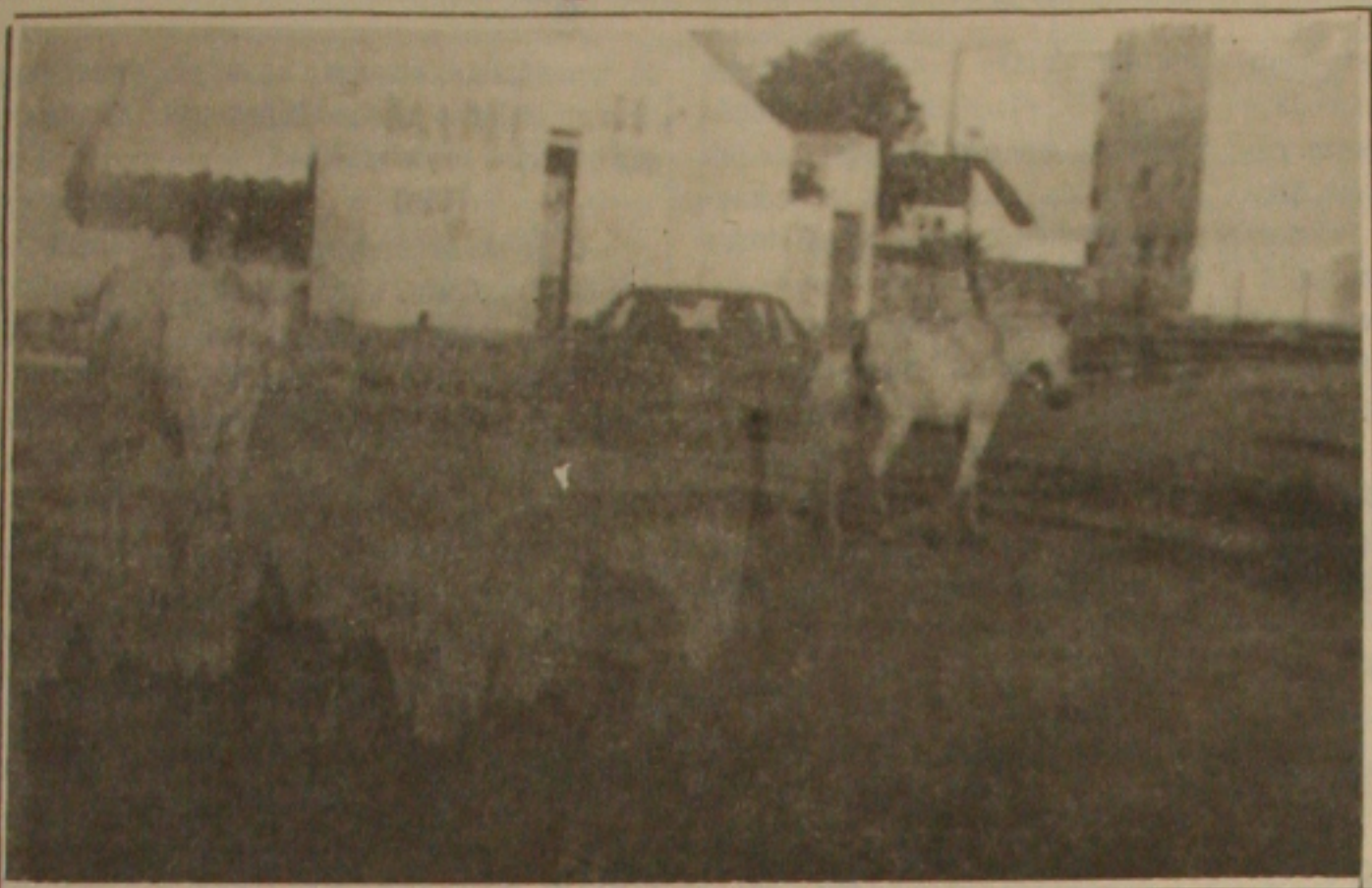
Os cavalos continuam soltos e "passeando" pelas ruas e avenidas de Aracaju, sem que a PMA adote qualquer providência.