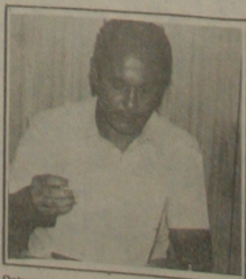
Delmo explica a barca

O presidente da Sergiportos confirmou a inauguração do "Barco do Novo Sergipe" para este sábado, acrescentando que ele estará funcionando com normalidade em todos os finais de semana, justamente para propiciar o melhor atendimento ao fluxo de passageiros que aumenta consideravelmente aos sábados e domingos, respectivamente.