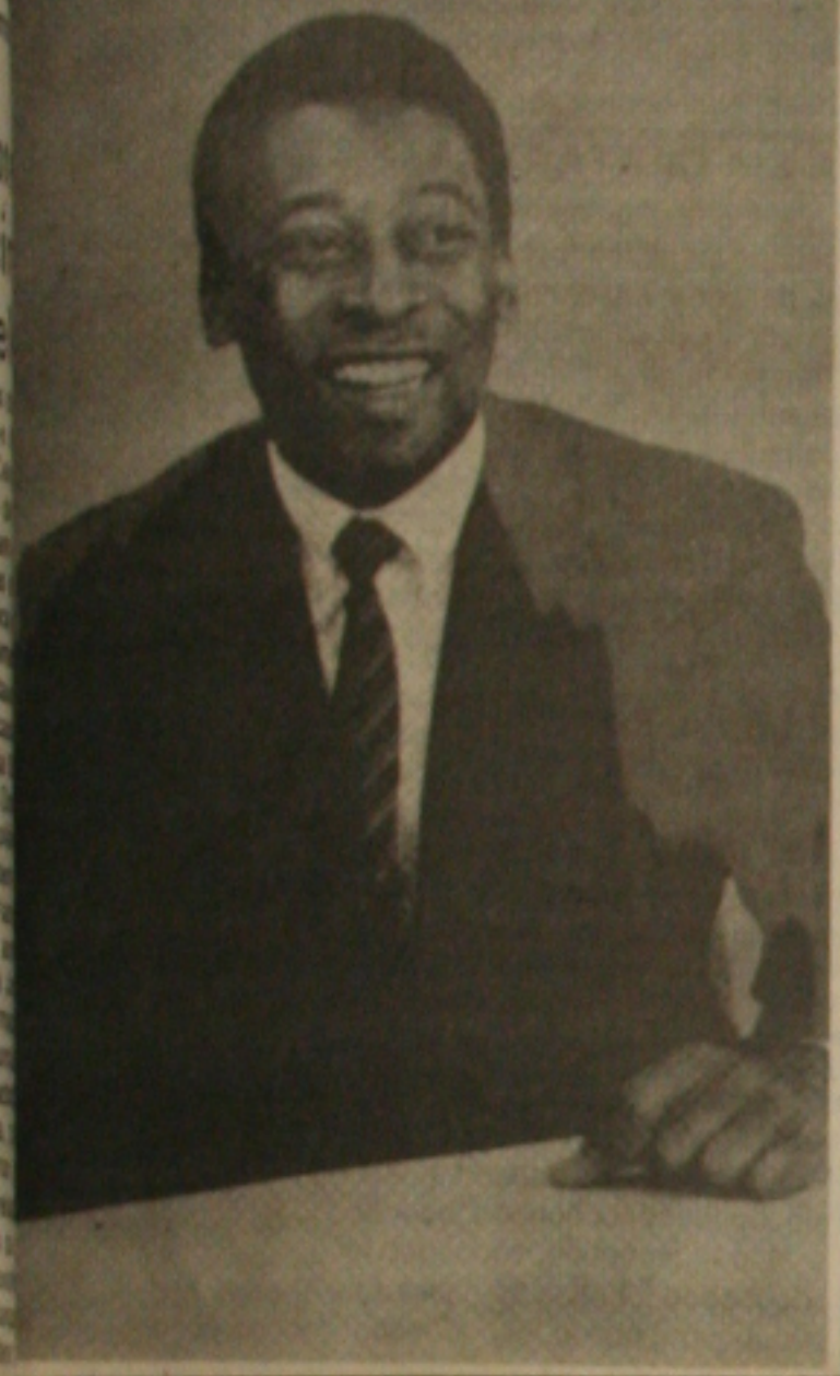
Pelé para os preparativos de festa dos seus cinquenta anos.