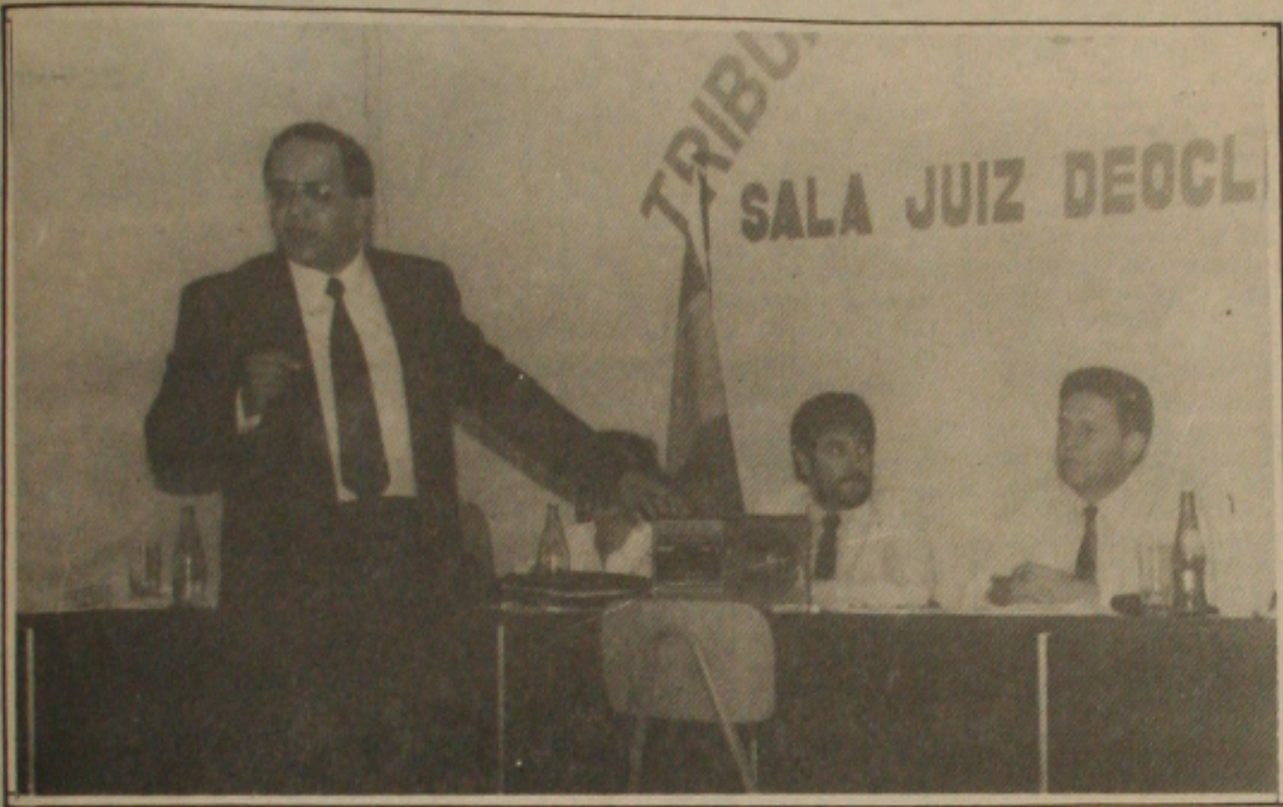
Gutemberg denuncia complô na FSF para favorecer ao Confiança.