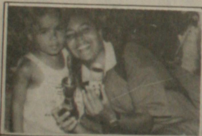
Contenta, a mãe exibe o troféu ganho pelo filho, na corrida de velocípedes.