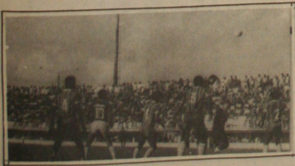
O Itabaiana não conseguiu vencer o Dragão, no Presidente Médici.

A primeira modificação no Itabaiana para a partida contra o Santa Cruz, será o deslocamento de Lima da lateral direita para a cabeça de área. Na defesa Ariston pretende fazer algumas modificações, mas não tem ainda os nomes definidos. Ontem o time treinou nos dois expedientes e hoje será realizado o primeiro coletivo da semana. A partida contra o Confiança foi considerada pelo treinador como um jogo normal. O resultado no entanto não foi o que os serranos esperavam.