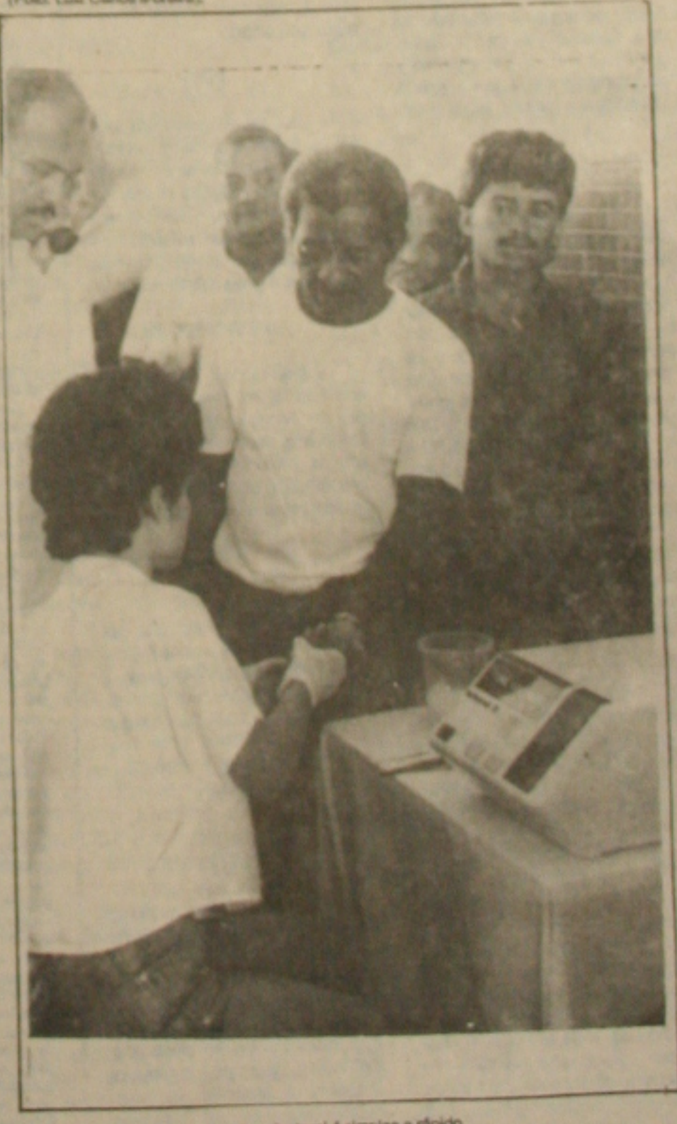
O exame para medir o índice de colesterol é simples e rápido.