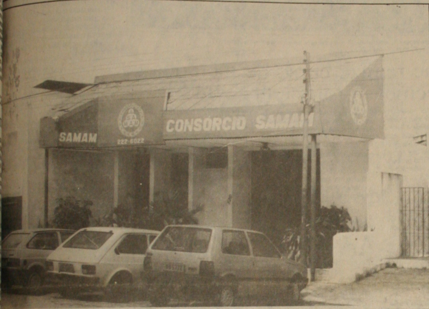
Condutores de veículos já pensam em demitir vendedores.

Em Sergipe muitas empresas de consórcio de veículos já estão pensando em demitir vendedores. Tudo isto em consequência das medidas adotadas pelo Governo Federal, que prorrogou por mais 90 dias a suspensão de formação de novos grupos de consórcio o que poderá, na avaliação de diretores de administradoras, sérios prejuízos para o setor.