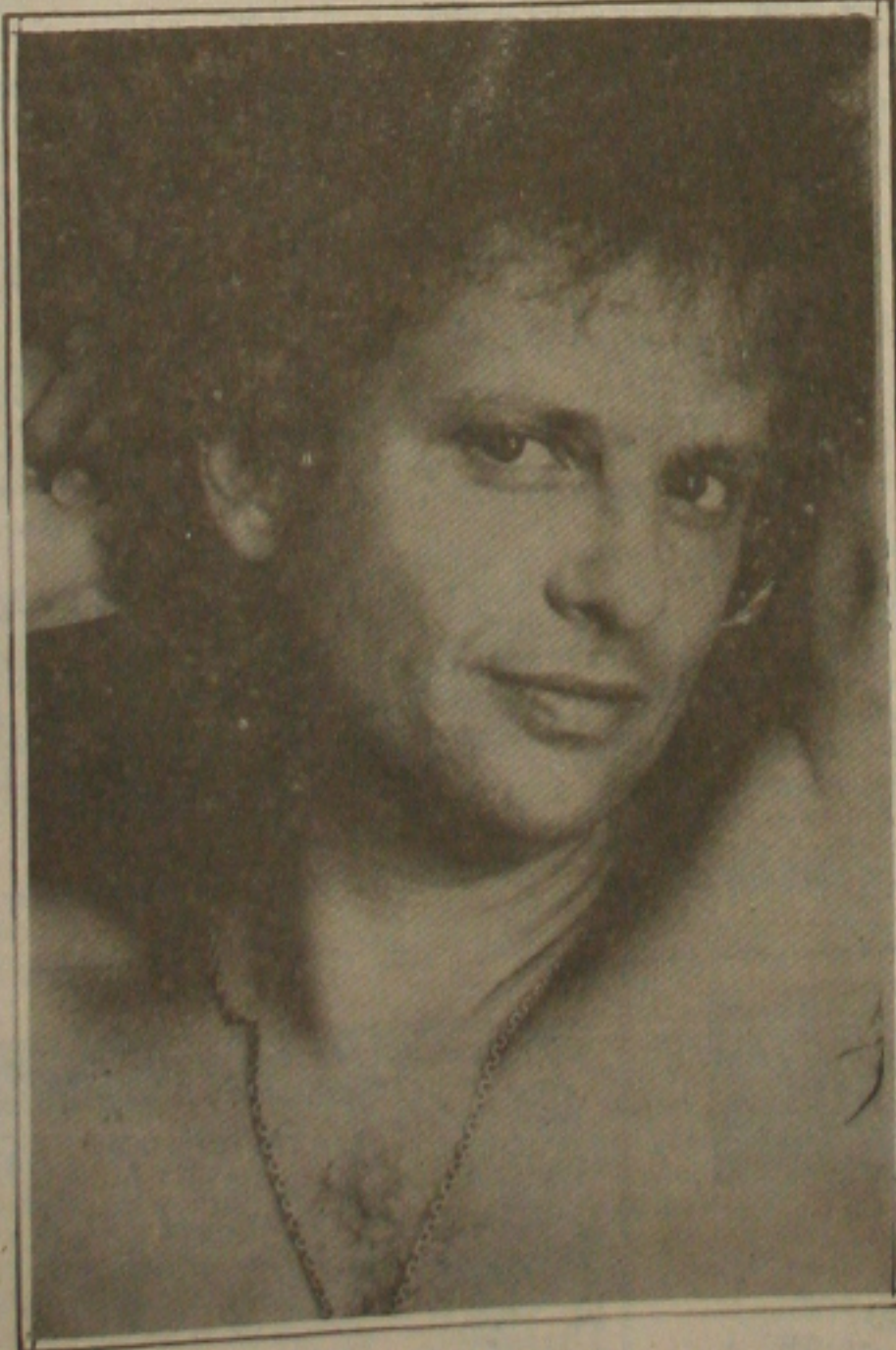
Guilherme Arantes sábado no "Vieirão".