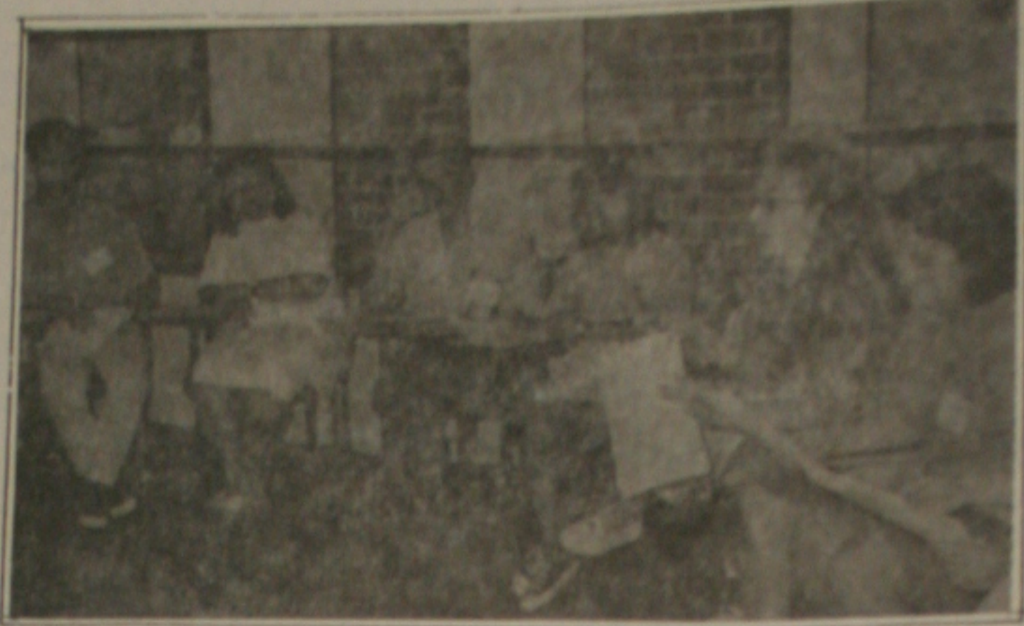
Com a participação de duas instrutoras, várias se aperfeiçoaram sobre os novos métodos e técnicas em formação profissional.