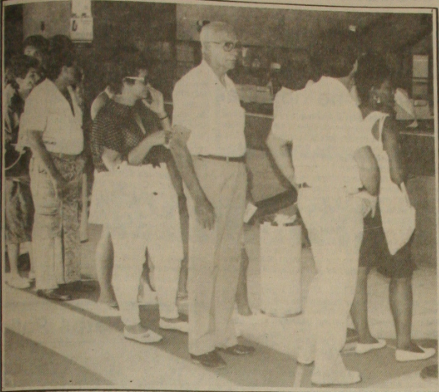
Face ao "feriadão", as filas bancárias no dia de ontem foram bastante longas.

Em decorrência do final de semana prolongado foi grande o movimento ontem nas agências bancárias da capital sergipana. Grandes filas se formaram nos guichês dos caixas logo nos primeiros minutos em que os bancos abriram suas portas ao público. Já no final da tarde foi bem menor o fluxo de pessoas, nestas instituições financeiras.