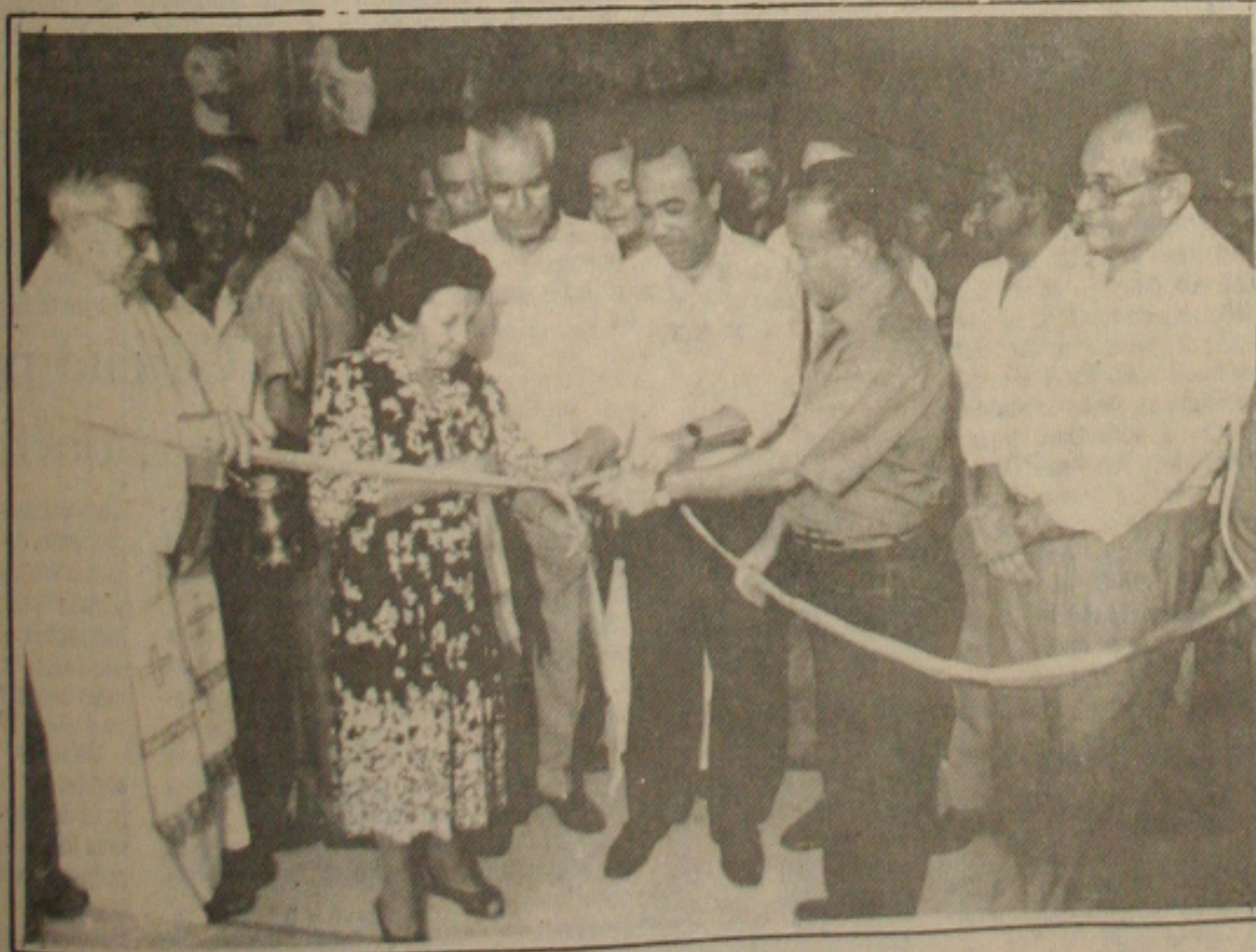
Inaugurar escolas e reformas as já existentes são metas do futuro Governo de Sergipe.