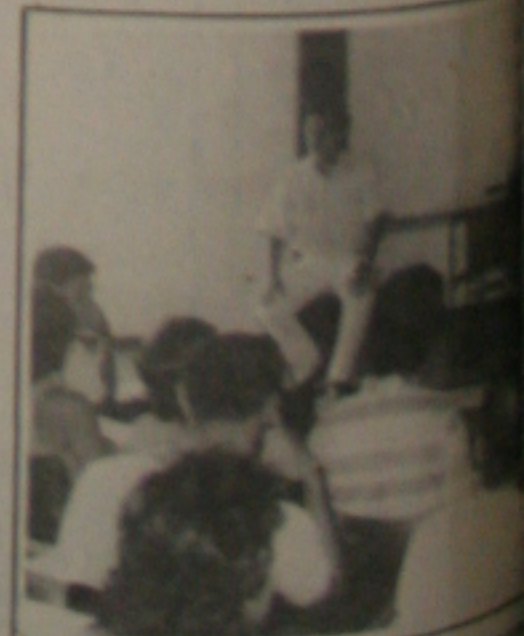
Secretaria de Saúde do Município promove reciclagem de agentes de saúde.