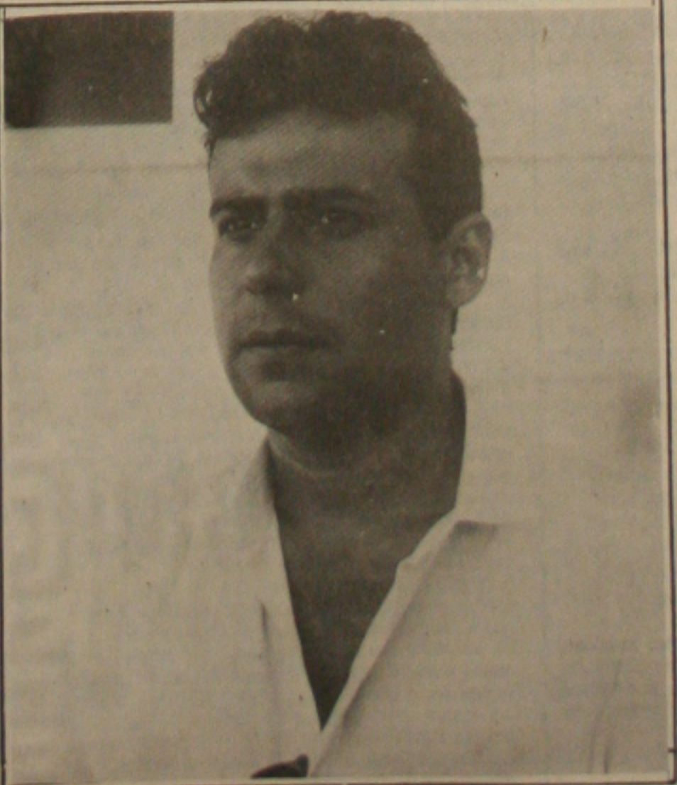
Garcez acha que o povo terá vantagem com novos congressistas.

O líder pefelista aposta em um entendimento amplo entre os 24 deputados e quanto a eleição da Mesa Diretora, ele continua reafirmando que é muito cedo para se pensar isso, visto que muita coisa ainda será votada até o final dessa legislatura.