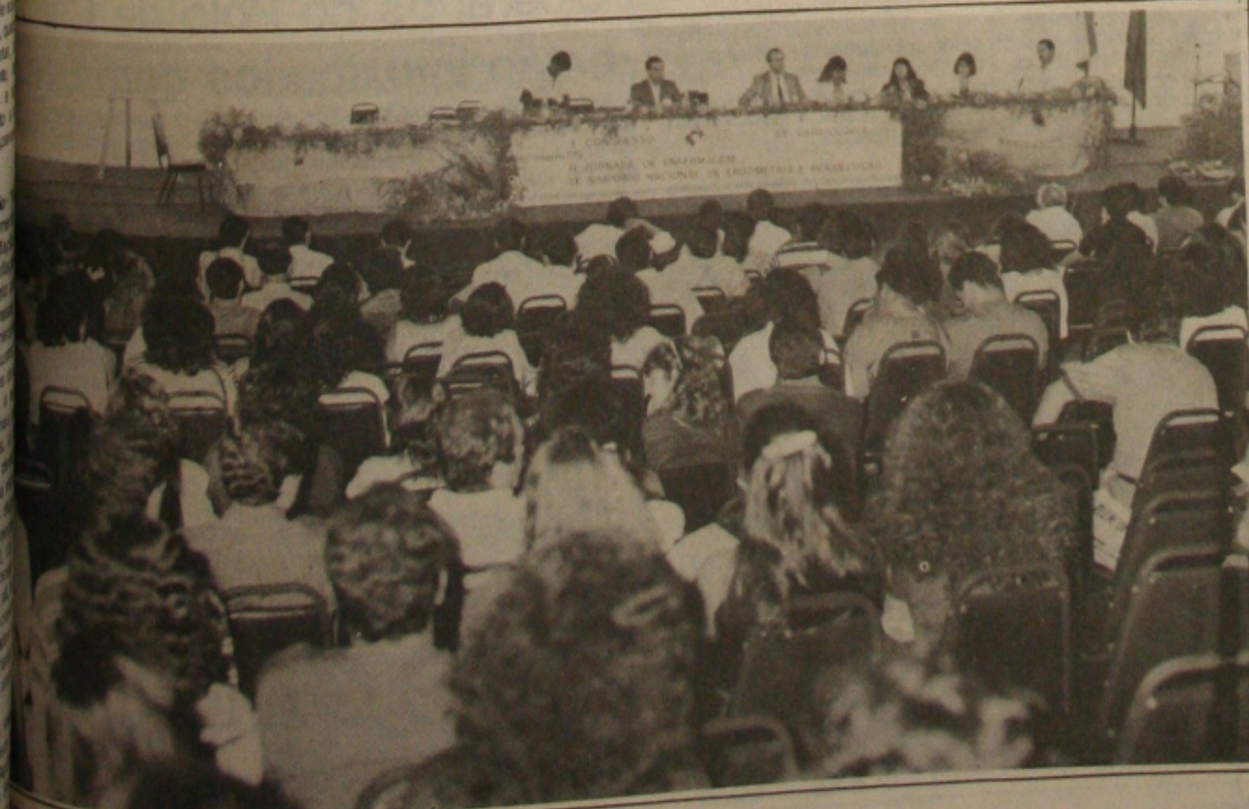
o Congresso de Cardiologia é encerrado com uma sessão de debates.