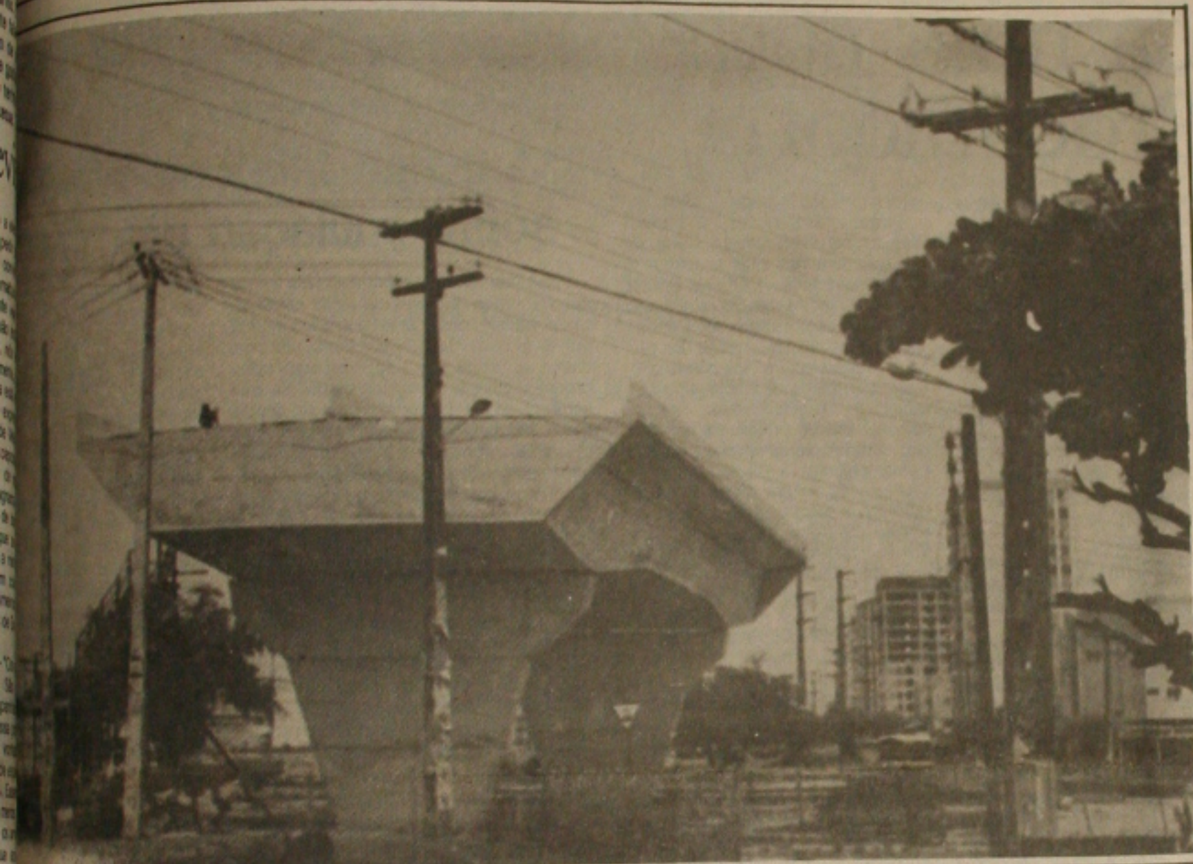
Viaduto na avenida Hermes Fontes está atrasada.

O viaduto da avenida Hermes Fontes, no cruzamento com a avenida Saneamento, está com suas obras atrasadas desde o mês de agosto, data em que o viaduto deveria ter sido concluído. Segundo avaliou o secretário municipal de Obras, Sérgio Smith, é normal o atraso na obra, e assegurou que o viaduto deverá estar operando no fim do mês de dezembro ou mesmo no início do mês de janeiro, no próximo ano.