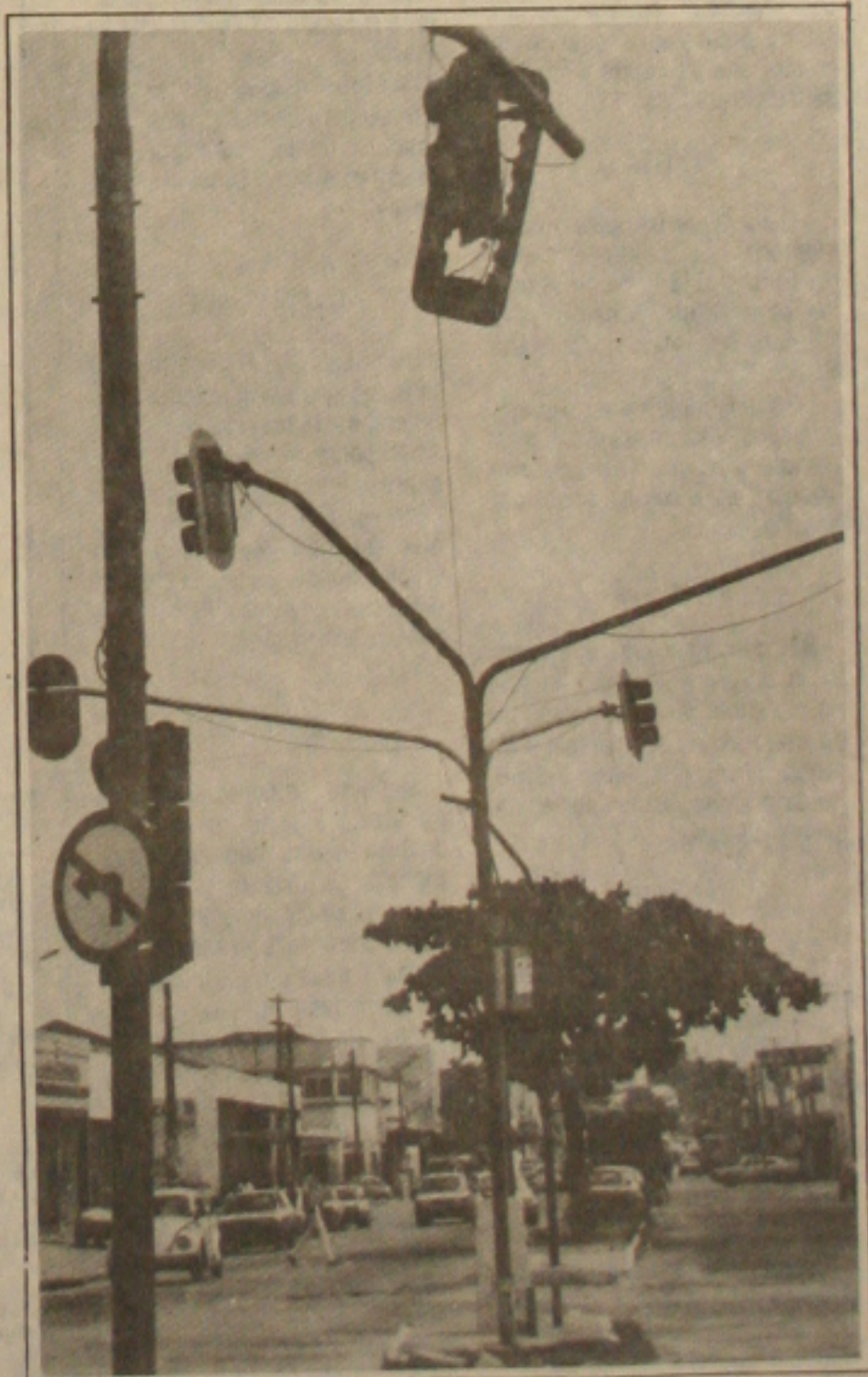
Os semáforos quebrados serão substituídos pelo Detran.