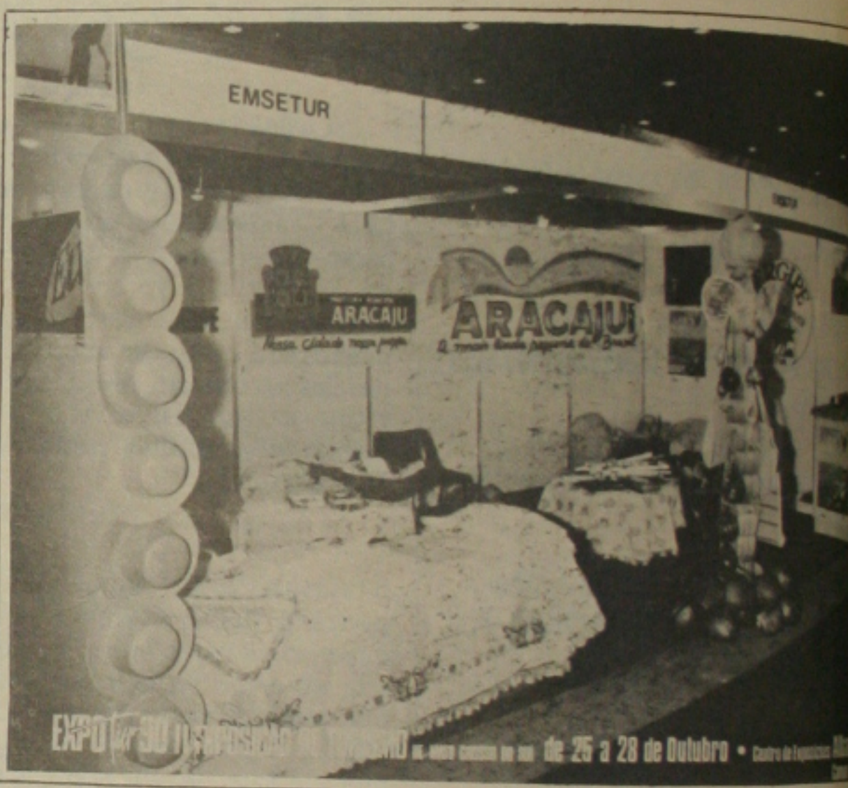
O estande da Emsetur (o único do Nordeste), foi instalado numa localização privilegiada do Pavilhão de Exposições Albano Franco