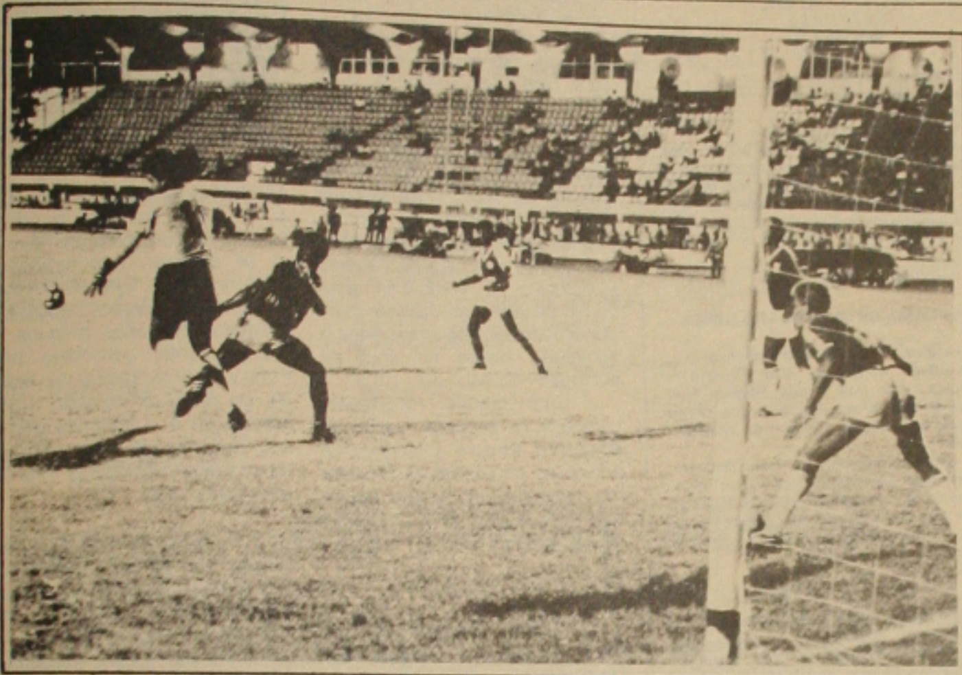
Sergipe tem parada difícil contra o Estanciano.