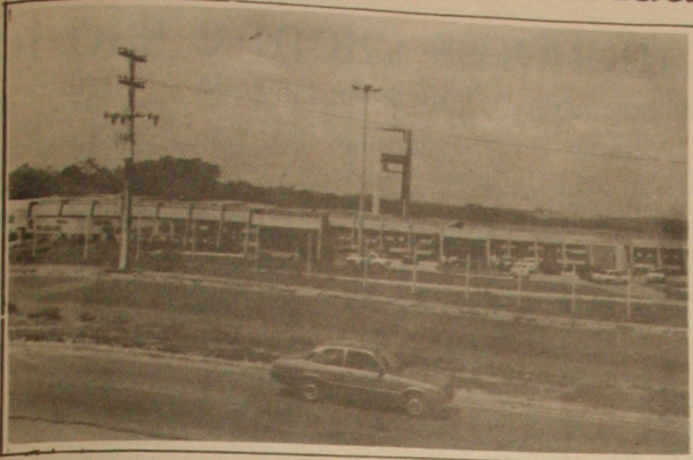
Hospital Governador "João Alves Filho" vive novos problemas. (Foto/Arquivo).

Os funcionários do Hospital Governador João Alves Filho poderão ainda esta semana paralisar as atividades por tempo indeterminado. Tudo está dependendo apenas do resultado de uma assembleia geral a ser realizada dentro de alguns dias quando a categoria pretende tomar um posicionamento em caso de suas reivindicações não serem atendidas pelo governo estadual.