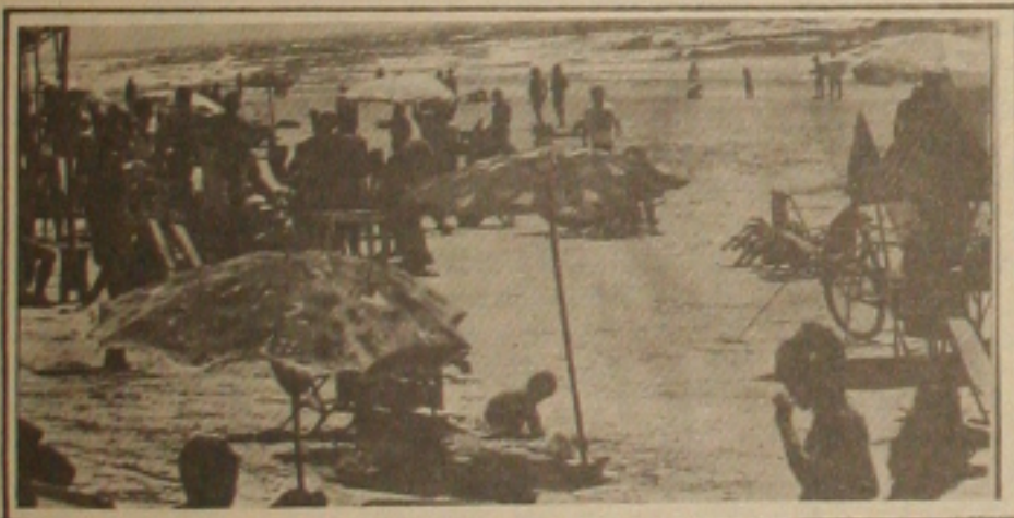
As praias ficaram lotadas com o feriado prolongado.

No último dia do Encontro, primeiro de dezembro, acontecerá a assembleia geral da Associação Brasileira das Instituições de Combate ao Câncer. O encontro será encerrado portanto ao meio-dia com um almoço.