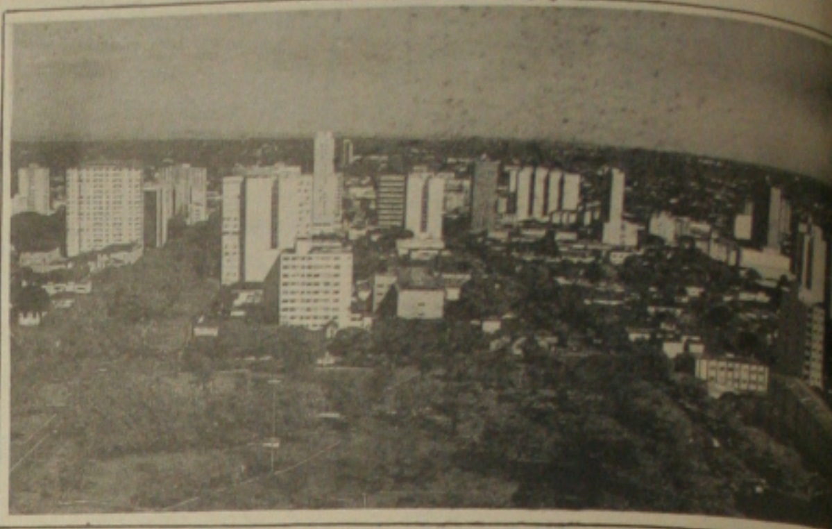
Campo Grande sediou a Expotur/90

O leitor pode indagar o que levou a Emsetur e a Secretaria da Indústria, Comércio e Turismo, investirem no I Salão de Turismo de Ribeirão Preto.