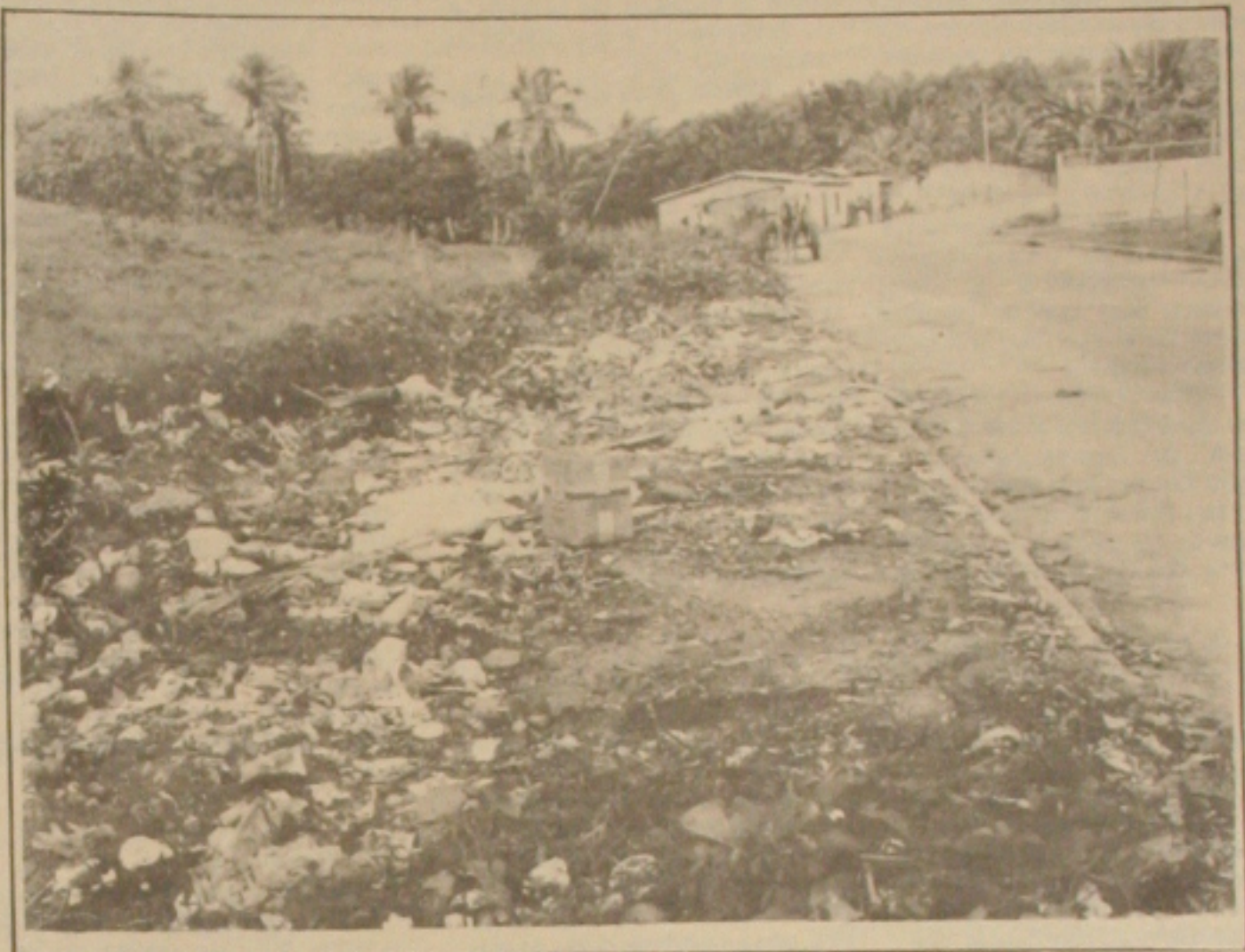
Falta de coleta de lixo causa problemas para moradores do Eduardo Gomes. (Foto Luiz Carlos Moreira).

No próximo comentário analisaremos a tragédia que se abaterá sobre Sergipe se a Nitrofertil fosse desativada. Seria um erro que atingiria o Porto e sacrificaria o Pol. Cloroquímico, e, como consequência a economia sergipana como um todo.