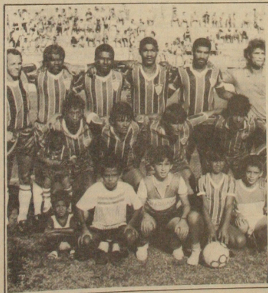
O Itabaiana pode deixar o Presidente Médici hoje, com o título do segundo turno.

O apitador escolhido pela Cobraf, para dirigir o encontro foi o carioca Claudio Garcia, pertencente ao quadro de aspirantes à Fifa. As despesas de arbitragem ficam por conta do Itabaiana, que solicitou arbitro de outro Estado, para dirigir o encontro.