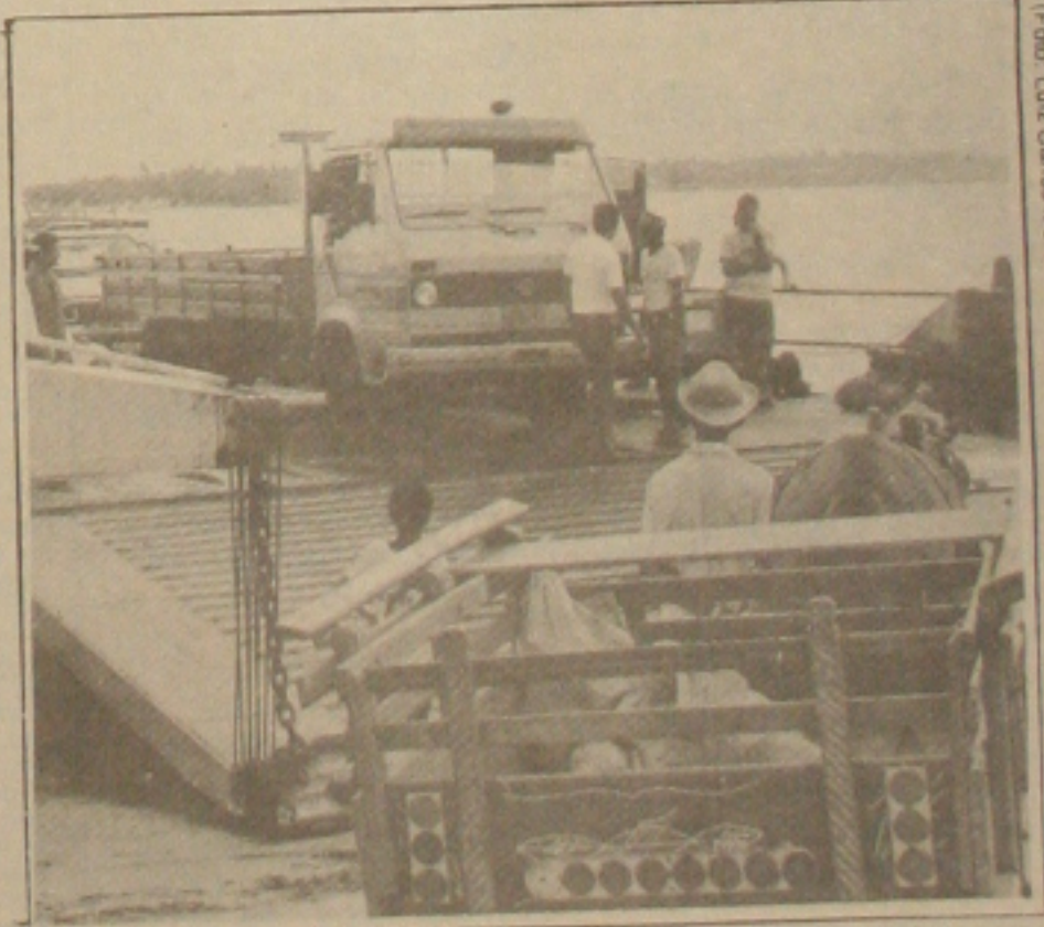
Uma única balsa operando é insuficiente para o movimento nos finais de semana.

Com o final de semana prolongado, milhares de turistas de Aracaju e de outros municípios do interior do Estado, estão na Atalaia Nova, e hoje voltam a enfrentar um antigo problema: a travessia do Rio Sergipe pela balsa. E que a Sergiports tem duas balsas: Cotiguiaba e Atlântica. A primeira, a maior, está quebrada há quase um ano e a travessia vem sendo feita precariamente apenas pela balsa Atlântica, que tem capacidade apenas para 18 carros. Hoje certamente, pelo lado da Barra dos Coqueiros, grande fila de veículos será formada e a balsa vai entrar em operação pela noite, apesar de não ser recomendável, pois, a mesma não dispõe dos equipamentos necessários para promover a travessia noturna com segurança.