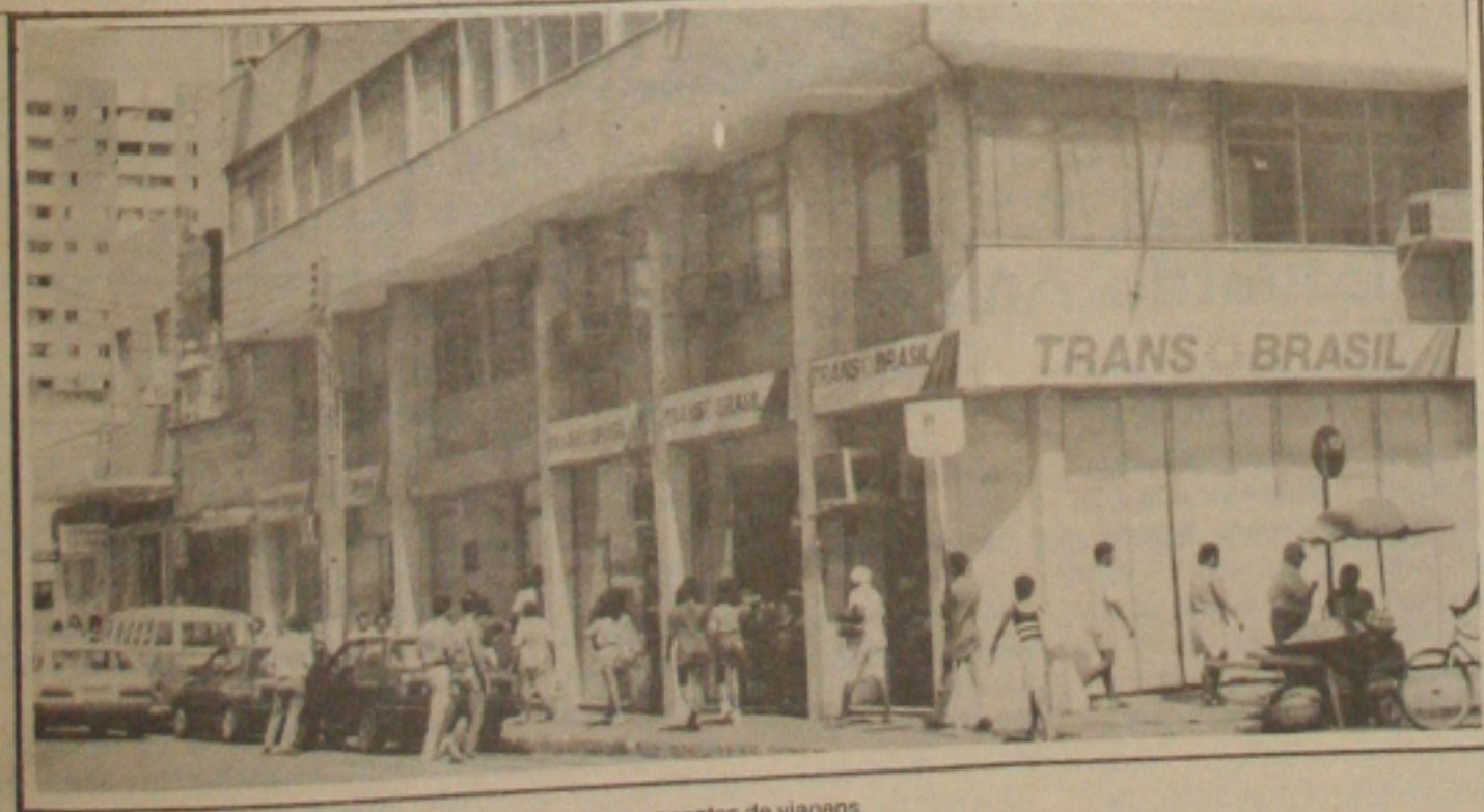
A liberação dos preços das passagens cria euforia entre os agentes de viagens