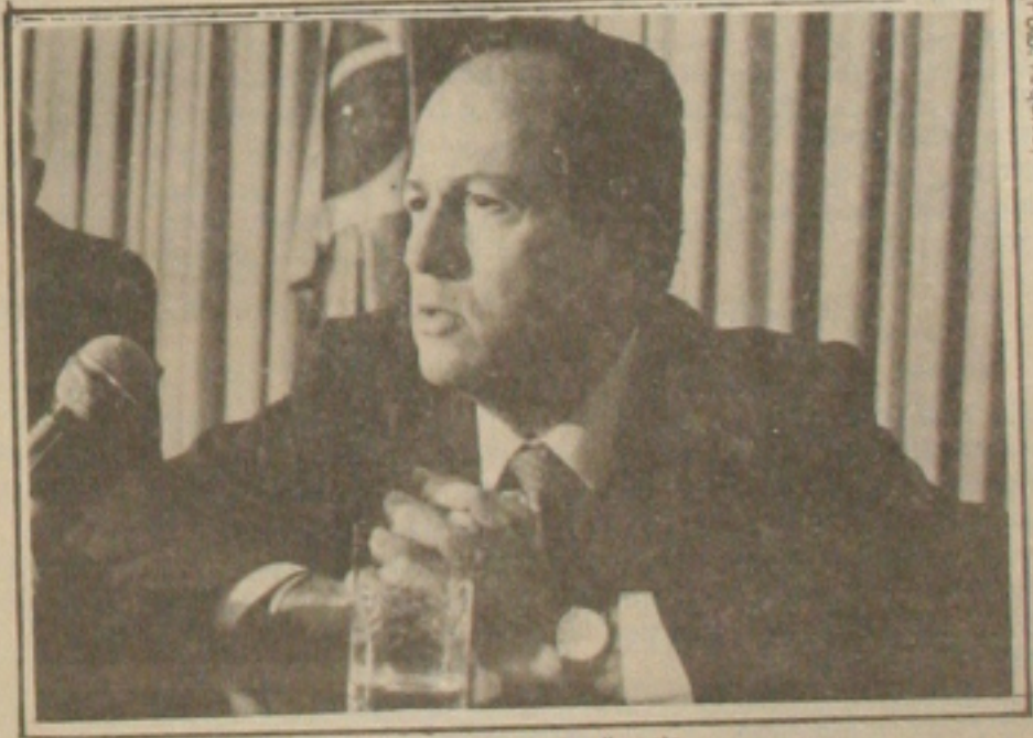
Albano, critica as taxas de juros e defesa do entendimento