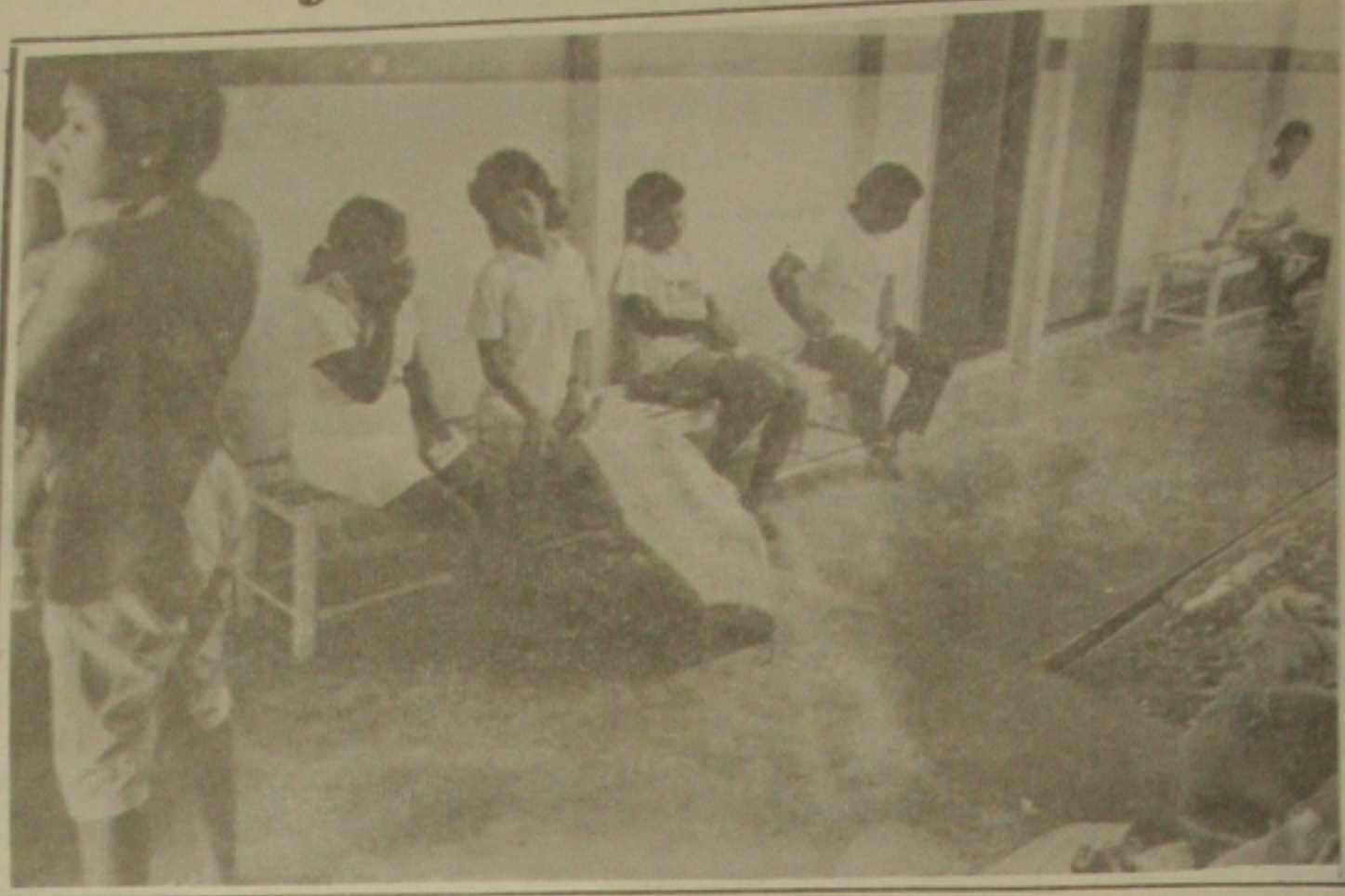
A partir de agora os postos e centros de saúde passam a atender qualquer especialidade, basta marcar a consulta.