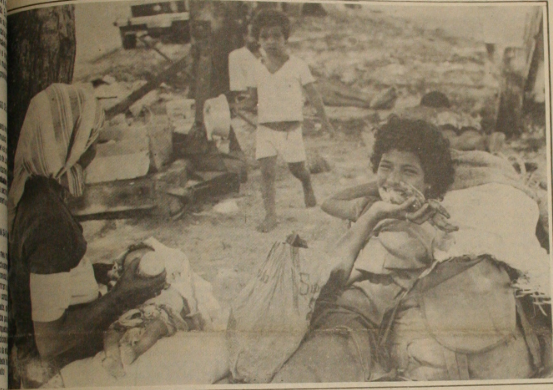
Em realidade absoluta, essas crianças nem sabem que no Brasil tem uma lei nova que as assegura condições parecidas com as da distante e inatingível Suíça.