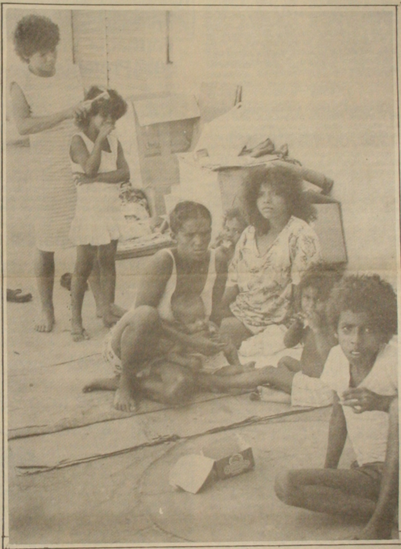
Cresce a cada dia o número de menores carentes em Aracaju.

Em termos práticos em Sergipe ocorreu apenas a transferência de menores de 18 anos