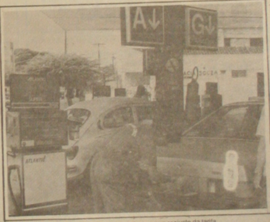
Com o aumento dos combustíveis, os taxistas querem reajuste da tarifa.

interferência de Collor junto a Caixa Econômica para aprovação dos recursos destinados à duplicação da Adutora do São Francisco e convidou o presidente para participar das inaugurações, em dezembro, do Parque dos Cajueiros. O presidente Collor aceitou o convite e na oportunidade será homenageado com a colocação do seu nome no calçadão do novo Parque. (Página 3).