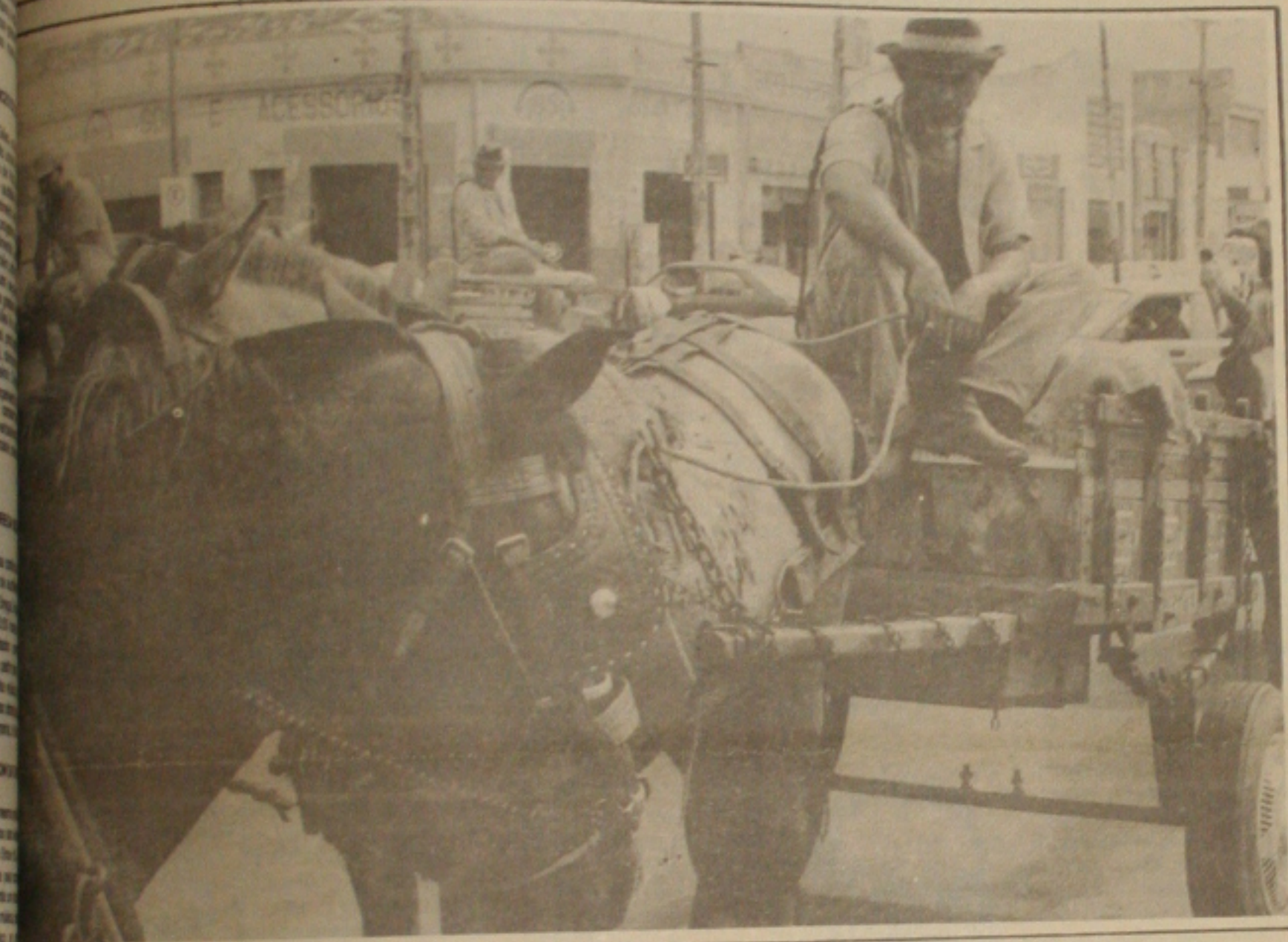
...dos dentes, os carroceiros passam o dia todo parados na Avenida Coelho e Campos, a espera de um frete.

A Delegacia de Ordem Política e Social do Departamento da Polícia Federal em Sergipe, comprovou a participação do prefeito José Augusto Dutra, PFL, da cidade de Carira, no sertão sergipano, a 112 quilômetros de Aracaju, na falsificação de certidões de nascimento de 40 menores, para que pudessem fazer o alistamento eleitoral. O crime aconteceu em 1988 e o prefeito de Carira, que já foi fichado criminalmente, poderá ser condenado de dois a seis anos de reclusão.