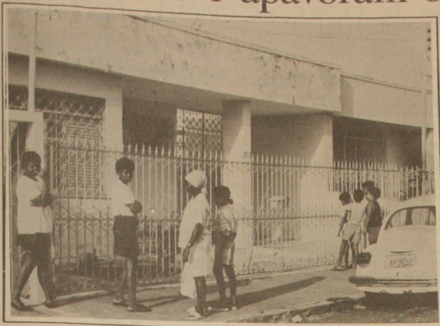
Moradores do Cirurgia foram ver o local do ataque das abelhas e estão atemorizados, tomando novas investidas.

...vender a laranja pelo preço justo e as despesas ser grande com a compra de adubo, uréia e cloreto de potássio. Na sua concepção, os pequenos e médios citricultores sergipanos, que se constituem em 80 por cento da categoria, serão os mais prejudicados, partindo do princípio de que não estão conseguindo investir, estão sendo mal remunerados nos preços e precisam de empréstimos com juros baixos como sempre tiveram para continuar plantando o que não ocorre com os grandes industriais e grupos econômicos que têm financiamento no BNDS e conseguem comercializar seus produtos. Ao finalizar, o presidente do Sindicato dos Citricultores disse que a previsão para o ano de 92 e 93 é que haverá sobre de 490 mil caixas de laranja no País em virtude do plantio está sendo grande e não tem a quem vender o produto, tendo em vista que além da super-safra nos Estados Unidos estão aparecendo novos sítios com plantação de laranja.