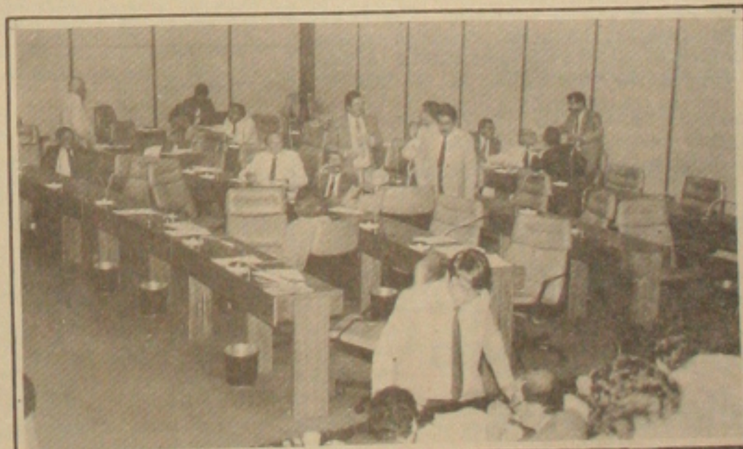
Ontem poucos foram os deputados que apareceram na Assembleia e muitos dos quais apareceram neste foto já estão em "férias".

Concluindo, o vereador afirma que "repudia esta atitude dos membros que formam o Sindicato assim como também a atitude do Poder Executivo.