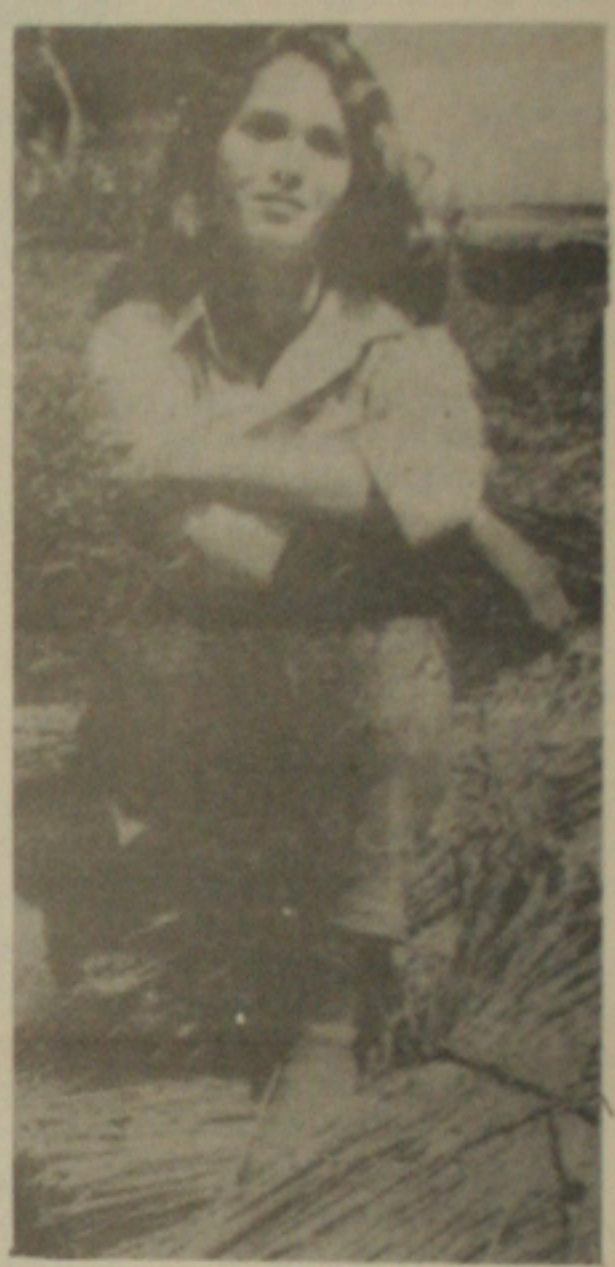
A atriz baiana faz o terceiro papel da sua carreira