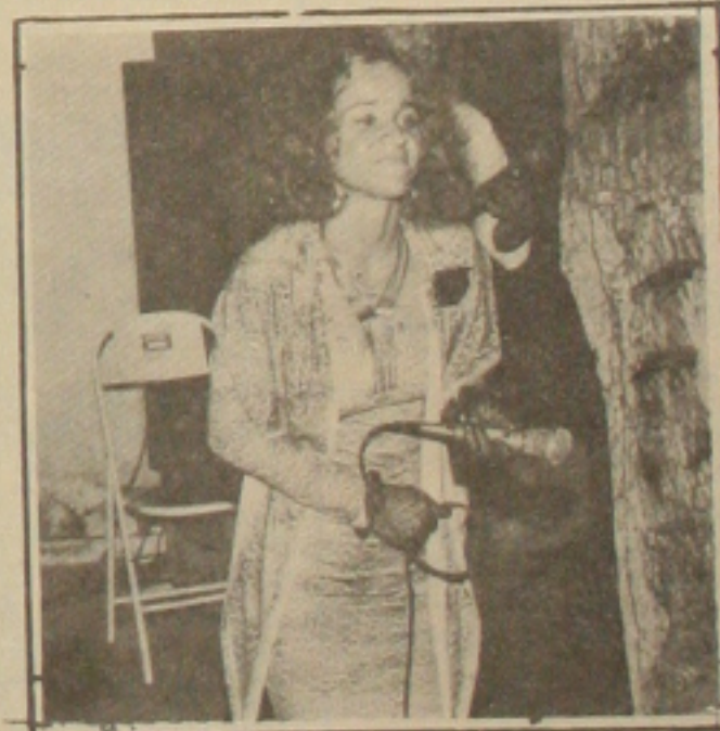
Amorosa, sempre charmosa, cantando e encantando.

Pressinto que, ao final, a nossa história não terminará como terminou como a do "Reino de Avilan", onde o povo conquistou a sua liberdade.