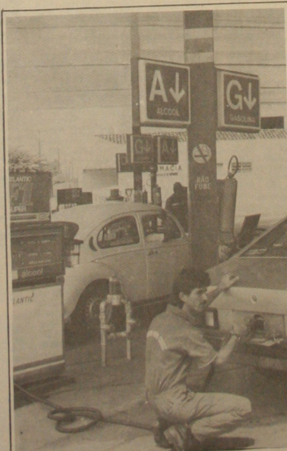
Taxistas querem reajuste para superar preços dos combustíveis.

O taxista observou ainda que a Superintendência Municipal dos Transportes Urbanos deve levar em consideração que em outros Estados as tarifas dos transportes coletivos e dos ônibus intermunicipais e interestaduais também sofreram reajuste em função do aumento no preço dos combustíveis. Desta forma a PMA deve conceder também reajuste para nós aqui em Aracaju. Para você ter uma idéia, estou precisando de um