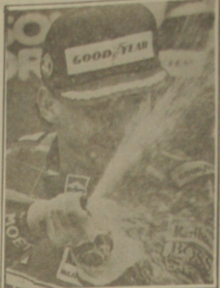
O campeão de Fórmula 1 - Ayrton Senna

Se houver indícios de crime será aberto um inquérito Policial Militar (IPM), para levar a justiça militar os culpados se não houver indícios de crime, a sindicância pode concluir ou não pela ocorrência de transgressão disciplinar, por parte de algum superior do cadete. Na hipótese de que tenha ocorrido transgressão, o oficial responsável será punido com base no RDE - Regulamento Disciplinar do Exército.