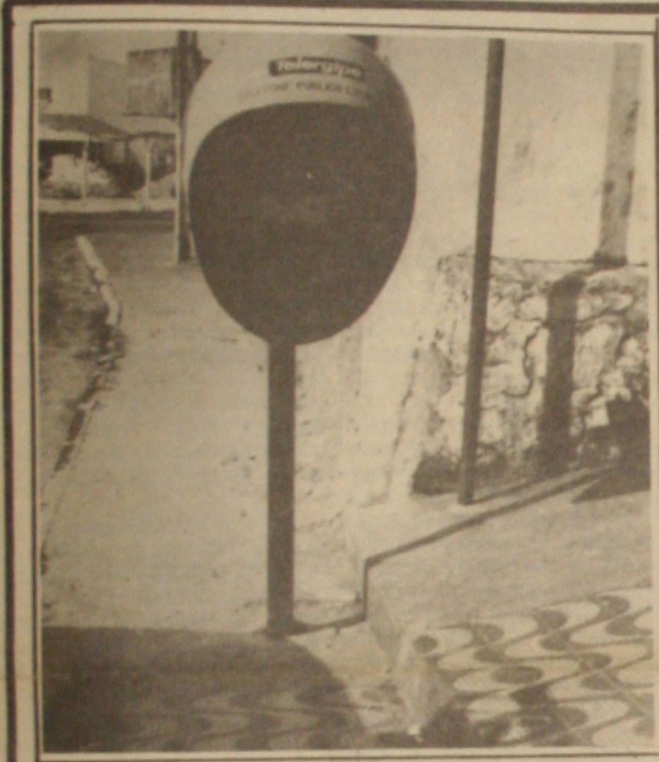
Metade dos aparelhos de Aracaju são destruídos por ação criminosa da própria população.

O torcedor sergipano está pronto para o jogo de domingo entre o time de casa, o Atlético Sergipe, e o visitante, o Atlético Paranaense. O jogo promete ser emocionante, principalmente para os torcedores locais. O time rubro não conta com a presença de um jogador de peso, mas espera poder continuar sonhando com o título. O Atlético Paranaense, por sua vez, vem de uma vitória e busca manter o ritmo. O jogo será transmitido ao vivo pelo canal 10.