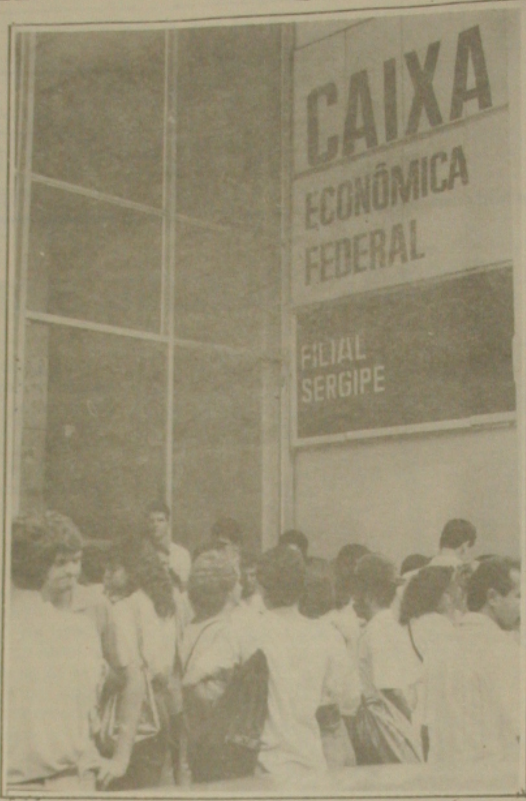
A CEF lança em Sergipe, a poupança azul para facilitar a vida de seus clientes.