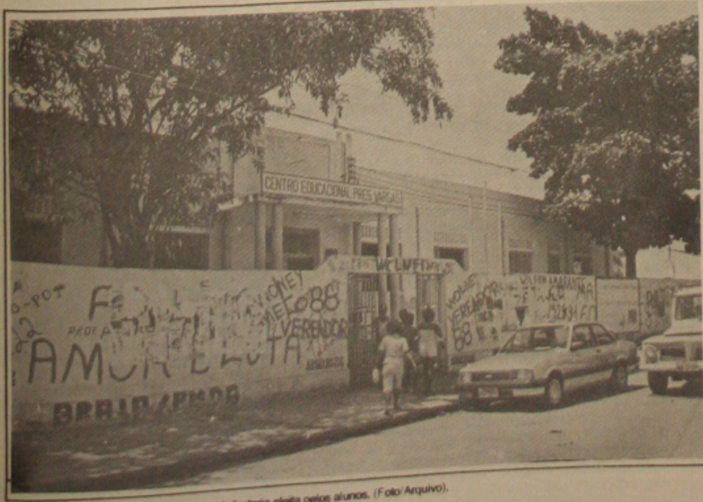
Centro Educacional Presidente Vargas terá diretoria eleita pelos alunos.

Têm direito a voto todos os alunos maiores de 11 anos, os funcionários indistintamente e os professores de todos os estabelecimentos de ensino da rede municipal. A Secretaria da Educação prevê cerca de 14 mil alunos, 1800 professores e 1800 funcionários votantes durante o pleito eleitoral. No entanto ninguém é obrigado a votar, consequentemente, aquele que deixar de exercer o seu direito não sofrerá qualquer prejuízo.