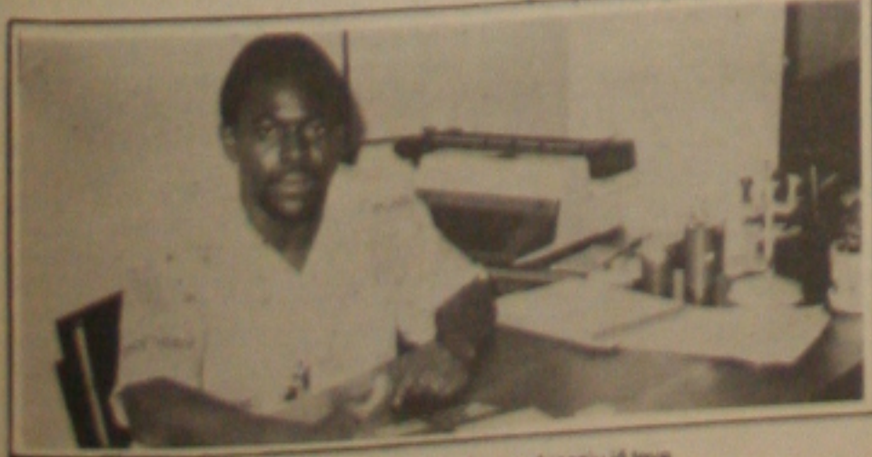
...a situação... a administração...

O político não deve ser do tipo Copa do Mundo, ou seja, aquele que só aparece de quatro em quatro anos, pois, acima de tudo, ele deve mostrar interesse e ser amigo do seu eleitor.