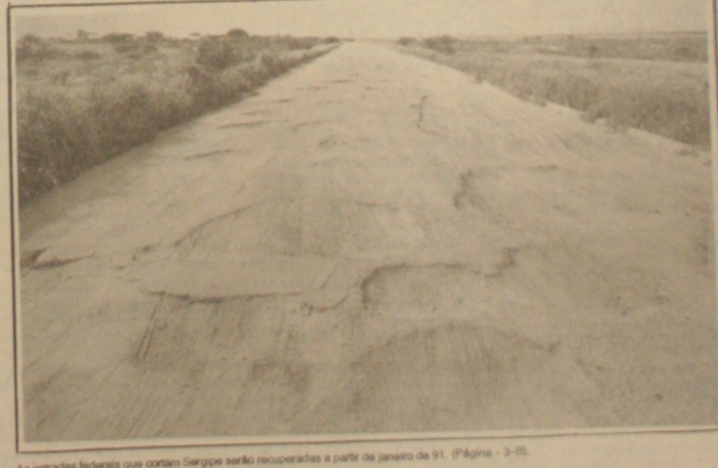
As estradas federais que cortam Sergipe serão recuperadas a partir de janeiro de 91. (Página 3-B).