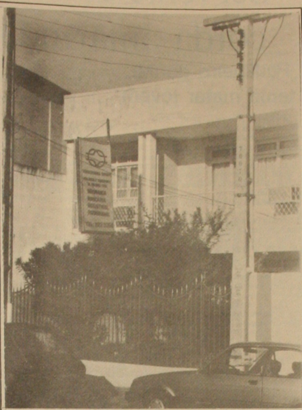
Sindicato denuncia a Transguarda ao IAPAS e a DRT por cometer irregularidades.