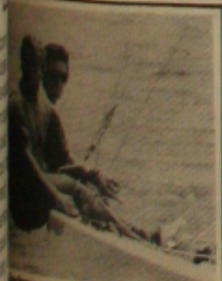
Quando vão lutar na raias do Mosqueiro...