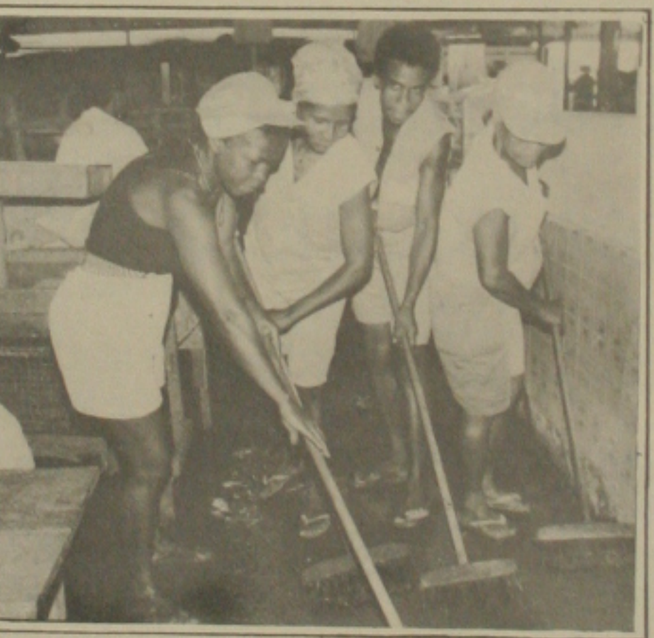
Funcionários da Semab fizeram uma limpeza no mercado municipal

Paulo Roberto esclareceu que o Detran vai colocar placas espalhadas na Avenida, traçando o percurso, com o objetivo de orientar aos motoristas no novo roteiro traçado. O novo itinerário do trânsito, no percurso Distrito Industrial-centro, será o seguinte: Rua Lourival Chagas; Rua Urquiza Leal seguindo Avenida Francisco Porto, Avenida Pedro Braz e Rua Leopoldo Mesquita. Com esse desvio, as obras continuarão, sem nenhum prejuízo para as suas conclusões, evitando-se desta maneira, qualquer tipo de acidente, foi o que informou o engenheiro Paulo Roberto Melo Costa.