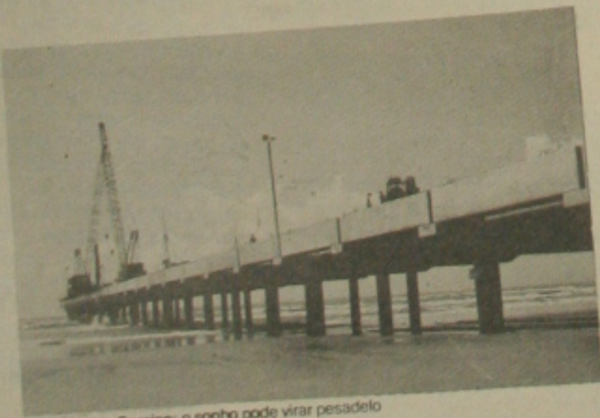
Porto de Sergipe: o sonho pode virar pesadelo

Ouçá todas as quintas-feiras, às quinze para as sete da manhã, hora local, o programa BOM DIA, GOVERNADOR, uma prestação de contas dos atos da administração pública, apresentado em rede de emissoras sergipanas. BOM DIA GOVERNADOR, às quinze para as sete da manhã, hora local, na emissora sergipana de sua preferência.