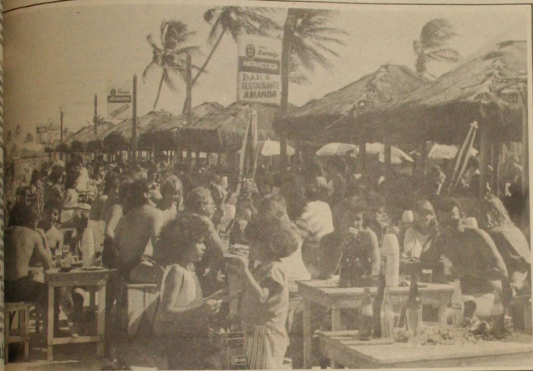
A falta de cerveja devido o aumento do consumo em Aracaju.

Apesar da crise econômica, o aracajuano não deixou de lado a companhia da "loira gelada" - cerveja - presente em todas as mesas de bar. Fritos até costumam considerar que a crise econômica e o arrocho salarial ainda não apertou o bolso das pessoas consumidoras de cerveja.