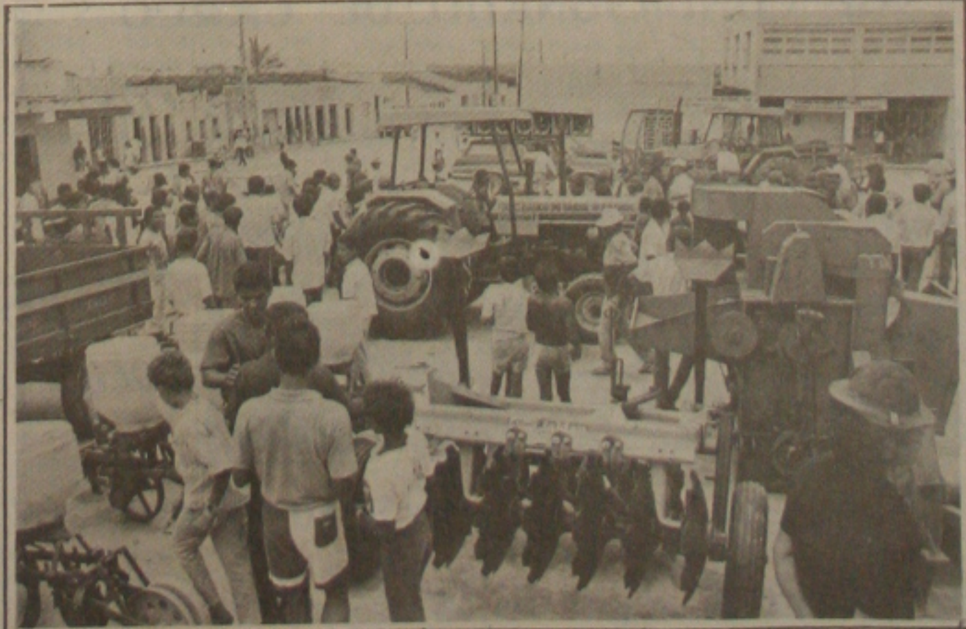
Moradores de Coronel João Sá contemplam os benefícios conquistados.

O BB, através do Fundec, dá prioridade ao meio rural e com os Planos de Desenvolvimento Comunitários Integrados, PDCIs, assegurados, não mede esforços para continuar assistindo ao homem do campo contando com a sua participação ativa no desenvolvimento das comunidades carentes.