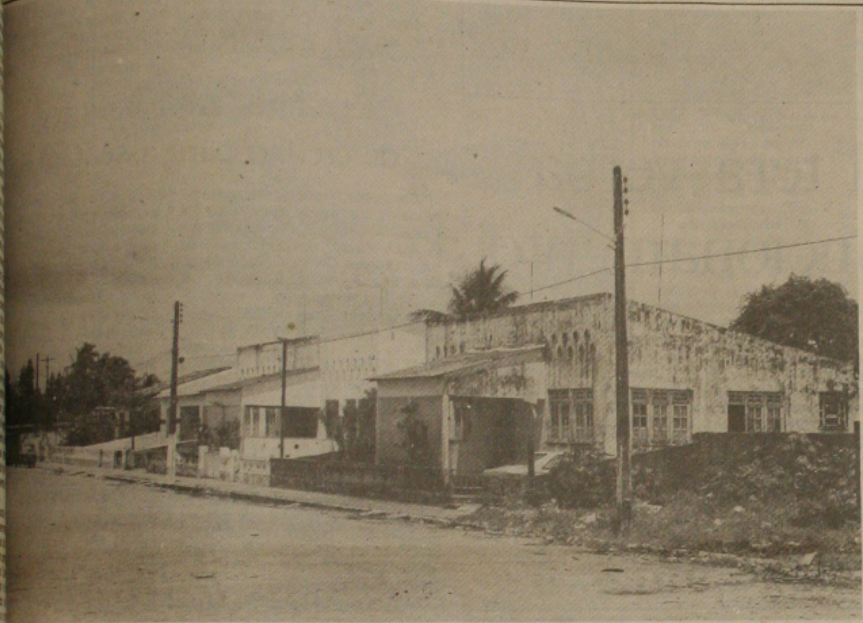
Rede Ferroviária S/A vai leiloar 10 casas.

Em Aracaju 10 casas da rede Ferroviária Federal S/A serão colocadas à venda através de leilão. Os funcionários não estão satisfeitos com os critérios adotados para a comercialização dos imóveis e asseguram que nenhum dos ferroviários dispõe de um salário suficiente para comprar o imóvel que será leiloado.