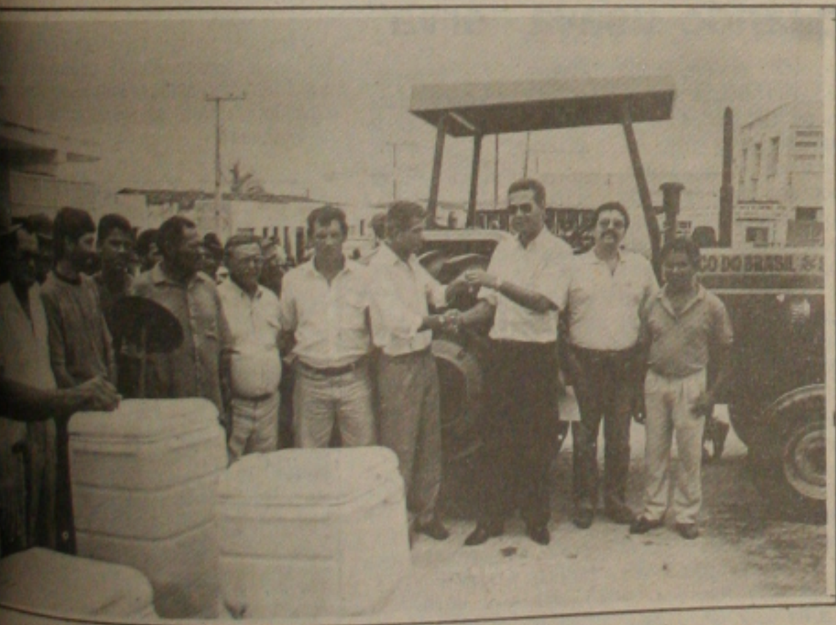
O superintendente do FUNDEC entrega as chaves do trator ao Presidente da Associação Comunitária.

O Fundec, Fundo de Desenvolvimento Comunitário, do Banco do Brasil, fez a entrega de um trator com todos os implementos agrícolas à comunidade do município de Coronel João Sá, na Bahia, visando incentivar o setor agrícola na região.