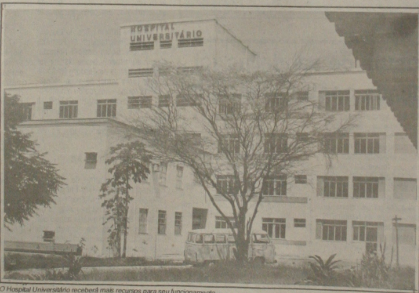
O Hospital Universitário receberá mais recursos para seu funcionamento.

administrativa do Governo Federal, cujos objetivos institucionais não são consonantes com os interesses da Instituição. A Universidade dispõe de relatório do próprio MEC demonstrando a necessidade de criação de 65 cargos e contratação de cerca de 670 servidores para colocar em funcionamento o Hospital Universitário. No entanto, o MEC insiste em cobrar da UFS uma redução em seu número de cargos. Esta foi uma das razões que levou o reitor em exercício a agilizar providências para regularizar o HU, a fim de fazer face às pressões que vem sofrendo do Governo Federal, no âmbito de sua reforma administrativa.