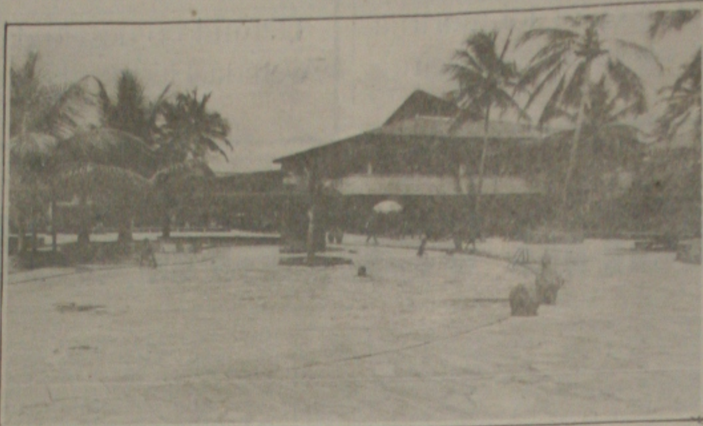
À pesquisa realizada pelo Senac também fará levantamento na rede hoteleira da capital.

A seleção para ingresso nos cursos do pós-graduação far-se-á através de compreensão de texto em língua portuguesa (eliminatória), compreensão de texto em língua estrangeira (classificatória), conhecimento específico (eliminatória) e entrevista com base no currículo vitae (classificatória). A bibliografia para esta prova está à disposição dos candidatos na Coordenação de Pós-Graduação e no Núcleo de pós-graduação e pesquisa, no Campus