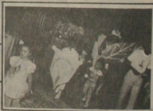
Os componentes da Escolinha Folhinha Verde na saída do desfile, acompanhados pela rainha da escola