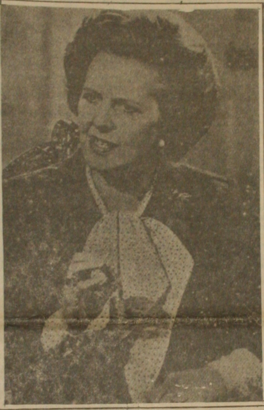
Thatcher: renúncia para não dividir mais Conservadores.

Londres — A Primeira Ministra Britânica Margaret Thatcher renunciou ontem, após 11 anos e meio de Governo. Thatcher comunicou a inesperada decisão ao seu Gabinete ontem pela manhã, dizendo que renuncia a bem da unidade do Partido, e para garantir uma vitória dos Conservadores nas próximas eleições gerais.