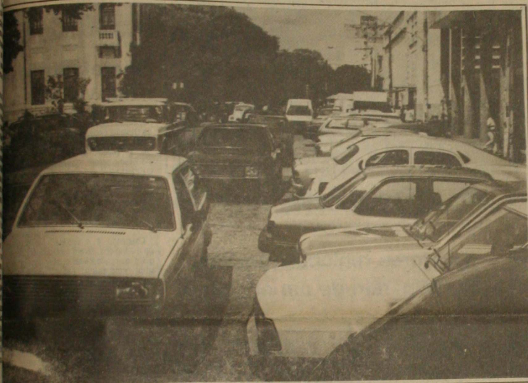
Carros no centro comercial prejudicam o trânsito: (Foto Luiz Carlos Moreira)

Dirigir em Aracaju é um quebra-cabeça, principalmente das 10h30min ao meio-dia, horário de maior concentração de veículos no centro comercial. Os motoristas, na maioria das vezes, não obedecem a sinalização (precária) e desrespeitam completamente o pedestre que não sabe como se comportar no trânsito.