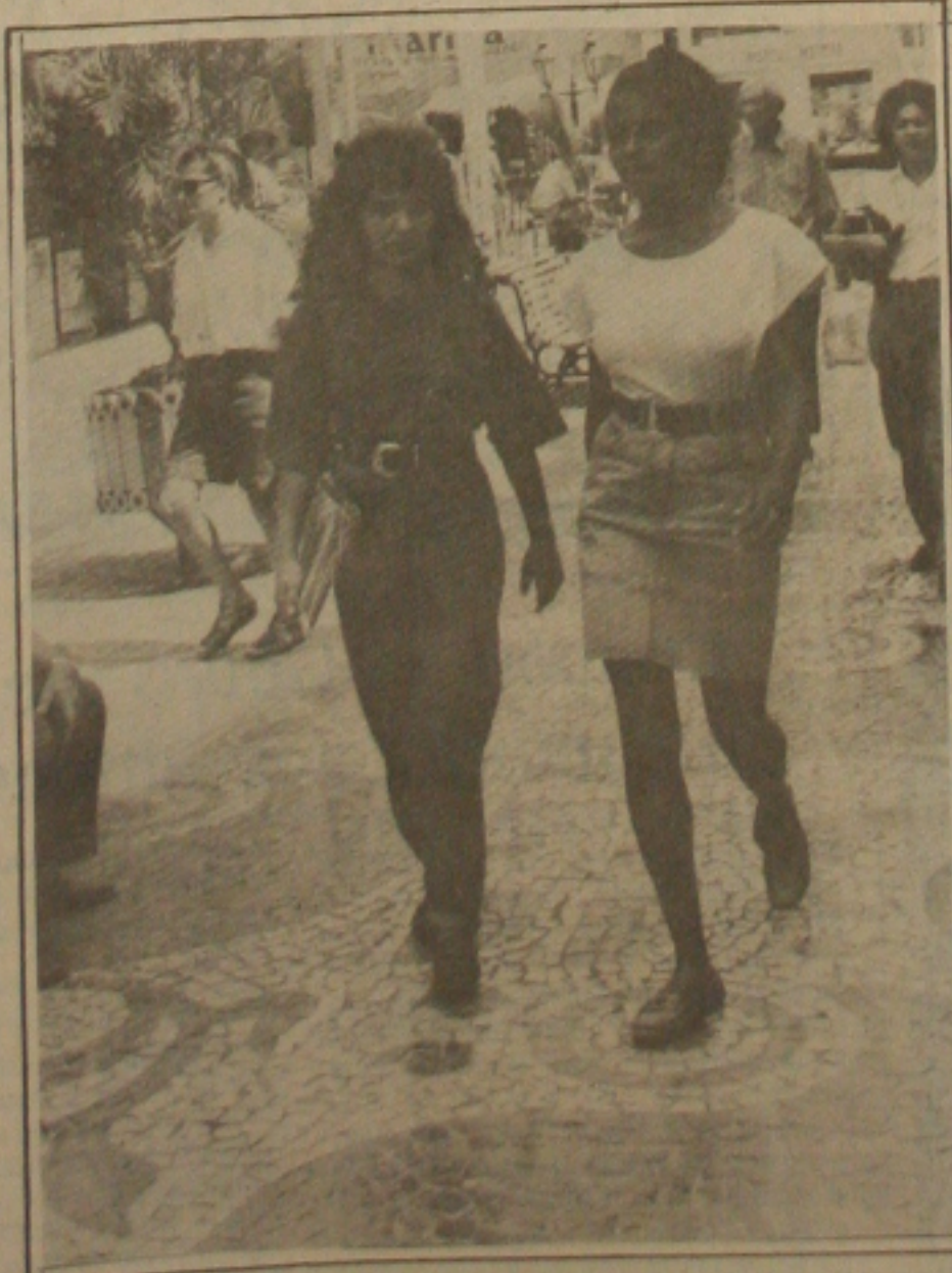
Mortes por complicações de parto atingem o índice de 10% no Nordeste: (Foto Luiz Carlos Moreira)

De acordo com os dados da OMS, as causas principais para os problemas de parto são hemorragias, infecções e doenças hipertensivas específicas de gravidez (pre-eclâmpsia e eclâmpsia). Sendo que o aborto é uma das causas mais determinantes das hemorragias e infecções, apresentando uma alta incidência de mortes e sequelas.