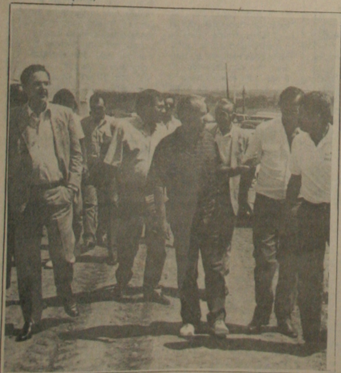
O governador Valadares inspecionou obras que estão sendo executadas no interior.

nete, baterias de sanitários masculino e feminino, além de estacionamento para vários ônibus e carros pequenos. Em Tomar do Geru o governador Valadares autorizou a construção da Ponte da Jaqueira, que interliga aquele Município a cidade de Itabalaninha. Segundo Flávio Oliveira, diretor do DER, existe uma ponte de madeira, que será substituída por uma de concreto, resolvendo em definitivo o problema. A ponte terá 31 metros de comprimento e custará ao Estado 45 milhões de cruzeiros, devendo ser concluída e entregue num período de 4 meses.