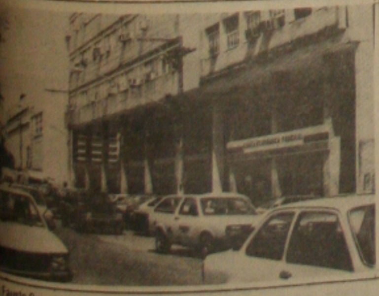
Trânsito no centro comercial de Aracaju.