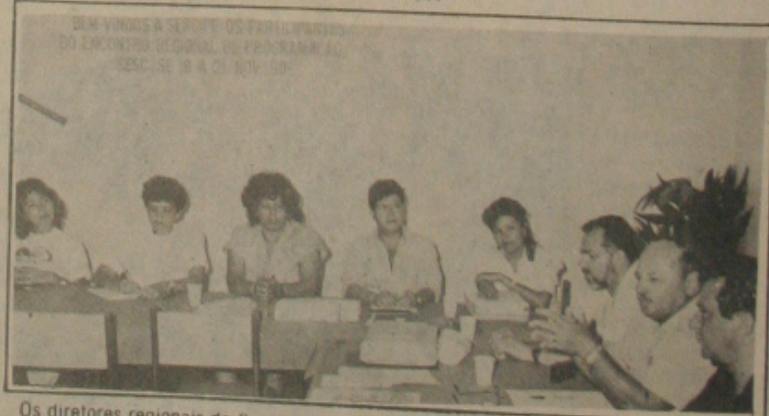
Os diretores regionais do Sesc participaram do encontro realizado no Aracaju Praia Hotel.

Ressaltou ainda o presidente da Federação, que a sociedade deve tomar conhecimento sobre as atividades do Sesc levando-o de forma a beneficiá-la através de seus inúmeros programas. E o encontro realizado em Aracaju serviu de aprimoramento de trabalho que será colocado em prática na programação de 91.