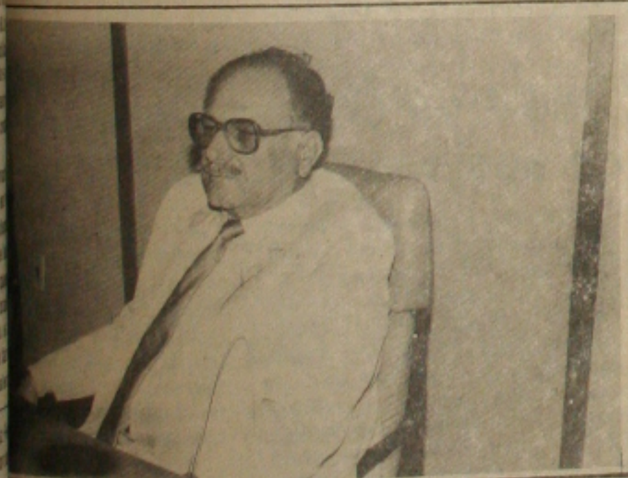
O eleitor analfabeto exige tudo dos candidatos e não vota em nenhum das eleições "casadas"