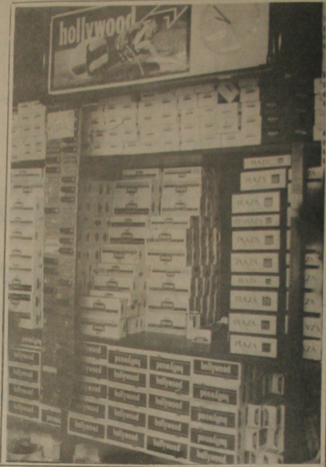
O combate ao uso do fumo, em especial ao cigarro, será discutido hoje no seminário.

Segundo informações do próprio prefeito Walter Cardoso, Valadares obteve recentemente numa pesquisa junto à população estanciana, 87 por cento de popularidade, fruto da sua administração transformando a cidade num canteiro de obras. Ele disse que de uma só vez o Governo efetua as construções do Ginásio, Escola, Conjuntos Habitacionais, pavimentação de quase todas as ruas, duas pontes interligando o Município a Boquim, Matadouro, Praças e obras de infra-estrutura. Valadares garantiu entregar todas estas obras prontas até antes de sair do Governo.