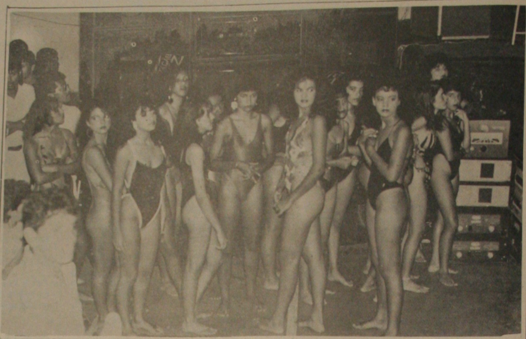
As candidatas quando do ensaio geral na manhã de ontem.