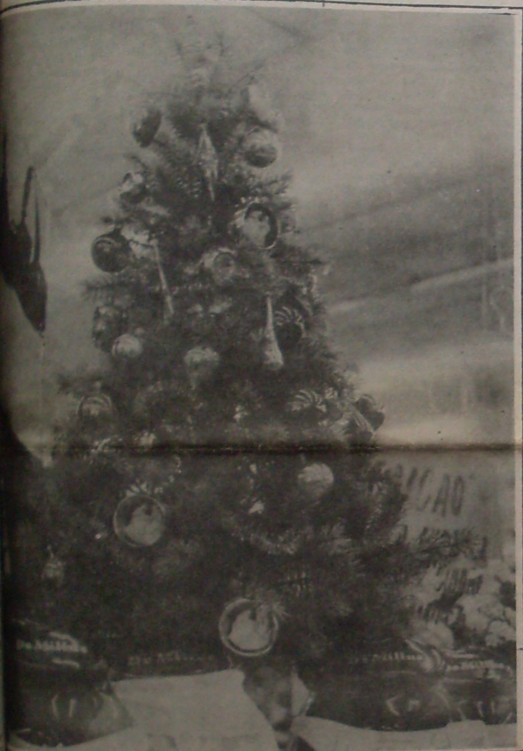
Para o Natal chegar, as casas comerciais estão decoradas com motivos natalinos para aumentar as vendas.