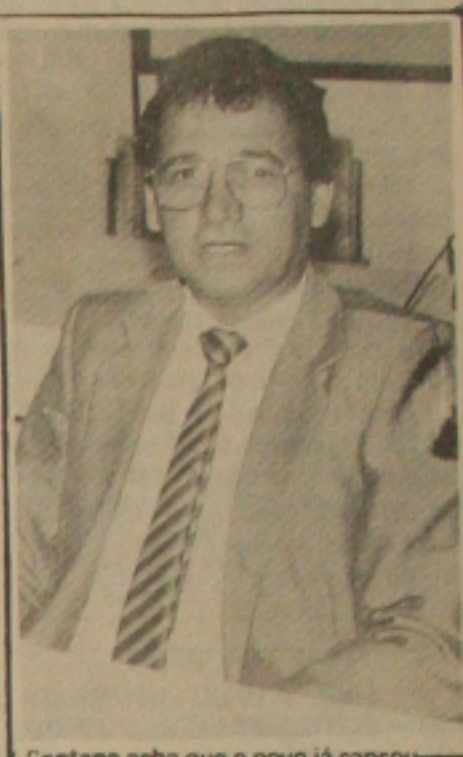
Santana acha que o povo já cansou de Collor

A programação da Associação relacionada ao Encontro de Crianças e Adolescentes será encerrada na próxima segunda-feira com uma passeata que sairá da Praça Tobias Barreto. "A concentração seguirá pela Rua Itabaiana, acabando na Praça Fausto Cardoso quando será lançada a campanha "Não matem nossas crianças". O objetivo do ato é alertar a sociedade e as autoridades para a dramática situação do menor", concluiu Marcelo Dêda.