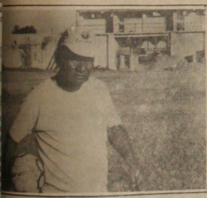
Mistério sobre o time do Confiança.