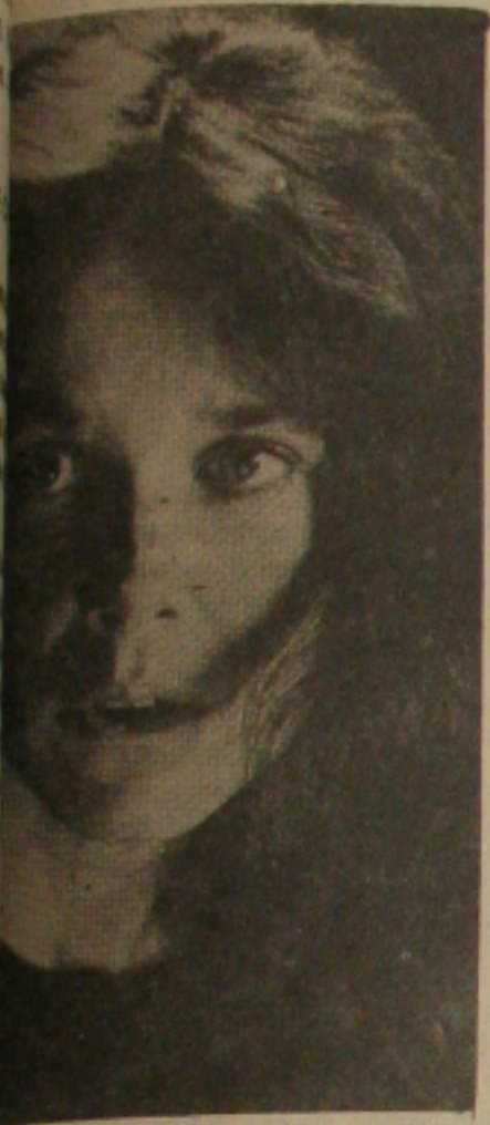
... está em Brigada da Morte. na Sala VIP.

... secreto-presidencial Charles Bronson confiar de que o alvo de atentados é o presidente. Cenas seguintes e os dois por todo o País, perseguidos por uma fuga, começam a se conhecer melhor e pode muito bem ser traído por ela. A da pela mulher mesmo de Bronson, e morreu este ano. Pode ver.