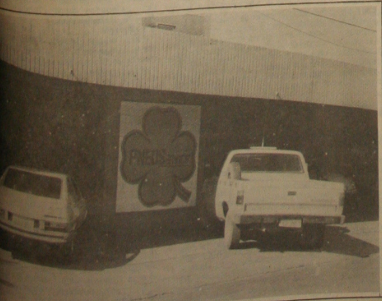
fez suas portas para o comércio varejista em Aracaju.