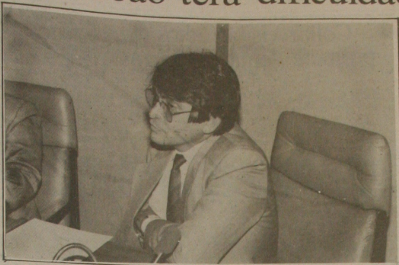
Falcão quer firmeza da bancada federal para defender interesses de todos os sergipanos.