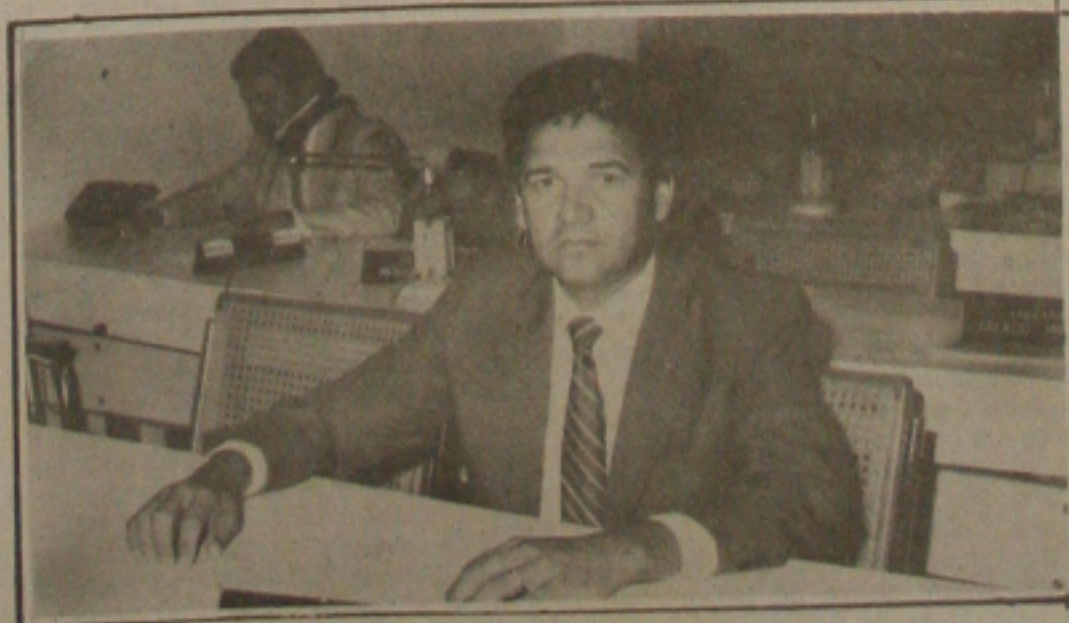
Carlos Santana quer os representantes municipais numa campanha regional pelo desenvolvimento do Nordeste.

Abordando vários fatores sobre a atuação desse segmento da sociedade, o comandante do Corpo de Bombeiros, assegurou que toda a equipe que forma esta corporação vem mantendo o desenvolvimento do seu trabalho em prol da população sergipana com amor, fé, carinho e dedicação. Lembrou que, a quatro anos está à frente do Corpo de Bombeiros e continua com sua consciência tranquila do dever cumprido, se colocando inteiramente à disposição de todos os parlamentares e toda a população quando assim fizer necessário.