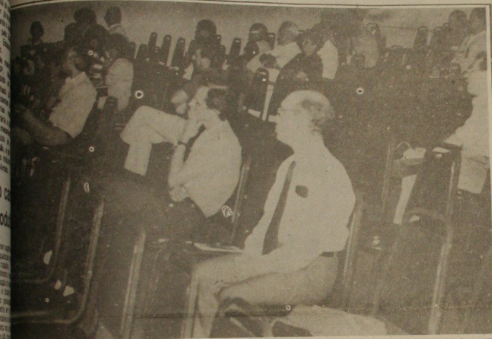
Encontro dos Hospitais de Oncologia.