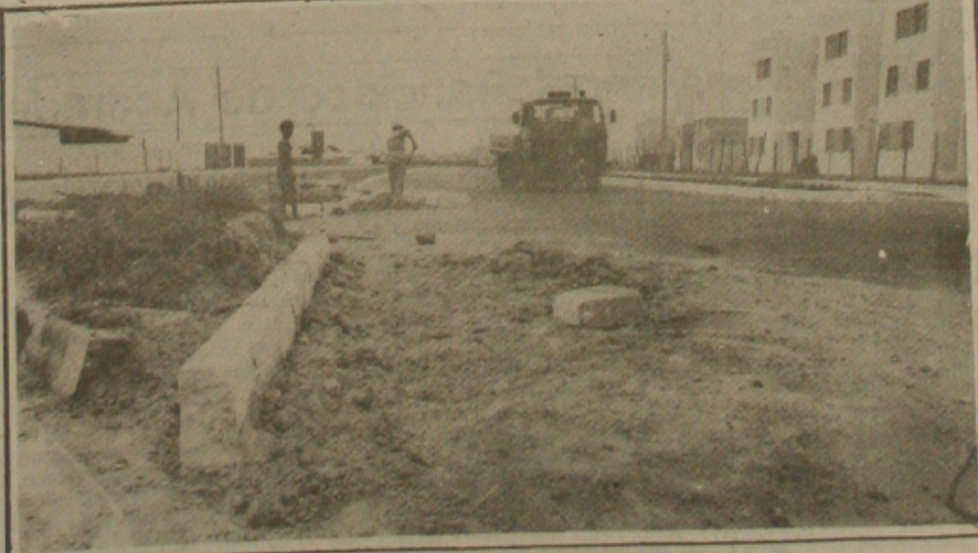
Prefeitura inicia recuperação das pistas da Coroa do Meio. (Página 2B).

...dares e o governador eleito João Alves Filho. Já há um consenso na maioria dos deputados estaduais de que realmente o presidente Fernando Collor ao determinar essas medidas, está traindo essas lideranças políticas, com as quais se comprometeu em não prejudicar o desenvolvimento do Estado. O primeiro grito de alerta na Assembleia foi dado pelo deputado Laonte Gama, que chegou a propor a suspensão do receso parlamentar por vigilância cívica. Ontem o deputado Nicolau Falcão, líder do Governo, expressou a sua solidariedade e disse concordar com as críticas. (Página 3).