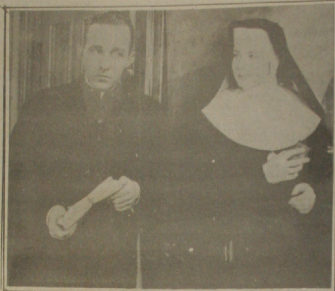
Com a chegada de padre O'Malley (Bing Crosby), irmã Benedict (Ingrid Bergman) muda seus métodos de ensino.

Por causa de suas orelhas de abano parecidas com as do personagem Bing, da tira de quadrinhos "The Bingsville Bugle", Harry Lillis Crosby mudou seu nome de batismo para Bing Crosby. E parece que a mudança deu certo ou, pelo menos, trouxe muita sorte. Bing foi o cantor mais popular dos anos 30 e sua voz de ouro sempre garantiu os desmaios de fãs apaixonadas e que seus discos liderassem nas paradas de sucesso. Na década de 40, Bing bilhou