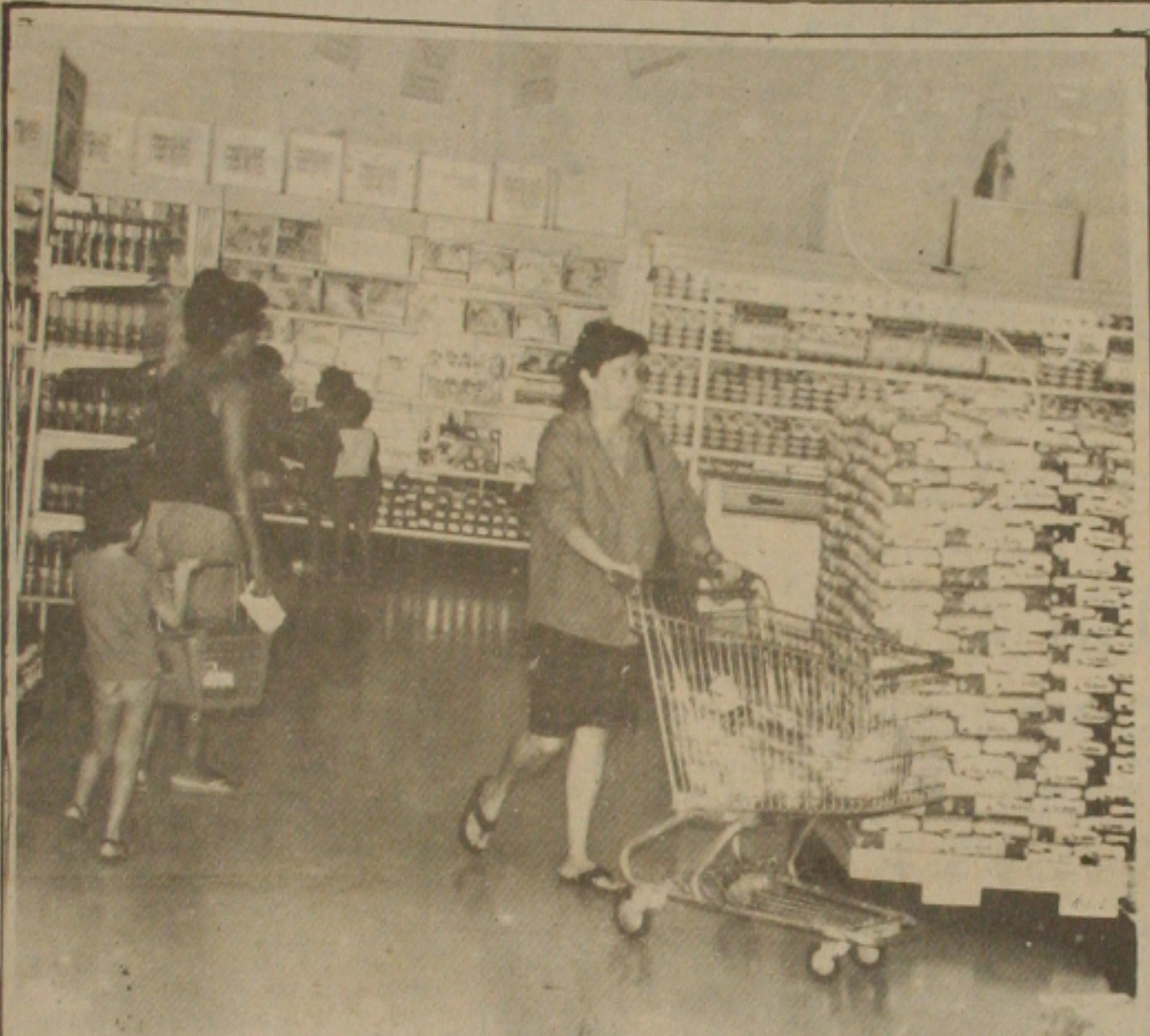
Consumidores antecipam compras para evitar remarcação de preços.

O presidente do Banco do Brasil, Alberto Pollicar, deverá visitar Sergipe na próxima quinta-feira quando estará no local pela manhã com todos os gerentes de agências, advogados e chefes de órgãos. O assunto a ser tratado durante esta reunião não foi divulgado ontem pelo superintendente do Banco que preferiu fazer maiores comentários a respeito da visita do presidente do Banco do Brasil a Sergipe. O superintendente do BB se comprometeu a dizer apenas que se trata de uma visita rotineira do presidente do Banco. O superintendente chegou aqui e no dia seguinte para o Estado de Alagoas onde fará a reunião de rotina", finalizou.