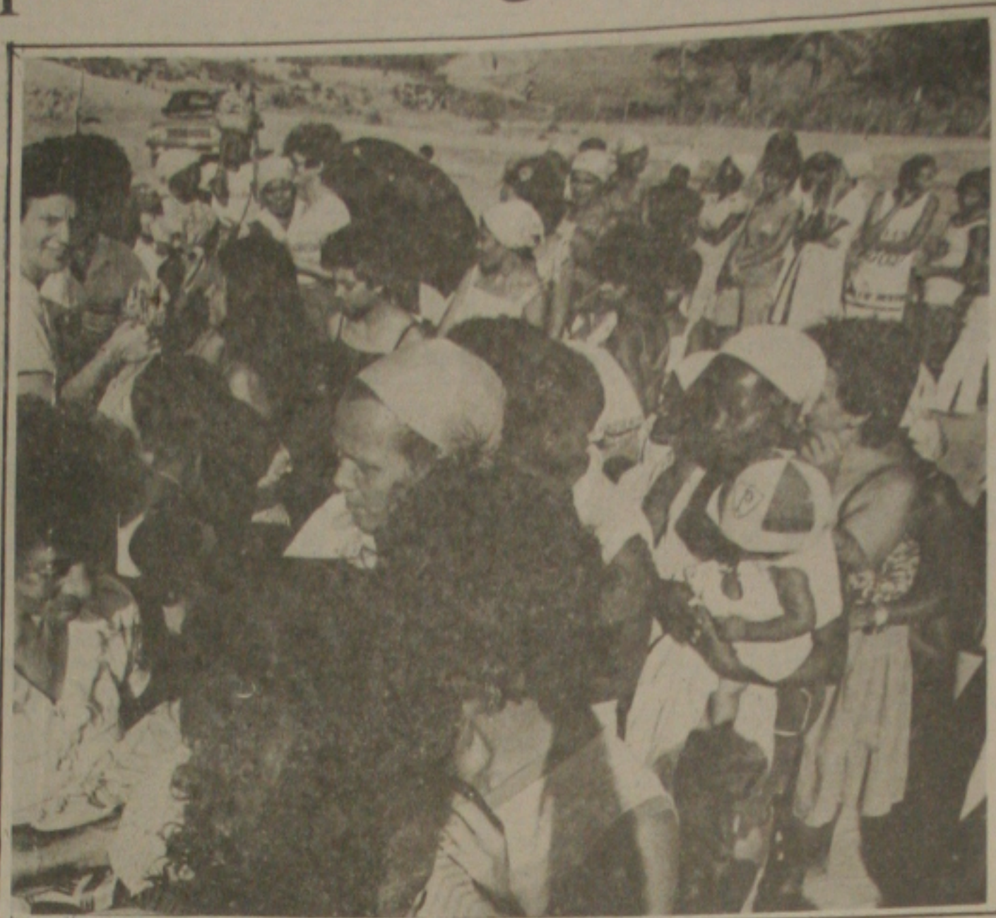
Mulheres sergipanas poderão ser beneficiadas com novo tratamento eficiente na menopausa.

O ministro da Saúde assinalou que "os administradores de Saúde deverão daqui pra frente gerenciar com maior competência e zelo os recursos repassados para o setor de saúde. Temos parâmetros para a definição do orçamento e para o atendimentos dentro do princípio da universalização do atendimento. Isto exige gerenciamento, fiscalização, auditoria e controle, para evitarmos principalmente desperdícios e desvio dos recursos de saúde."