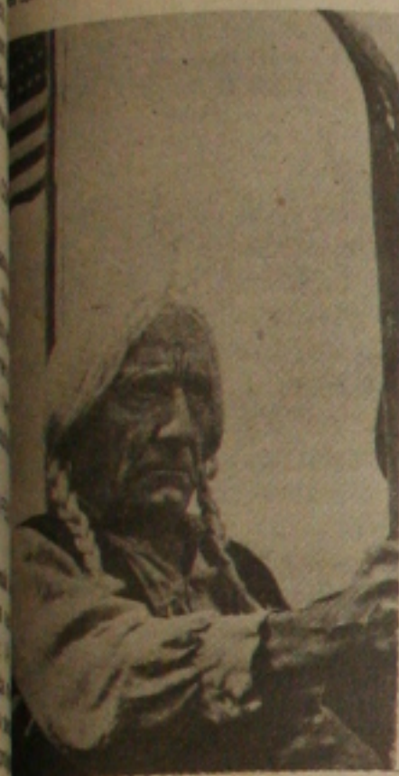
Uma Raça é o filme da Sala VIP.

...-21:40 H ...ANCE MUITO PERIGOSO (Into the Night) ... de John Landis. Com Jeff Goldblum, Dan ... Irene Pappas, Roger Vadim, Dan ... David Bowie, Vera Miles. 115 minutos.