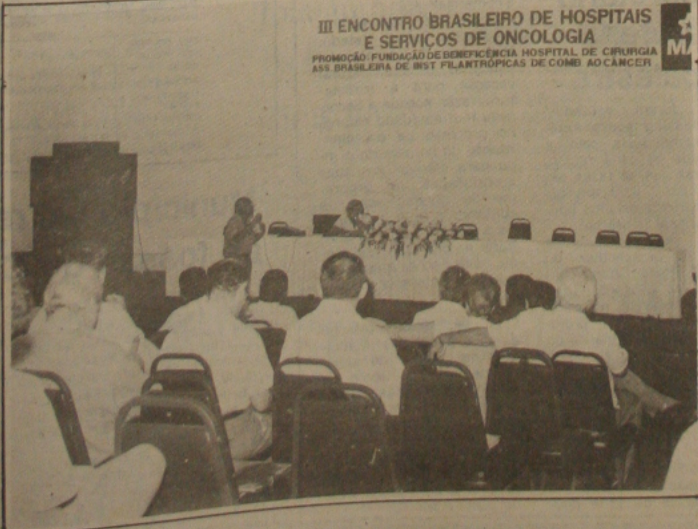
Instituto Nacional do Câncer quer reduzir o índice de mortalidade.

As atividades do III Encontro Brasileiro de Hospitais foram encerradas no fim da tarde com a conferência "Fontes alternativas de receita" com a participação do goiano Geraldo Silva Queiroz.