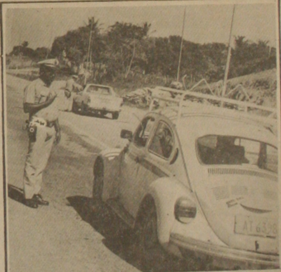
Nas blitz os patrulheiros estão parando todos os carros nas rodovias.

A meta do Instituto Nacional do Câncer, (INCA), para o próximo quinquênio é deduzir em pelo menos 10 por cento o índice de mortalidade ocasionada pelo câncer em todo o país. A informação foi prestada pelo diretor do órgão, Marcos Moraes, que ontem participou do III Encontro de Hospitais e Serviços de Oncologia que está sendo realizado desde a última quarta-feira no salão de convenções do Hotel Parque dos Coqueiros. Para tanto, conforme informações de Marcos Moraes, o Inca tem elaborado recomendações para a classe médica no sentido de que os médicos pratiquem de forma correta os exames físicos dos pacientes, objetivando com isto aumentar a possibilidade de diagnósticos precoces da doença. (Página 1-B)