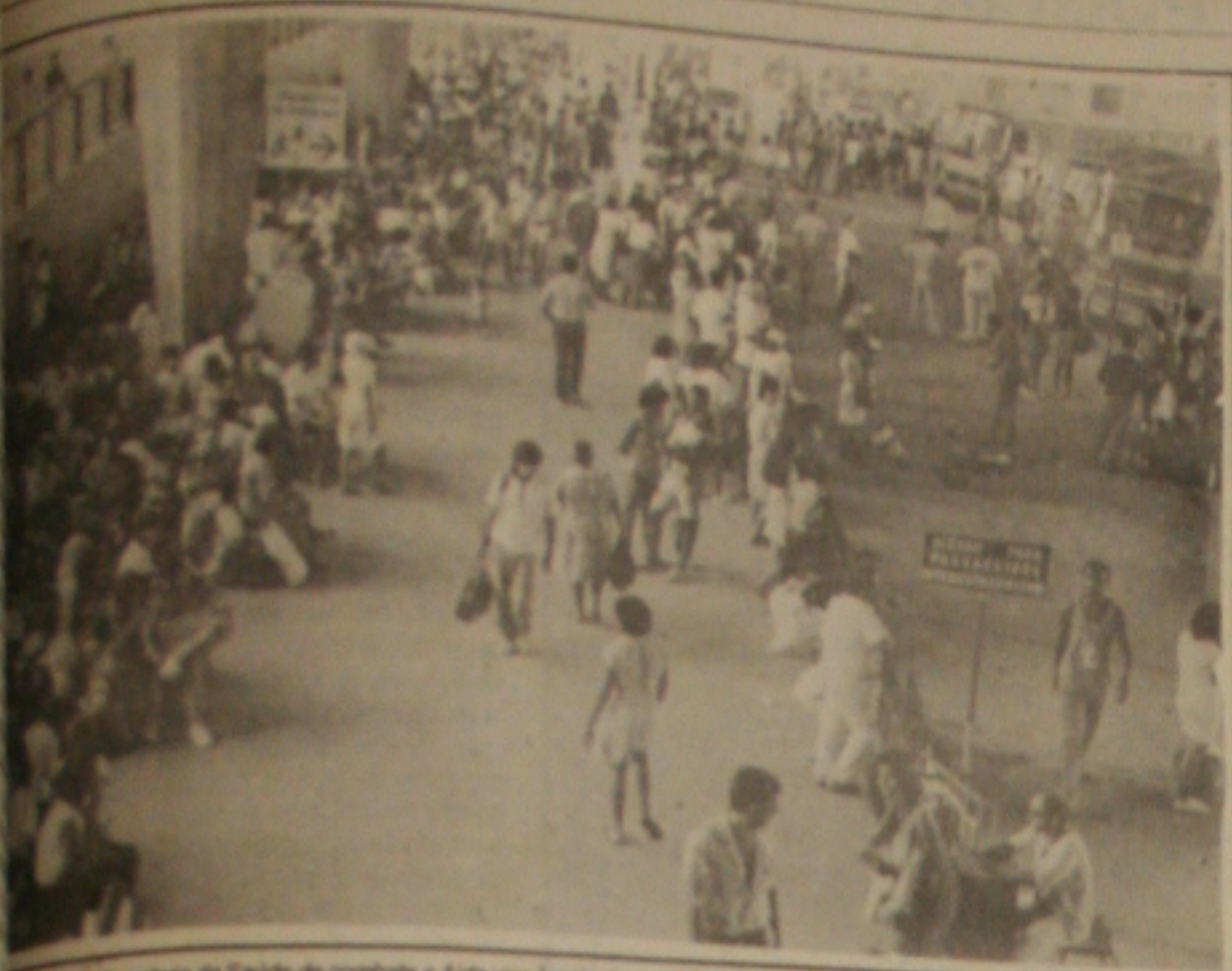
Hoje, para Secretaria da Saúde de combate a Aids visa locais de grande movimento, como por exemplo, o Terminal Rodoviário.