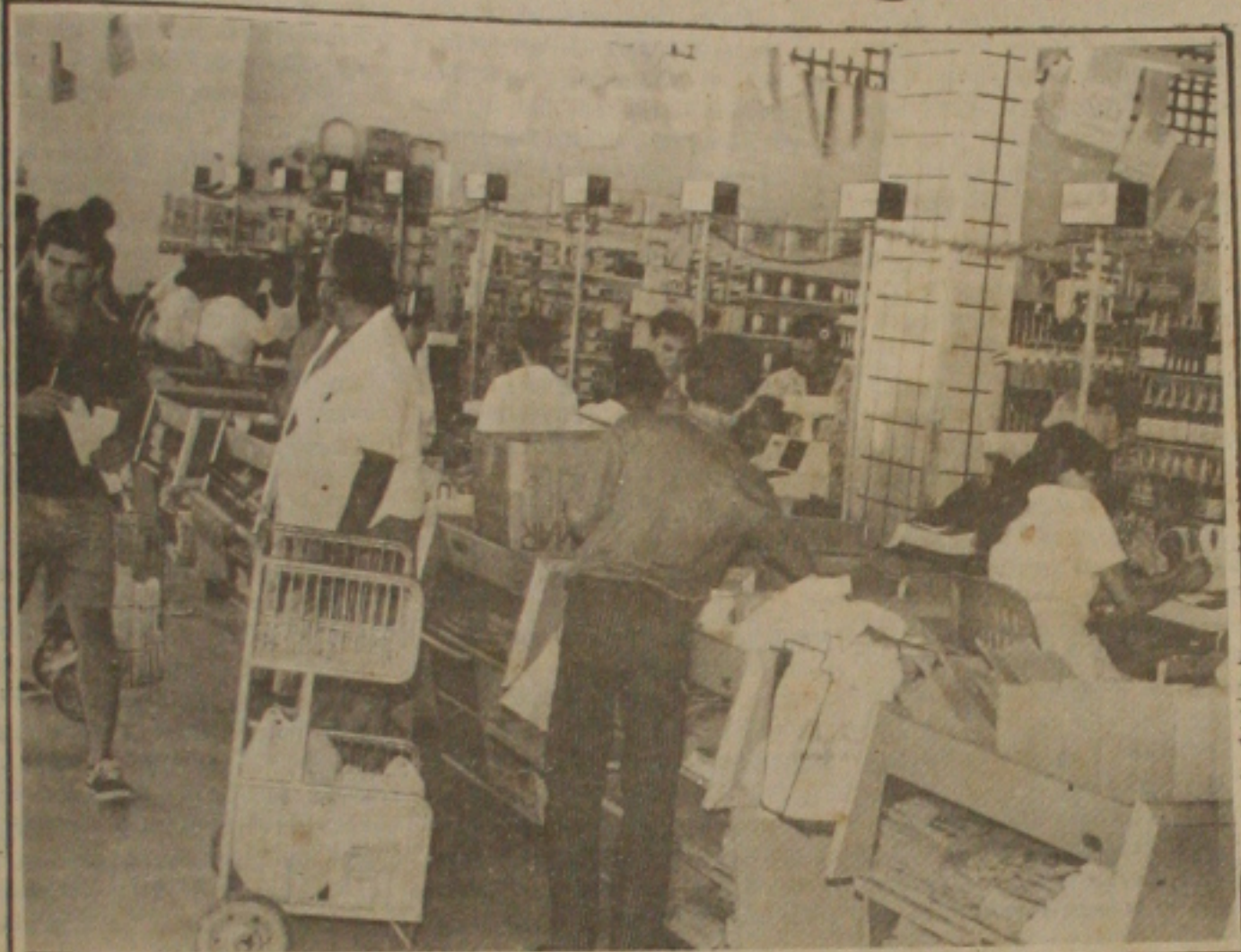
Consumidores foram aos supermercados para evitar os reajustes da virada do mês.

Em um assalto bem planejado, em que um dos bandidos disfarçou-se de carteiro, seis homens armados de revólveres e escopetas levaram, no início da manhã de ontem, Cr$ 74 milhões da agência do Banco Itaú, do Largo dos Mares, em Salvador. Os assaltantes pegaram todos os maletes de dinheiro que seriam distribuídos às demais agências do Itaú na capital.