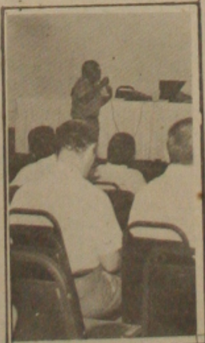
Instituto Nacional do Câncer quer reduzir o índice de mortalidade.