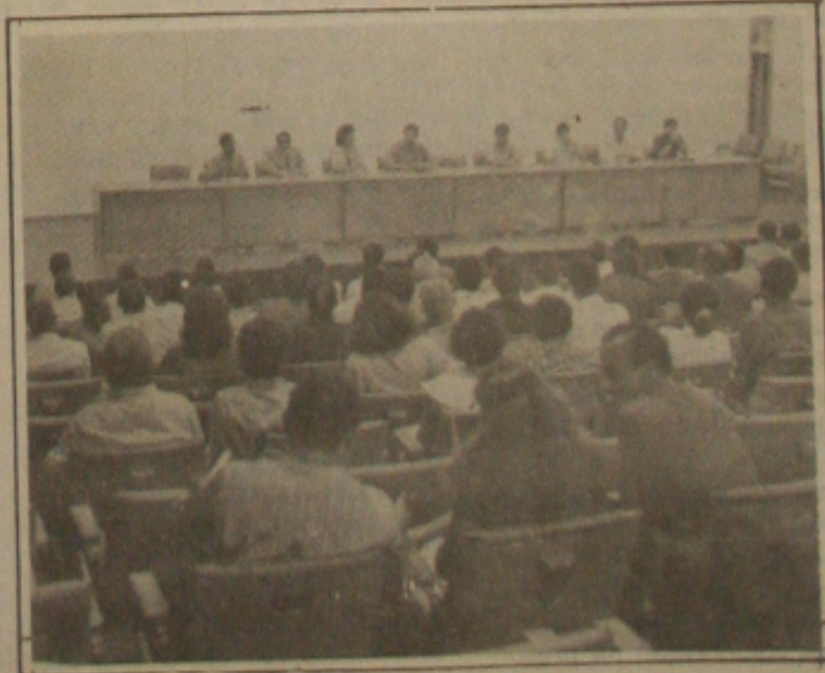
Encontro Estadual de Integração Municipal.