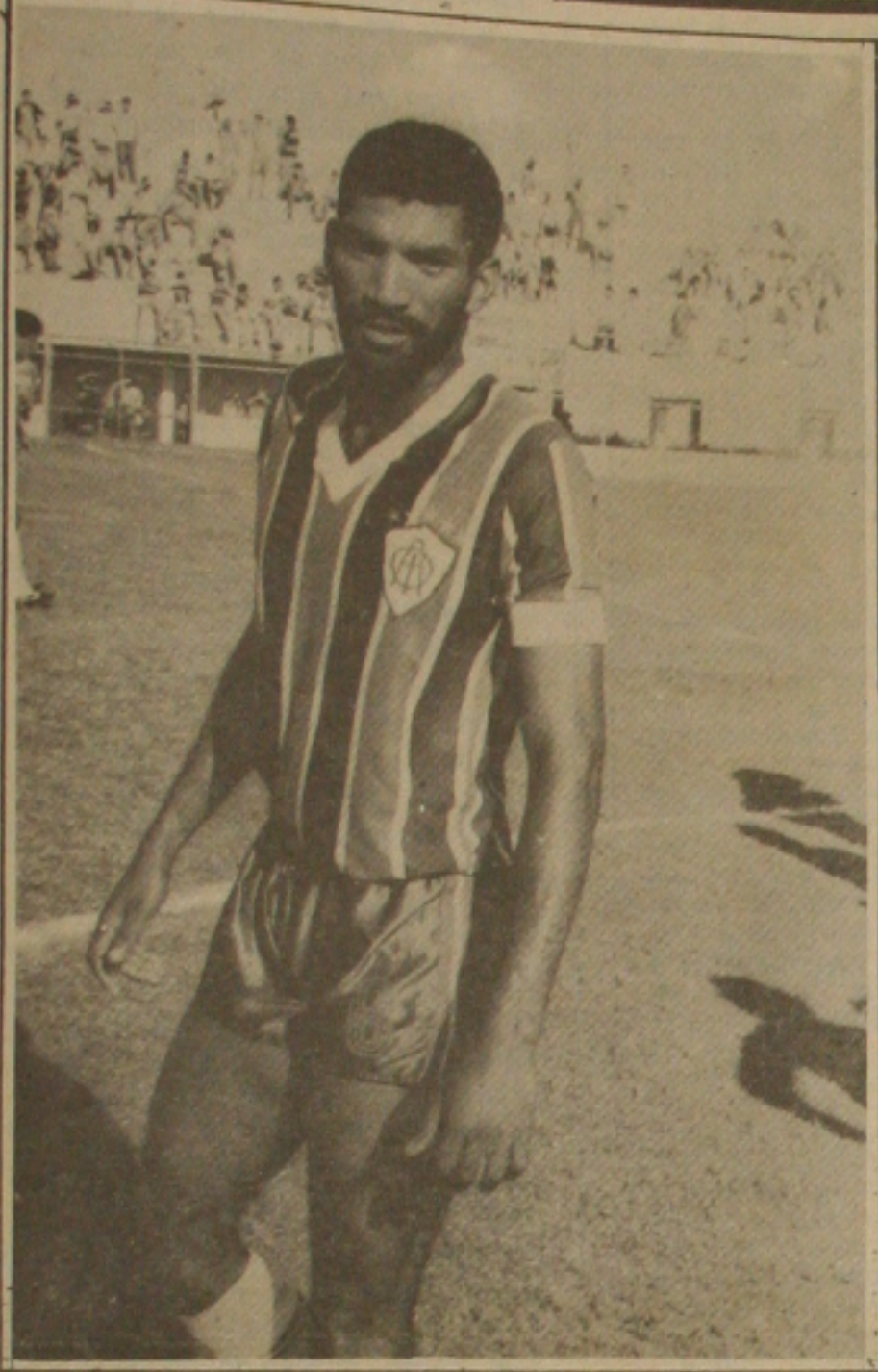
Itaparica retorna ao time semana e pode ser o lateral direito.

... não pensa mais em recuar, porque será difícil cometer o roubo devolvendo. Ele está preocupado com os documentos, que para Dentinho interessam a ninguém e pelo menos devolvam a ele os documentos. O fato de acontecer justamente na da decisão do título, ainda mais o atleta; Ontem ao atleta chegou a Aracaju comemorar a sua festa de aniversário e foi surpreendida com o jogador demonstra sua resignação, por estar com o roubo bem ao lado de sua família para ele é o que mais lhe interessa no mundo. A família que ontem trocou uma simples comemoração de aniversário de alguns atletas. Não foi a comemoração que eu esperava, mas feliz o fato de estar ao lado da família nesta data me deixa