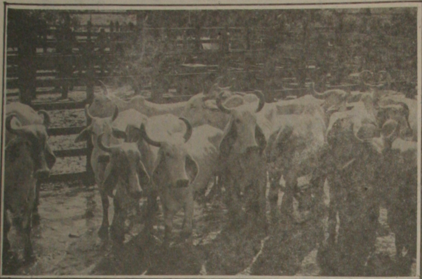
A Sudap iniciou a terceira campanha de vacinação para combater a febre aftosa que dizima o rebanho bovino.