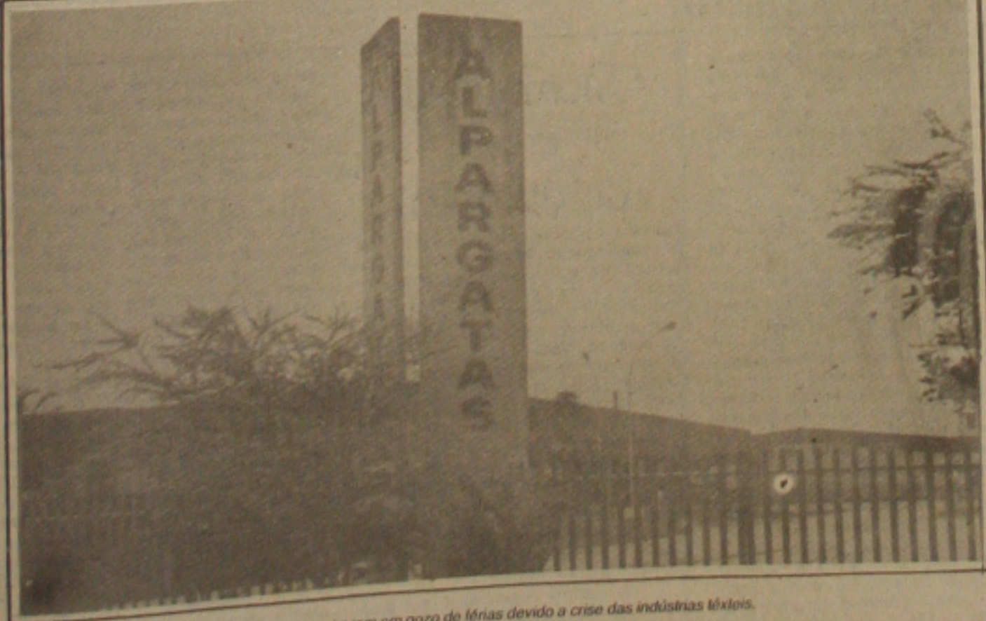
Só na Alpargatas cerca de 1.200 operários entraram em gozo de férias devido a crise das indústrias têxteis.