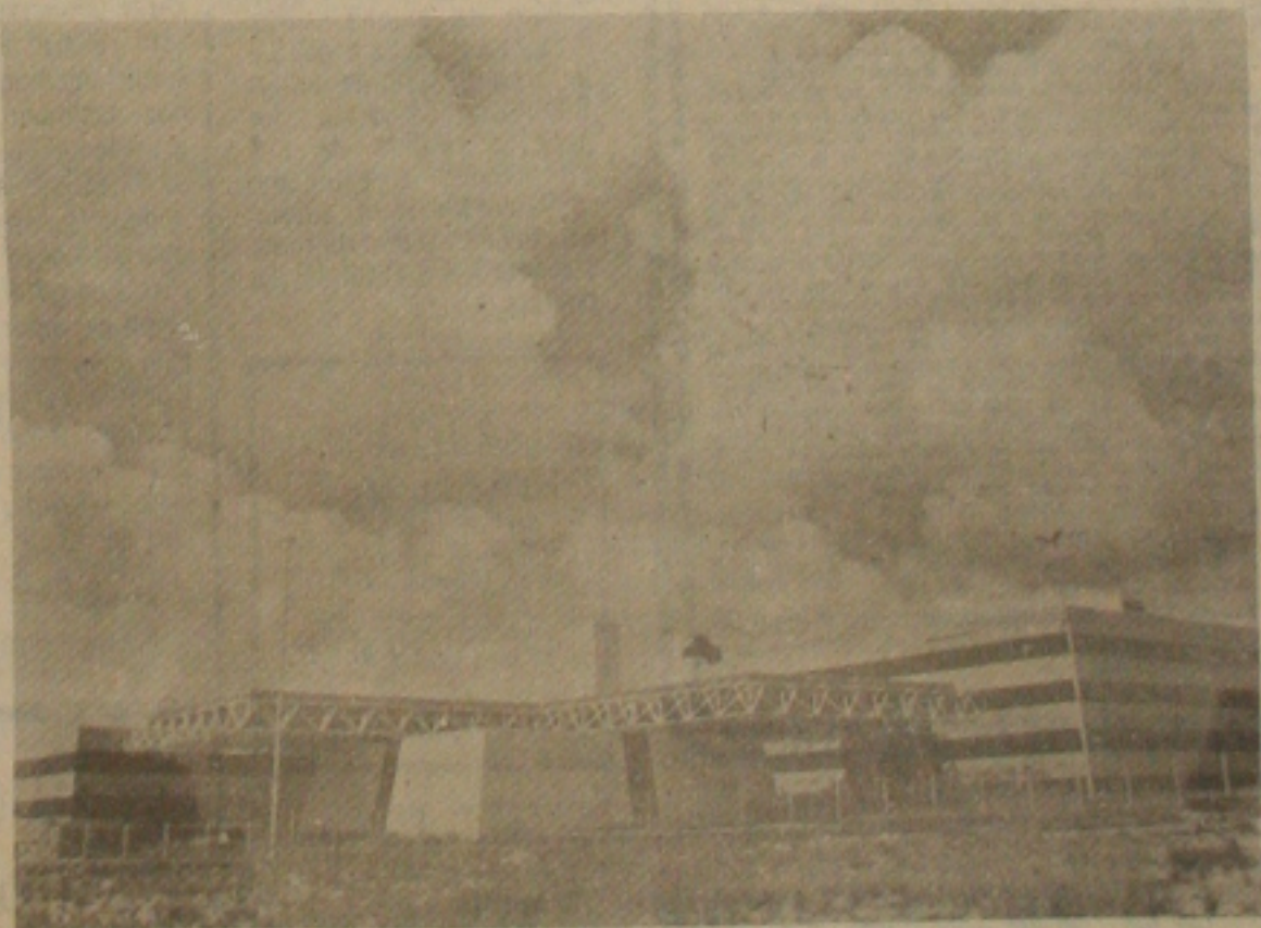
Nova Sede (FIES/SESI/SENAI/IEL)

A Federação das Indústrias do Estado de Sergipe (FIES); o Serviço Social da Indústria (SESI), o Serviço Nacional de Aprendizagem Industrial (SENAI), e o Instituto Euvaldo Lodi (IEL) comunicam às autoridades, empresários, lideranças sindicais, imprensa, trabalhadores da indústria e ao povo em geral, que a partir de hoje, dia 5 de dezembro, estarão funcionando em suas novas sedes, localizadas no Centro Administrativo 'Governador Augusto Franco', nesta capital.