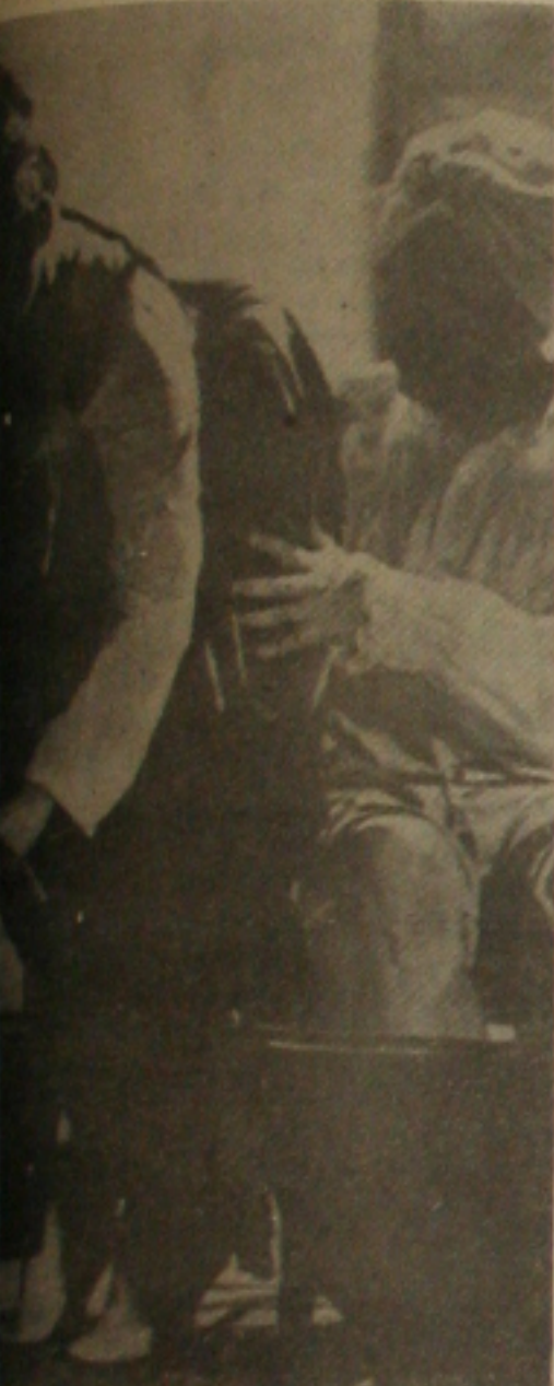
Sutherland é o escritor e conquistador do filme de Federico Fellini, que a escreve quarta-feira à Oh

GEMEAS (Two of a Kind). EUA, 1982. Direção: Roger Young. Com George Burns, Benson, Cliff Robertson, Barbara Barrie. Delicadas em mais de um sentido entre e seu neto etcapcional. Telefilme sensível.