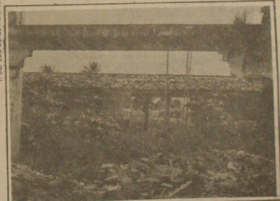
A Praça de Esportes é o retrato do abandono do patrimônio público.