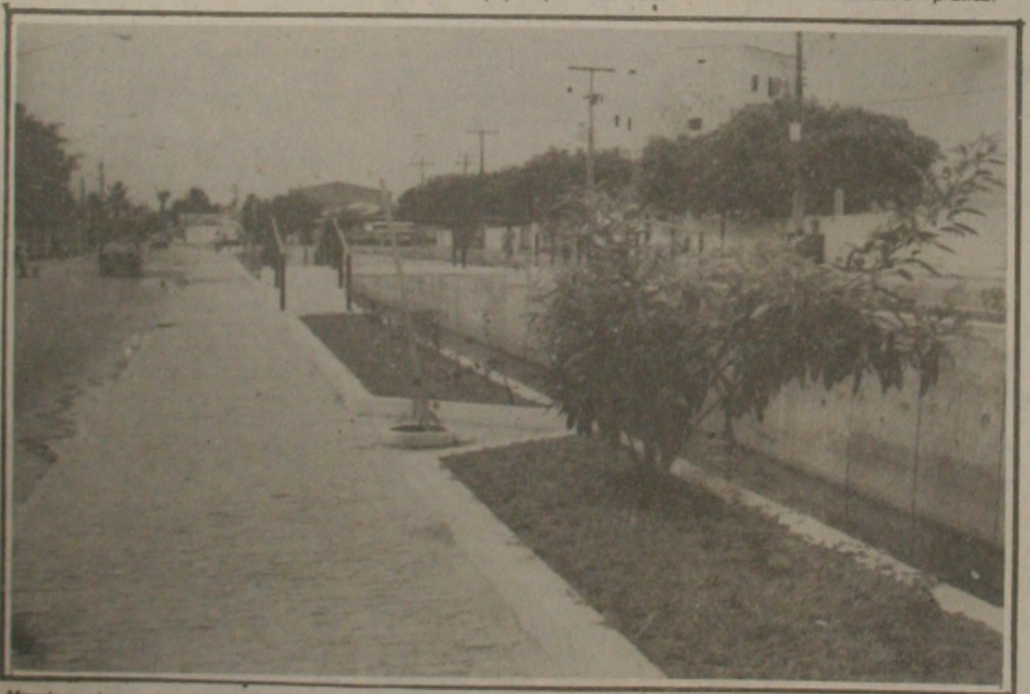
Moradores são conscientizados para preservar plantação de canteiro da Avenida Francisco Moreira.

No dia 19 de dezembro termina o prazo para requerer trancamento total de matrícula ou em disciplinas e, no dia 21, expira-se o prazo para entrega pelo Centro de Educação e Ciências Humanas dos comprovantes da prática de magistério (alunos de pedagogia). O término do segundo semestre está programado para o dia 4 de fevereiro de 1991.